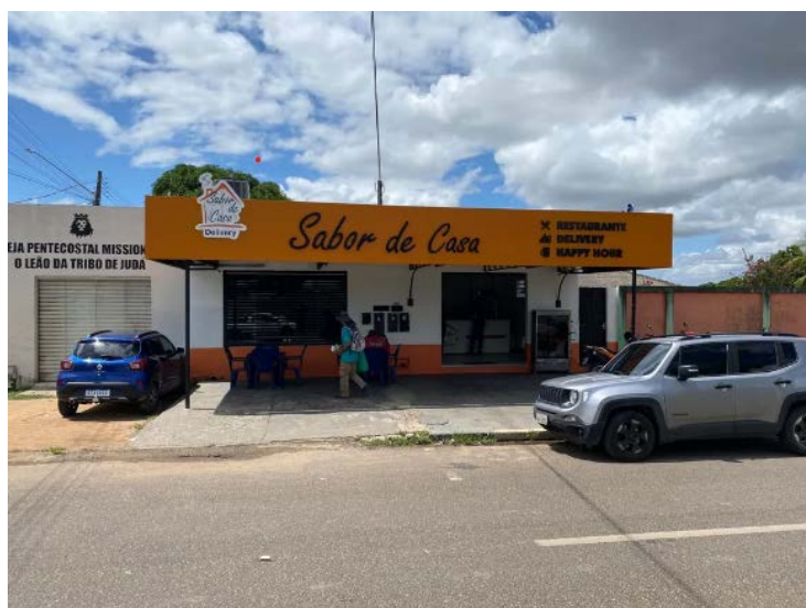
Foto da fachada da empresa.

O link da entrevista concedida ao portal de notícias G1, que pertence ao conglomerado de comunicação Grupo Globo, está disponível abaixo: