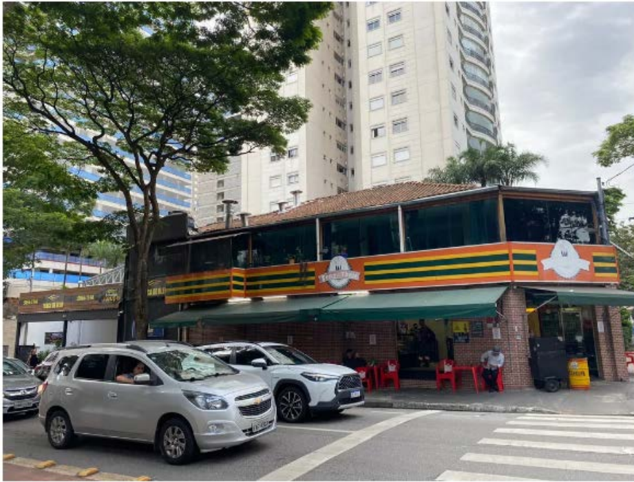
Fachada do restaurante Tony & Thaís, localizado na Zona Sul de São Paulo

Os valores das notas emitidas são expressivos, girando em torno de R$ 9 mil por nota fiscal. O kit lanche adotado pelo GSI é o produto responsável por catapultar tais gastos. Esse kit é composto por dois sanduíches de presunto e queijo, uma maçã, uma barra de cereal, uma lata de refrigerante e uma garrafa de água mineral de 500 ml.