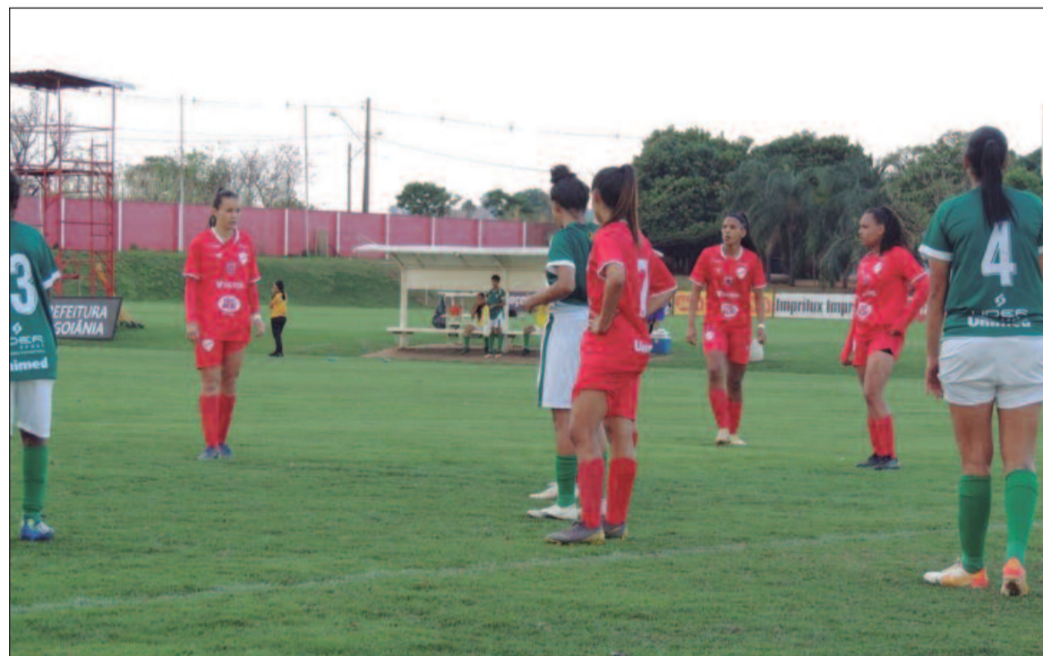
Vila Nova e Aliança se enfrentam na primeira fase da competição