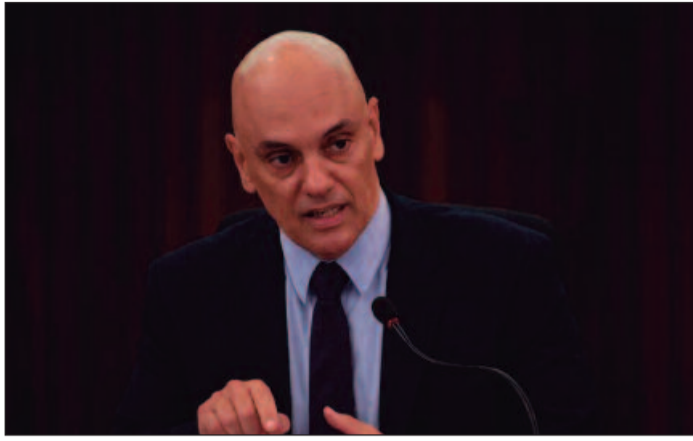
Ex-presidente teve documento negado para viagem a Israel