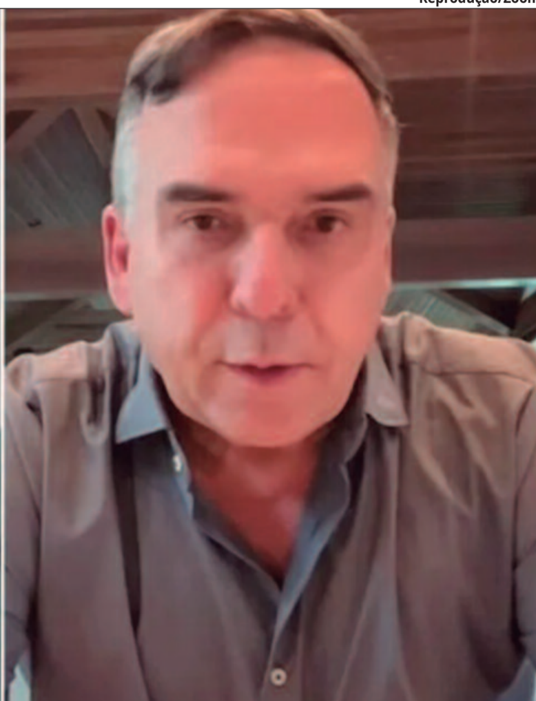
A oficialização foi feita em uma live pelo Zoom na tarde de sábado (30/3) com a presença do governador Ronaldo Caiado (União Brasil)

e também do ex-prefeito de Aparecida de Goiânia Gustavo Mendanha (MDB). Nenhuma costura prosperou.