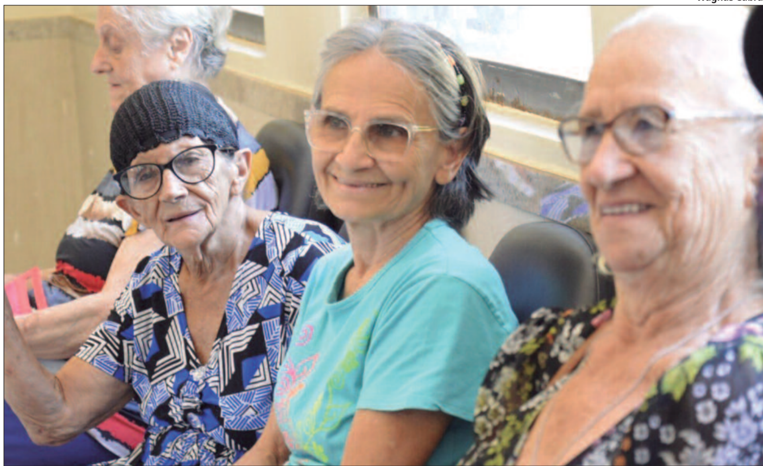
Destinação da declaração do Imposto de Renda pode fomentar ações voltadas para crianças, adolescentes e pessoas idosas em Goiás

A captação de recursos para o Fecad será utilizada em ações como o fortalecimento do Comitê de Participação de Adolescente (CPA), implantação do