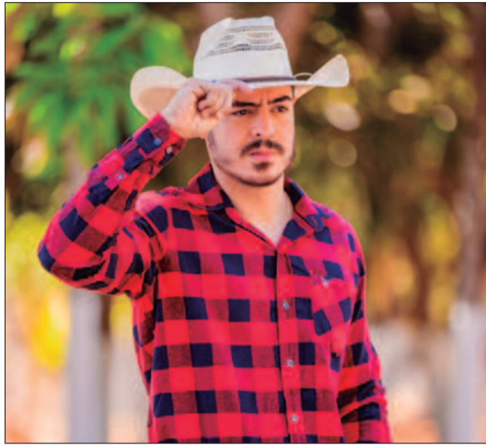
Projeto conta com o espetáculo 'Vô contá procêis', de Jacques Vanier, renomado artista e comediante do Estado de Goiás