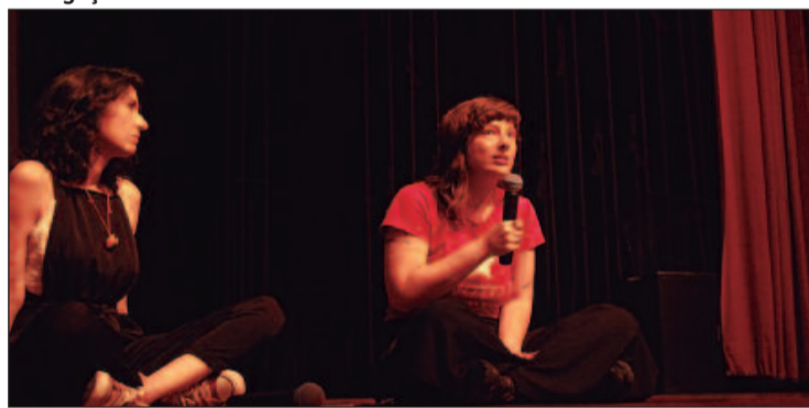
O roteiro contará com oficinas, exposição de banners, exibições de filmes e debates sobre a produção audiovisual feita por mulheres