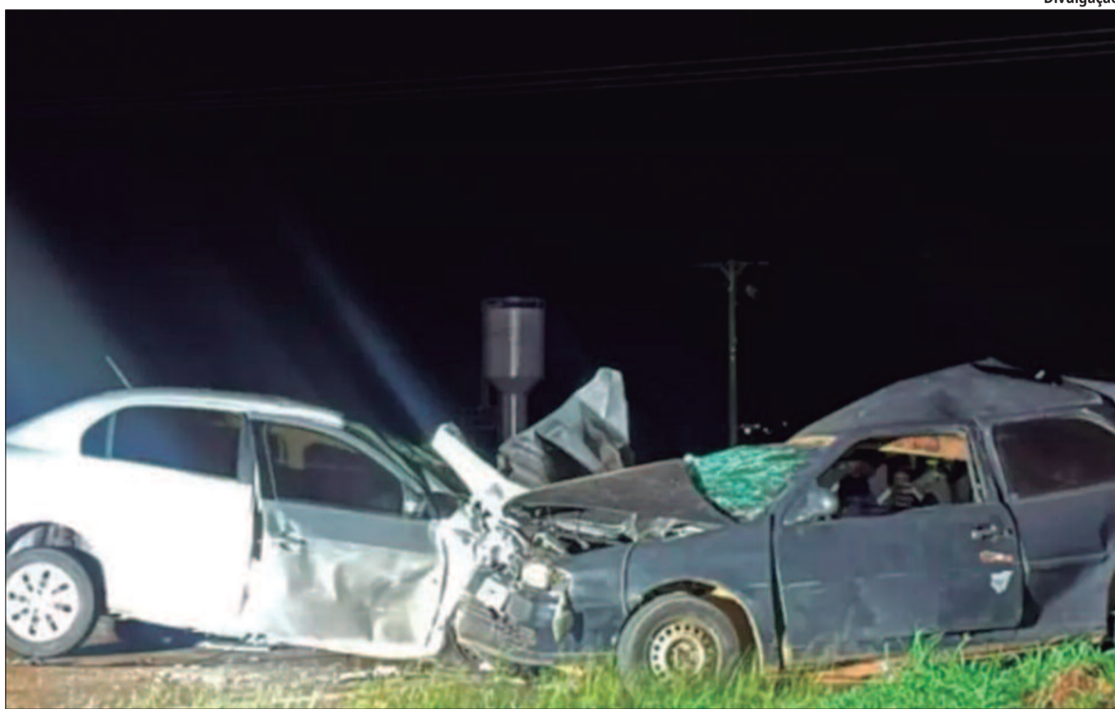
Acidente deixou os dois carros destruídos na lateral da pista em Goianópolis

O primeiro grupo com três passageiros no carro se dirigia com destino a Bonfinópolis, a 30 quilômetros a leste de Goiânia. O outro grupo com seis passageiros no carro saía de festa de cavalhadas para o povoado de Marinópolis, em Teresópolis de Goiás. O velório das seis vítimas de Marinópolis ocorreu na cidade nesta tarde do dia 8 para amigos e familiares.