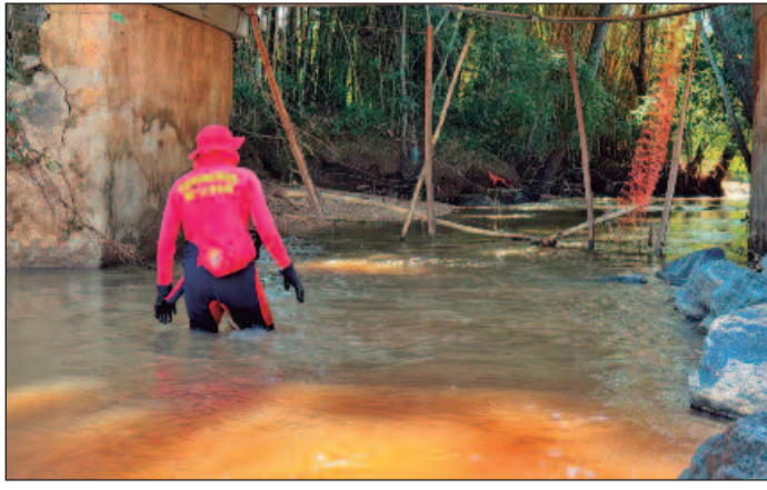
Momento em que os bombeiros procuravam corpo de menina que ficou mais de 60 horas desaparecida, em Aparecida