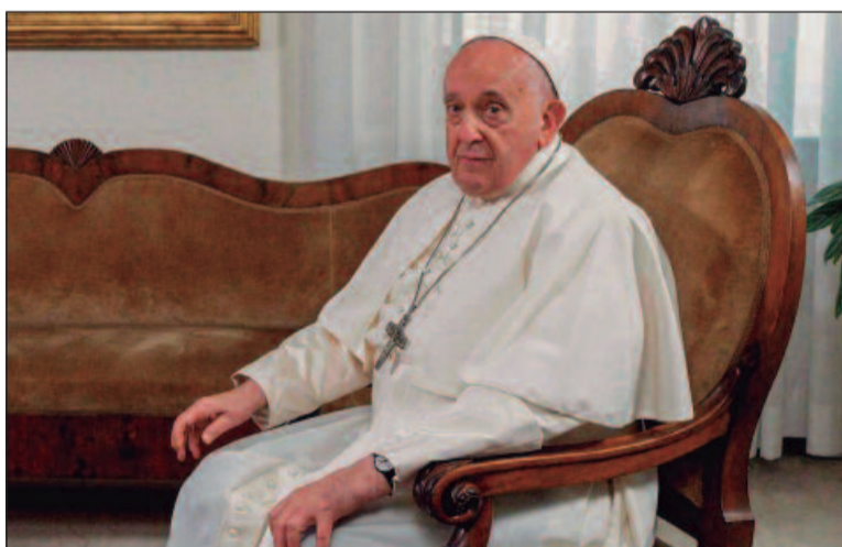
Posição foi manifestada no documento Dignitas infinita

nota afirma que “desejar uma autodeterminação pessoal, como prescreve a teoria de gênero, além dessa verdade fundamental de que a vida humana é um dom, equivale a uma concessão à antiga tentação de se tornar Deus, entrando em competição com o verdadeiro Deus de amor revelado a nós no Evangelho”. A teoria de gênero, muitas vezes chamada de ideologia de gênero por seus críticos, sugere que o gênero é mais complexo e fluido do que as categorias binárias de homem e mulher, e depende de mais do que características sexuais visíveis.