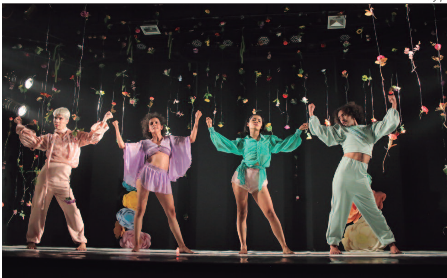
No palco, os bailarinos se apresentam em formato de performance com dança contemporânea e alguns elementos da cultura K-Pop