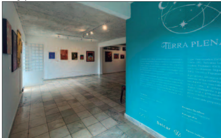
A exposição busca explorar a paisagem vibrante de Goiás, refletindo sua conexão com o céu observado abaixo da Linha do Equador

aos sábados, domingos e feriados, das 12h às 22h. Esta atração oferece aos visitantes a oportunidade de se depararem com os gigantes do mar por meio de projeções subaquáticas em 360 graus de alta tecnologia. Desfrute de um mergulho virtual envolvente pelo fundo do oceano, onde tubarões, baleias e peixes coloridos ganham vida. Os ingressos estão à venda no site (loja.imersomar.com). Quando: até 19 de maio. Onde: Av. Perimetral Norte, Nº 8303, Fazenda Caveiras - Goiânia. Ho-