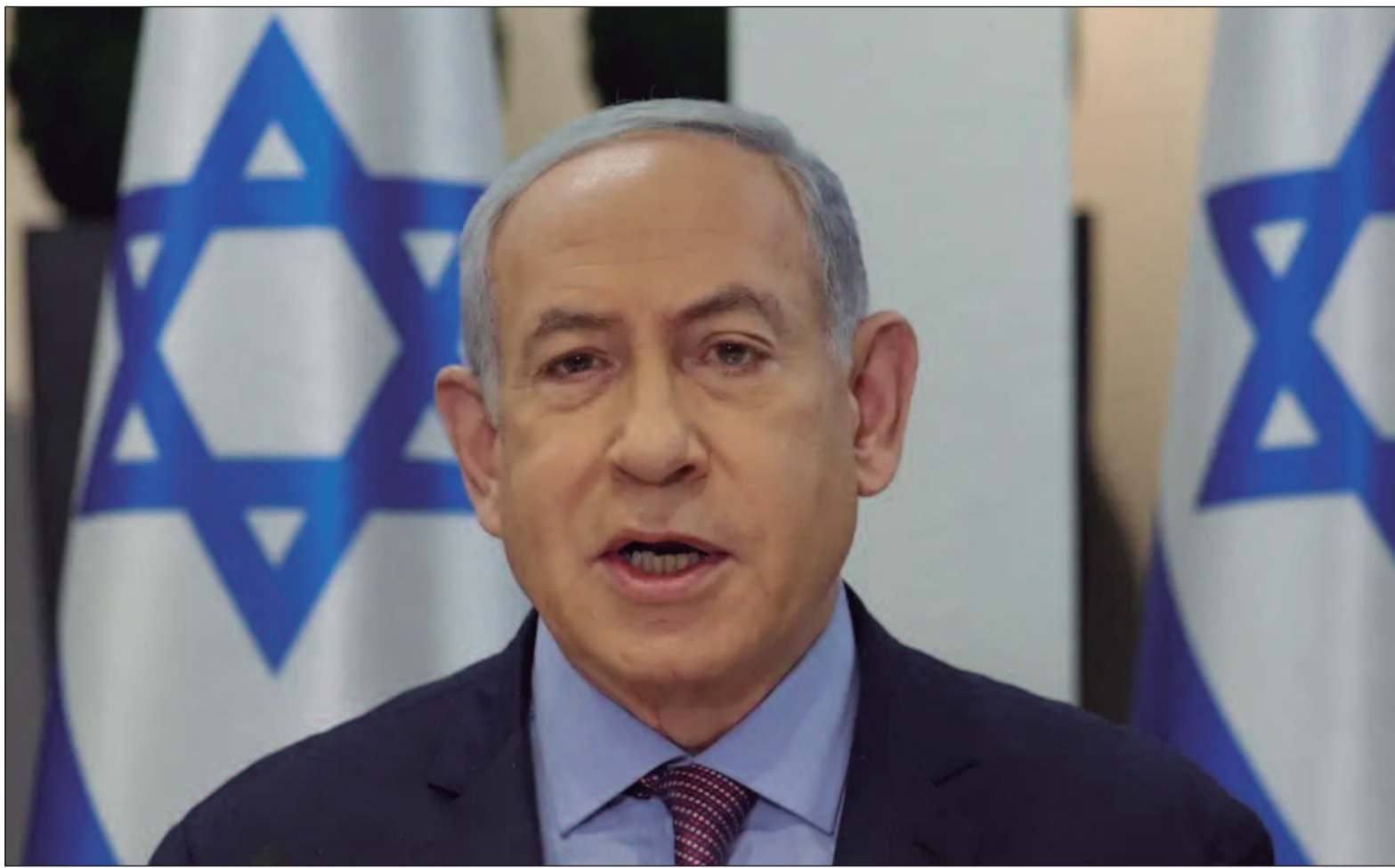
Israel e o Hamas enviaram equipes ao Egito no domingo para conversações que incluíram mediadores do Catar e do Egito

Em Jerusalém, nesta segunda-feira, um dia depois que as forças israelenses se retiraram de algumas áreas do sul de Gaza, Netanyahu disse que havia recebido um relatório detalhado sobre as negociações no Cairo. “Estamos trabalhando constantemente para atingir nossos objetivos, em primeiro lugar a libertação de todos os nossos reféns e a vitória completa sobre o Hamas”, declarou Netanyahu.