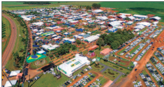
Máquinas com inteligência artificial e 100% conectadas