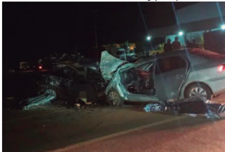
Algumas das vítimas ficaram presas nas ferragens dos carros enquanto as outras foram ejetadas para a pista

Inicialmente, a forte batida deixou seis mortos no local. Os três feridos foram atendidos pelo Serviço de Atendimento Móvel de Urgências (Samu) a destino para o Hospital Estadual de Anápolis Dr. Henrique Santillo (Heana). Contudo, duas das vítimas morreram horas