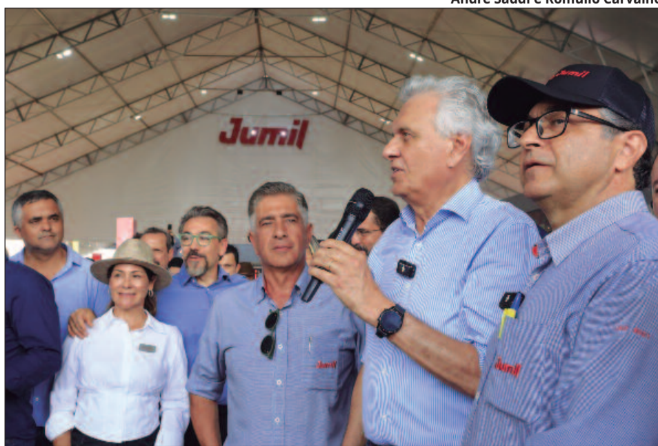
Governador citou projeções que apontam o campo como puxador do PIB goiano