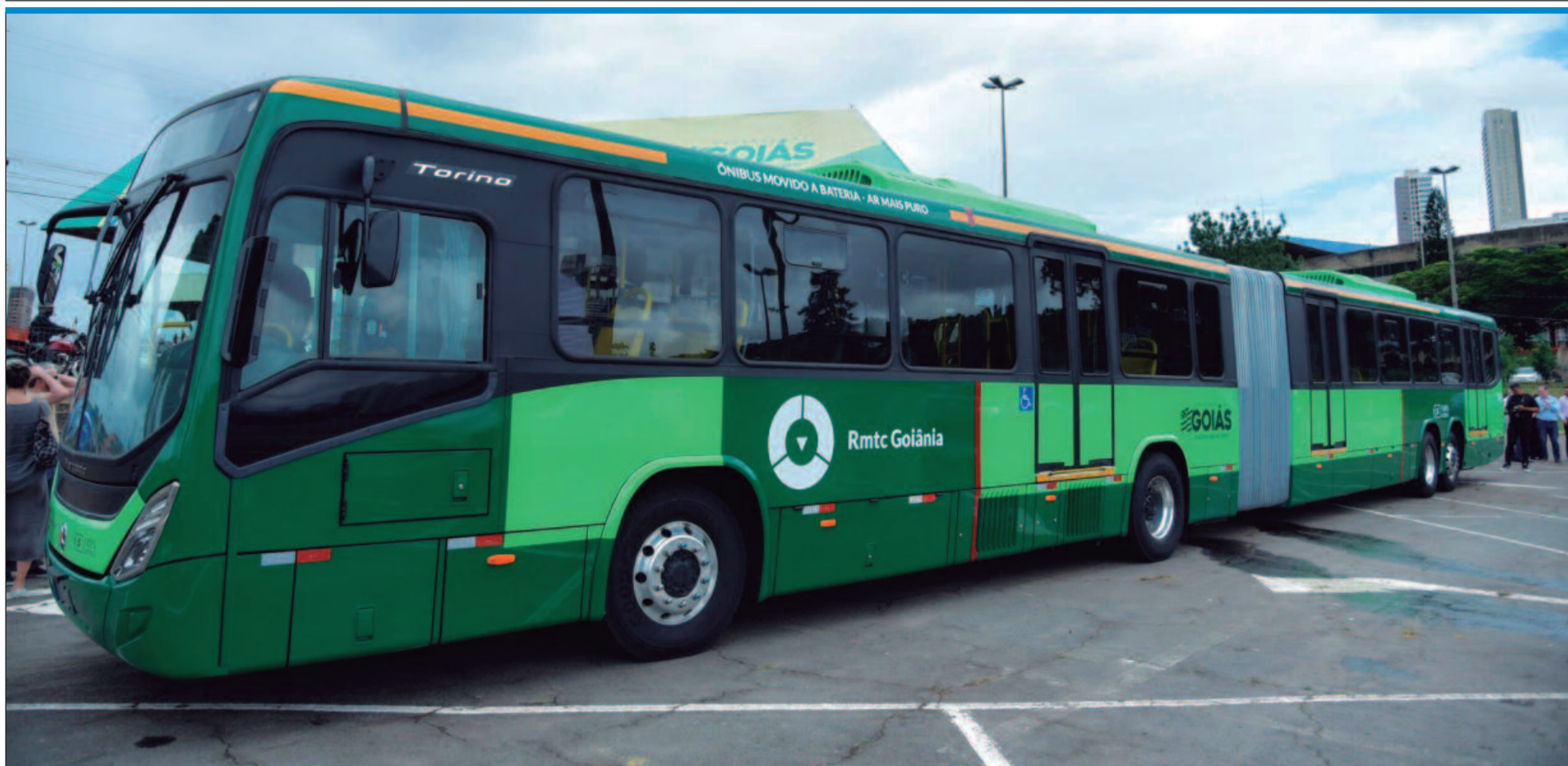
A primeira etapa será entregue até julho deste ano, com 200 novos ônibus, bem como obras no Terminal Novo Mundo