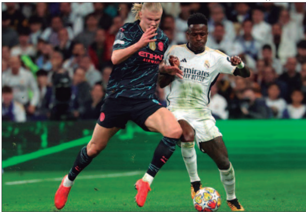
O Real Madrid e o Manchester City fizeram um jogão digno de final

Valverde deixou a partida em igualdade novamente após um golaço. Vini Júnior acertou um passe para o volante que finalizou forte de primeira para deixar tudo igual no Bernabéu. Com o empate nenhu-