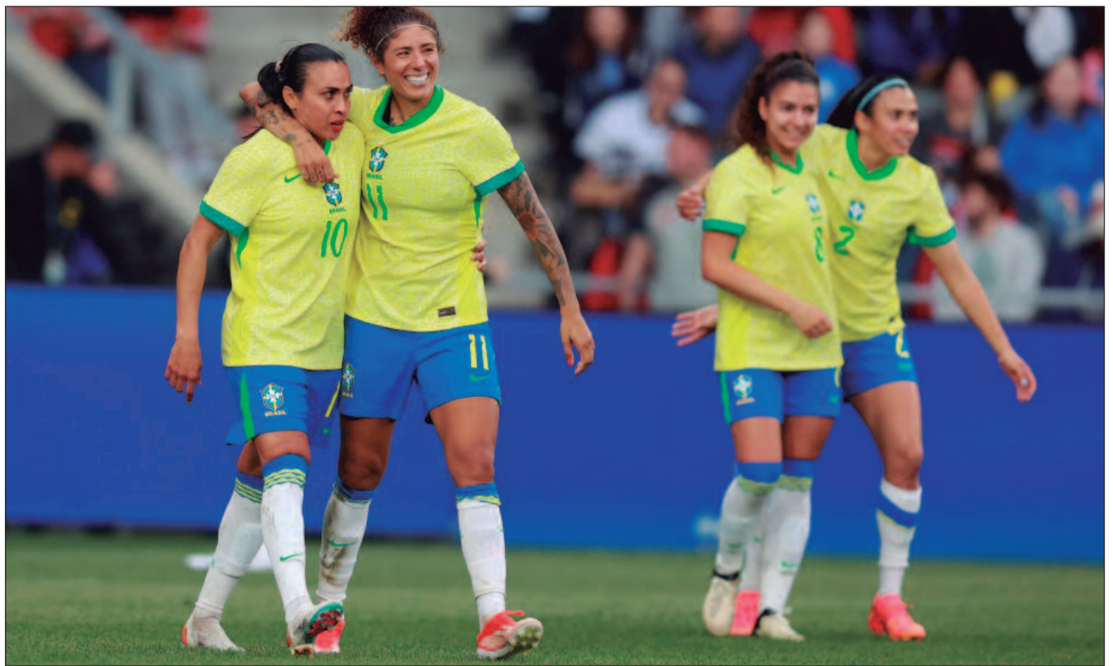
Cristiane fez o gol de empate e se tornou a segunda maior artilheira da seleção, com 97 gols

A equipe canarina tentou algumas chegadas. Aos 14 minutos, Marta chamou a responsabilidade, dominou no meio, se livrou da marcação e tentou o passe para Priscila na área, porém a marcação japonesa estava atenta e fez o