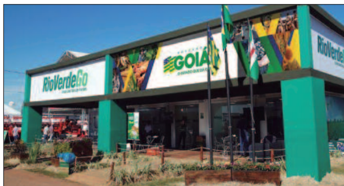
São mais de 650 expositores e expectativa de 140 mil visitantes