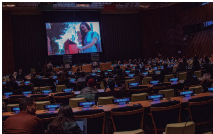
Os vídeos vencedores serão exibidos na Cerimônia de Premiação PLURAL+, realizada na sede das Nações Unidas em Nova Iorque