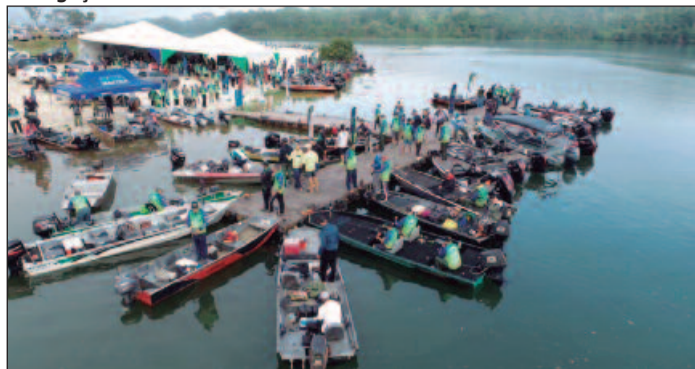
Evento atrai pescadores e turistas e movimentou a economia dos municípios ribeirinhos