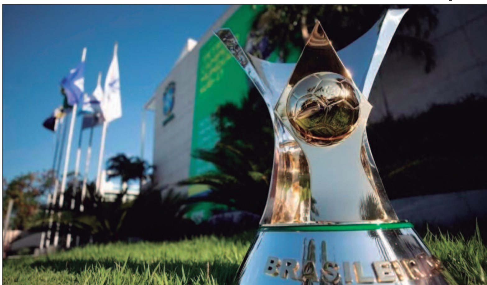
20 equipes darão início ao torneio em busca do título de campeão brasileiro

rado um dos mais competitivos do mundo. Conta com o atual campeão da Libertadores, Fluminense, além de ter nove campeões estaduais nesta temporada, que são: Atlético-PR, Atlético-GO, Atlético-MG, Criciúma, Cuiabá, Flamengo, Grêmio, Palmeiras e Vitória.