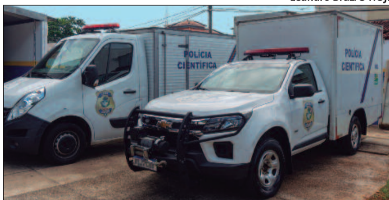
Na seção, são conduzidos dois tipos de análise: antropológica e a odontológica

incluindo sexo, idade e estatura aproximada da pessoa em questão. Ele serve como uma estimativa, auxiliando na redução do espectro de busca. "Através do exame antropológico, nós tentamos determinar o sexo do indivíduo