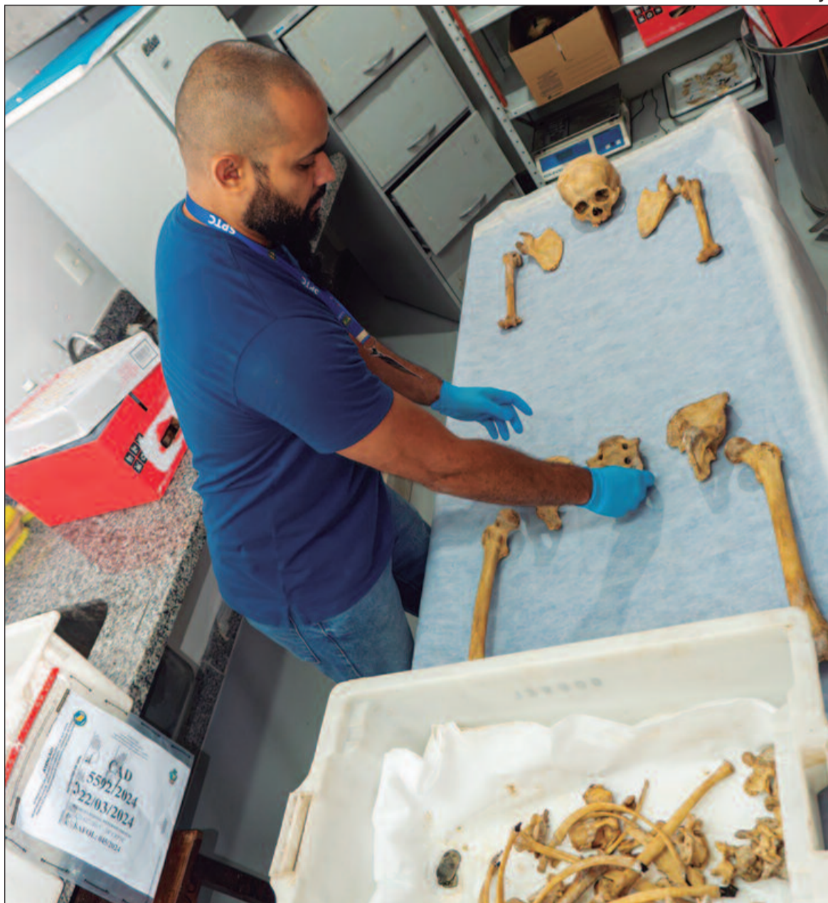
Ossadas são levadas para departamento chamado de Safol

O exame antropológico é realizado com o intuito de identificar o perfil biológico,