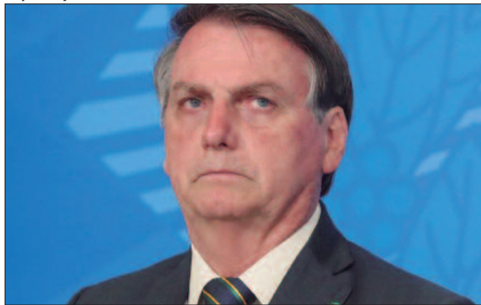
Ex-presidente questiona falas sobre 'sumiço' de móveis