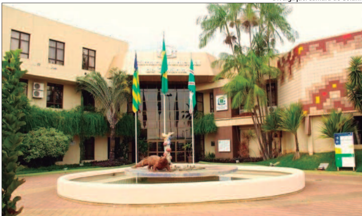
Ao todo, 14 parlamentares decidiram trocar de partido, enquanto 21 permaneceram onde estão