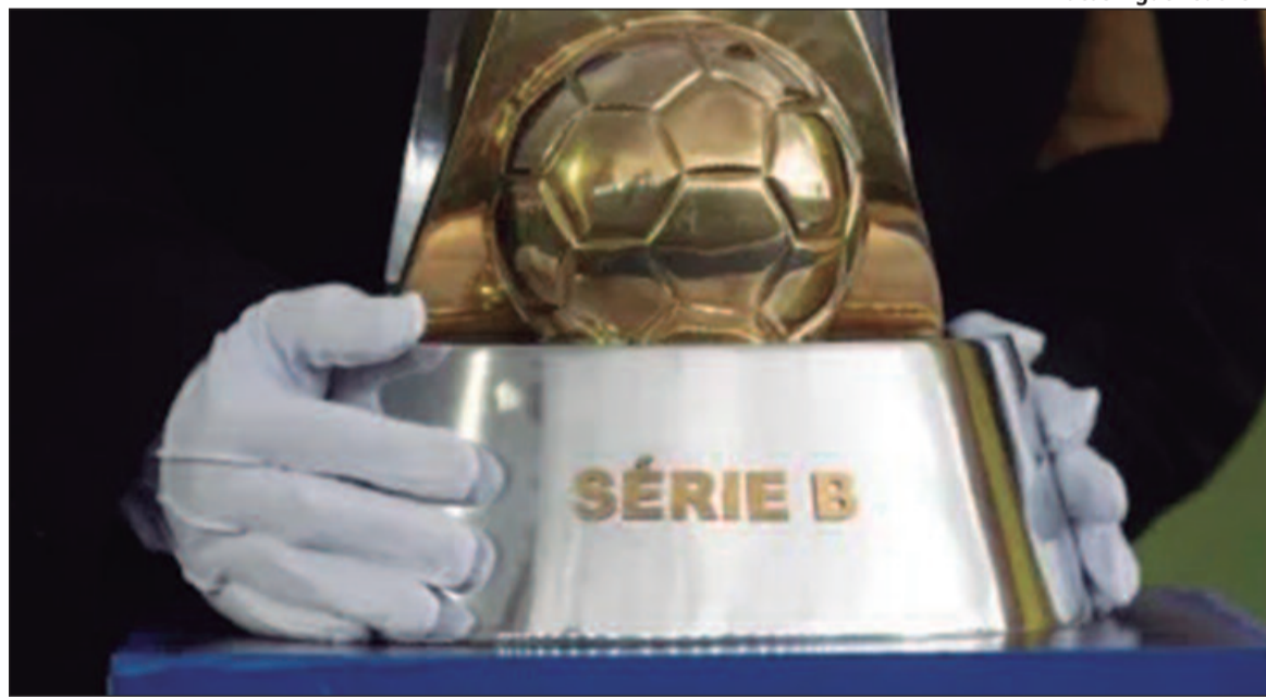
Goiás e Vila conheceram detalhes da estreia