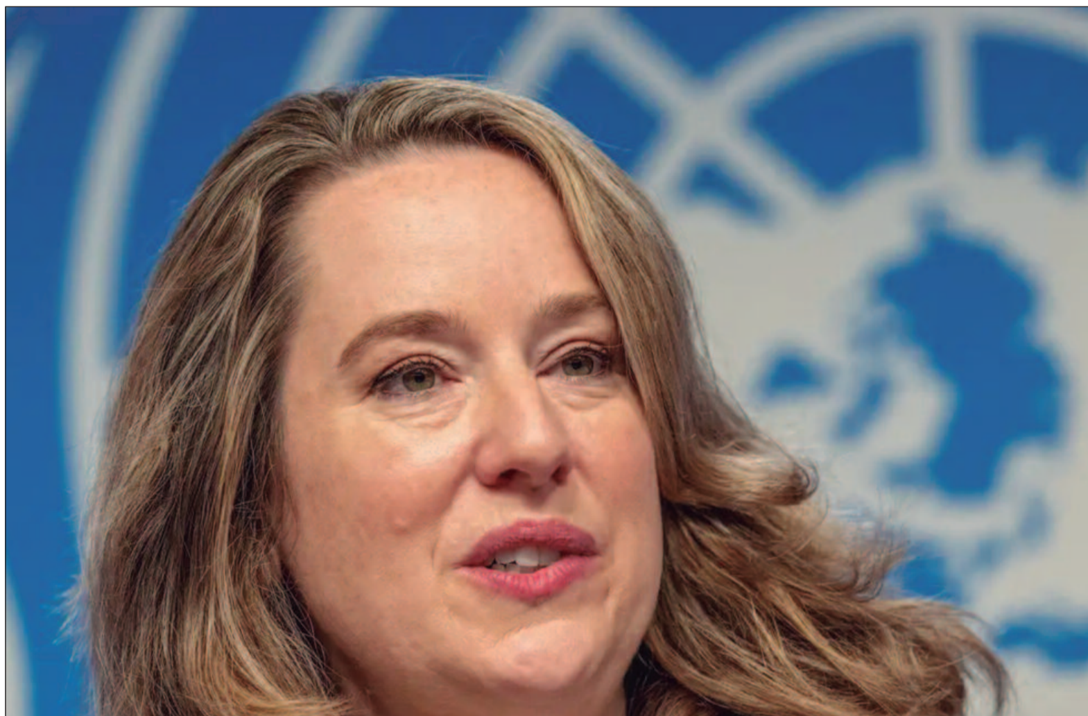
O número de pessoas que precisa de ajuda “continua a crescer a cada dia”, à medida em que a guerra entra numa fase prolongada

“Sinto-me inspirada e honrada pela força daqueles que conheci – mulheres que via-