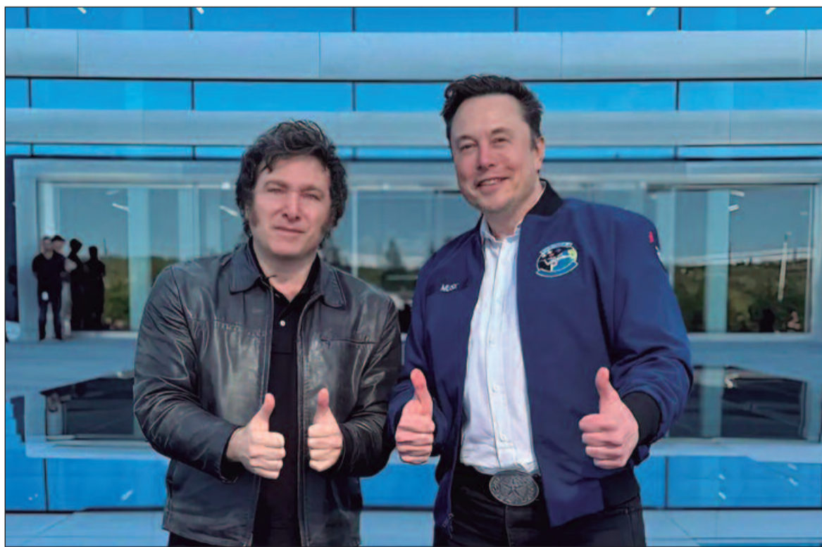
Presidente e empresário defenderam o que eles chamam de “liberdade de expressão”

A invasão russa foi condenada pela comunidade internacional, que respondeu com o envio de armamentos para a Ucrânia e o reforço de sanções econômicas e políticas a Moscou.