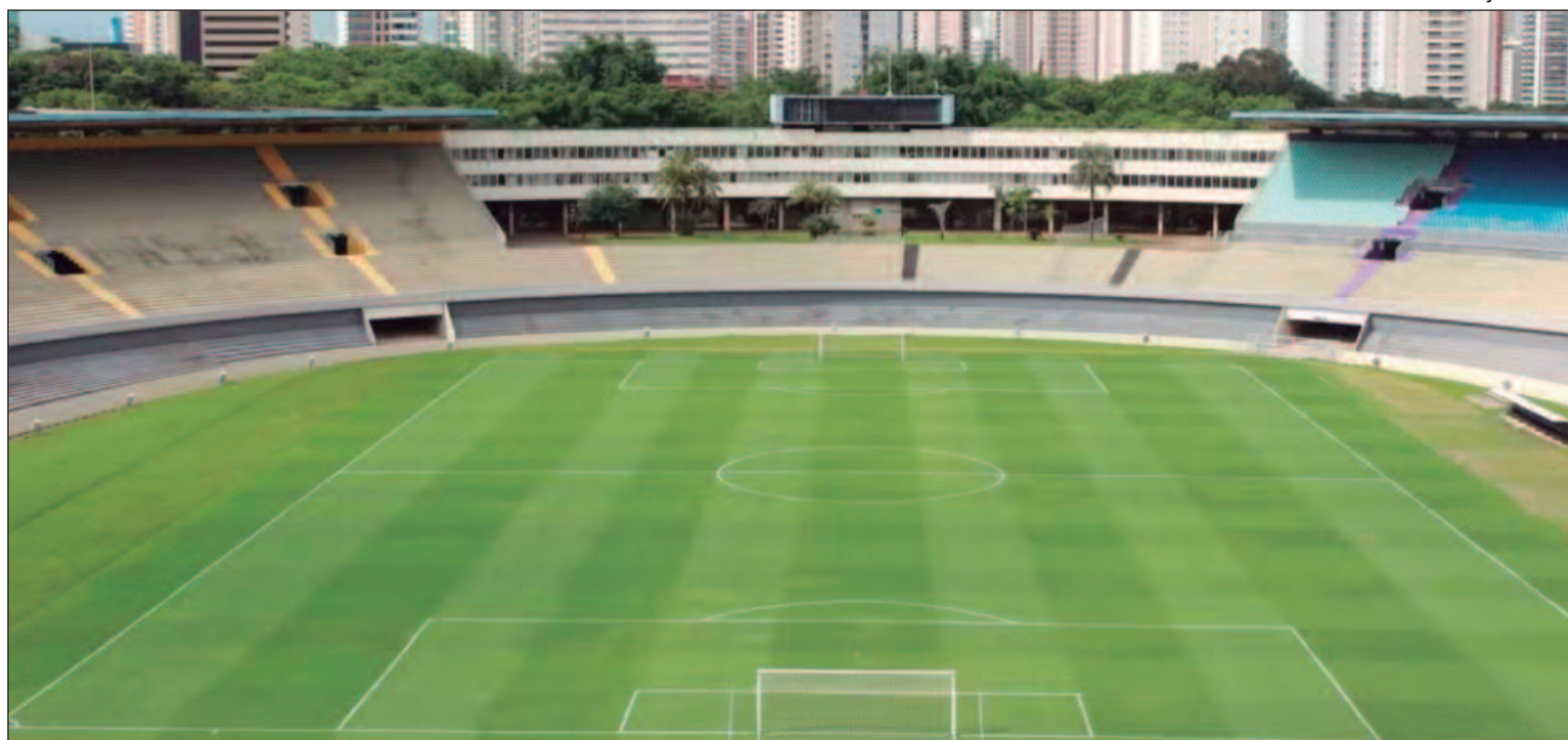
O Estádio Serra Dourada volta a ser palco de grandes jogos. O primeiro será Atlético Goianiense e Flamengo neste domingo (14)

"A expectativa de um grande jogo, hoje somos o melhor ataque do país e vamos encarar o Flamengo, que é um dos candidatos ao título e sofreu apenas dois gols até agora na temporada. Expectativa de um grande jogo, as duas equipes vivem um bom momento, nos