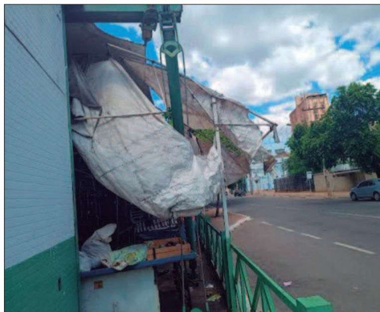
A sujeira, depredação e falta de segurança municipal são fatores que afastaram os clientes comerciais do Centro