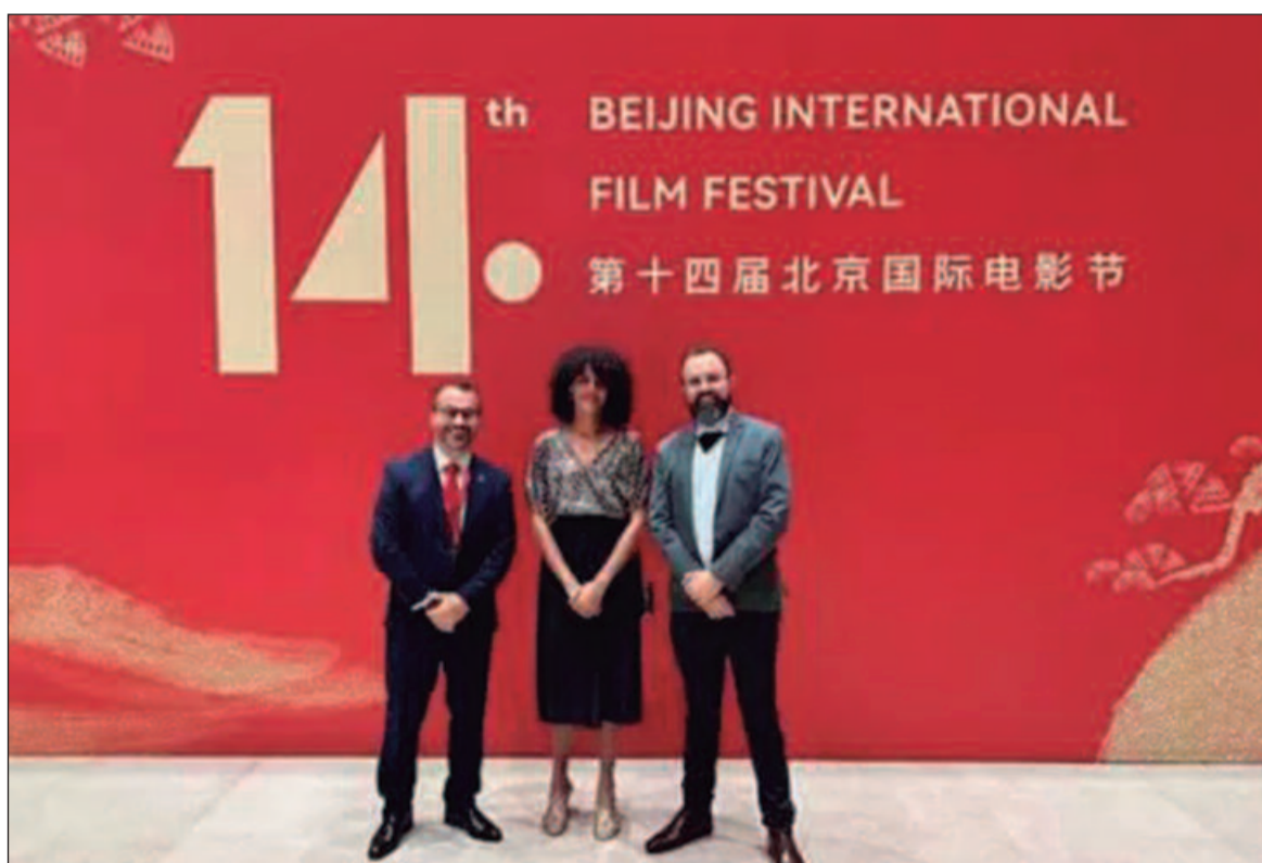
Na China, o secretário-executivo adjunto do Ministério da Cultura celebra o intercâmbio cultural durante a abertura do Festival Internacional de Cinema de Pequim, onde o Brasil é o país convidado de honra

"Para nós é uma grande honra sermos o país homenageado da 14ª Edição do Festival Internacional de Cinema de Pequim. Este ano marca os 50 anos do estabelecimento das relações diplomáticas entre o Brasil e a China. Desde então, as trocas culturais e a cooperação entre os dois países continuaram a se aprofundar, com o cinema brasileiro se tornando um elo importante para