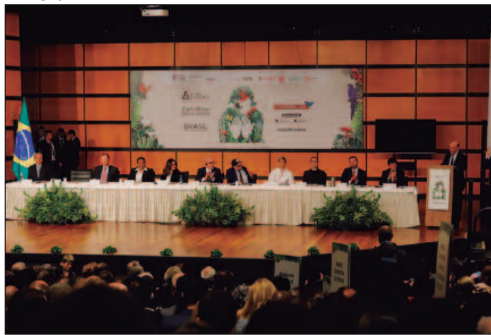
Mediação de atividades para estreitar laços entre Brasil e Colômbia e promovendo uma maior compreensão mútua