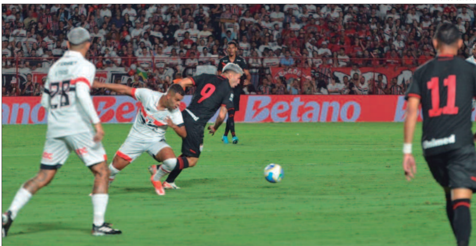
Dominado dentro de casa, o Atlético perde por 3 a 0 e segue sem pontuar no Brasileirão