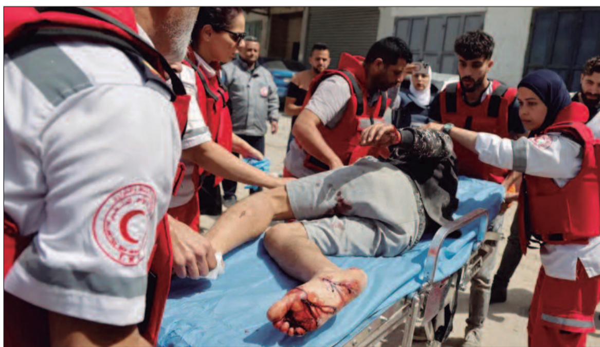
Israel mantém ofensiva na Faixa de Gaza

Ela diz que, na região onde vive, chove apenas três meses no ano. Ela usa no cultivo sistemas de armazenamento de água para contar com esse recurso durante todo o ano. “Temos que aproveitar ao máximo a água na época de chuva, para armazená-la e garantir o uso tanto para a família quanto para os animais.” (ABr)