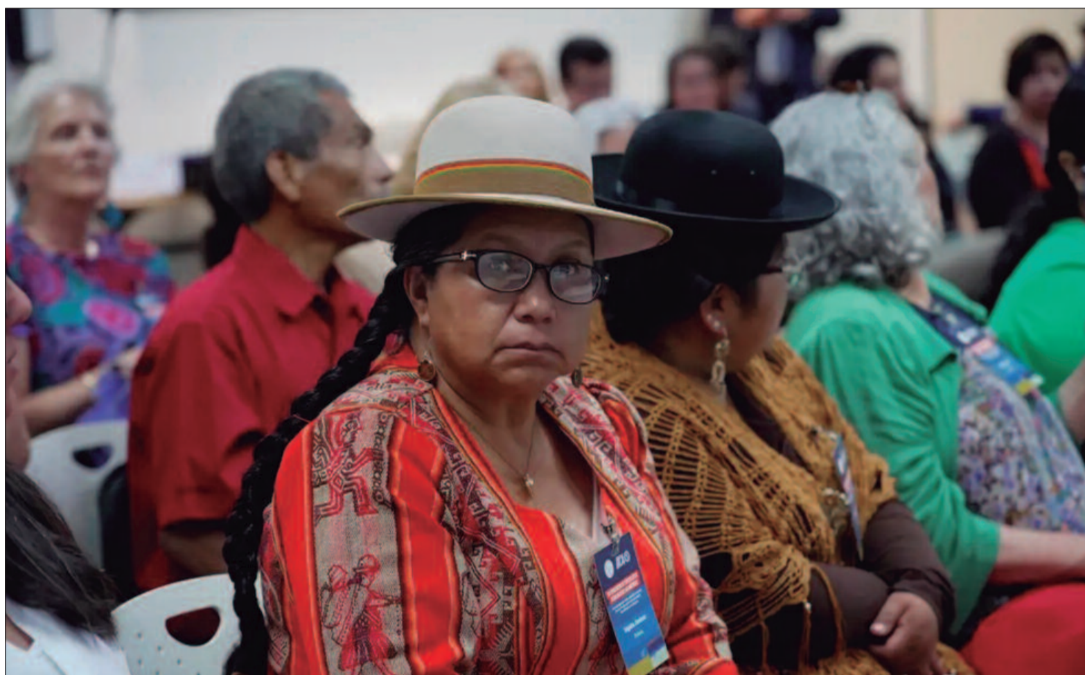
Yana é a 1ª mulher indígena do povo aymara a pilotar um drone na Bolívia e pesquisar formas de facilitar o cultivo e de difundir o uso da tecnologia

Yana está entre os 42 líderes rurais que participaram do encontro na Costa Rica. Embora representem quase todos os países da América e vivam em realidades distintas, alguns temas e desafios os unem. Um deles é a água, essencial para qualquer criação ou cultivo e escassa em muitas regiões. A escassez é um efeito da crise climática que o mundo enfrenta, com altas variações de temperatura e falta de previsibilidade de seca ou chuva. Durante os dias do encontro, ao longo desta semana, os líderes compartilharam as experiências e mostraram como