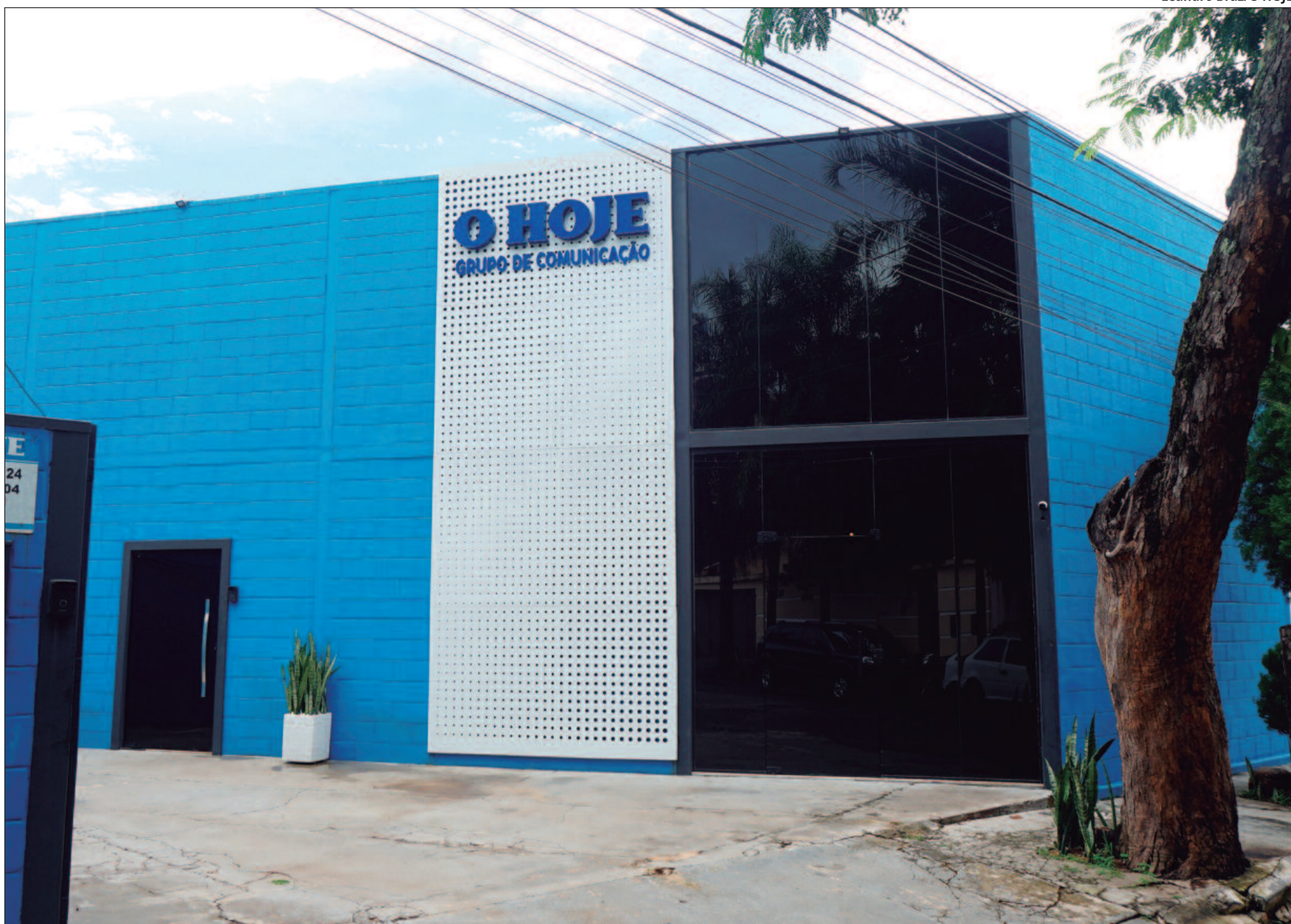
O HOJE se consolida, ano a ano, em busca dos elementos que acomodam as vozes dos interesses sociais. Até porque a informação é um direito fundamental de todos