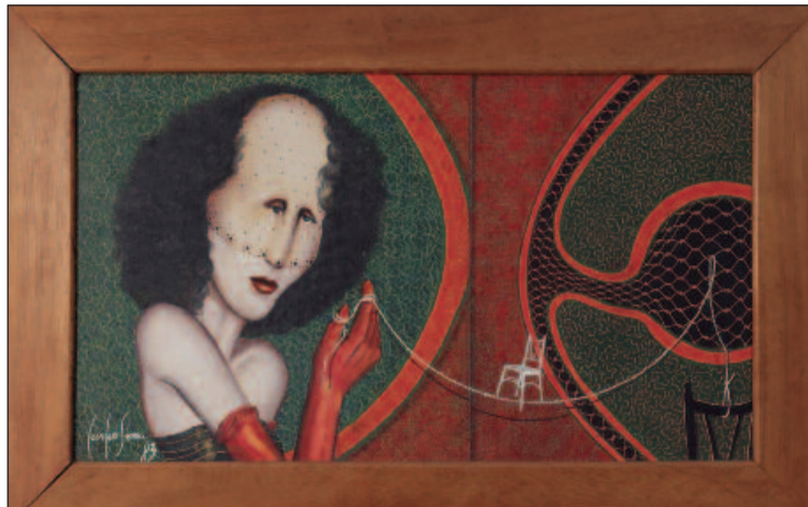
Mostra reúne obras de 32 artistas locais consagrados no cenário cultural para homenagear o influente legado de Zilca Rodrigues

de aproximadamente 1.000 m², conta com mais de 70 atrações, reunindo um acervo único de ilusões de ótica e experiências divertidas, que irão brincar com o cérebro e com a razão, de terça-feira a sábado, das 10h às 22h, com entradas até às 21h, e domingos e feriados das 12h às 20h, com entrada até às 19h. Os ingressos podem ser adquiridos através do site (sympla.com). Quando: terça-feira a sábado. Onde: Av. Perimetral Norte, N° 8303, Fazenda Caveiras - Goiânia. Horário: 10h, 12h. Ingressos: (sympla.com).