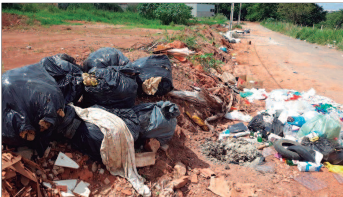
Após meses de crise na coleta de lixo, nova empresa deve assumir serviços para os próximos dois anos

Esta nova companhia deve contar com novos veículos pesados, além de um sistema de varrimento mecanizado utilizado em cidades europeias. Ao todo, serão 128 novos veículos que deverão cumprir os primeiros 24 meses de contrato. Em 27 de maio, o consórcio irá assumir toda a coleta domiciliar da cidade. Como parte da frota, os novos caminhões contam com melhorias como uma capacidade de carga superior aos veículos usados anteriormente. Além disso, não precisarão usar a