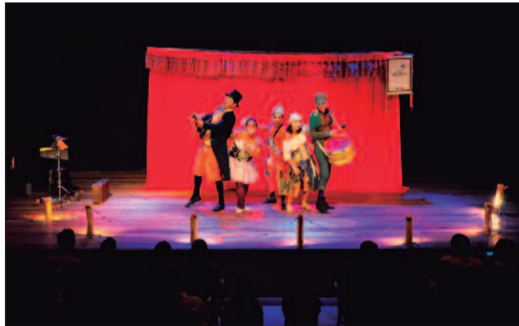
Trupe de mambembes acaba de chegar à cidade e, por onde passa, apresenta suas peças ao grande público

A segunda ação consiste no registro audiovisual da turnê, para dar continuidade à web-série estreada em 2022 no canal do grupo Carroça no Youtube, chamada O Sumiço da Carroça - doc, com estreia prevista para setembro de 2024. A montagem do espetáculo conta com patrocínio da Lei Mu-