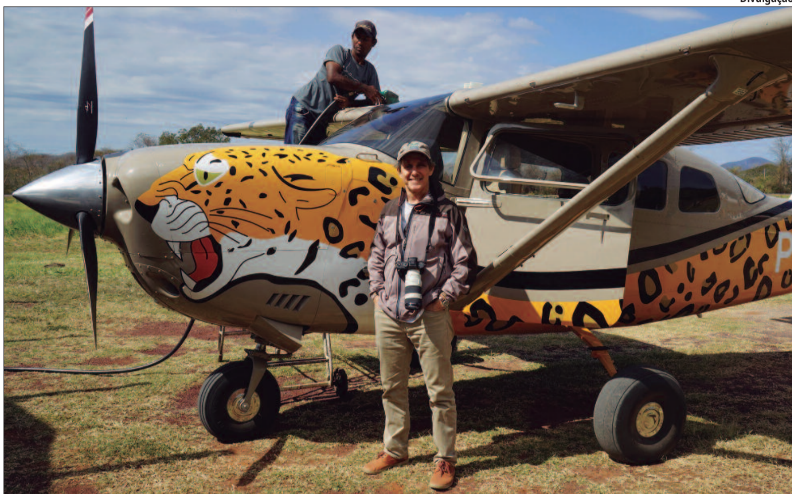
Para a publicação deste livro, o fotógrafo João Farkas embarcou em uma expedição de um ano pelo Estado

Reconhecido internacionalmente, Farkas pode ser encontrado em coleções de museus de todo o mundo, como o La MEP, em Paris, e Center of Photography, em Nova York. Também foi correspondente fotográfico para as revistas Veja e Isto É, e recebeu o Prêmio Vitae e o Prêmio Aberje pelo documentário 'Retratos da Ocupa-