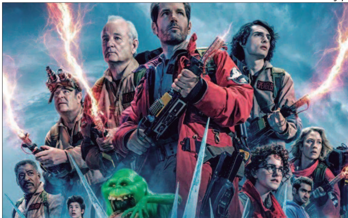
Nesta sequência da franquia Ghostbusters, a família Spengler retorna para onde tudo começou

Abigail (Abigail, 2024, EUA) Duração: 1h 49min. Direção: Matt