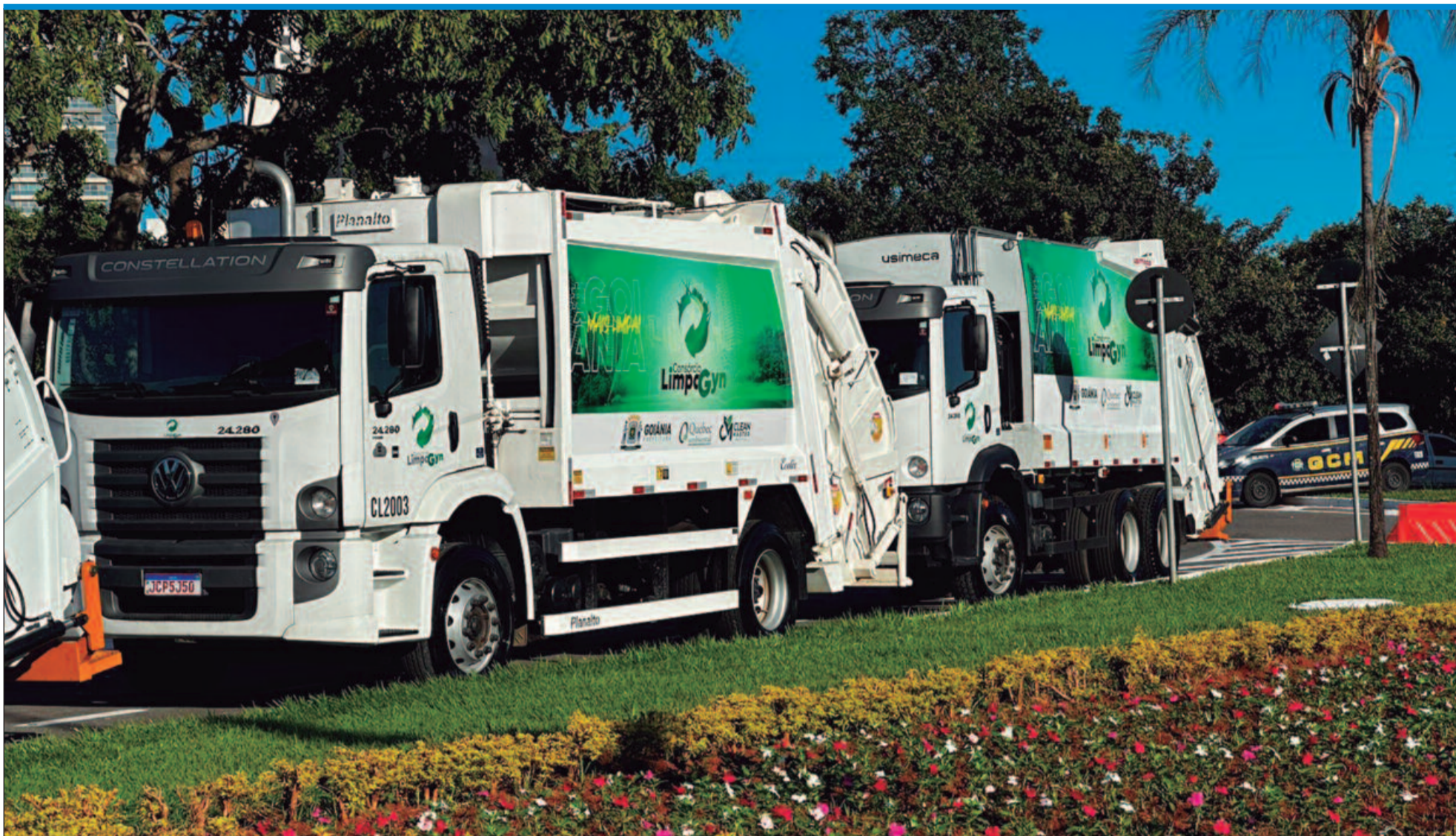
Veículos começam a trabalhar nesta terça-feira (23). As regiões Oeste, Leste e Norte serão as primeiras a receber o serviço