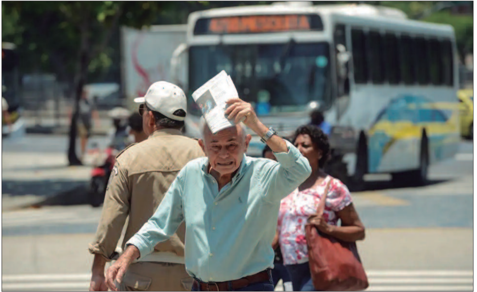
Trabalhadores, especialmente os mais pobres do mundo, são mais vulneráveis do que a população em geral aos perigos dos extremos climáticos

“À medida que (os riscos) evoluem e se intensificam, será necessário reavaliar a legislação existente ou criar novas regulamentações e orientações”.