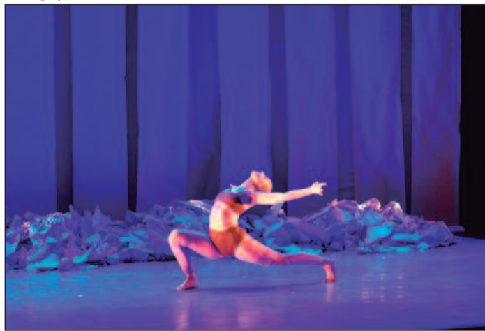
O grupo leva na bagagem sua dança e uma história de 12 anos de estrada