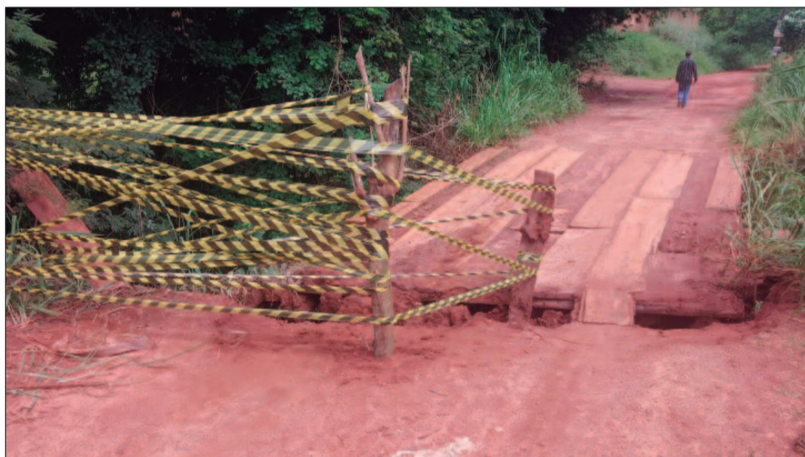
Ponte sobre o córrego do Carioquinha, que liga condomínios, caiu deixando os moradores isolados

Particularmente alarmante é a situação da ponte que conecta o Monte Sinai ao Serra Dourada, uma vez que sua queda isolou esses dois setores da cidade. Com uma altura de