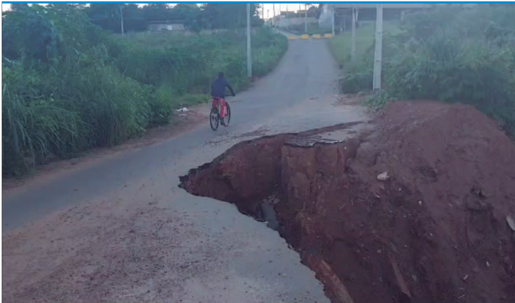
Ligação entre os setores Monte Sinai e Serra Dourada, em Trindade, ruiu até o poste de energia ser arrancado