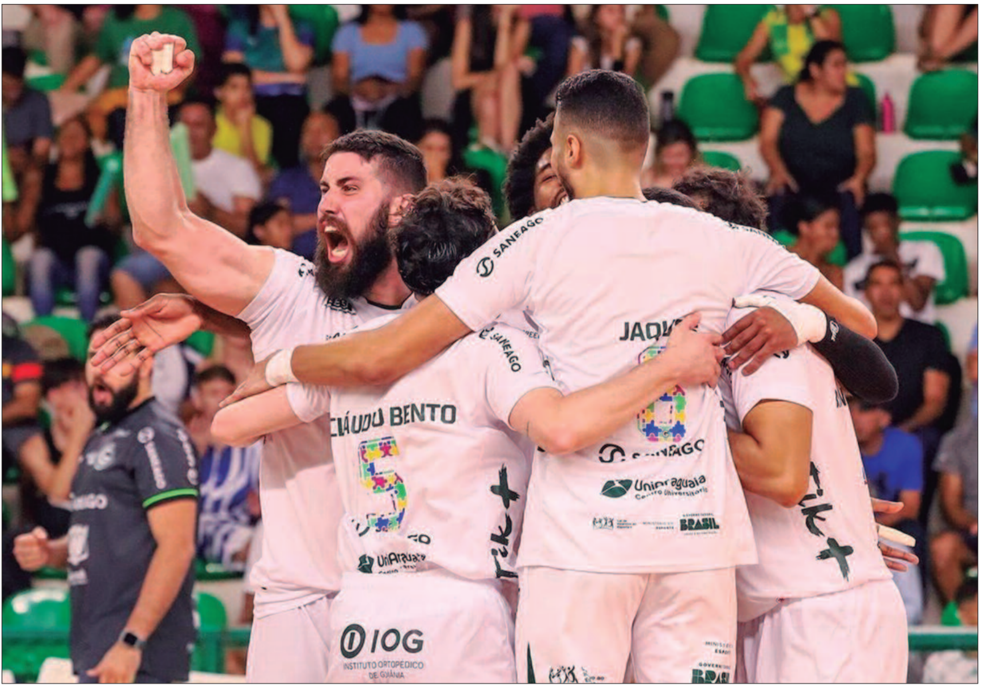
Após se garantirem na elite do vôlei nacional, Goiás e Neurologia disputaram título da Superliga B