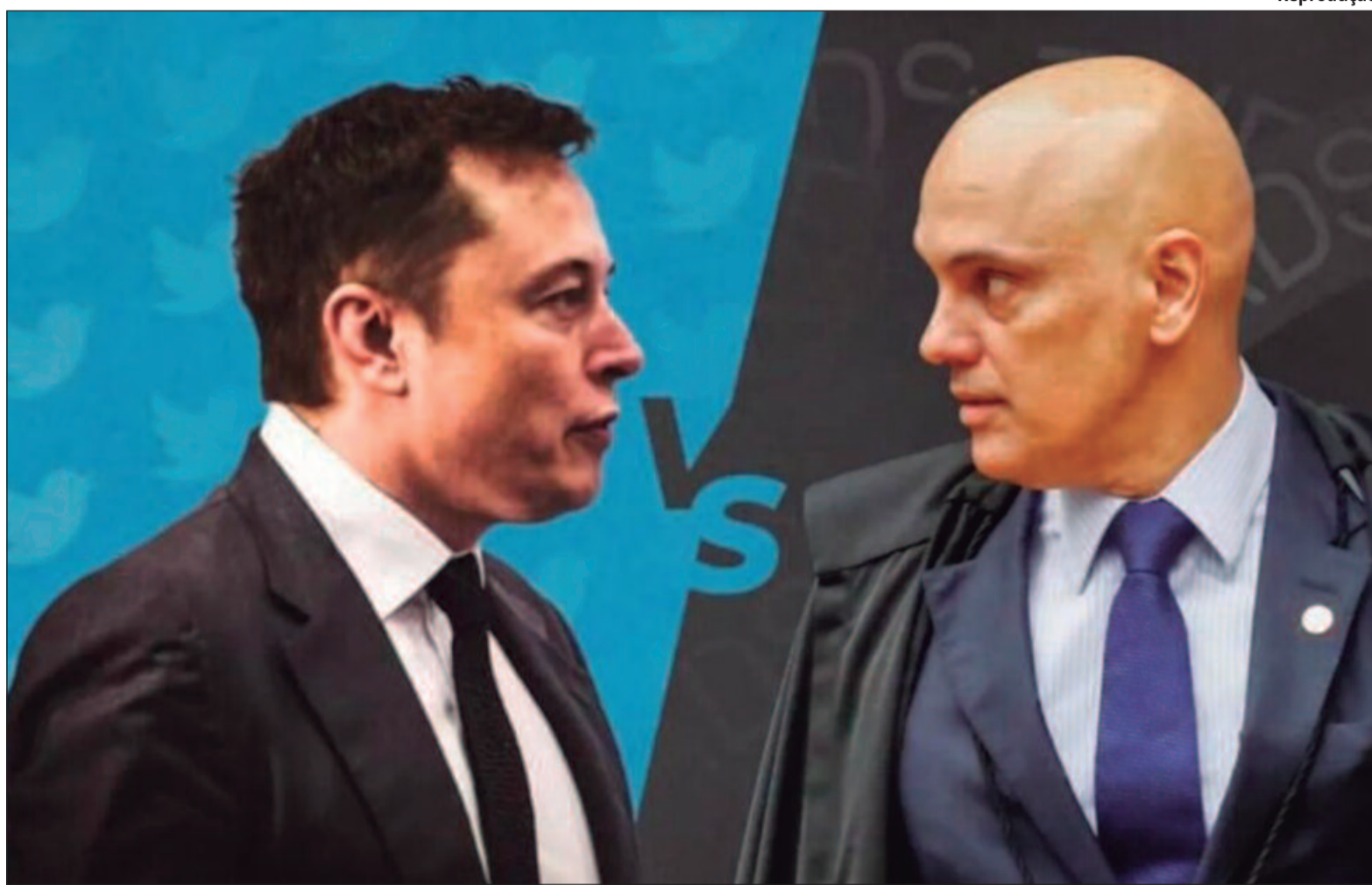
O dono do X, Elon Musk, tem feito críticas ao ministro do STF, Alexandre de Moraes, desde o começo do mês, chegando a chamá-lo de ditador

Em entrevista ao Jornal O Hoje, o deputado ainda citou que Musk também “foi barrado na Austrália por divulgar ações violentas” na rede social. “Não cabe a ele e a nenhum empresário se meter em políticas de outros países. Isso é invasão de soberania. Pode