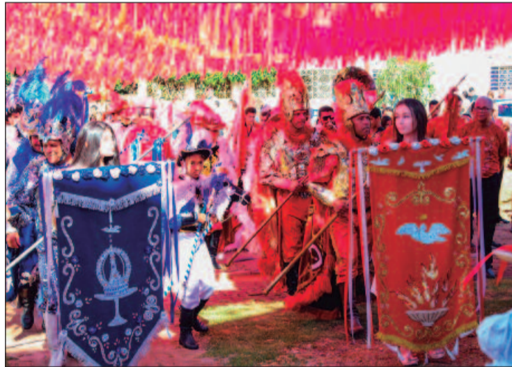
Por toda sua importância histórica, a cidade de Goiás sediará a festa deste ano, fortalecendo a iniciativa em sua oitava edição

ticipado e promovido anualmente estes encontros cuja proposta é reunir regiões que possuem devoção ao Divino Espírito Santo.