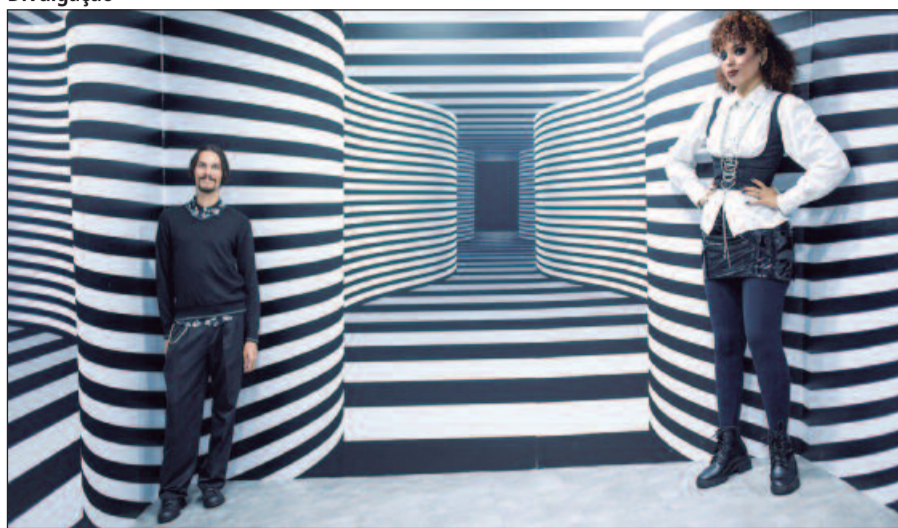
O espaço conta com aproximadamente 1.000 m 2 e com mais de 70 atrações, reunindo um acervo único de ilusões de ótica e experiências divertidas

feira a sábado. Onde: Av. Perimetral Norte, Nº 8303, Fazenda Caveiras - Goiânia. Horário: 10h, 12h. Ingressos: (sympla.com).