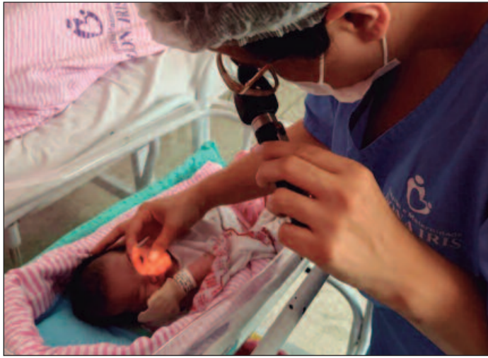
O teste é um direito de todo recém-nascido para diagnóstico de doenças