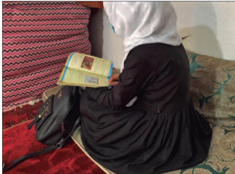
Repressão visa principalmente jovens entre 15 e 17 anos

Em meados de abril, a polícia iraniana anunciou que tinha reforçado o controle sobre o uso obrigatório do véu