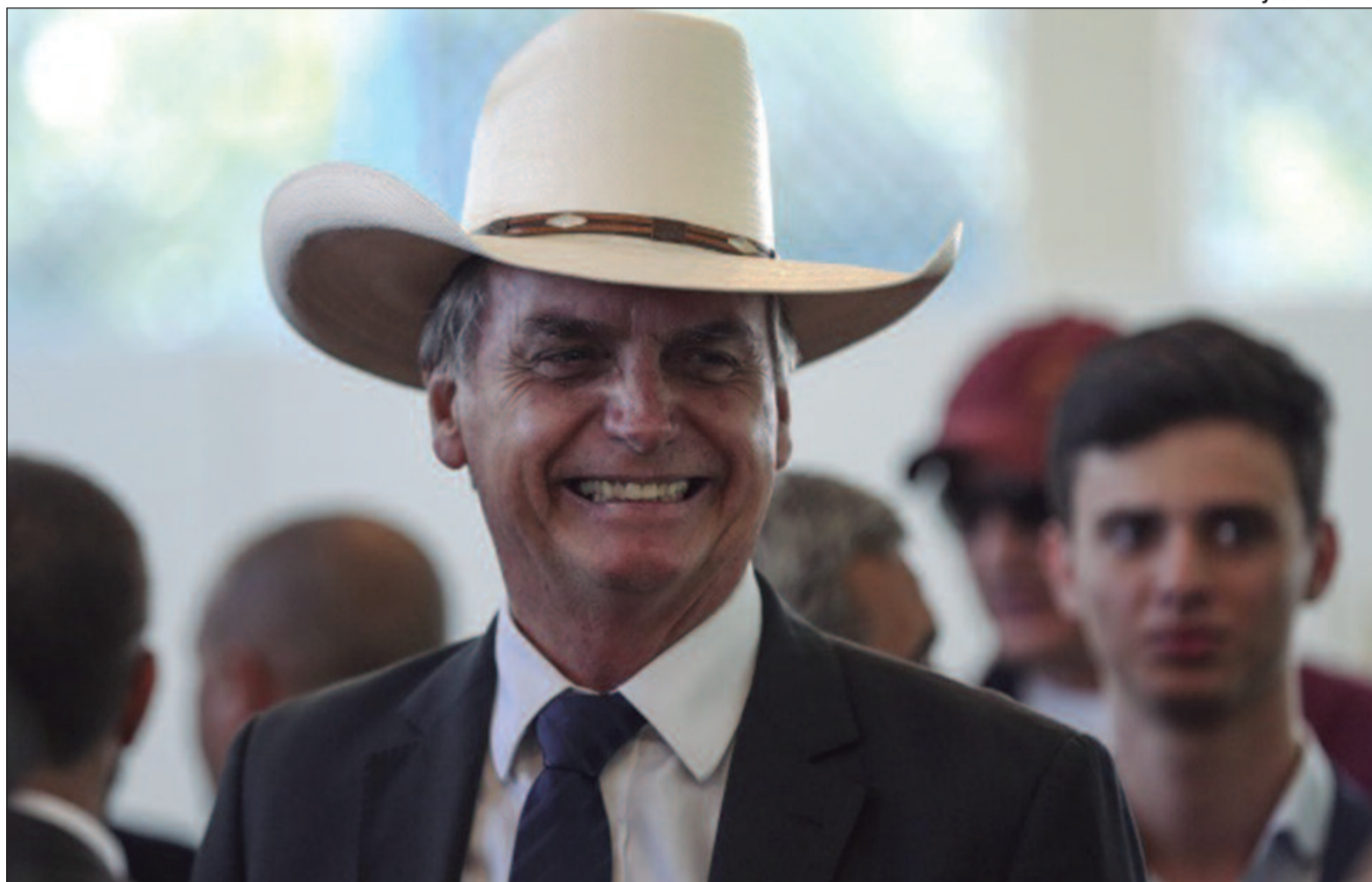
O ex-presidente Jair Bolsonaro (PL), ainda em passagem por Goiânia, em 2023, disse que a meta do PL é fazer mil prefeituras pelo País

Como citado, entre os cinco maiores PIB, o município de Catalão talvez tenha o nome que mais precise ser trabalhado. Em Anápolis, a situação também pode apresentar desafios. Isso porque a direita se dividiu, o que beneficia o ex-prefeito e deputado estadual, Antônio Gomide (PT), apontado