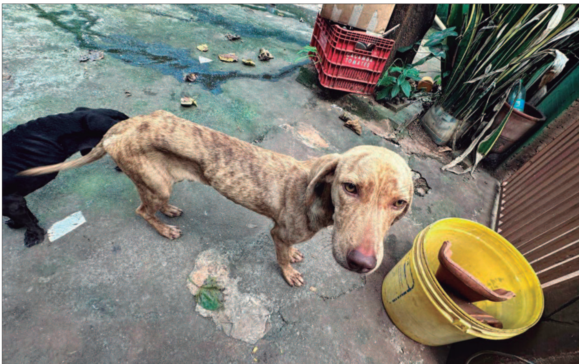
Cão Dexter, vira-lata de tamanho médio, foi encontrado em estágio avançado de desnutrição