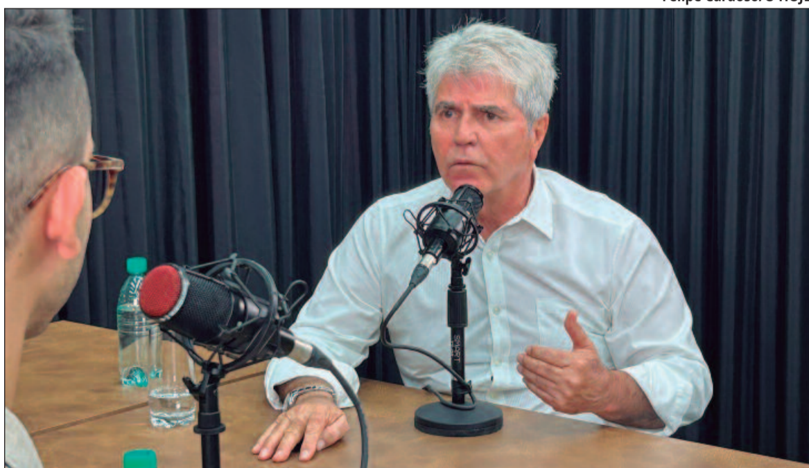
Empresário, que é pré-candidato a prefeito de Goiânia, visitou a redação de O HOJE na sexta-feira