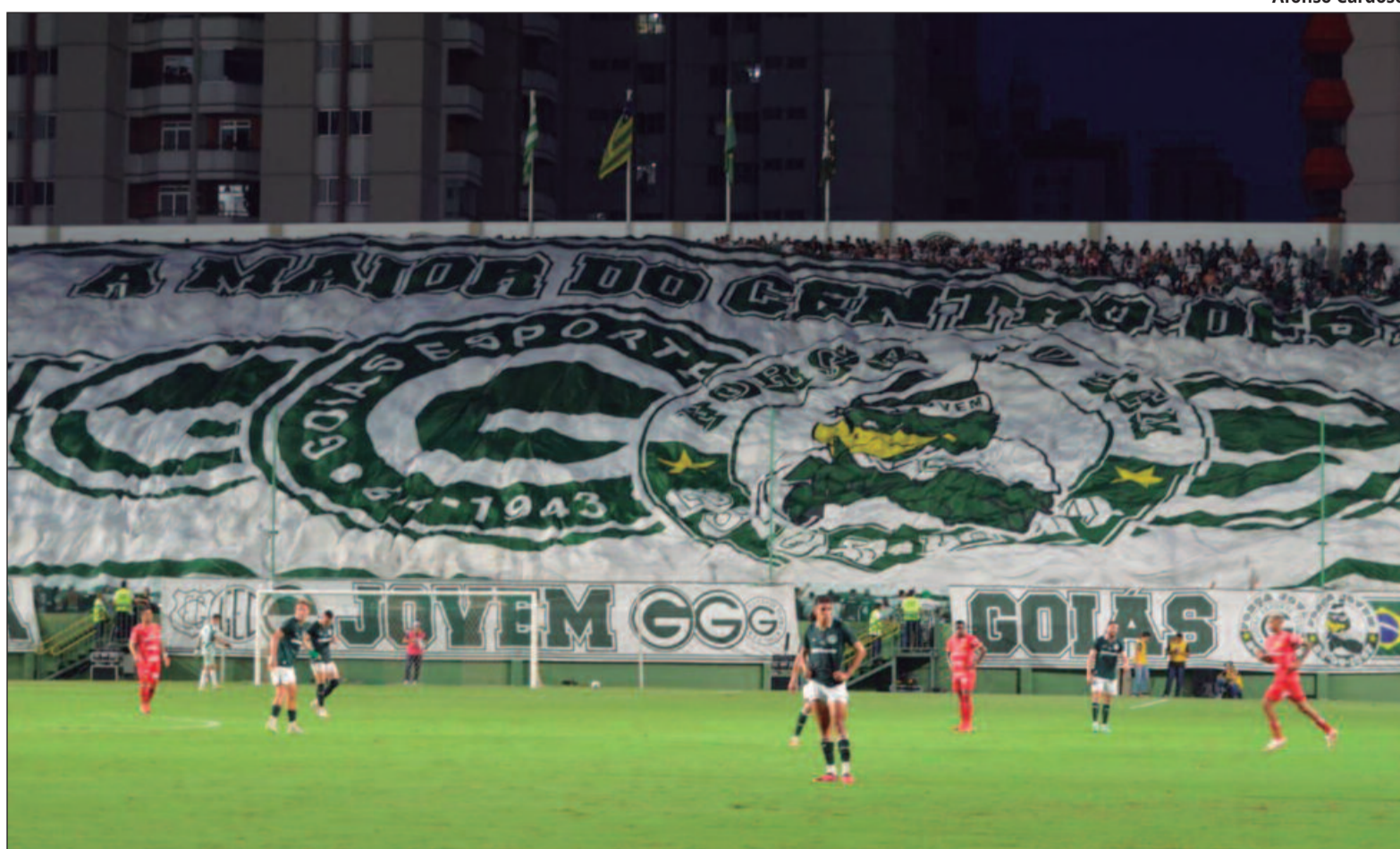
A Macaca defende uma invencibilidade de 11 anos sem perder para o Esmeraldino

"Não é só ter posse de bola, já teve jogo que tive muita posse e perdi. Temos que ser cirúrgicos. Trabalhamos muito isso. O futebol é complicado e não dá margem para você perder gols. Nós temos que aproveitar as oportunidades e matar o jogo. Não tem segredo. É jogar bem em casa, se impor e matar quando tivermos a oportunidade", explicou o treinador.