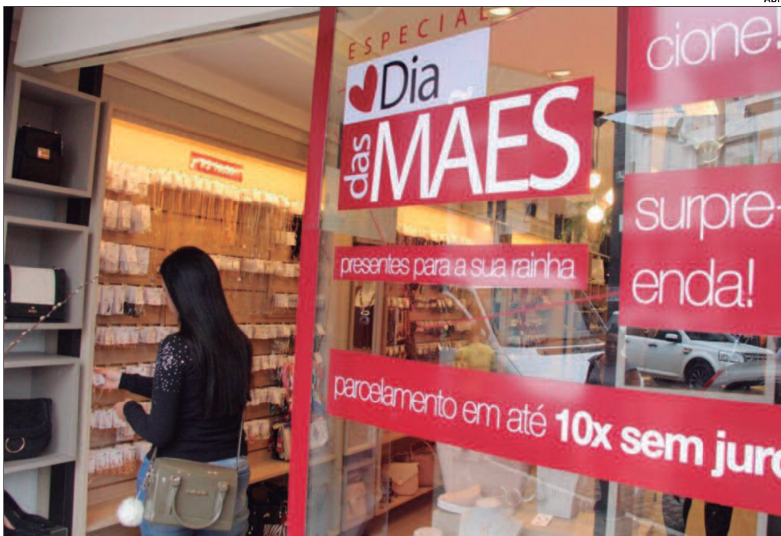
Nas vitrines do comércio, as placas de promoção, descontos e formas de pagamento atraem os olhares do consumidor