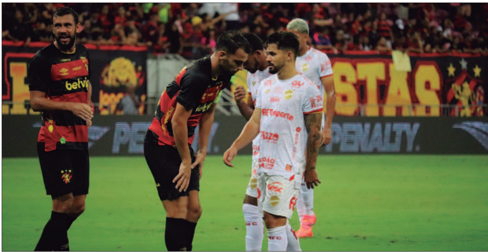
Fora de casa, Tigre foi superado pelo Leão e não somou pontos na segunda rodada do Brasileiro Série B