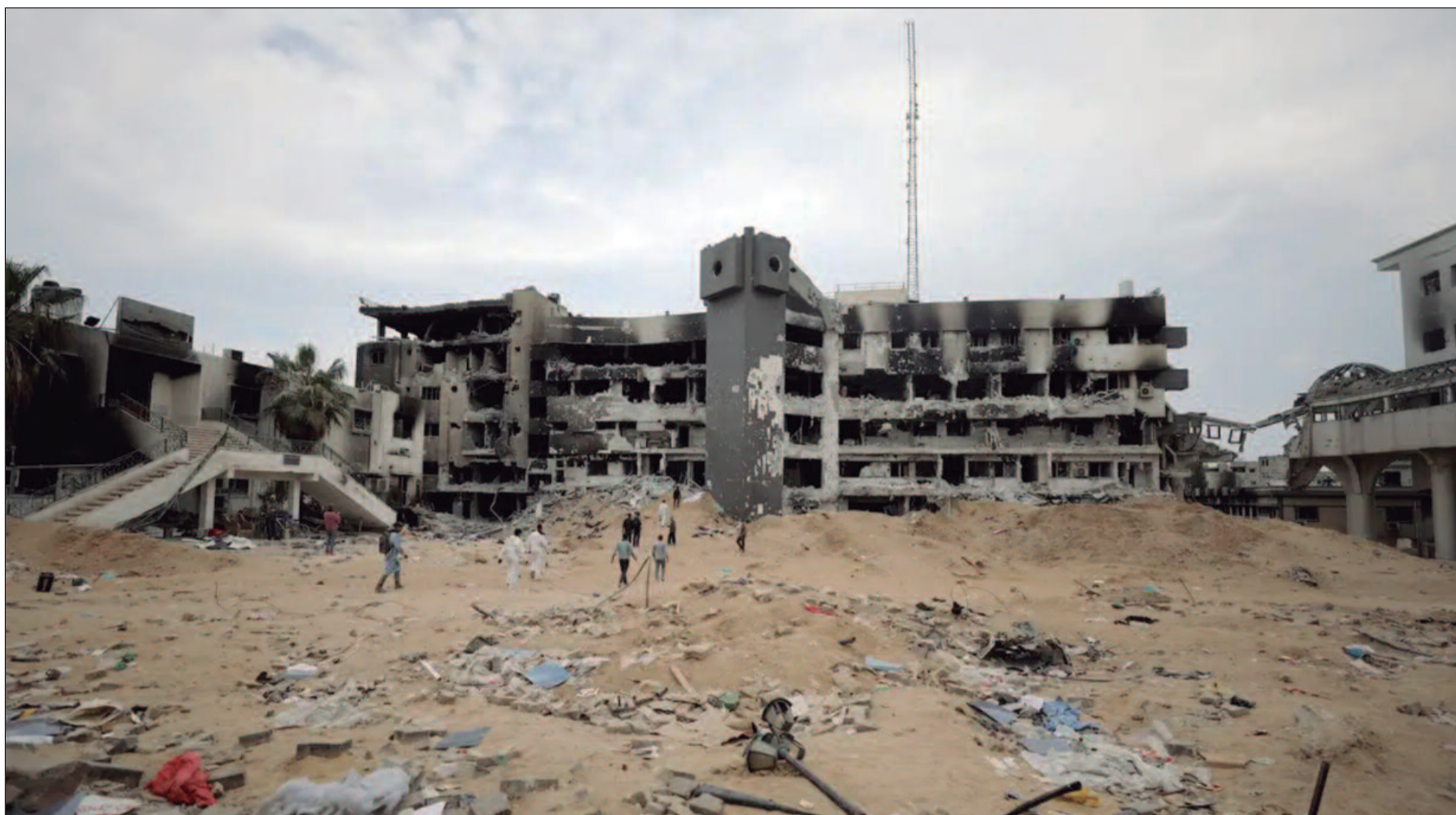
Guerra já teria deixado cerca de 37 milhões de toneladas de detritos