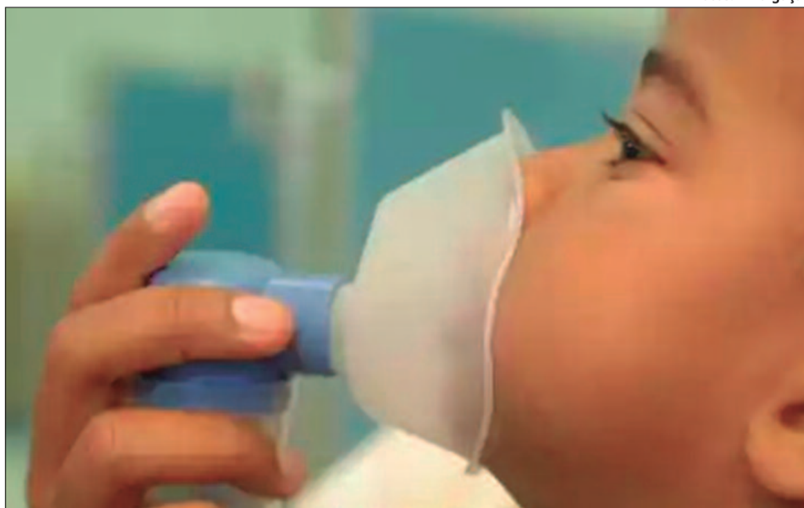
Casos de doenças respiratórias se concentram em crianças e idosos