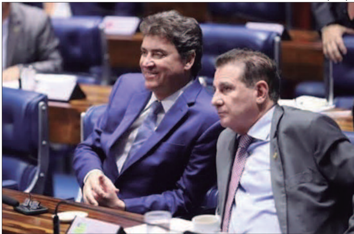
Alvo de críticas, a PEC do Quinquênio deve voltar ao centro das discussões no Senado Federal

O PL 2.721/2021, por exemplo, que está em análise na Comissão de Constituição e Justiça (CCJ),