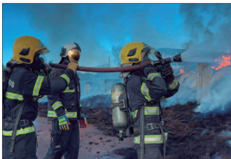
Mais de 30 militares estiveram presentes nas operações que se prolongam para a terceiro dia

De acordo com ele, a demora no combate dos fogos é por conta do material de borracha que possui uma fa-