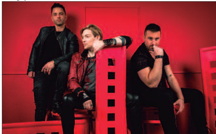
A banda traz ao Palácio da Música, no Centro Cultural Oscar Niemeyer, a turnê 'Camino Palmero - 20th Anniversary Tour'

Pio Vargas, o encontro 'Do livro não me livro', nesta sexta-feira (3), a partir das 14h, na sala de estudos da unidade. A iniciativa, que tem parceria com o Clube de Escrita Criativa Nonada, visa promover uma tarde literária, com imersão ao universo das letras. A programação é toda gratuita e inclui oficina de Escrita Criativa; Mostra Literária; ações de incentivo à leitura; dinâmicas e sorteios de livros; além de um momento musical ao som do pop com discos de vinil do acervo do Museu