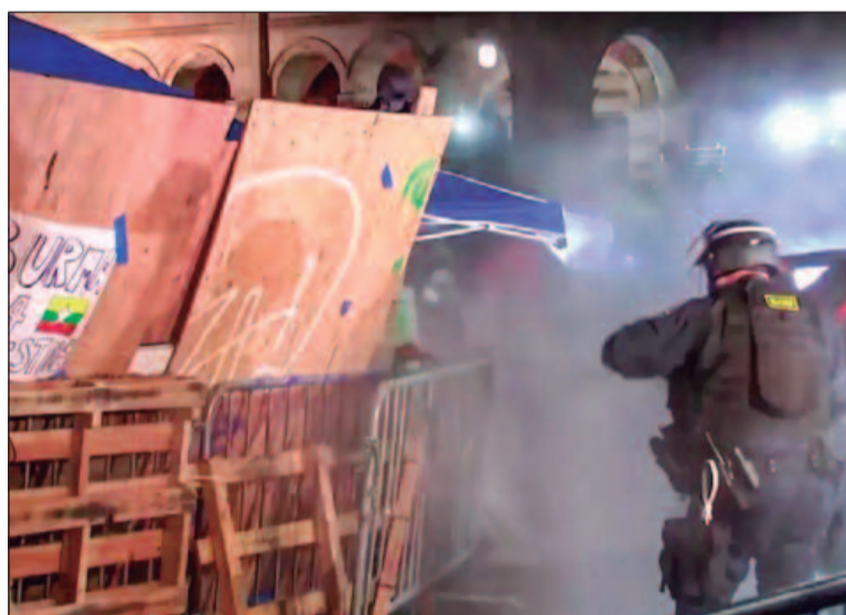
Estudantes fazem mobilizações em apoio aos palestinos

nia, em Los Angeles, anunciou o cancelamento das aulas de hoje, após confrontos entre os manifestantes pró-Palestina e pró-Israel que decorreram na praça central do campus universitário.