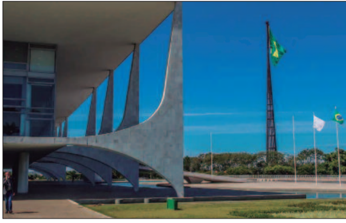
Primeiro-ministro visita o Brasil e terá reunião com Lula