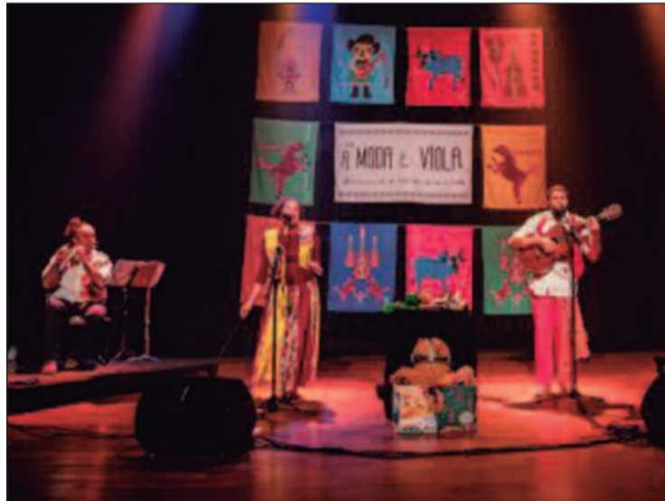
Iniciativa nasce da vontade de apresentar ao público a diversidade da viola caipira, desde a tradição à contemporaneidade

até experimentações que misturam a viola com jazz, música erudita e rock estão entre as atrações previstas.