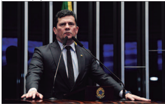
Processos chegam ao TSE após absolvição do ex-juiz no TRE-PR