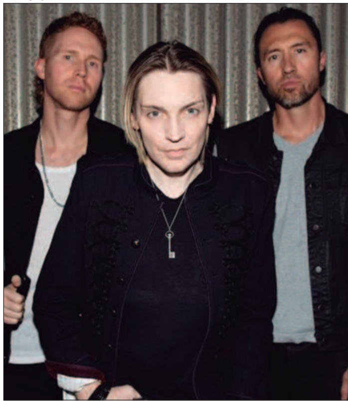
A banda se apresenta pela primeira vez em Goiânia e chega com a 'Camino Palmero - 20th Anniversary Tour'