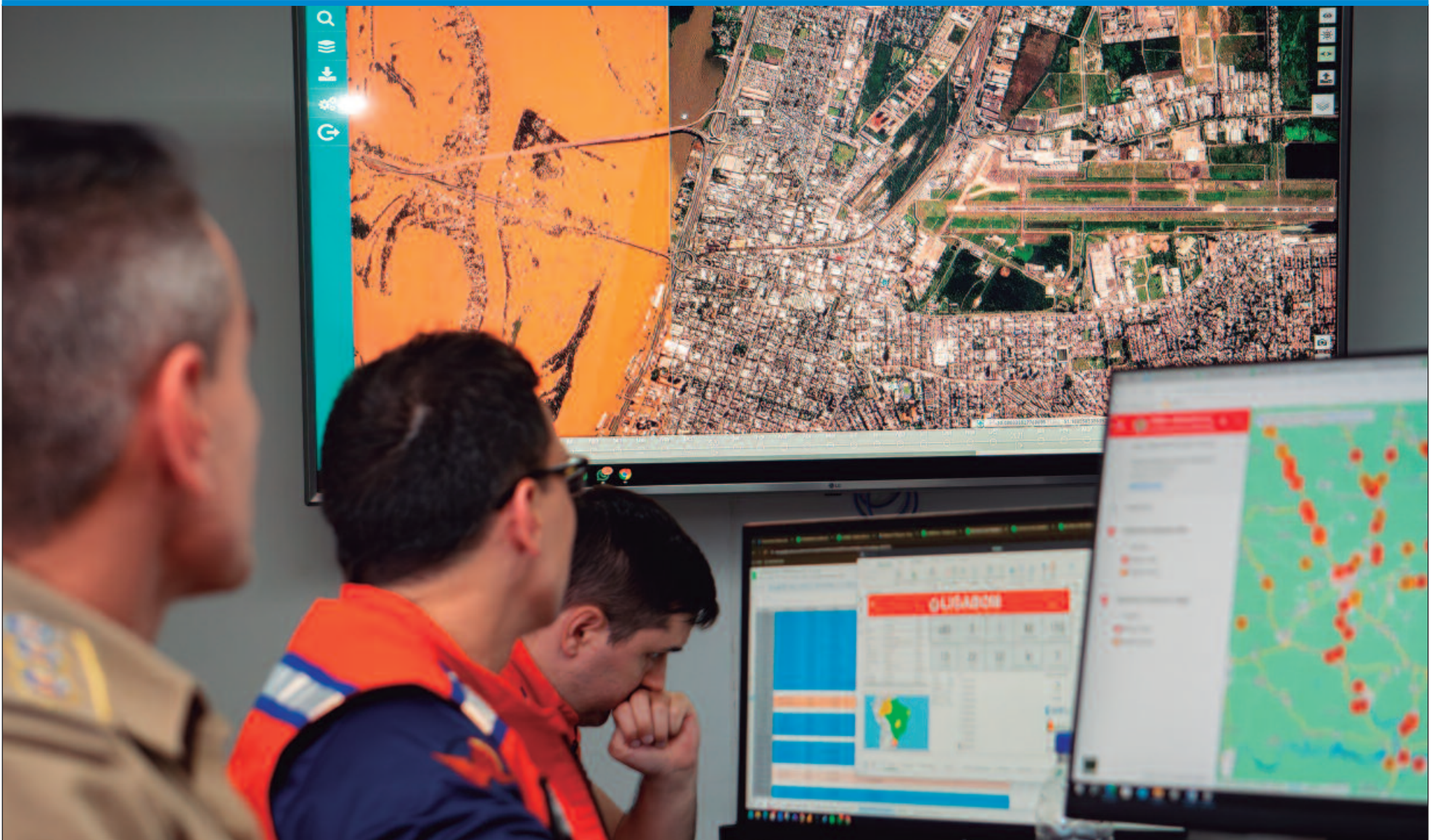
Equipe do gabinete de resposta possui assistência de ferramentas e mapas atualizados do Estado