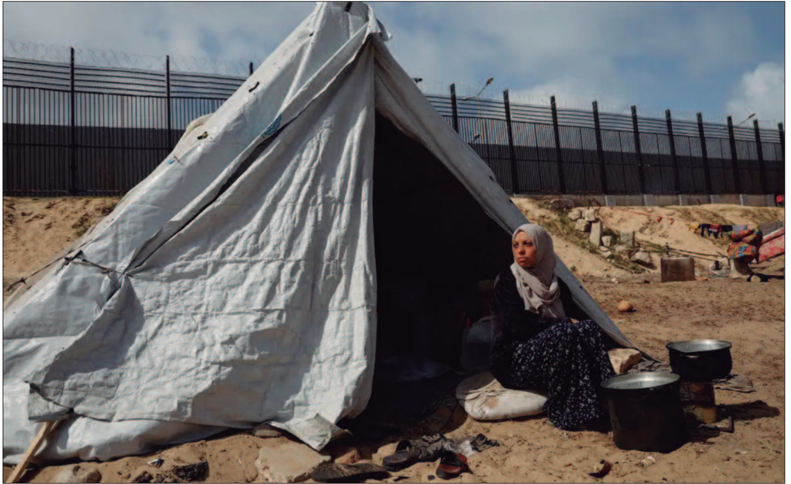
Em Rafah, ao Sul do enclave, perto da fronteira com o Egito, as forças israelenses intensificaram os bombardeiros aéreos e terrestres

No sábado (11), o exército israelense emitiu ordens de evacuação para os residentes de Jabaliya, pedindo que abandonassem o local "imediatamente", uma vez que as suas forças tentavam eliminar militantes do Hamas. "Estavam bombardeando por todo lado, incluindo perto de escolas que