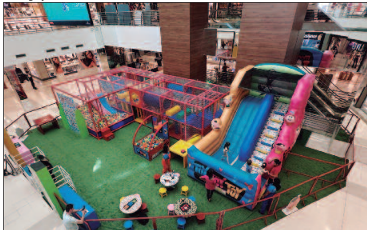
As aventuras da Turma da Mônica desembarcaram na Praça de Eventos do Goiânia Shopping oferecendo diversão para crianças

das Cavalhadas' estará em exibição até 28 de maio, com visita gratuita de segunda a sexta-feira, das 9h às 17h, no Museu da Imagem e do Som. A exposição apresenta obras em escultura de Valmir Neves e Vinícius Fagundes, grafite da artista Thainá Junger, fotografias de Michelly Matos e vídeos da Kam Filmes, destacando personagens das Cavalhadas em cerâmica, esculturas botânicas de frutos secos do Cerrado, grafite com os principais ícones dos festejos