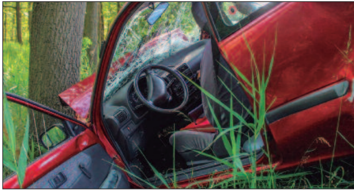
Carro saiu da pista da rodovia GO-060 e bateu em uma árvore