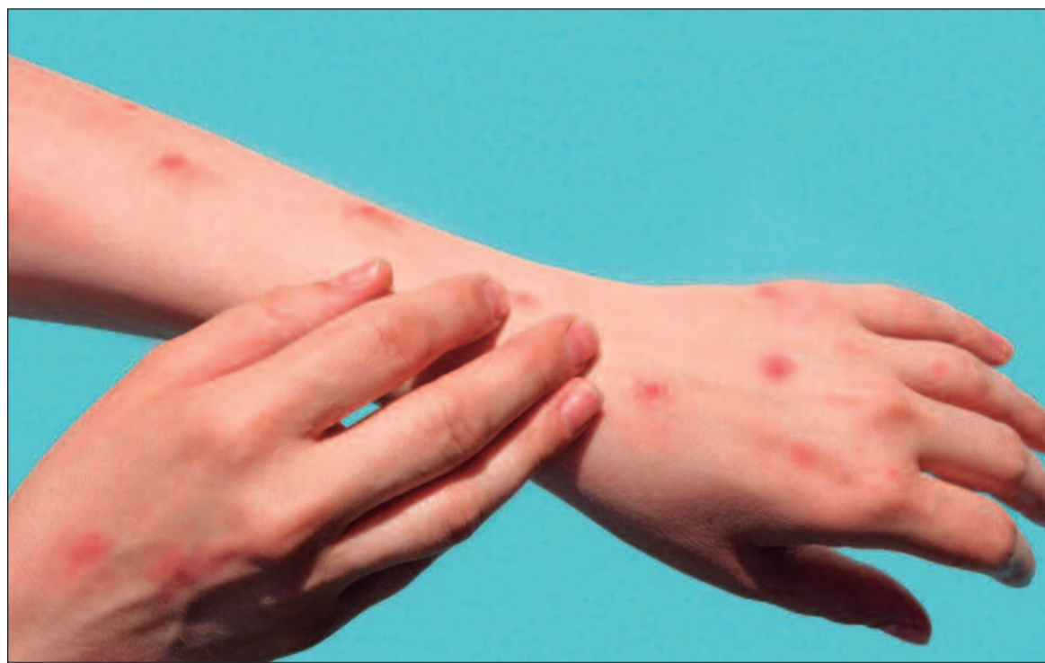
A doença, com origem na África, já registra mais de 99 mil casos confirmados globalmente

Os casos recentes de doença têm mostrado algumas particularidades, como a ausência de sintomas de mal-estar no início da infecção, além de manifestações como edema peniano e dor intensa na região do reto, o que tem tornado a identificação da doença mais complexa. A transmissão ocor-