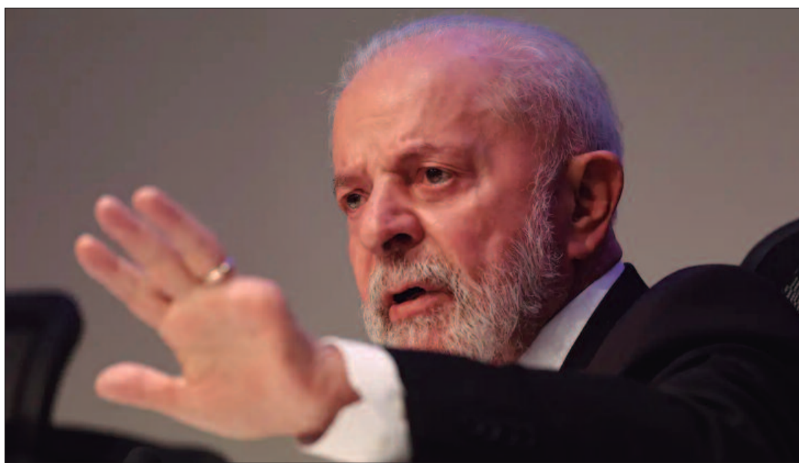
Presidentes do Brasil e da Colômbia falaram por telefone

Mais oito drones foram abatidos sobre a região sul de Kherson. Vários ataques russos nessa região mataram uma pessoa e feriram 13 no último dia.