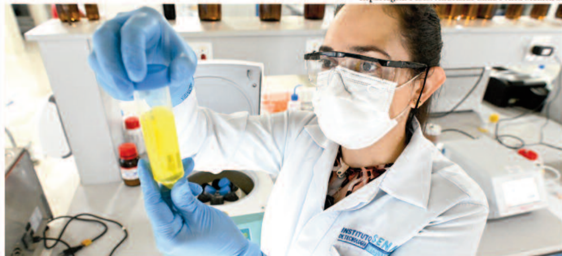
Laboratório do Instituto Senai de Tecnologia em Alimentos e Bebidas, em Goiânia: credenciamento garante qualidade e segurança dos produtos e diminui custos e prazos de entrega das amostras

Reportagem e foto: Andelaide Lima e Alex Malheiros