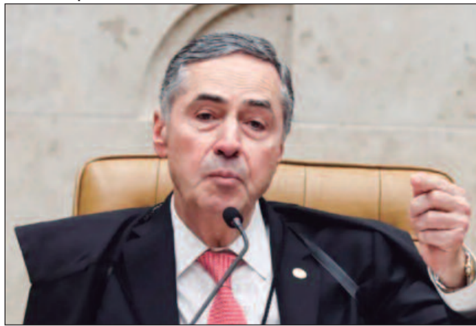
Decisão vem após Flávio Dino ordenar suspender as emendas