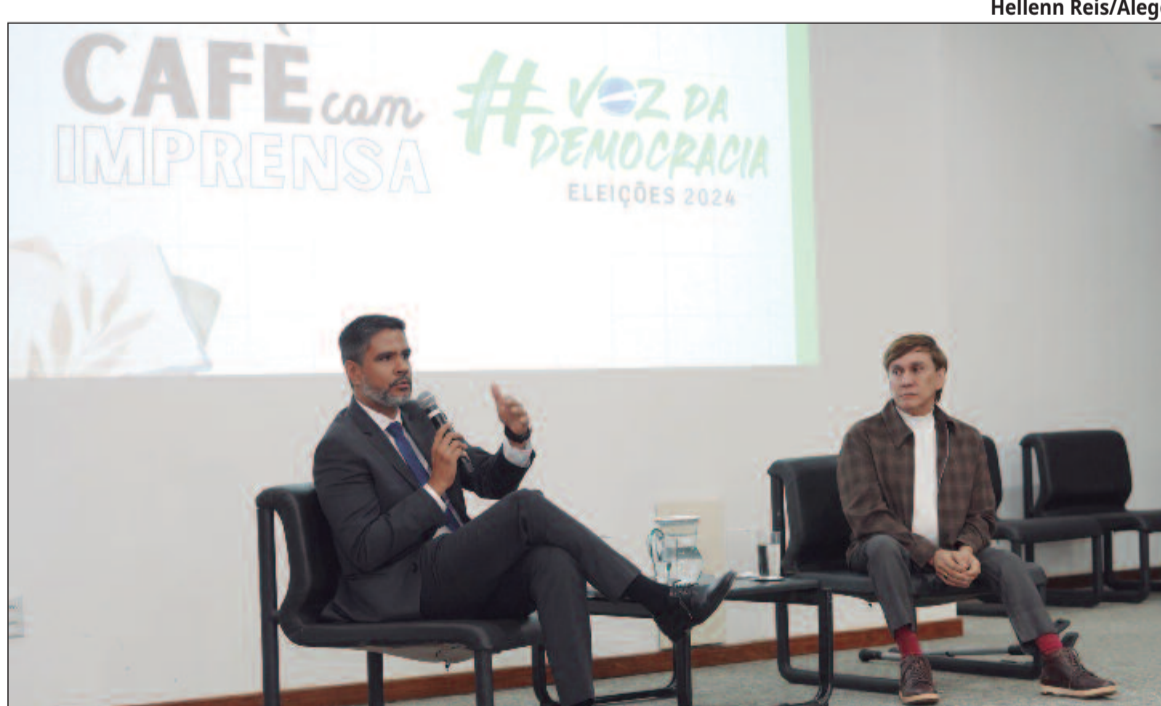
A partir desta sexta, os candidatos a vereador e prefeito darão início às campanhas eleitorais

Diversas dúvidas foram respondidas ao longo do encontro. A maioria delas relacionadas aos limites de atuação dos candidatos nas plataformas digitais. Sobre o assunto, o desembargador explicou que algumas normas