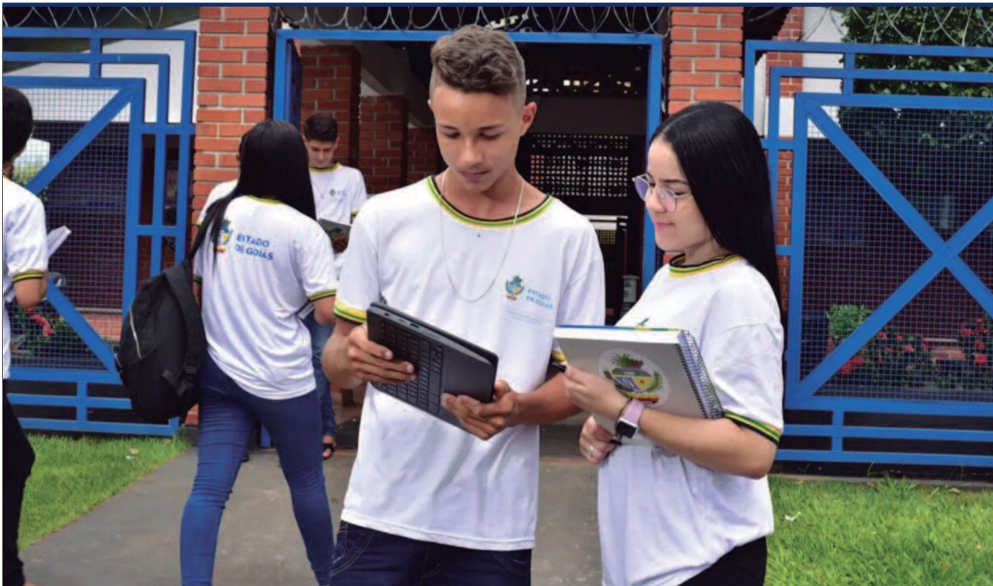
O Ideb é calculado a cada dois anos e varia numa escala de 0 a 10