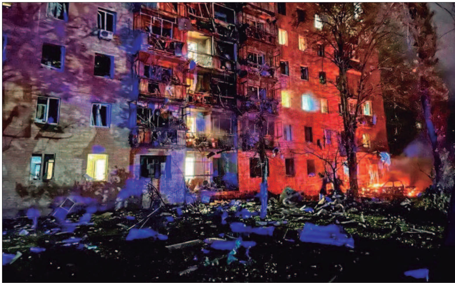
O maior ataque estrangeiro a territórios soberanos russos desde a Segunda Guerra Mundial ocorreu em 6 de agosto

O presidente ucraniano, Volodymyr Zelensky afirmou, nessa quarta-feira que suas