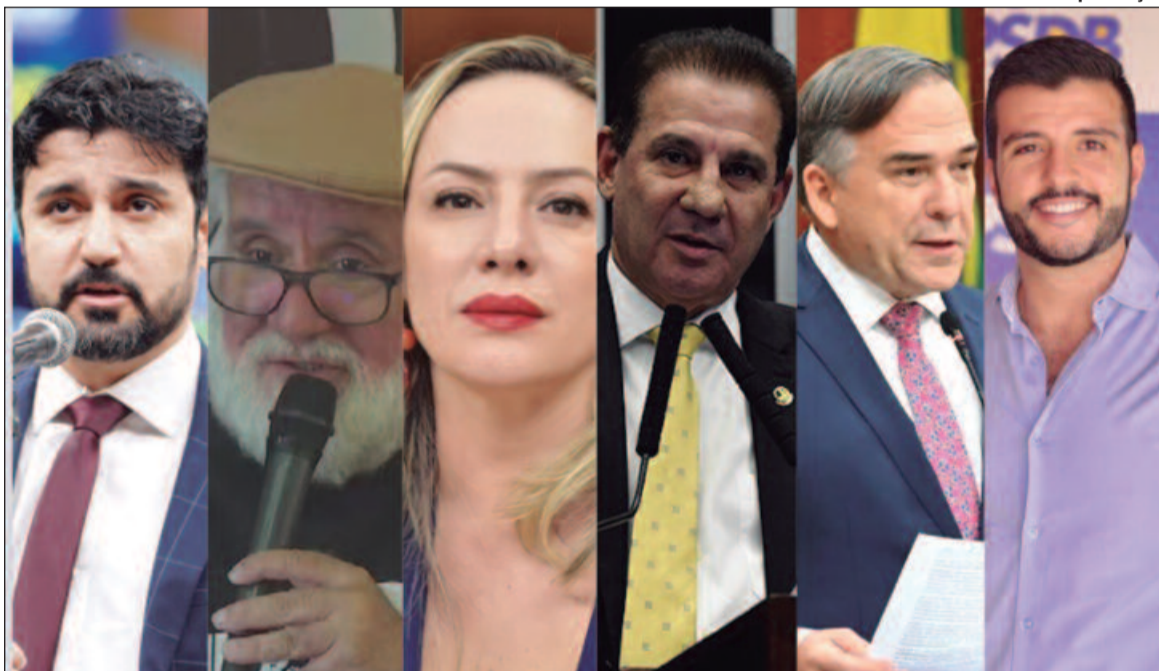
É neste momento que os candidatos, junto a seus aliados e base eleitoral, mergulham na campanha