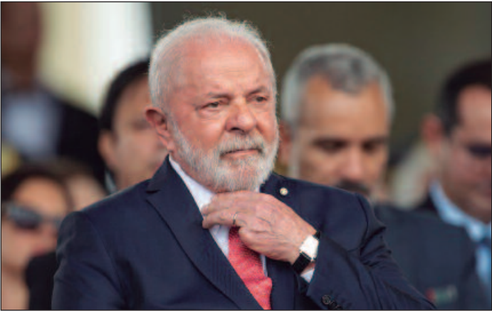
Em declaração conjunta com a Colômbia, governo brasileiro cobra transparência