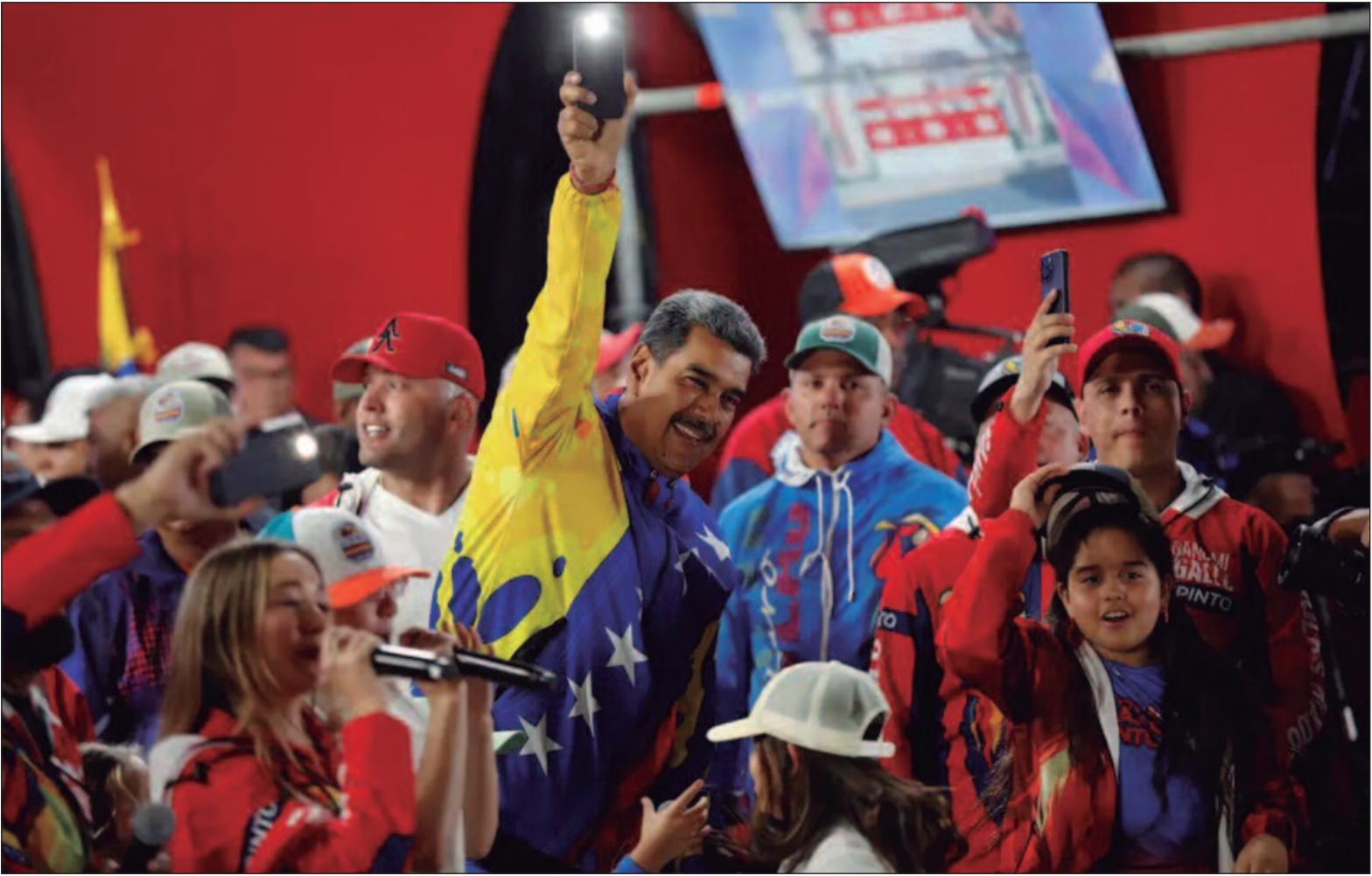
“Nossos países já haviam manifestado o desconhecimento da validade da declaração do Conselho Nacional Eleitoral”

“Nossos países já haviam manifestado o desconhecimento da validade da declaração do CNE [Conselho Nacional Eleitoral], logo que se impediu o acesso aos representantes da oposição à contagem oficial, a não publicação das atas e a posterior negativa de se realizar uma auditoria imparcial e independente de todas elas. A Missão Internacional Independente de Determinação dos Acontecimentos sobre a República Bolivariana da Venezuela alertou sobre a falta de independência e imparcialidade de ambas as instituições, tanto o CNE como o TSJ. Os países que subscrevem reiteram que somente uma auditoria imparcial e independente dos votos, que avalia todas as atas, permitirá garantir o respeito à vontade popular soberana e a democracia na Venezuela”, diz um trecho da carta conjunta.