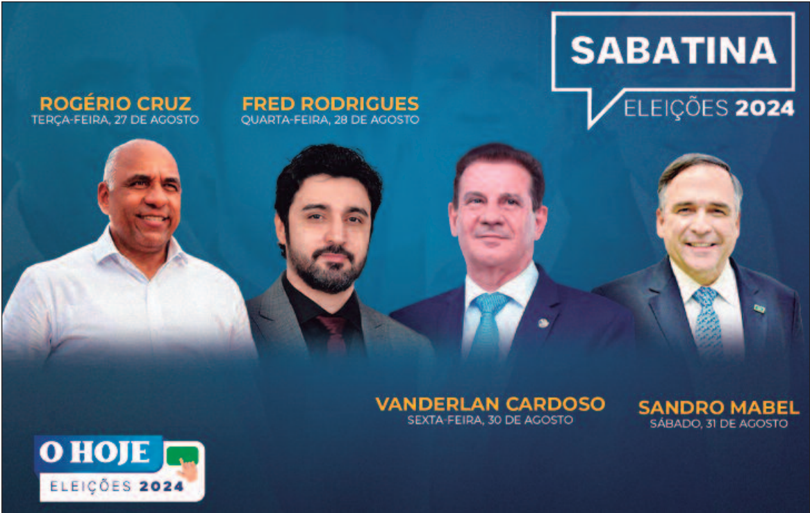
O HOJE promove, ao longo desta semana, uma série de sabatinas com os candidatos a prefeito

Onde assistir e como participar As sabatinas serão transmitidas ao vivo pelas principais plataformas digitais do jornal O HOJE, ampliando o alcance e a acessibilidade das entrevistas. Os eleitores poderão acompanhar e interagir através do Instagram (@ohoje), TikTok (@ohoje) e YouTube (Grupo O HOJE). A transmissão simultânea em