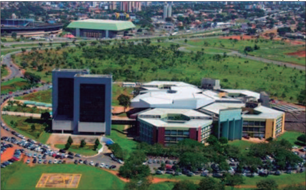
Dois dos sete candidatos ao Paço têm nomes do mesmo partido em suas chapas