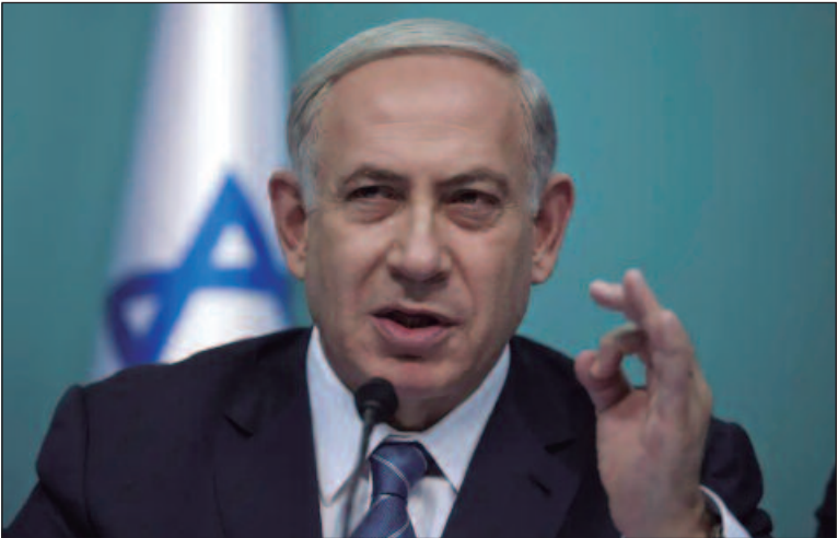
Benjamin Netanyahu alerta: “Este não é o fim da história”

Qualquer escalada no combate, que começou junto com a guerra em Gaza, possui o risco de se tornar um confronto regional ao trazer o apoiador