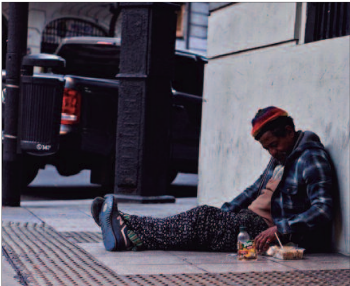
A maioria é composta por homens negros entre 18 e 59 anos, com extrema pobreza e alto índice de deficiência