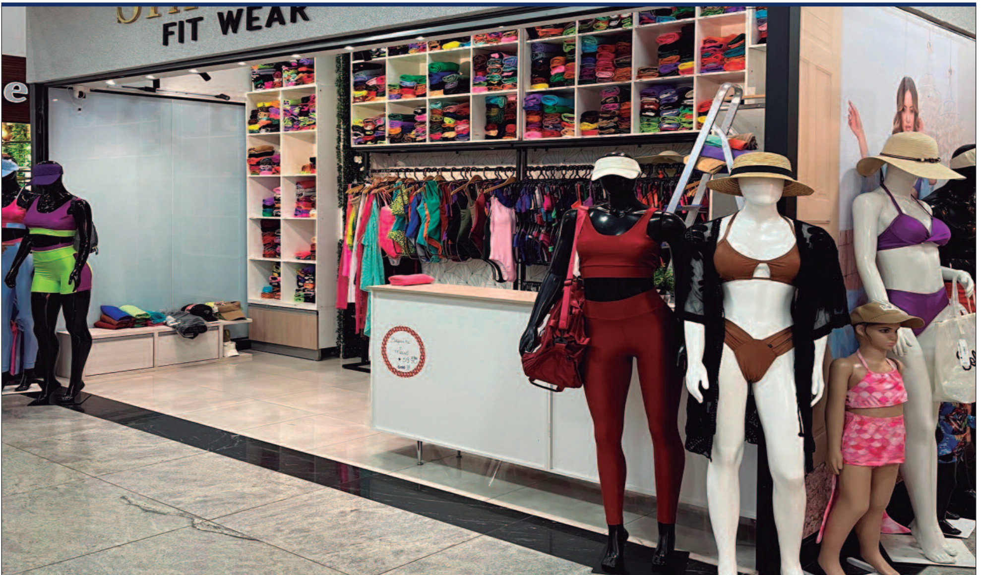
A estimativa é que, em 2023, o setor tenha movimentado cerca de 8 bilhões de reais, com projeções de crescimento contínuo