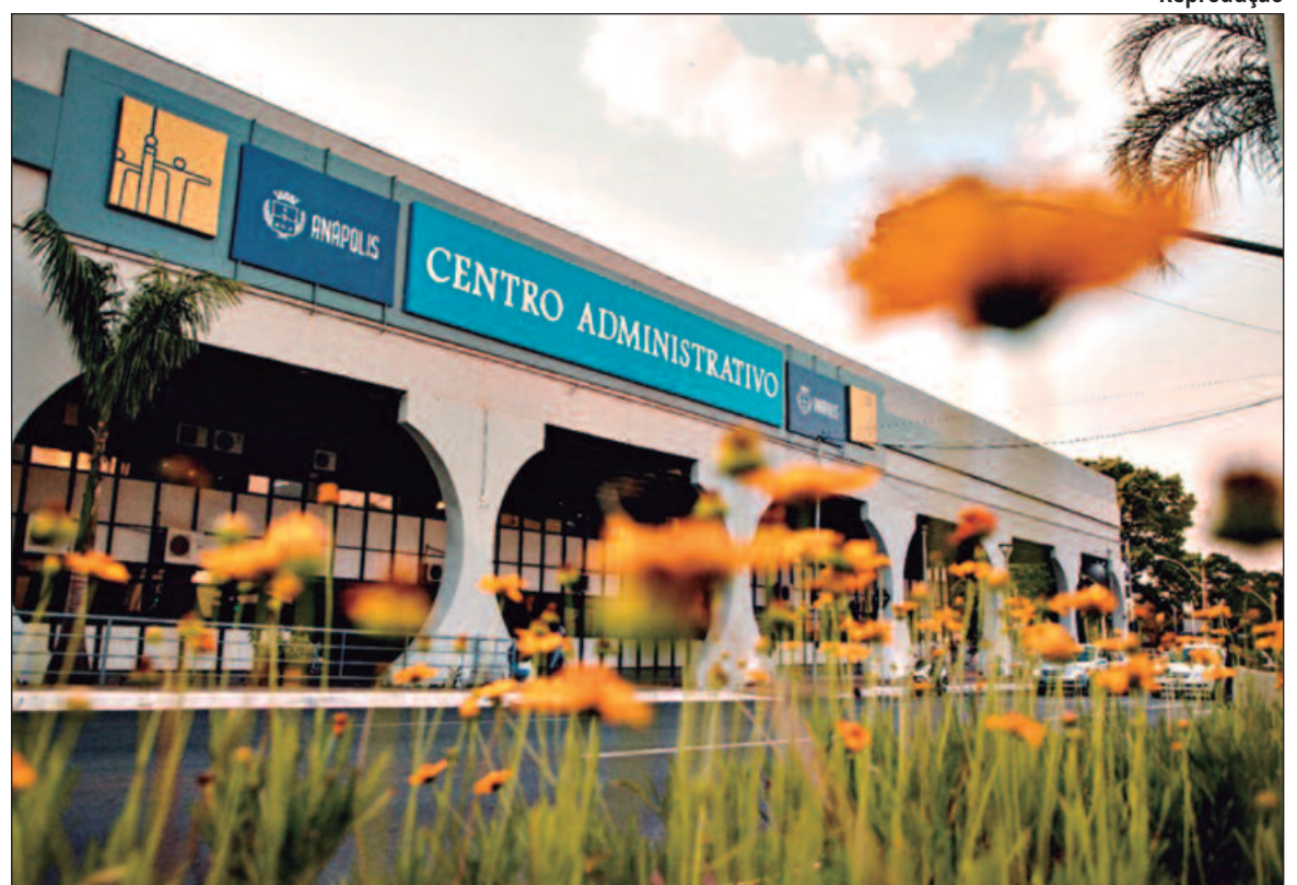
O Hoje já apresentou as propostas de saúde e educação dos candidatos à prefeitura da cidade

Em outro trecho, ele diz que a secretaria municipal de Segurança Pública será responsável pela interlocução com os mais diversos órgãos do Sistema Único de Segurança Pública (Susp), em prol das atividades da Segurança Pública no município, e terá como foco discutir políticas públicas de segurança local, bem como estabelecer programas e projetos