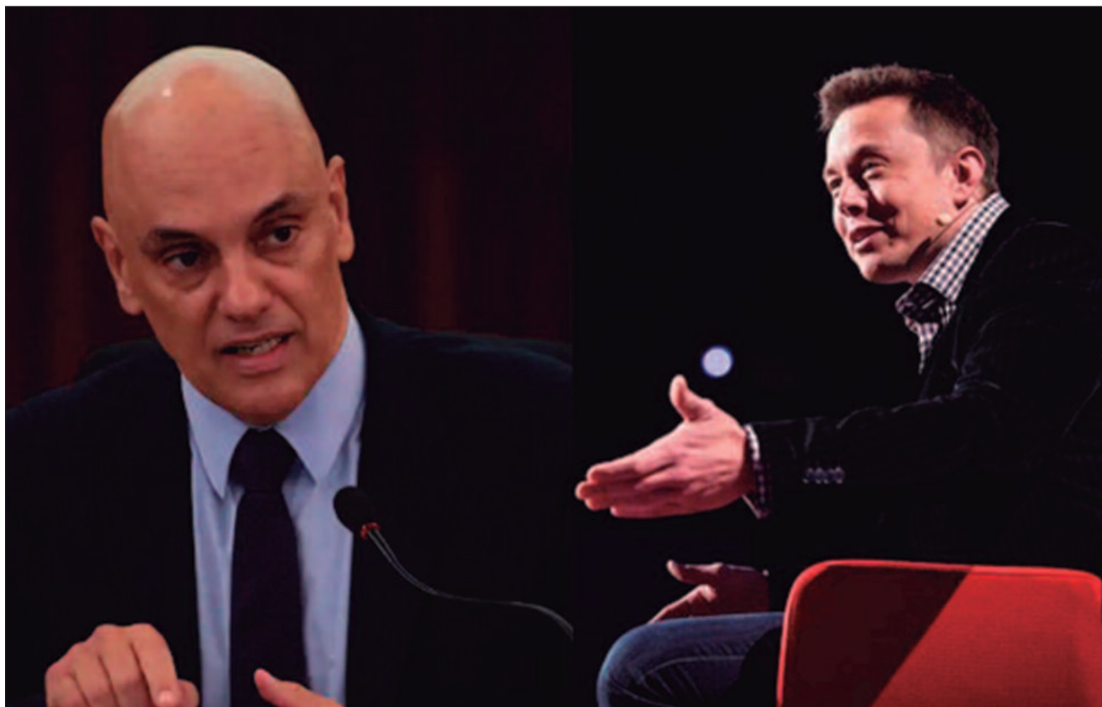
De maneira geral, o que se percebe são bolsonaristas em defesa de Musk, enquanto esquerdistas parabenizam Alexandre de Moraes

A derrubada da rede no país causou revolta de diversos parlamentares, em grande maioria, ligados ao bolsonarismo. O deputado federal Gustavo Gayer (PL-GO) postou um vídeo em suas redes sociais ironizando a imprensa, a qual o parlamentar disse que "bate palma" para Moraes. "A imprensa que apoia suas ações,