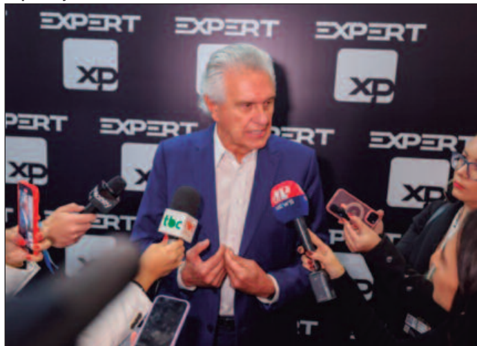
Governador rebateu afirmações de ministro do governo Lula