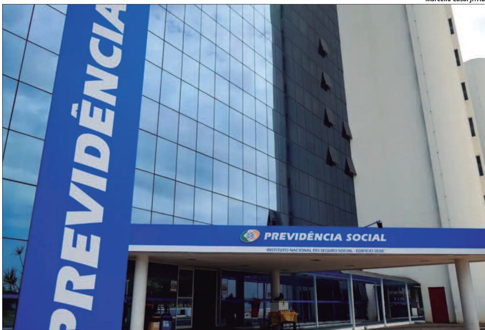
Só neste ano a revisão de seguros fornecidos por incapacidade temporária resultaram na economia de R$320 milhões