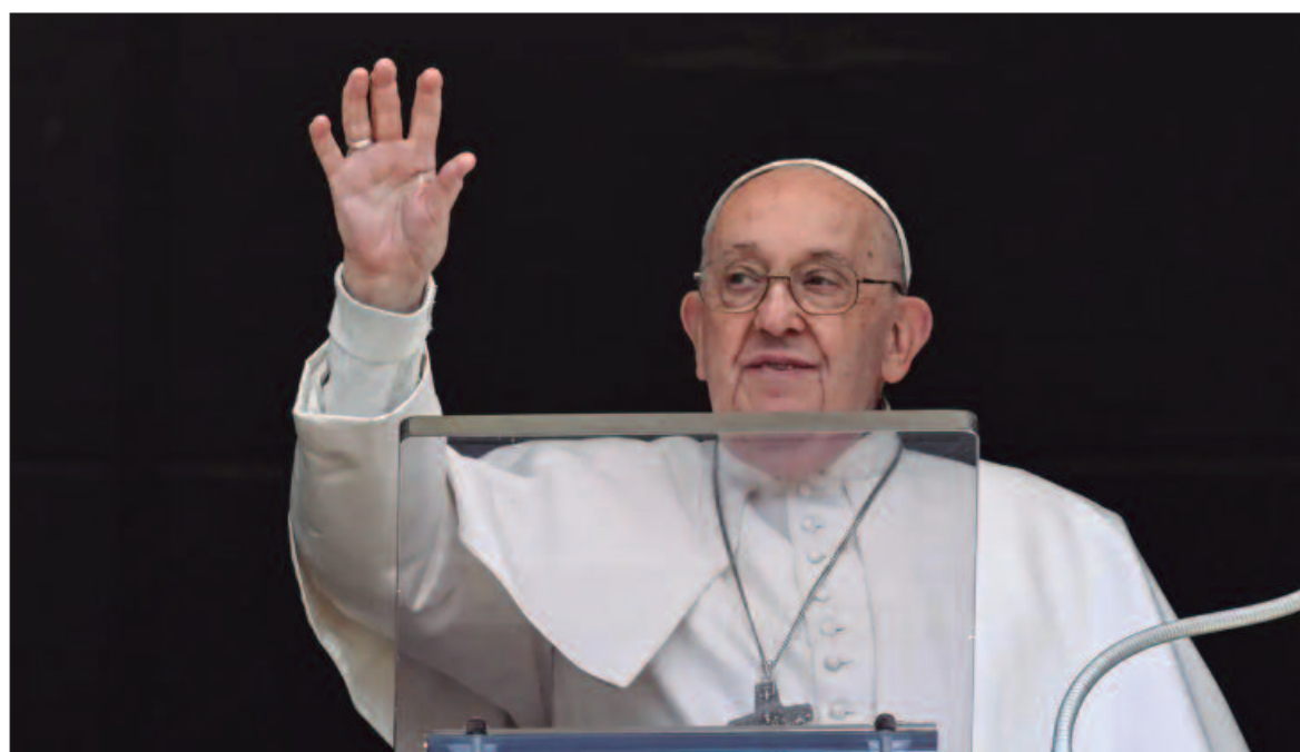
Declaração foi proferida durante novo alerta do líder católico sobre mudanças climáticas