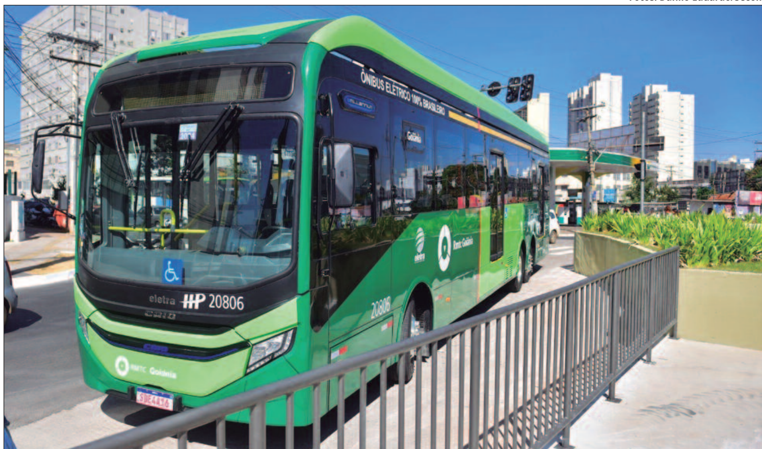
O BRT foi projetado para atender uma alta demanda de passageiros, com uma previsão de realizar 1,2 milhão de viagens por mês

O BRT Norte-Sul é operado por uma frota moderna, composta por 60 veículos de 14 metros, sendo 10 deles elétricos e os demais movidos a biodiesel. Esses ônibus estão equipados com ar-condicionado, carregadores de celular e Wi-Fi. Os novos veículos foram