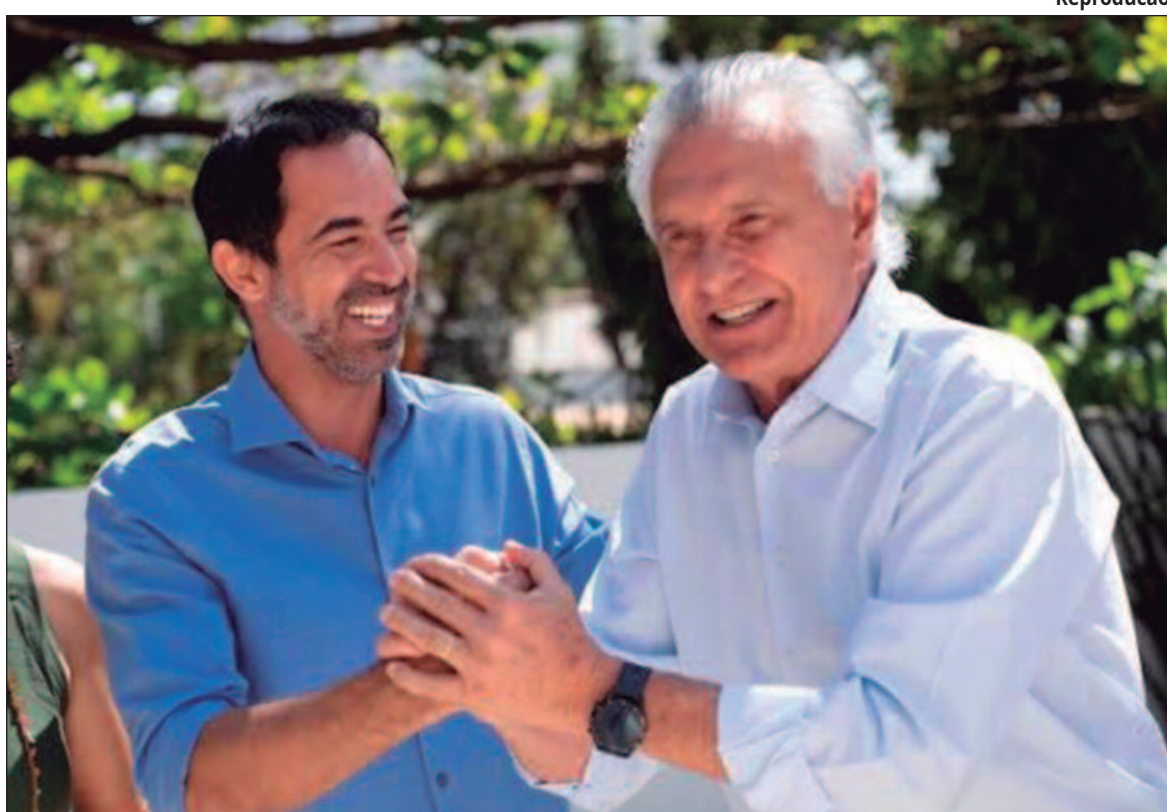
Em eventual segundo governo, gestão quer concluir reformas no sistema de saúde e abastecimento

O prefeito tem se destacado por mostrar mais o que tem