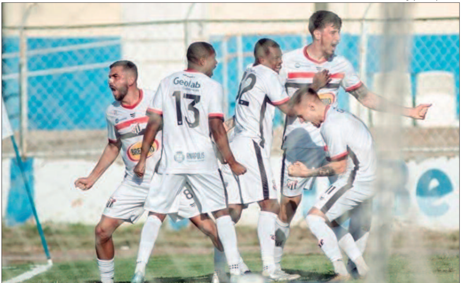
O Anápolis voltará a disputar a Série C do Campeonato Brasileiro após 16 anos

nutos, o Tricolor da Boa Vista chegou no ataque com Gonzalo, que apareceu novamente para marcar o segundo dele e empatar o duelo.