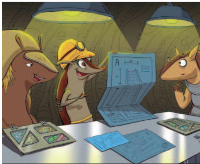
Animação passa no coração de Goiás, onde a protagonista, Malu, uma tatu engenheira, enfrenta desafios sociais