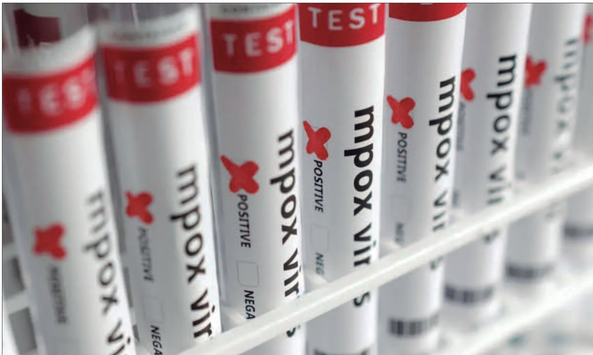
No começo deste mês, a Organização Mundial de Saúde declarou a mpox uma emergência de saúde pública global