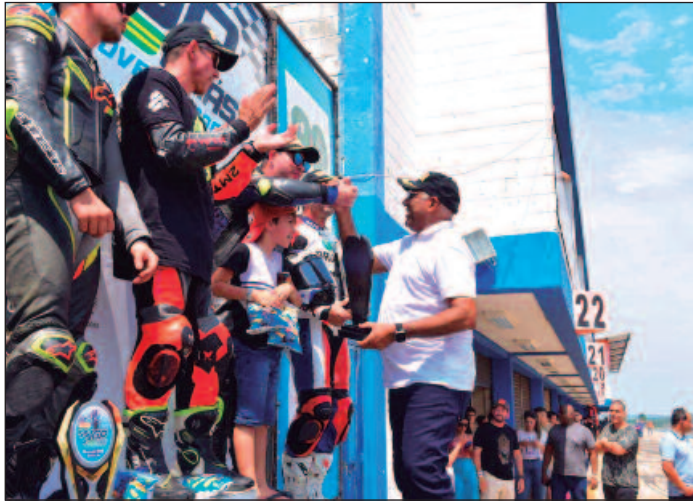
Prefeito recriou a pasta do Esporte e promete novo programa