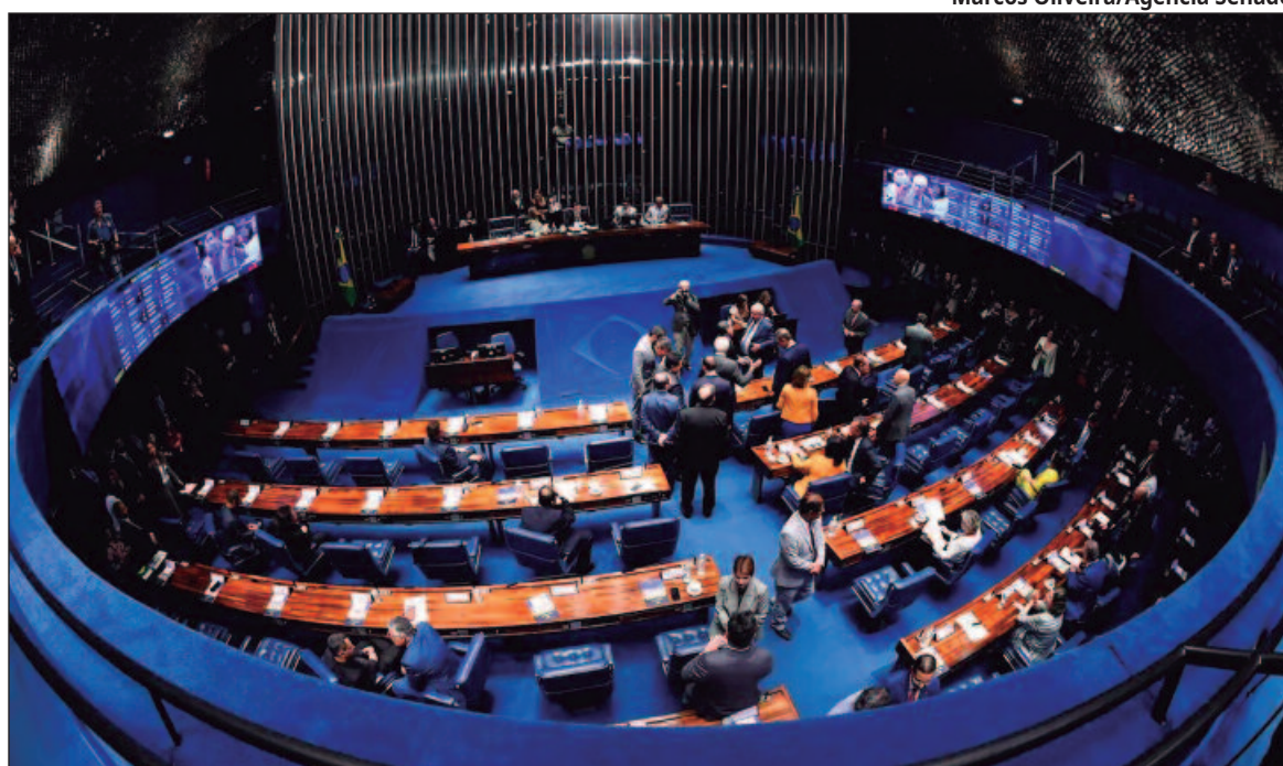
Plano do Governo Federal é começar implementação do novo molde de tributação em 2025

Em suma, a Reforma Tributária determina a simplificação dos impostos a nível federal, estadual e municipal. O imposto sobre consumo, o primeiro a ser tratado na reforma, será único, o Imposto sobre Va-