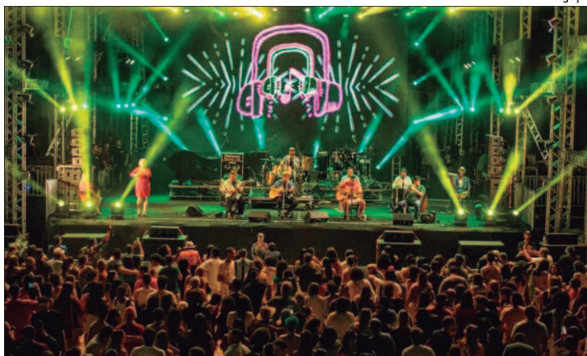
No total, são 55 artistas regionais e locais que vão agitar o público nos quatro palcos espalhados pela cidade

Para tornar a 23ª edição ainda mais completa, este ano o festival conta também com o Estúdio Primavera, que é um espaço de gravação