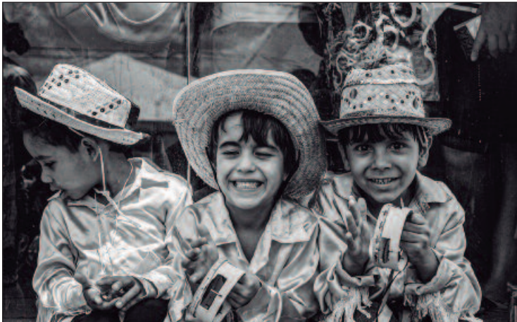
Além de Goiânia, a mostra composta por 80 fotos vai circular por mais 3 municípios goianos: Catalão, Ouvidor e Três Ranchos

através das fotografias reforça o sentimento de pertencimento a uma tradição intensa e viva, mantendo-a presente nas gerações futuras. A congada é, acima de tudo, uma experiência a ser sentida, uma celebração da vida, da fé e da herança cultural. Cada imagem se torna um elo vital na corrente da história, garantindo que a beleza e a resi-