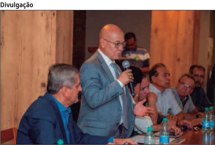
Candidato garante que, se eleito, terá a saúde como prioridade