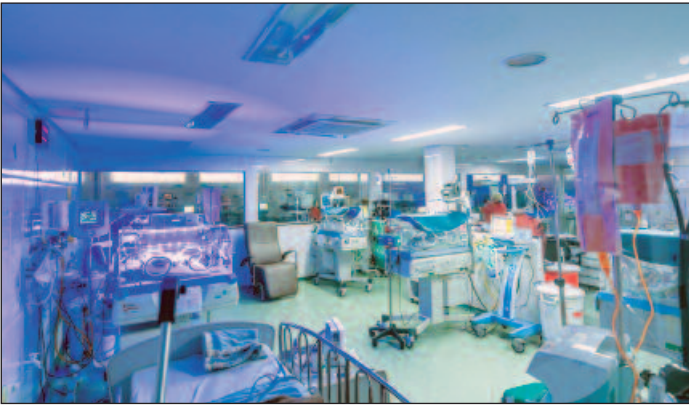
Unidade afirma não ter mais condições de arcar com os custos dos tratamentos e internações