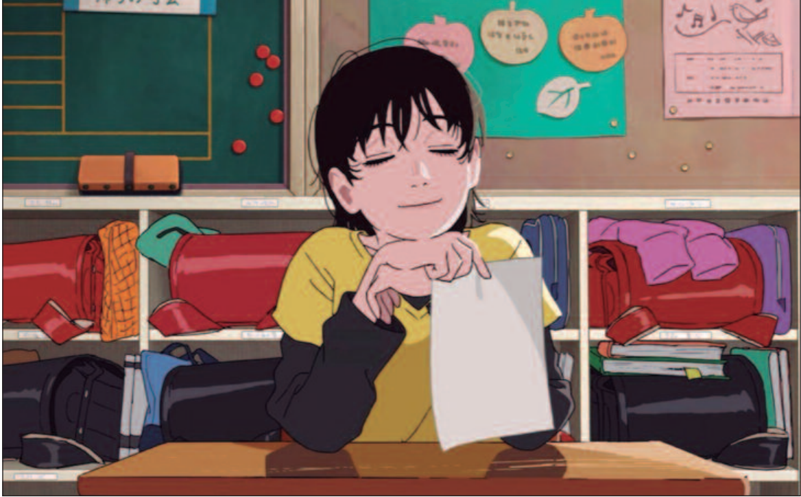
‘Look Back’ segue a história de amor por desenhar mangás que une duas garotas de uma cidade pequena