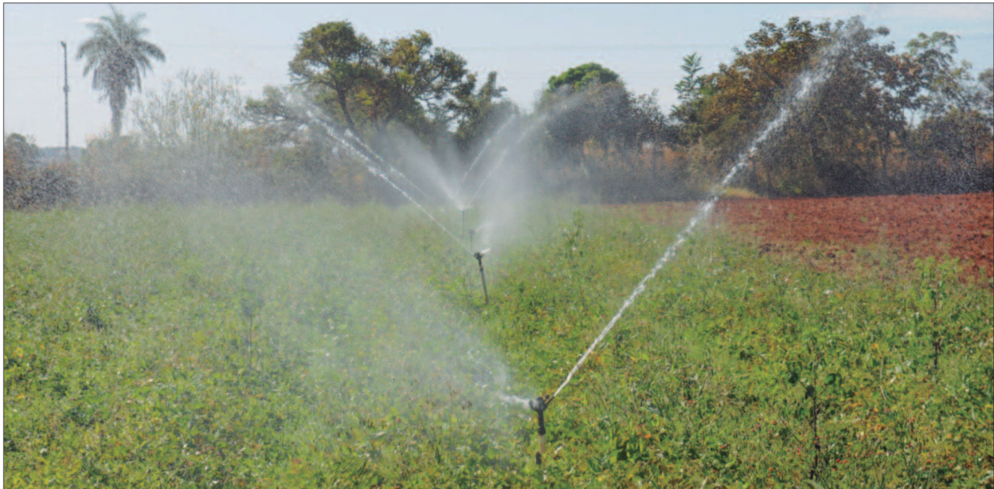
A melhor estratégia para manter a plantação são as barragens com a manutenção da vazão para que a água possa ser utilizada no tempo seco

balanço mede: a evapotranspiração da planta, a infiltração da água no solo plantado e a quantidade que uma colheita precisa da água. Este trabalho técnico que geralmente é feito por engenheiros agrônomos também é feito e orientado por equipes do Senar e da Emater através da iniciativa privada. (Especial para O Hoje)