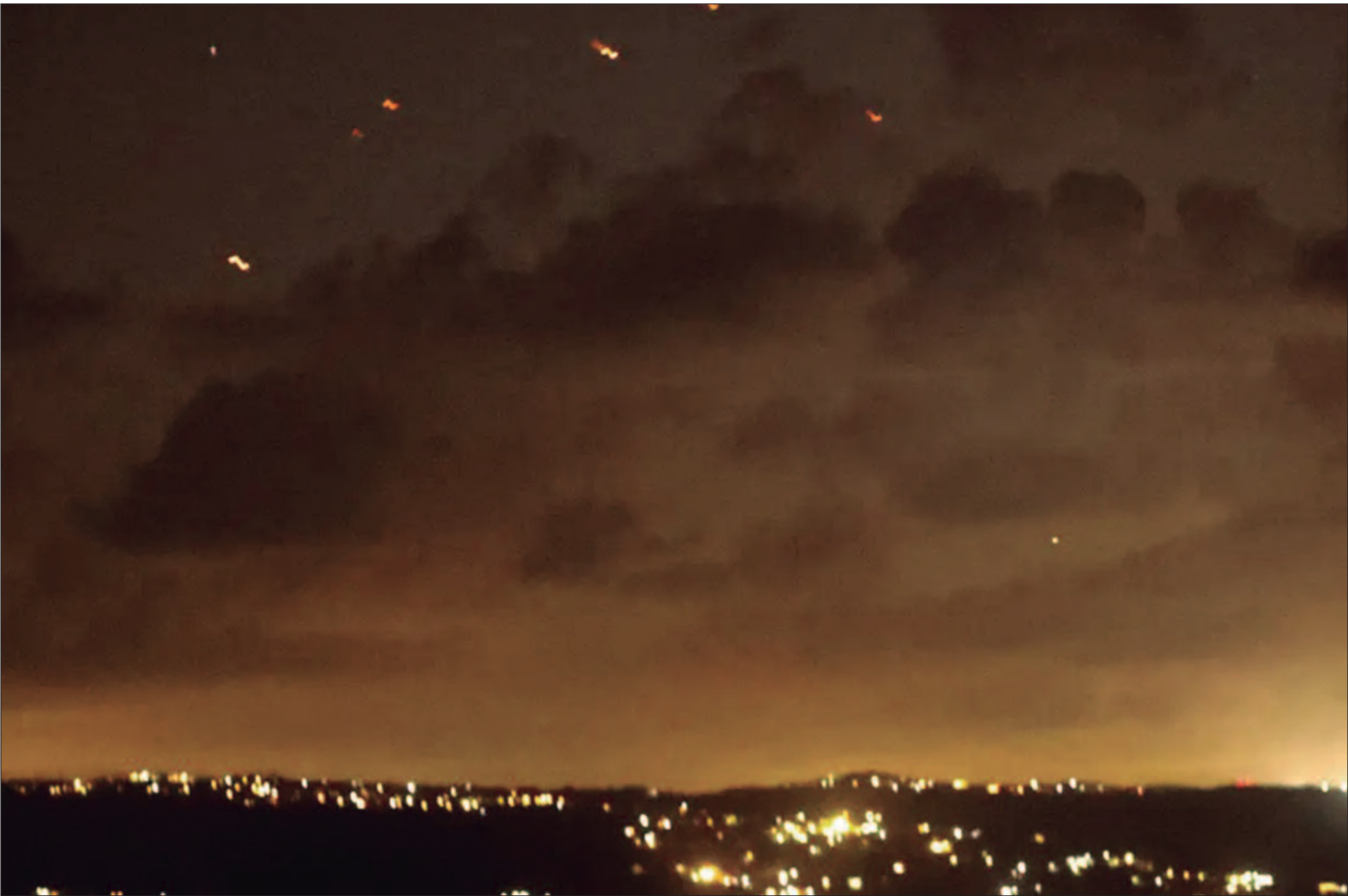
Assessor de segurança nacional dos EUA, Jake Sullivan, condenou nesta terça-feira (1º) o ataque com mísseis balísticos do Irã contra Israel como uma escalada significativa