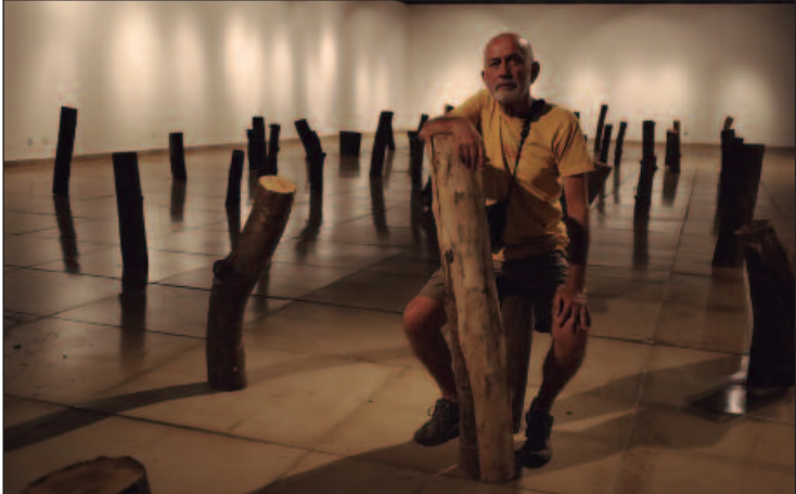
Instalação com elementos simbólicos que remetem à destruição ambiental faz manifesto contundente em defesa do meio ambiente

Associação das Mulheres Mastectomizadas, das 10h às 22h, com entrada gratuita. A inspiração, ‘Caminhos para a conscientização sobre o câncer’, é retratada em 13 telas com imagens capturadas por Danilo Facchini. O objetivo é sensibilizar a população em geral sobre a relevância das medidas preventivas e ações para garantir acesso adequado aos exames decisivos no diagnóstico precoce da doença. Quando: até 15 de outubro. Onde: Av. Dep. Jamel Cecílio, Nº 3300, Jardim Goiás – Goiânia. Horário: 10h. Entrada gratuita.