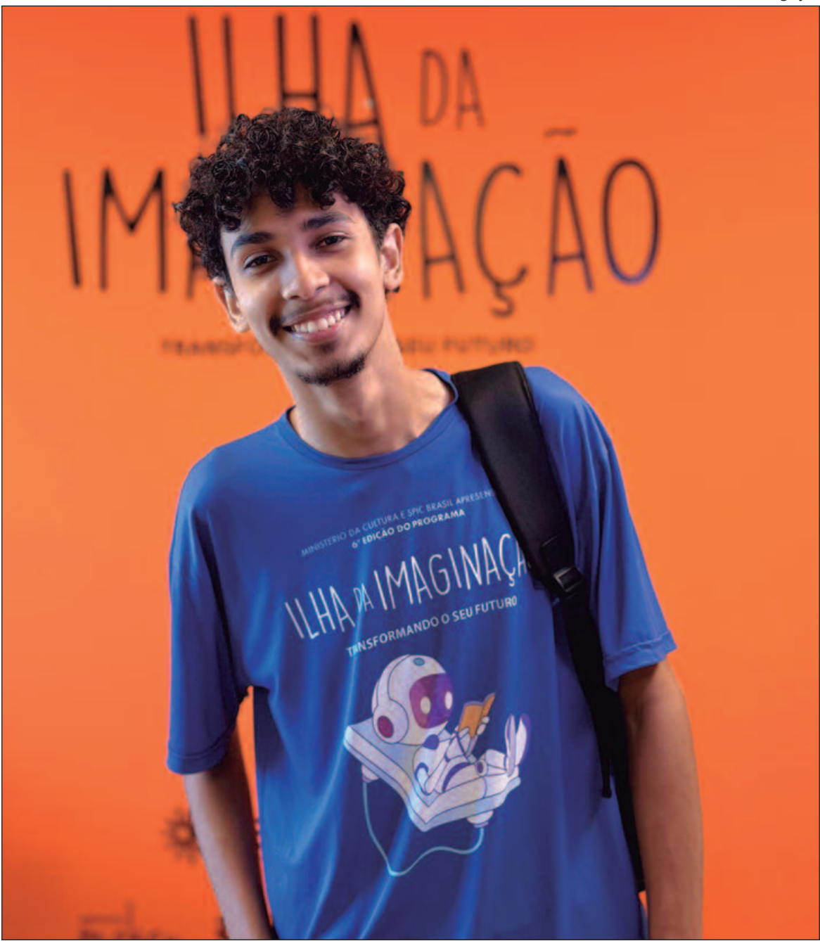
As animações feitas pelos estudantes têm conquistado diversos prêmios e indicações, solidificando este projeto como um verdadeiro espaço de criatividade e talento