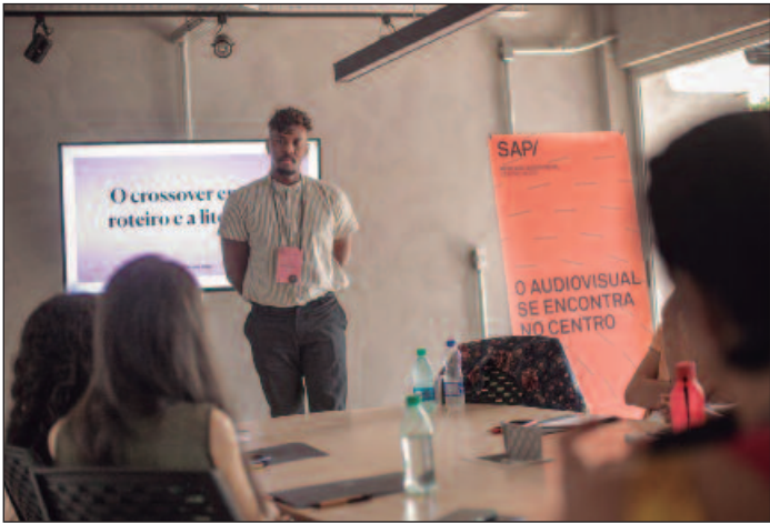
Programa se estabelece como um espaço relevante de aprendizado, negócios e networking no cenário audiovisual