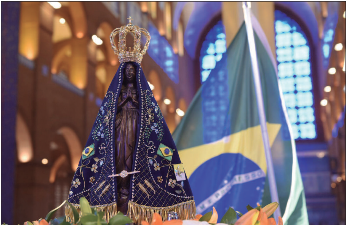
Por causa desta data, muitos fiéis participam de atividades específicas destinadas à devoção da santa