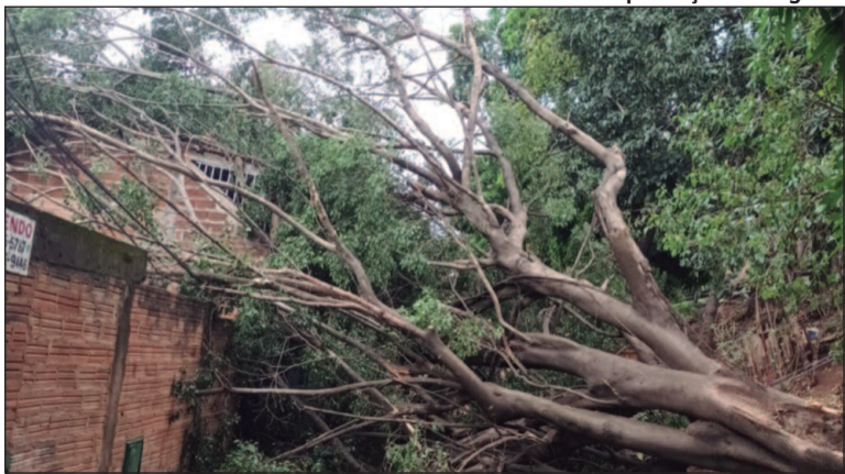
Uma das árvores caiu na Vila Bandeirantes em cima de um muro

A chuva também provocou diversos transtornos no trânsito, deixando o trânsito com lentidão e filas de grandes proporções, como na Av.136, T-9, Rua 90 no setor Sul. Além de muitos motoristas terem re-