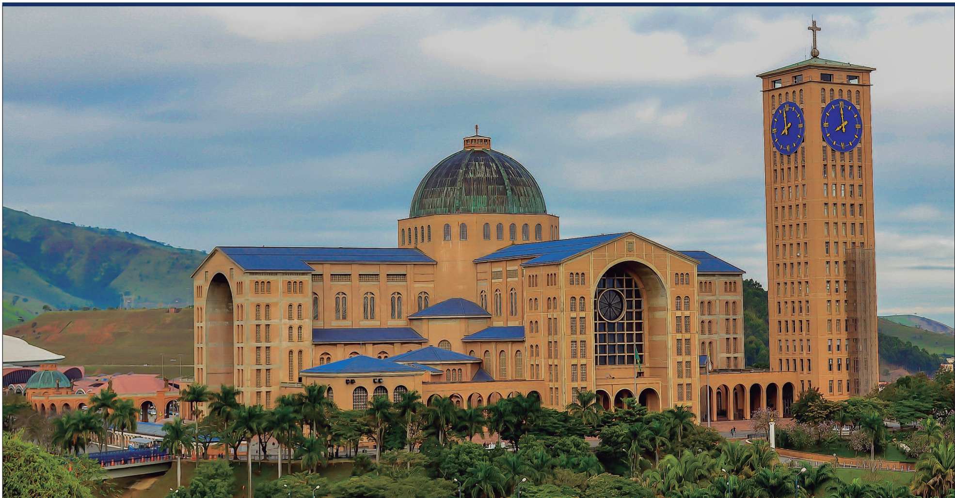
Imagem icônica de Nossa Senhora Aparecida fica na Catedral Basílica Santuário Nacional de Nossa Senhora Aparecida