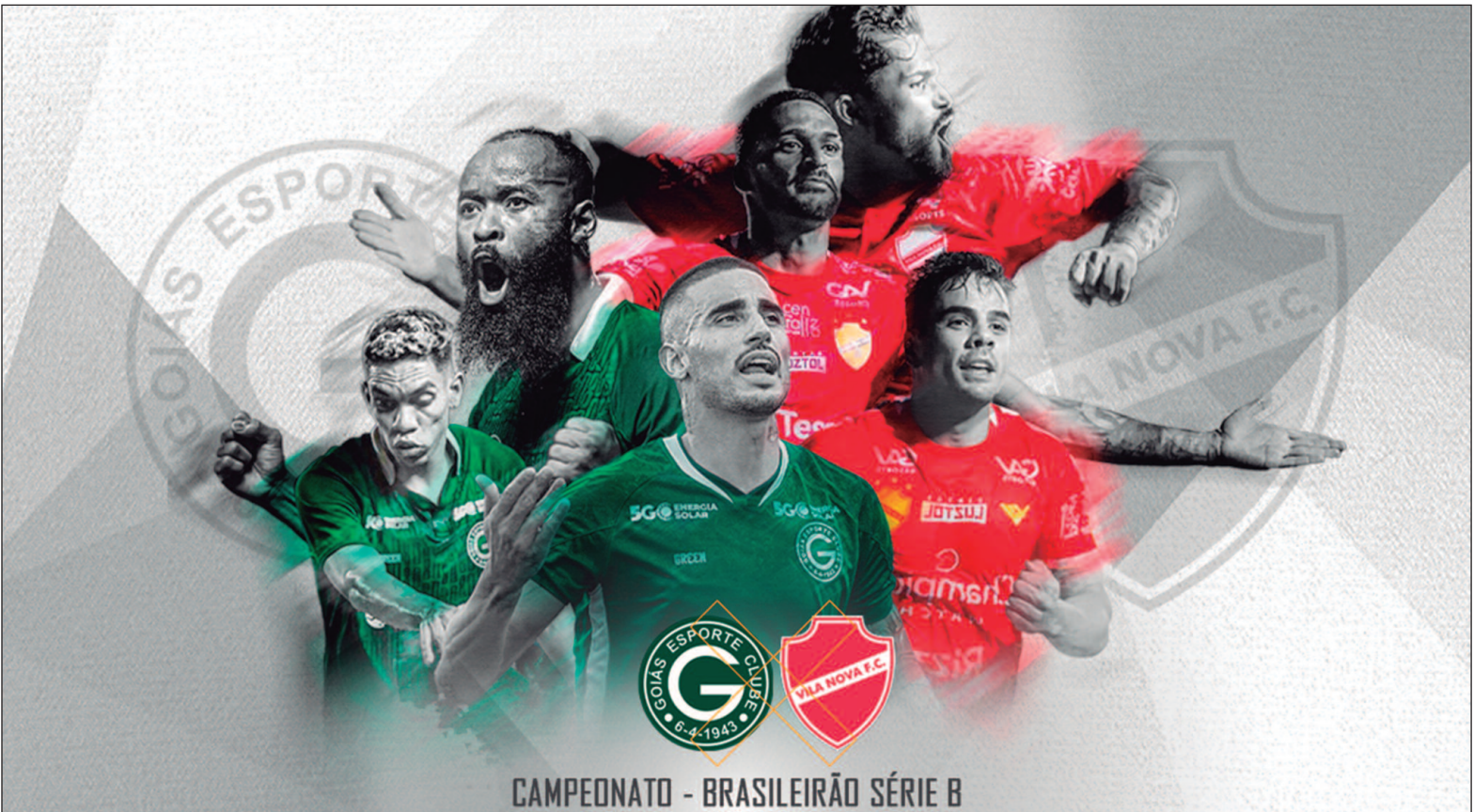
A partida carrega um peso para ambos os lados, já que as duas equipes ainda sonham com o acesso à elite do futebol brasileiro

Com uma campanha de altos e baixos, o Goiás tem mostrado força em momentos decisivos e conta com o apoio de sua torcida, que promete lotar a Serrinha. A expectativa