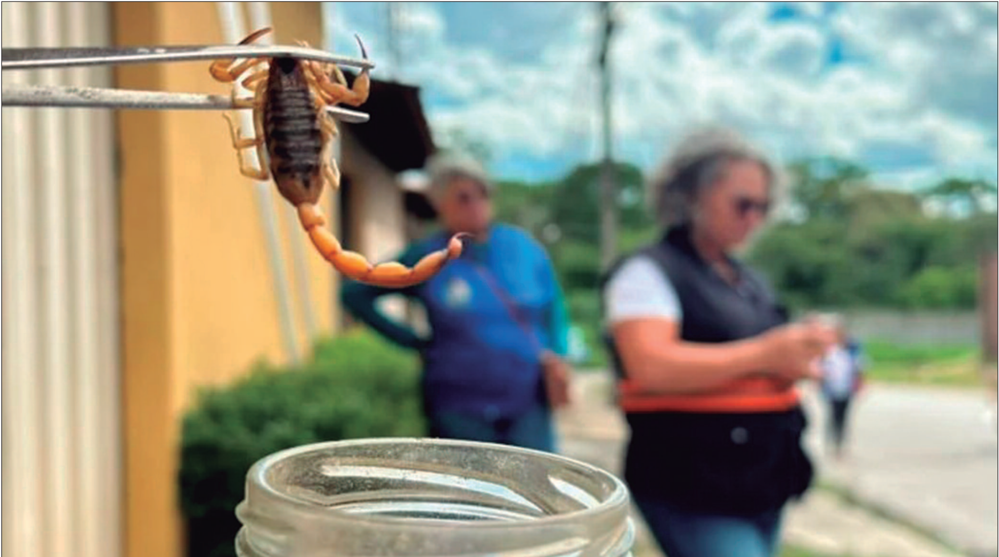
Os escorpiões se destacam como a principal causa de acidentes, com 4.591 ocorrências