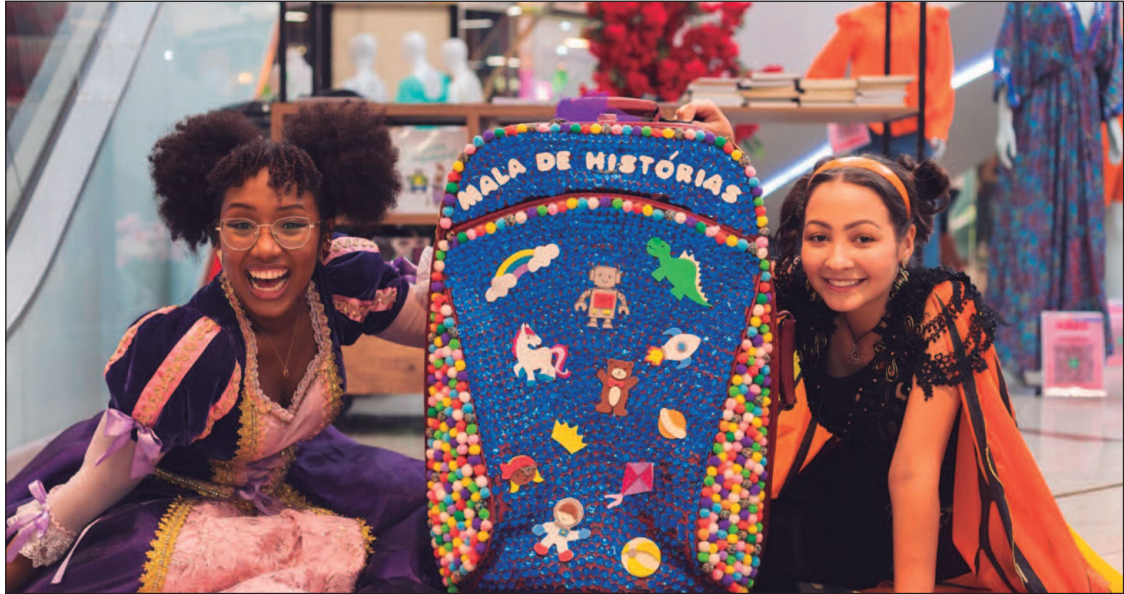
Criada em 2019, a Mala de Histórias fez mais de 80 ações culturais, beneficiando 2,5 mil crianças

No dia das Crianças (12), ações culturais ocorrerão no Araguaia Shopping e Mega