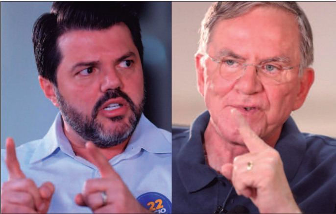
Anápolis é considerado um reduto bolsonarista no Estado