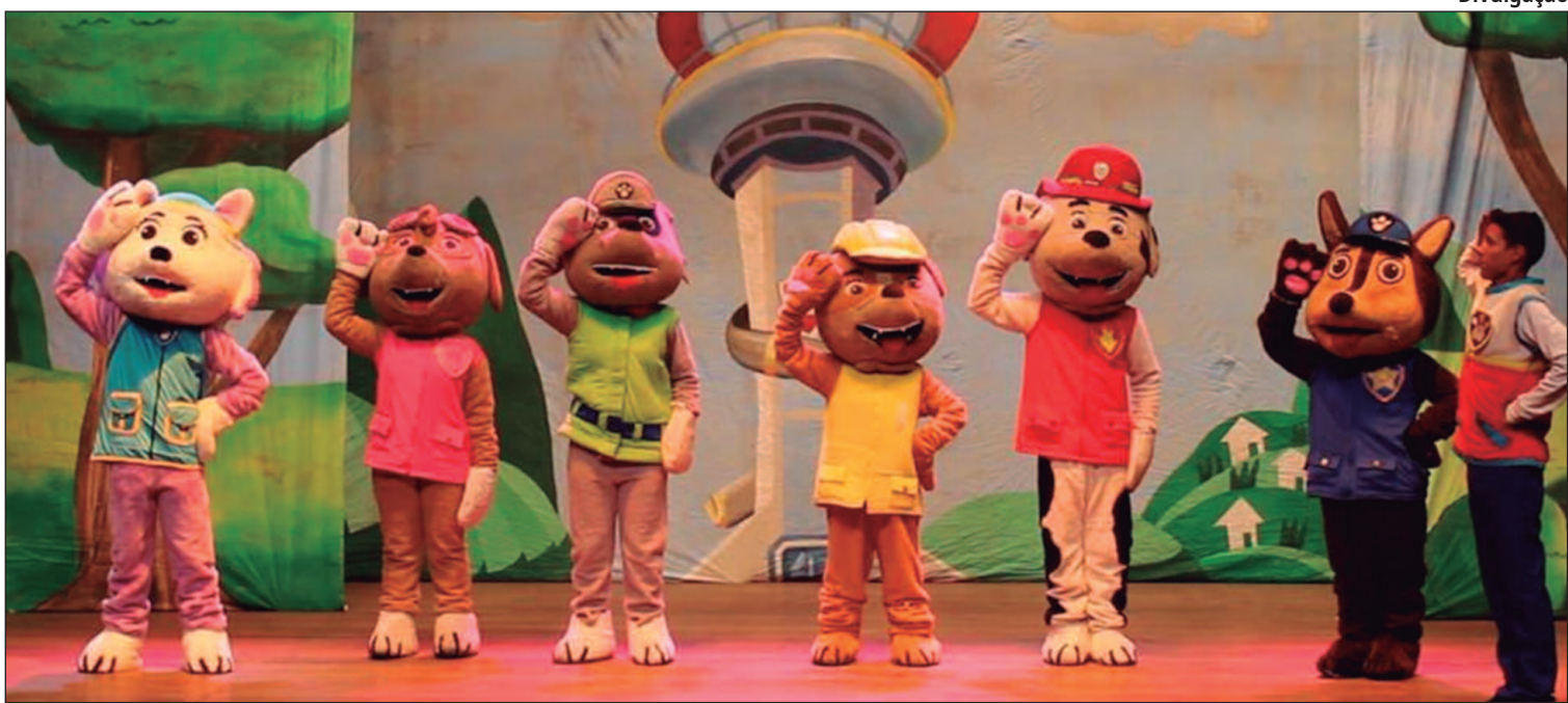
Espectáculo conta com personagens inéditos e novos episódios do show infantil da turma de cachorrinhos mais amada do Brasil

O Teatro Madre Esperança Garrido recebe neste sábado (12) o novo espetáculo ao vivo da ‘Patrulha Canina’. Serão duas sessões, às 15h e outra às 17h, com personagens inéditos e novos episódios do show infantil da turma de cachorrinhos (liderados pelo menino Ryder) mais amada do Brasil. Os ingressos podem ser adquiridos no site (ingressosa.com), além de fisicamente na Komiketo Sanduicheria (Av. T-4) e na Bilheteria do Teatro. Quando: Sábado (12). Onde: Av. Contorno, Nº 241, St. Central – Goiânia. Horário: 15h e 17h. Ingressos: (ingressosa.com).