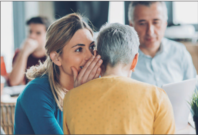
Pesquisas afirmam que fofocar pode ser saudável