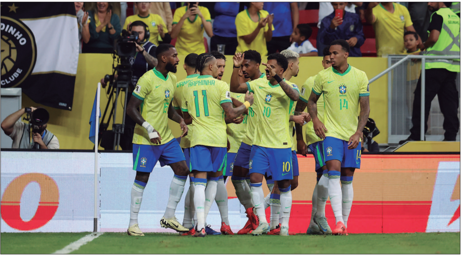
Esta foi a sexta vitória de Dorival Júnior no comando da seleção brasileira

clamou de pênalti após um possível toque de mão de Zambrano. O VAR chamou o árbitro para revisar o lance e a penalidade foi marcada. Sendo assim, aos 37 minutos, Raphinha cobrou o pênalti deslocando Gallese para abrir o placar para a seleção brasileira, que foi para o intervalo com a vantagem no marcador.