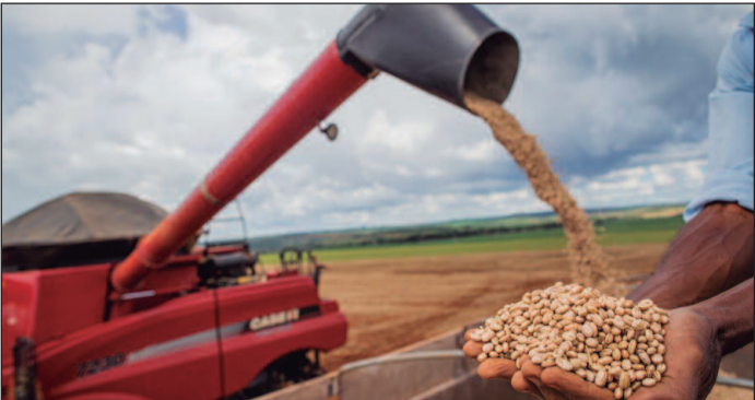
Conab projeta uma recuperação de 3,5% na safra de milho para o período de 2024/25