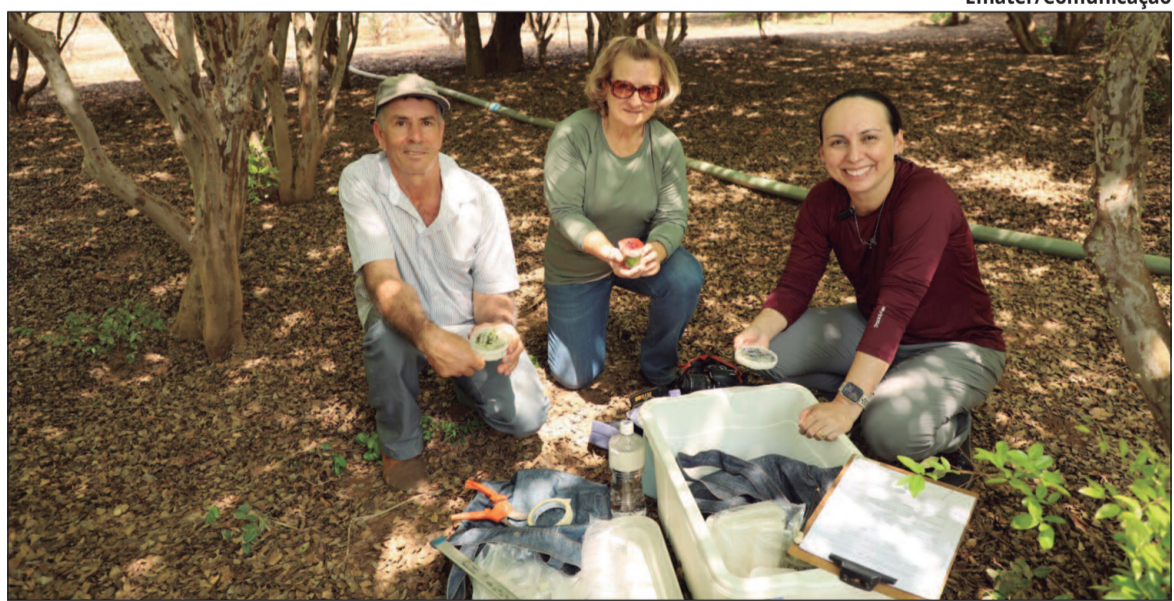
Hidrolândia possui 128 pomares cadastrados, com até 42 mil pés de jabuticaba por propriedade

Estamos na safra das jabuticabas, uma época aguardada em Hidrolândia, maior produtora mundial da fruta. Pesquisadores da Emater Goiás, em parceria com a Universidade Estadual de Goiás (UEG), intensificam a coleta de material genético de jabuticabeiras na região. O objetivo é identificar geneticamente as diferentes espécies, que são a principal fonte de renda do município, além de fornecer suporte técnico e científico aos produtores. Hidrolândia se consolidou como o maior produtor de jabuticaba do mundo, e a Emater Goiás desempenha um papel fundamental nesse processo, oferecendo assistência técnica conforme a demanda dos agricultores. Desde 2021, a agência realiza pesquisas voltadas à jabuticaba, com o intuito de fortalecer a cadeia produtiva e proporcionar aos agricultores práticas que melhorem a qualidade do cultivo e garantam a sustentabilidade econômica.