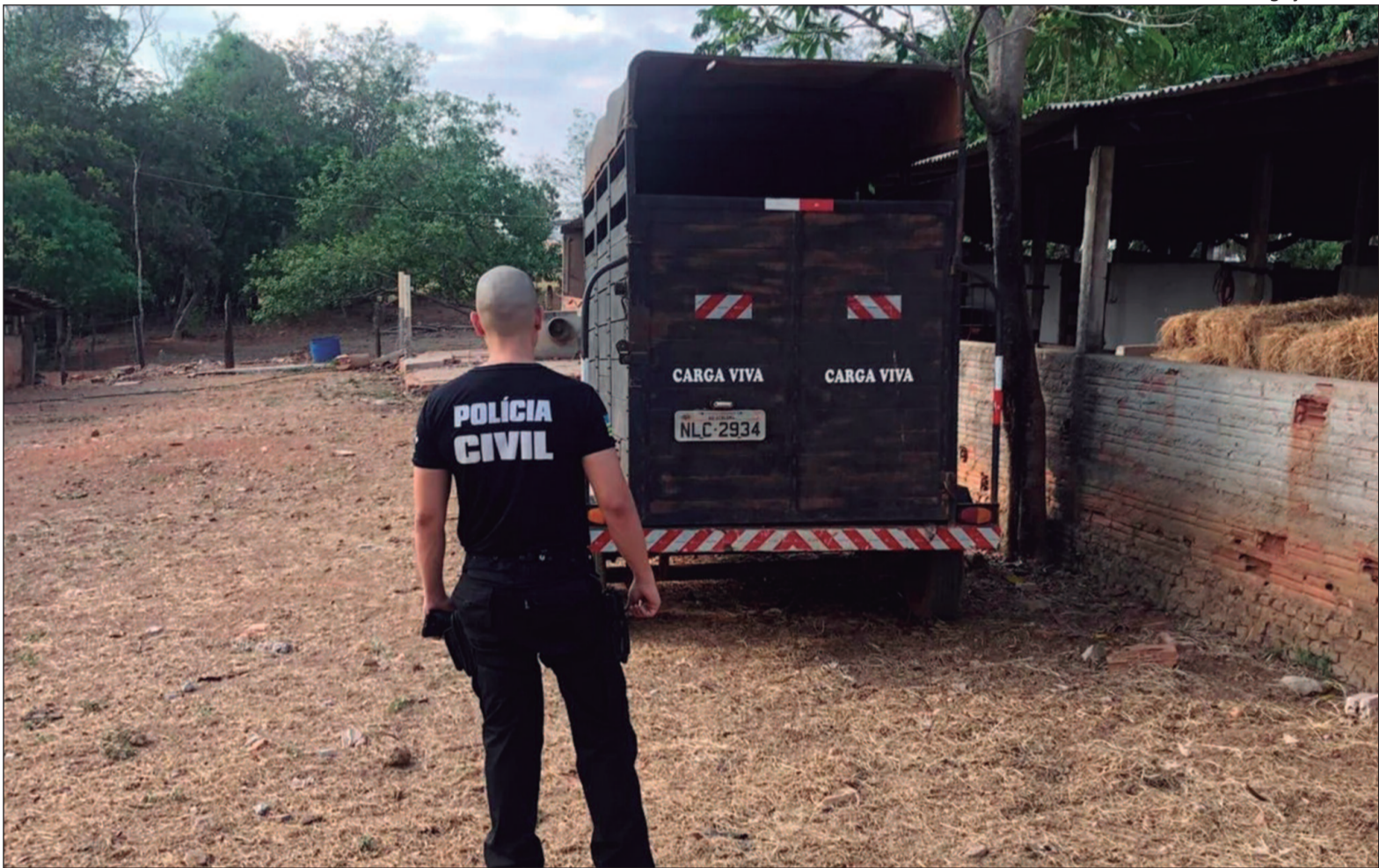
Os dados divulgados são provenientes do Sistema RAI e foram analisados pelo Observatório de Segurança Pública

Os indicadores criminais demonstram uma redução ex-