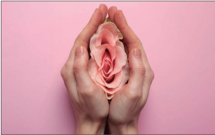
Cada mulher tem necessidades únicas na menopausa e o acompanhamento médico é fundamental para transição saudável

pode aliviar significativamente os sintomas da menopausa. No entanto, é fundamental avaliar se há contraindicações antes de iniciar o tratamento. Alternativas, como antidepressivos e terapias complementares, também podem ser eficazes”, explica a