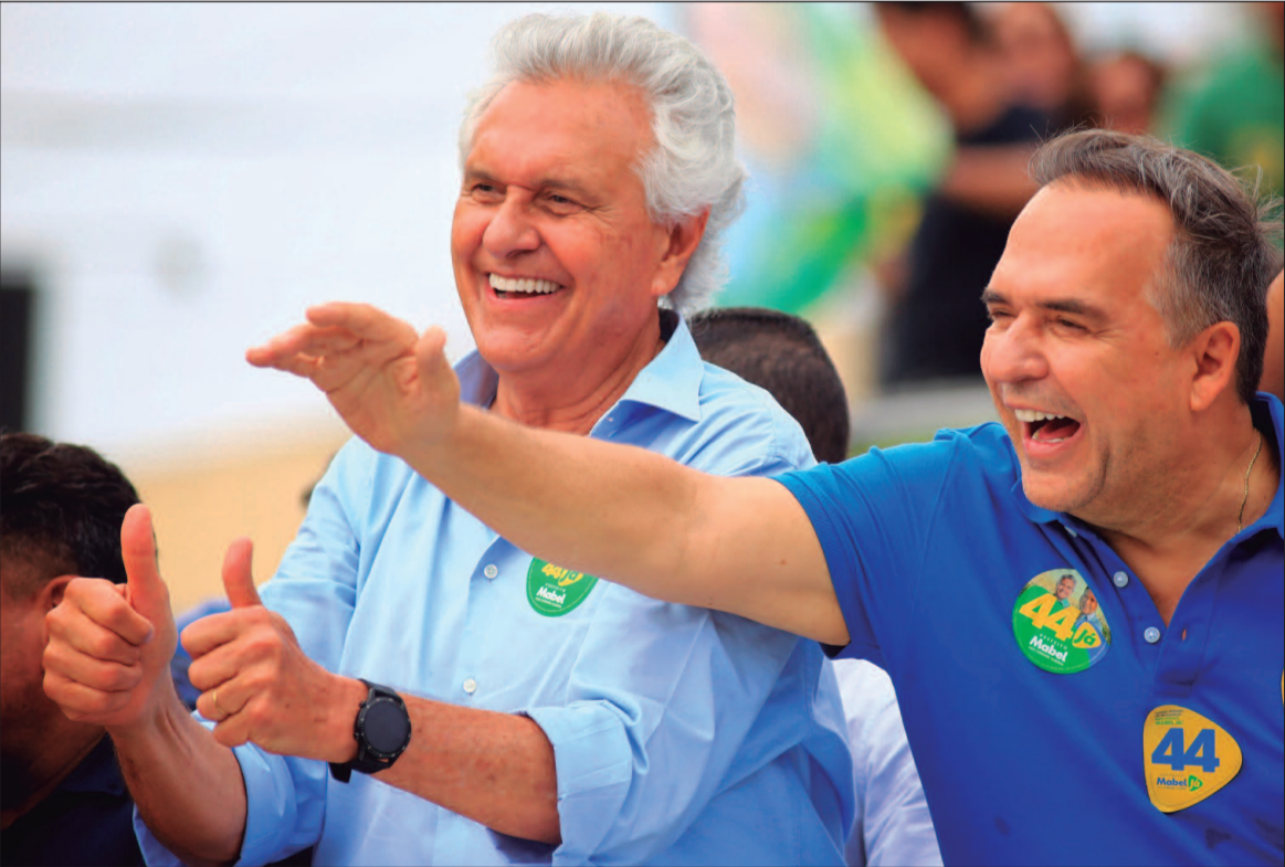
A disputa do segundo turno pela Prefeitura de Goiânia é considerada “tranquila”