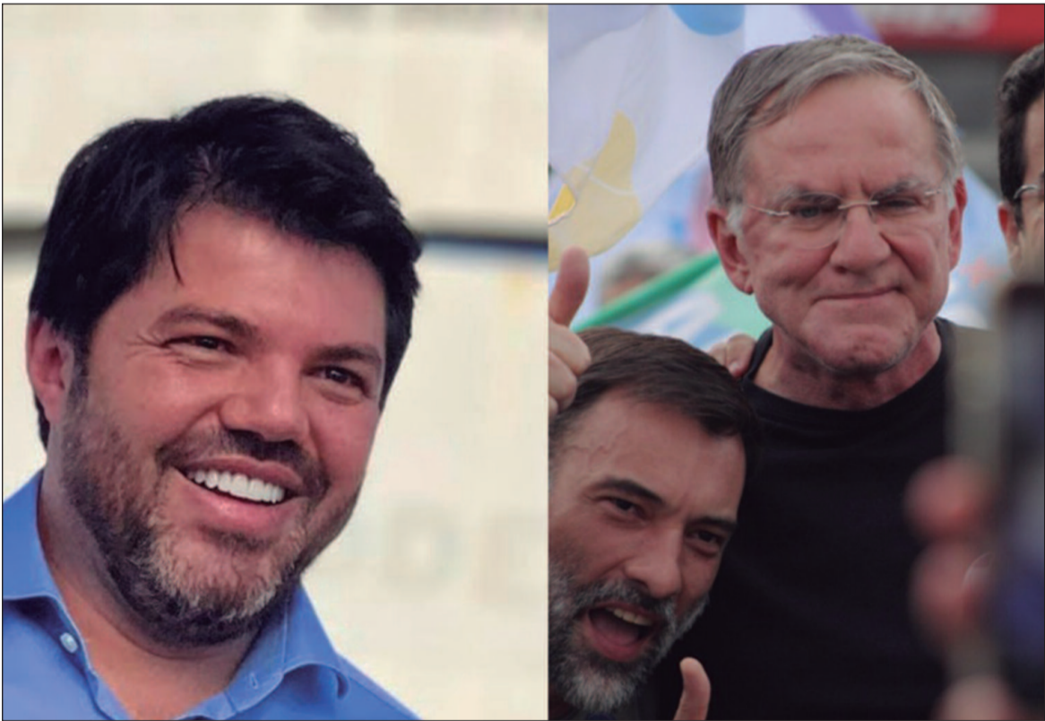
O cenário da disputa eleitoral por Anápolis aponta para a consolidação da virada de Márcio Corrêa

no vai ou não vai, já que naquele ano sua candidatura não era certa. Perto das convenções partidárias sua candidatura foi confirmada e logo o petista despontou na frente. O principal rival de Gomide naquela eleição seria o atual prefeito Roberto Naves (PP). Gomide desfrutava de uma popularidade inegável na cidade, devido ao seu histórico político muito bem avaliado na cidade. O deputado estadual abriu boa vantagem nas pesquisas eleitorais da época, chegando a 20 pontos percentuais de diferença a Naves, mas que foi derretendo aos poucos. A principal pedra no sapato de Gomide é a onda conservadora que se instaurou no eleitorado anapolino. Em 2020, Naves se recuperou ainda no primeiro turno e chegou perto da reeleição. A disputa foi para o segundo turno e o atual prefeito foi reeleito com pouco mais de 61% dos votos. Gomide, que chegou a ser o favorito nas eleições daquele ano, ficou a mais de 20 pontos percentuais atrás na disputa. 2024 O cenário da corrida eleitoral anapolina deste ano se