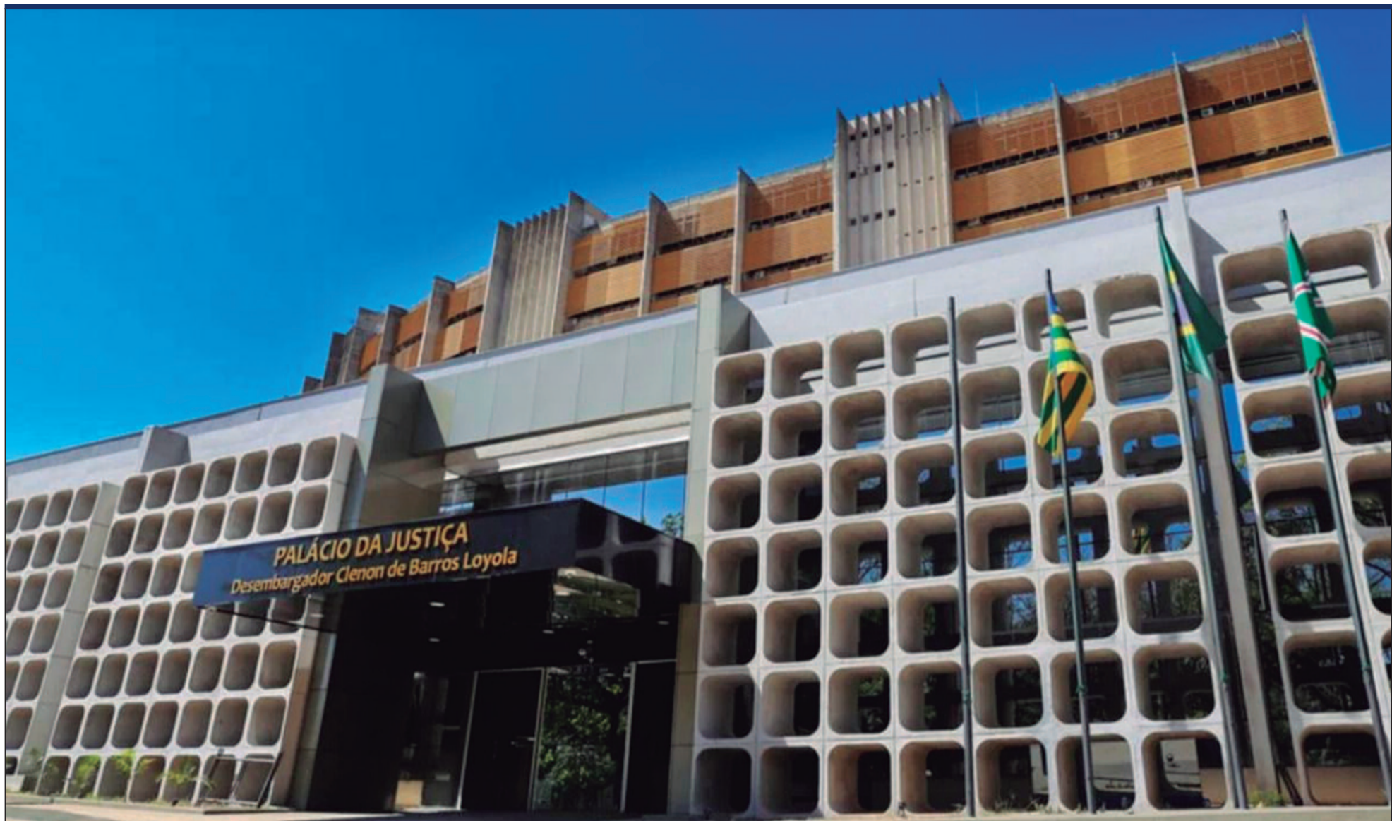
O prejuízo estimado ultrapassa R$ 20 milhões, mas acredita-se que esse valor possa ser ainda maior Comunicação/TJ-GO