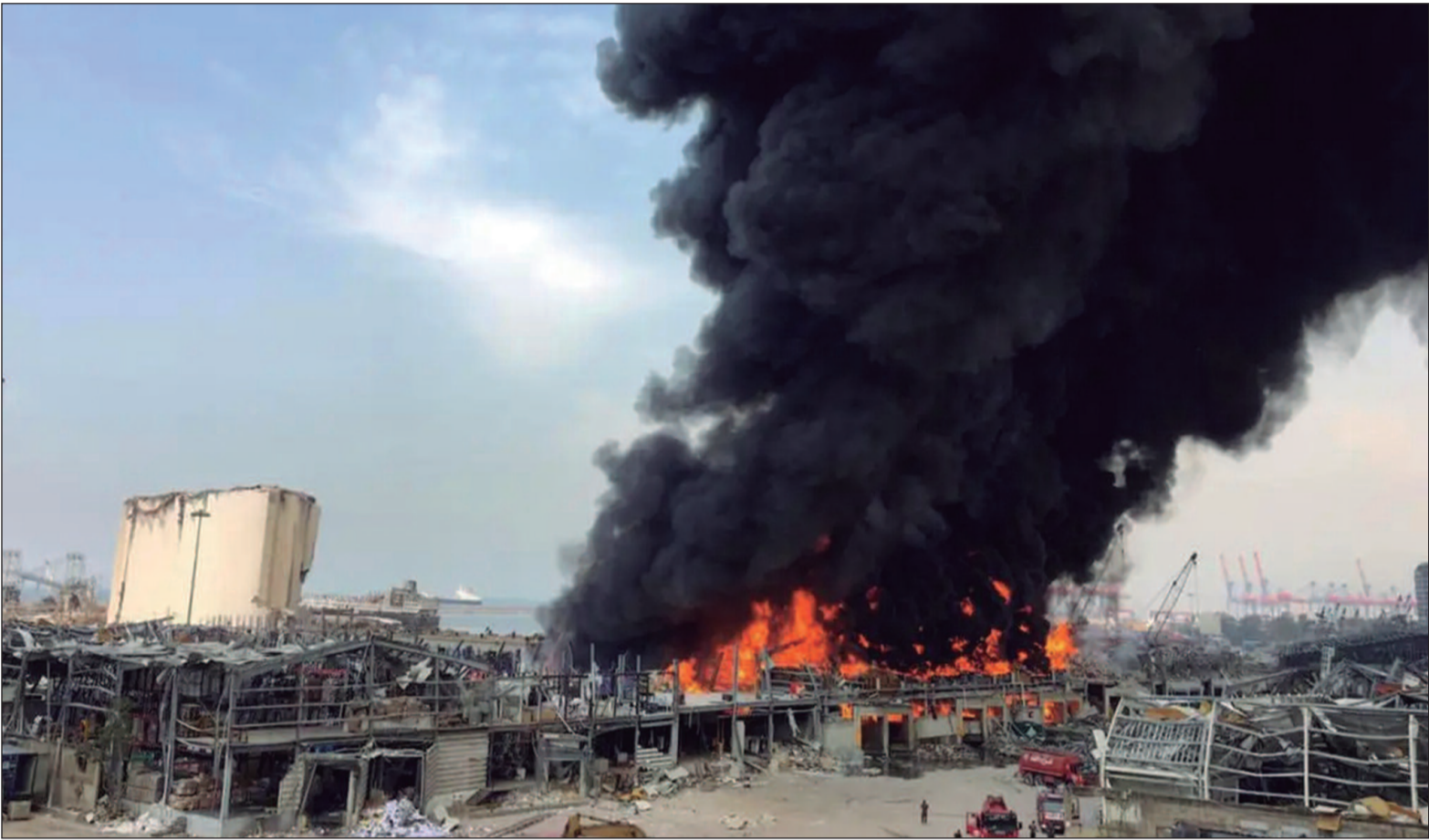
A maioria foi morta desde o final de setembro, quando Israel expandiu sua campanha militar

Israel diz que sua operação no Líbano visa garantir o retorno de dezenas de milhares de moradores forçados a fugir de suas casas no norte de Israel, devido aos ataques do