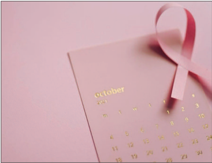
Em 2020, foram estimados 2,3 milhões de novos casos de câncer de mama em todo o mundo