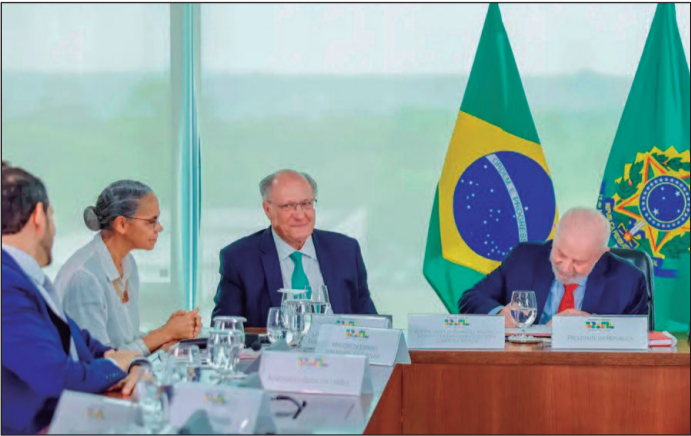
Proposta tem pedido de urgência constitucional