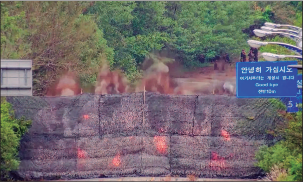
Na semana passada, a Coreia do Norte anunciou que estava aumentando a segurança em estradas