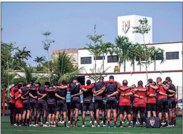
Atlético Goianiense e Cuiabá estão na zona de rebaixamento do Campeonato Brasileiro