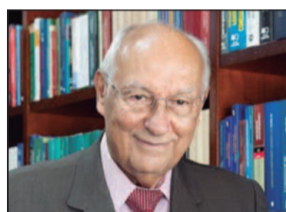
Ives Gandra Martins é professor emérito, honorário e doutor honoris causa de diversas universidades

A meu ver, ou ele volta a ser o pragmático dos dois primeiros mandatos, governando para o país e não para o PT, ou creio que os futuros resultados eleitorais serão ainda piores que os atuais.