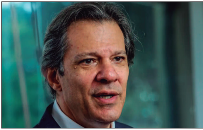
Ministro afirma que medidas irão manter o novo marco fiscal