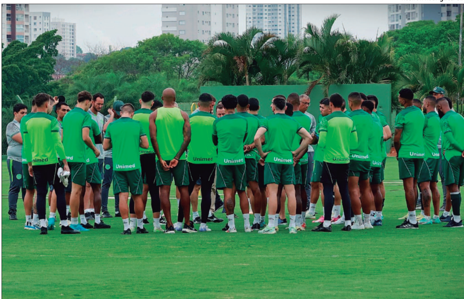
O Goiás já começou a se preparar para 2025 com o objetivo de não cometer os mesmos erros desta temporada