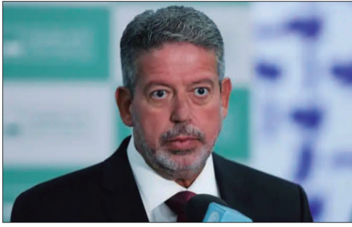
Deputado alagoano quer reunir apoio para sucessor na Câmara