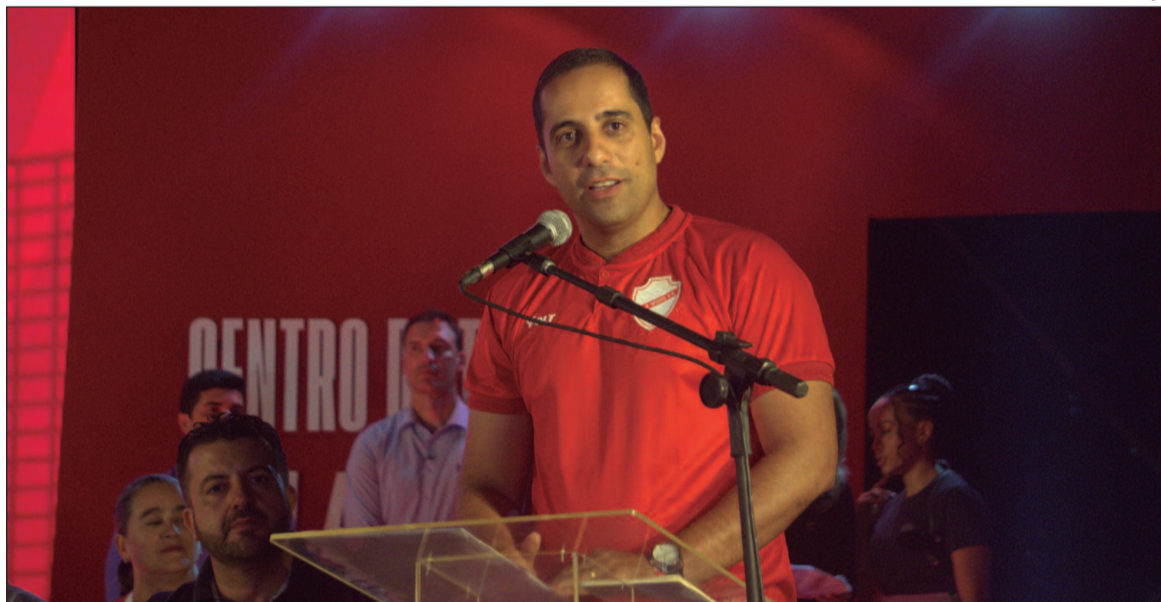
Desde que assumiu o Vila Nova, o presidente teve como seu principal objetivo quitar todas as dívidas