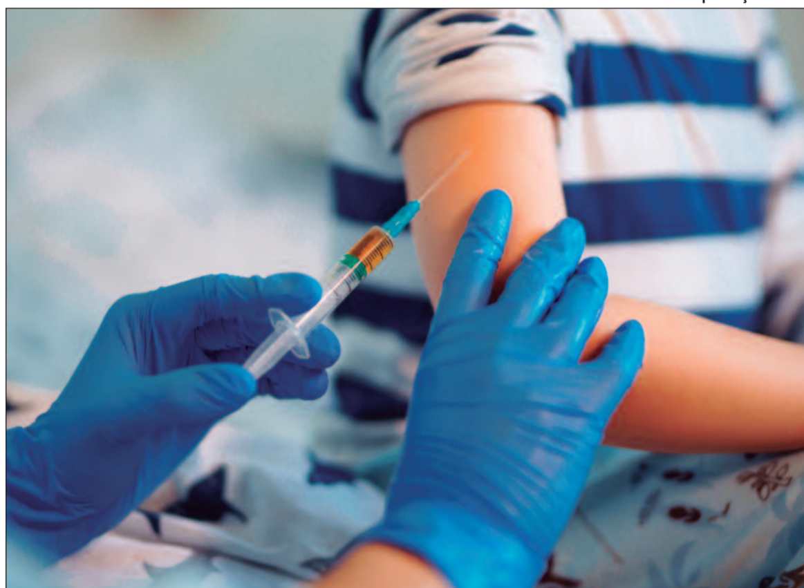
A partir do século XX, as doenças respiratórias se tornaram a principal causa de morte infantil

O vírus sincicial respiratório (VSR) é um dos principais causadores de infecções respiratórias em recém-nascidos e crianças pequenas. A ocorrência de casos tende a aumentar durante o outono e o inverno,