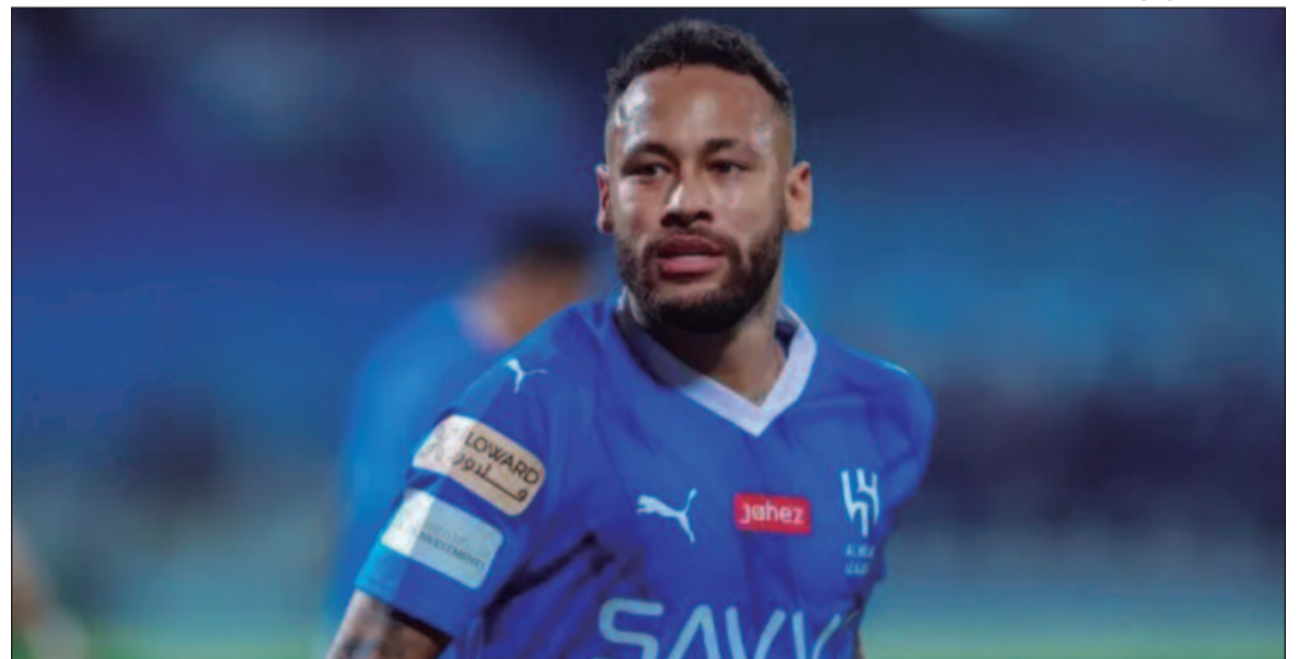
O camisa 10 quase marcou no seu primeiro lance em campo durante uma partida do futebol árabe