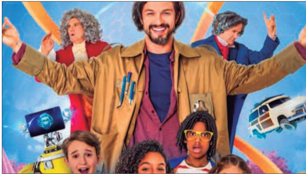
'Perfekta' conta a história dos novos amigos gênios: Isa, Tom e Linus. Para salvar a memória do robô Einstein, eles precisam da ajuda de um cientista misterioso que vive no Laboratório Perfekta

O Aprendiz (The Apprentice, 2024, Canadá) Duração: 2h. Direção: Ali Abbasi. Elenco: Sebastian Stan, Jeremy Strong, Maria Bakalova. Gênero: Drama. Cinemark Flamboyant: 16h20, 19h, 21h45. Kinoplex Goiânia: 18h40, 21h10. Cinex Oscar Niemeyer: 21h30. Moviecom Buriti: 19h15, 21h40. Super/Man: A história de Christopher Reeve (Super/Man: The Christopher Reeve Story, 2024, EUA) Duração: 1h 44min. Direção: Ian Bonhôte. Elenco: Christopher Reeve, Johnny Carson, Glenn Close. Gênero: Documentário. Cinemark Flam-