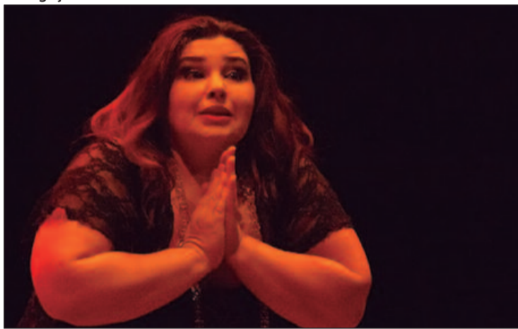
Projeto destaca a importância do espaço escolar como ambiente propício para o debate e a conscientização sobre temas sensíveis

cias diárias vividas por pessoas que estão fora do padrão corporal estabelecido pela sociedade, como os olhares críticos nas ruas e as frases comuns que, embora disfarçadas de preocupação, carre-