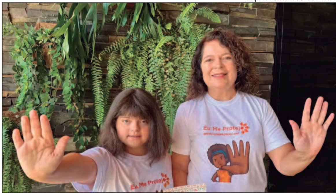
Objetivo é que educadores desenvolvam trabalhos pedagógicos para a melhoria da educação especial

Ao fim do curso, o objetivo é que os educadores desenvolvam trabalhos pedagógicos para a melhoria da educação especial na perspectiva inclusiva para atender às necessidades educacionais especiais de alunos com deficiência, transtornos globais de desen-