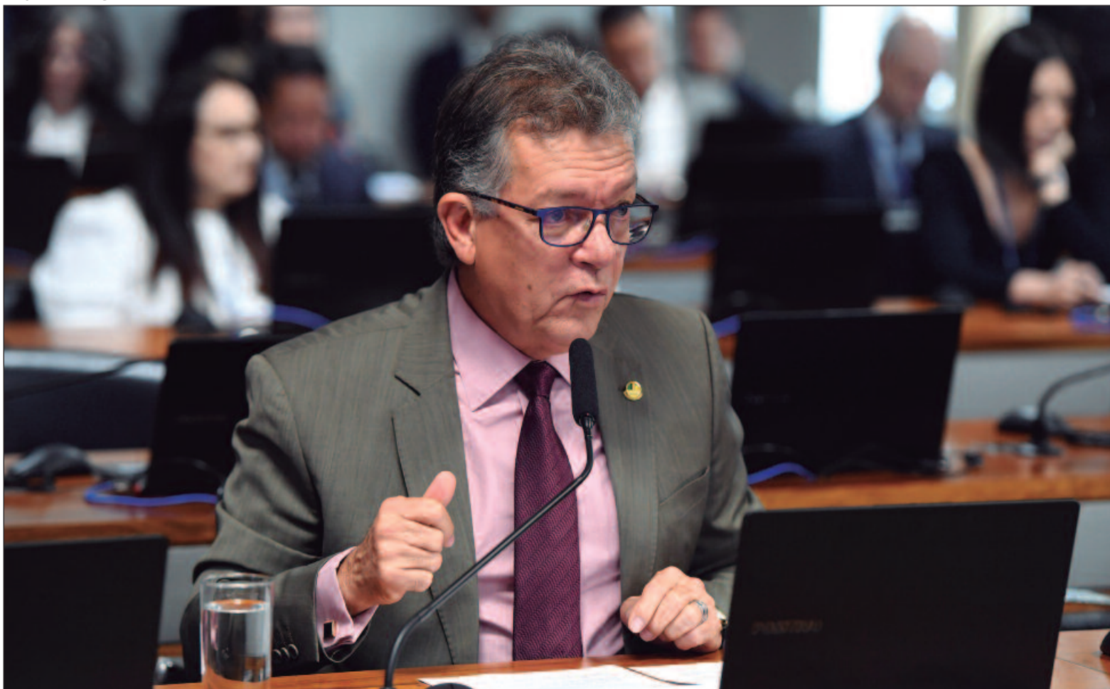
Roque de Sá/Agência Senado

Emendas de relator estendem o alcance do programa à geração de energia nuclear e definem regras para projetos de estímulo ao gás natural. (Agência Senado)