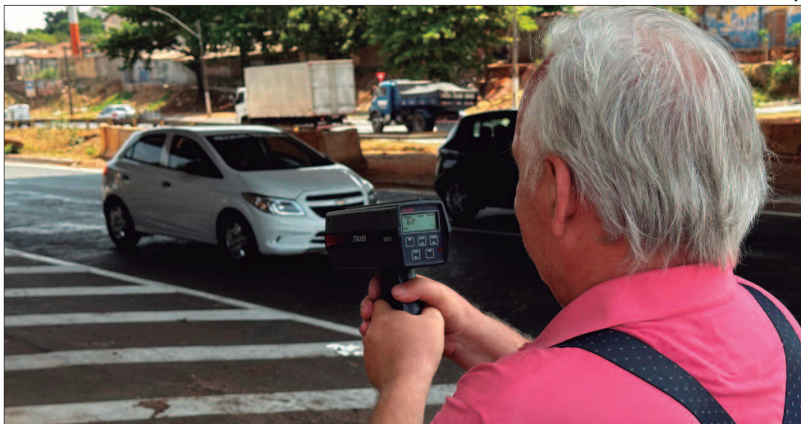
Radar móvel registra alta velocidade de condutores em vias de linha reta e fluxo rápido, como a Marginal Botafogo

A SMM destaca que a ausência dos radares não resulta na total descon sideração das normas de trânsito. “Esclarecemos que há uma licitação em andamento para aquisição de novos equipamentos, onde foram respondidos todos os pedidos de impugnação e segue dentro dos trâmites normais”, declarou a secretária. Além disso, enfatiza que a fiscalização continua ativa com a presença dos agentes, que têm realizado operações te-