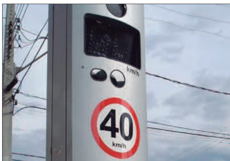
Capital enfrenta crise de segurança no trânsito com a ausência de radares de fiscalização e condutores cometendo infrações

máticas, com outras autuações fora desses temas que ainda podem ocorrer.