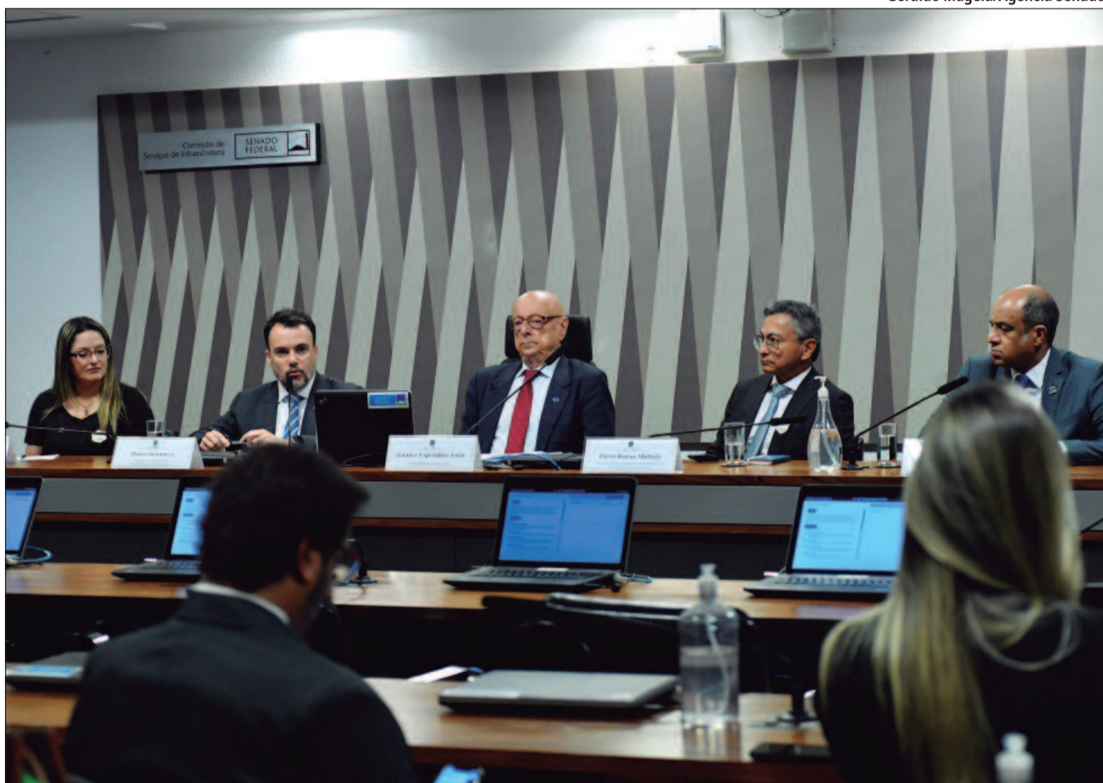
Geraldo Magela/Agência Senado

O objetivo é oferecer garantia em financiamentos de projetos de desenvolvimento sustentável. Pelo texto, são consideradas como “de desenvolvimento sustentável” ações relacionadas à produção energética de matriz sustentável, à pesquisa tecnológica ou ao desenvolvimento de inovações tecnológicas que proporcionem