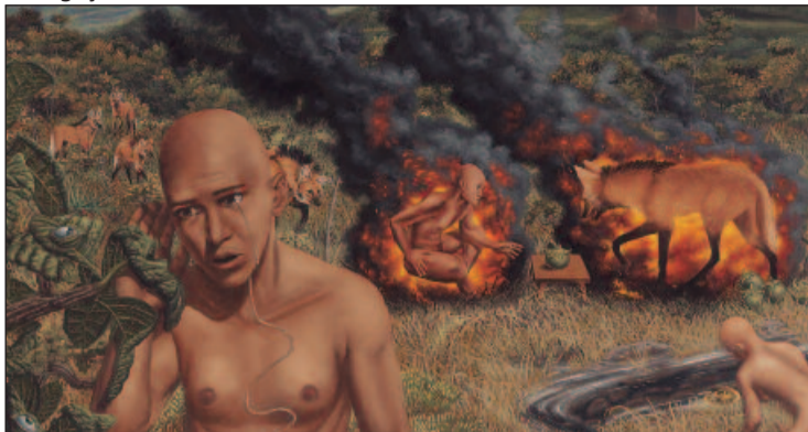
Trabalhos surgiram após imersão na Chapada dos Veadeiros e exploram as complexas relações humanas e o drama ambiental

unidade do Shopping Cerrado, em Goiânia, e se estende a clientes que já têm direito à meia-entrada. Nos dias da promoção, um combo especial composto por pipoca média e bebida média também terá 50% de desconto. A promoção não é válida para áreas especiais como puff e lounge da Sala Júnior, nem em feriados, pré-estreias e conteúdos alternativos. Para mais informações sobre a programação, acesse shoppingcerrado.com.br/cinema. Os ingressos podem ser adquiridos na bilheteria ou online, com taxa de serviço no site. Quando: até 26 de novembro. Onde: