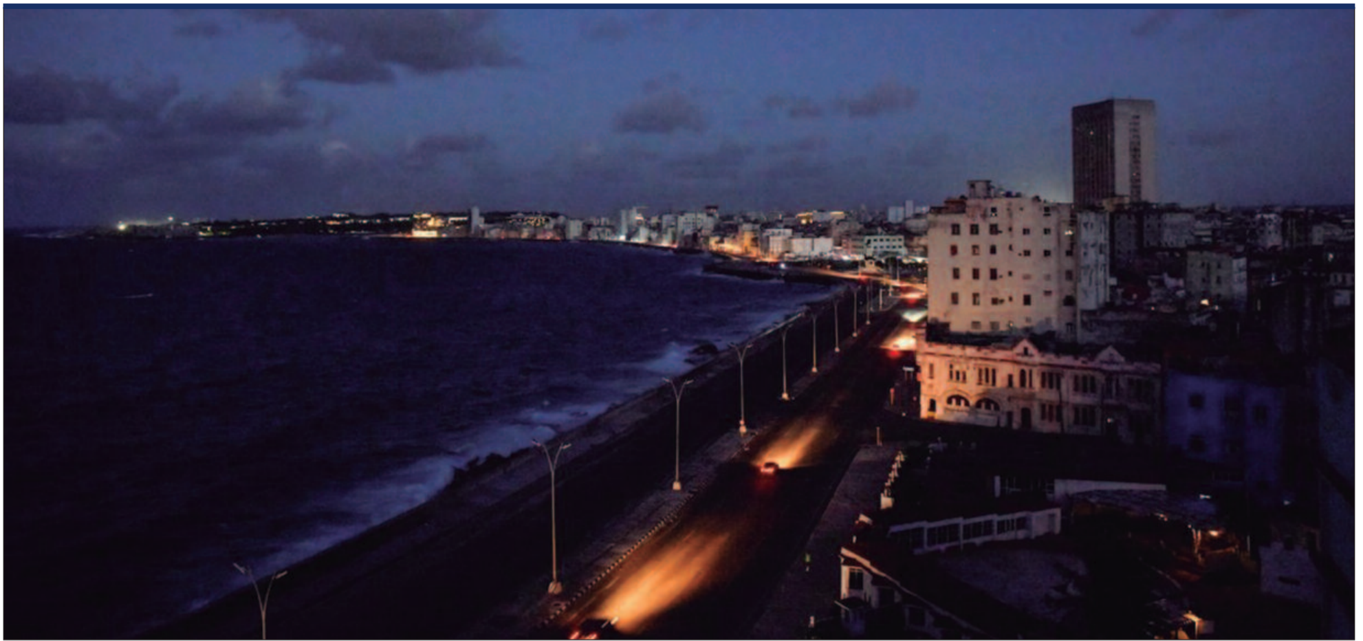
Operadora de Cuba informou ter restaurado a eletricidade em partes da capital Havana nesta segunda-feira (21), após a quarta grande falha na rede em 48 horas