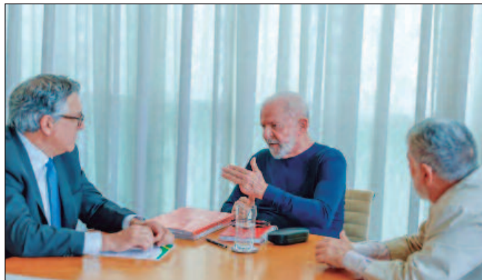
Presidente Lula sofreu o acidente no sábado (19) no Palácio da Alvorada, ao escorregar no banheiro