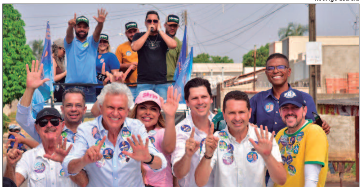
Governador aproveitou agendas de candidatos para mostrar que quer a cabeça de chapa em 2026

Porém, enfrenta desafios no combate à violência contra a mulher. Na educação, Caiado avançou no Ideb, o que fortalece a imagem de gestor eficiente. No campo eleitoral, o chefe do Executivo goiano busca consolidar o União Brasil como uma base forte para