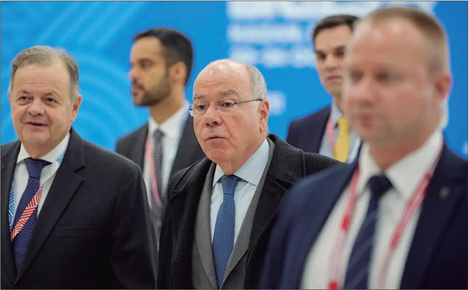
“Foram os países do Sul Global que votaram a favor da resolução da Assembleia Geral da ONU que pede a cessação das hostilidades”

O chefe da diplomacia brasileira acrescentou que não haverá paz sem um Estado palestino independente, solução que vem sendo rejeitada pelo governo de Israel. “A decisão