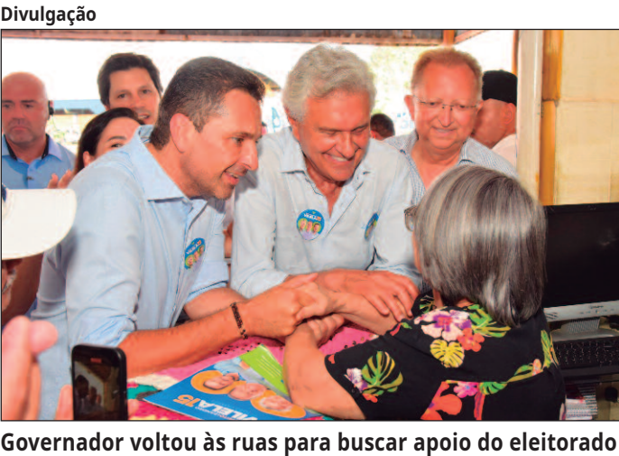
Governador voltou às ruas para buscar apoio do eleitorado