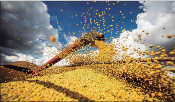
Produtividade da soja teve uma redução devido às intempéries climáticas