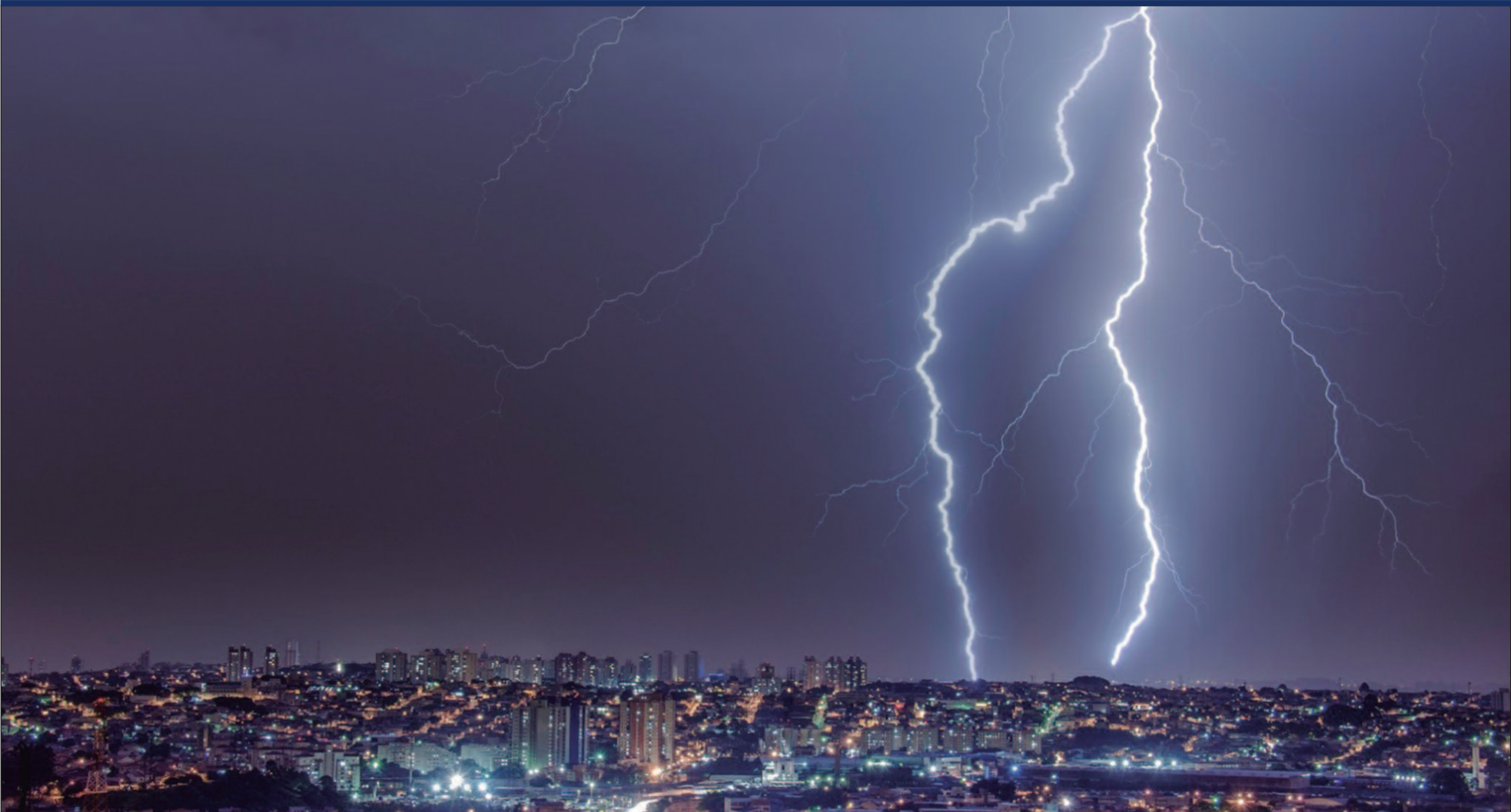
Regiões quentes, como Goiás, criam condições ideais para a formação de tempestades e descargas elétricas