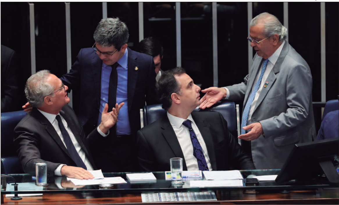
Reforma Tributária é, sem dúvida, um dos assuntos mais importantes do Congresso nos últimos anos

aprovação dos deputados e senadores, outros ainda são vistos como extremamente desafiadores para ambas as Casas. Acontece que desde o início da fase de regulamentação, o texto tem sofrido pressões causadas por interesses regionais e setoriais, gerando resistências. Também pesa para os congressistas o fato da definição e trava da alíquota do IVA dual ainda ser um ponto de discordância entre os partidos políticos. Diante das divergências de ideias, e, consequentemente, da necessidade de consenso para que o texto possa avançar, a leitura é que pode ser difícil encontrar uma via de coalizão em tão pouco tempo. Em outras palavras, para que os prazos sejam cumpridos, alguém vai precisar ceder. E por falar em prazos, os próximos passos já foram apresentados. O relator da regulamentação, senador Eduardo Braga, sugeriu 11 audiências públicas no colegiado e duas sessões temáticas no plenário antes da votação definitiva. Braga diz ter “a ambiciosa meta” de concluir a análise do projeto ainda neste ano. De acordo com senador, a expectativa é “viabilizar a votação da forma mais breve possível, sem açodamen-