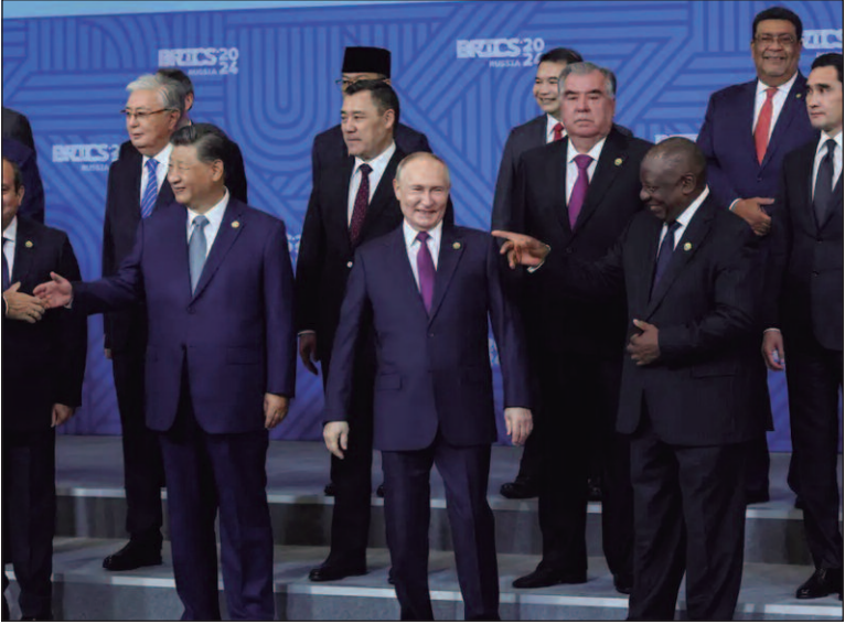
Convidados participarão do bloco como membros associados

“Enviaremos um convite e uma proposta aos futuros países parceiros para participarem do nosso trabalho nessa qualidade [de parceiros associados] e, ao recebermos uma resposta positiva, anunciaremos quem está na lista. Seria simplesmente inapropriado fazer isto agora, antes de recebermos uma resposta, embora todos esses países praticamente tenham feito solicitações uma vez ou