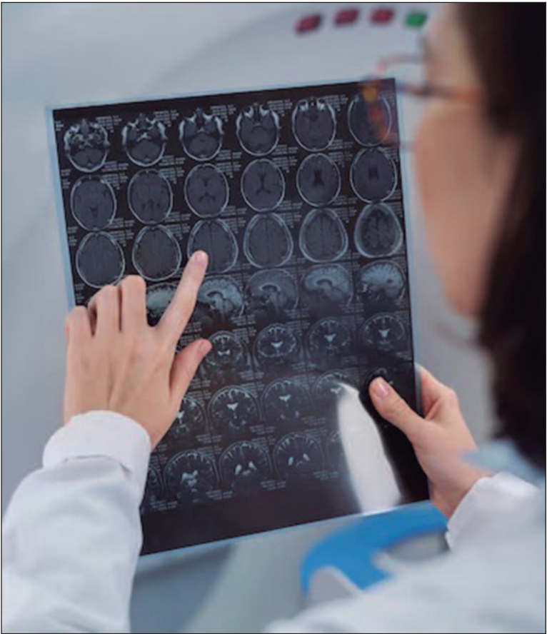
Entre janeiro e agosto de 2024, 39.345 brasileiros faleceram por causa do acidente vascular cerebral