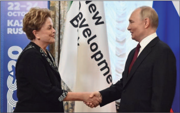
Putin quer estender gestão da presidente Dilma Rousseff