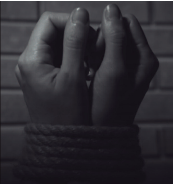
A luta pela igualdade de gênero é complexa e exige uma abordagem multifacetada