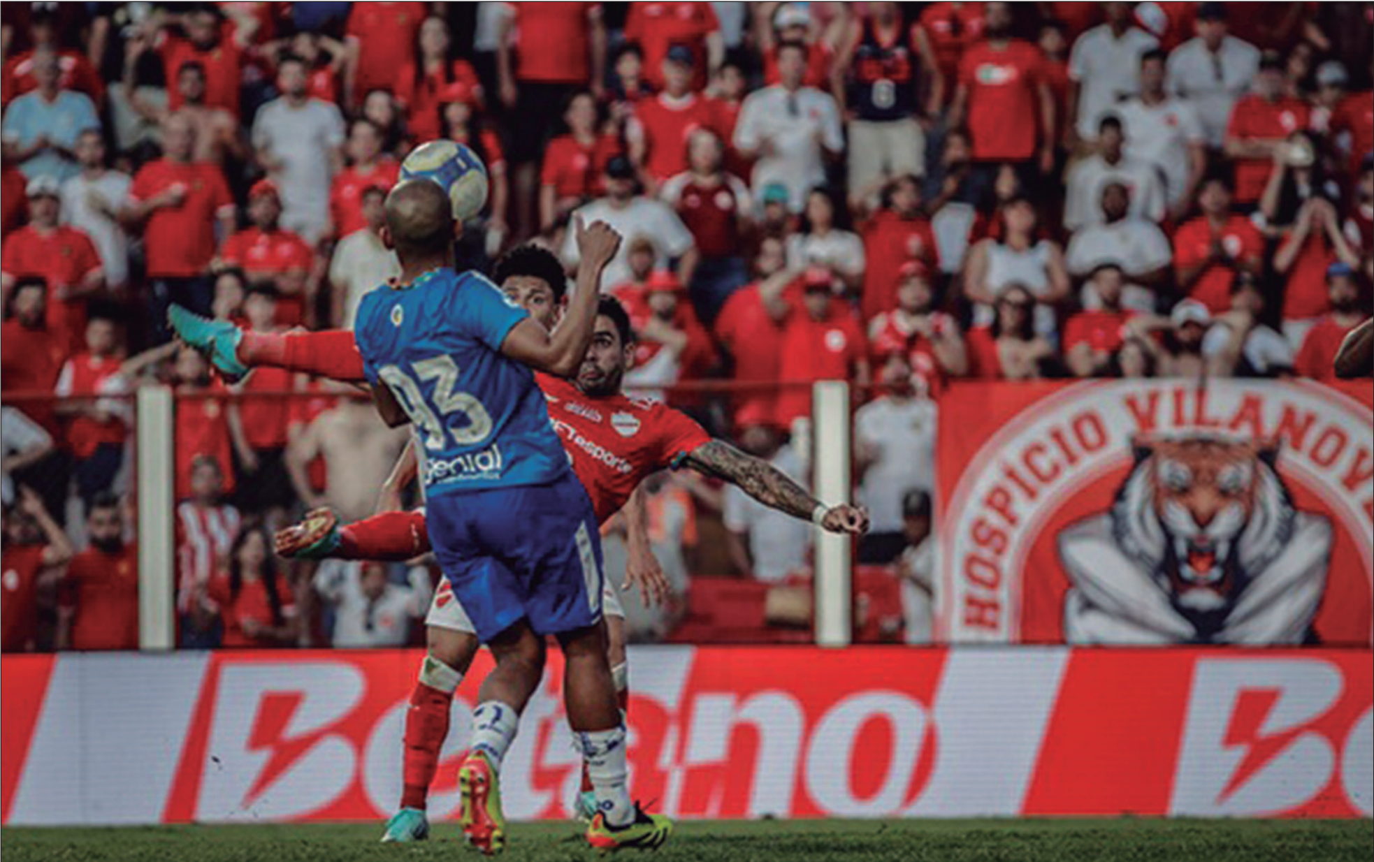
O Avaí chega pressionado após uma sequência negativa na Série B do Campeonato Brasileiro