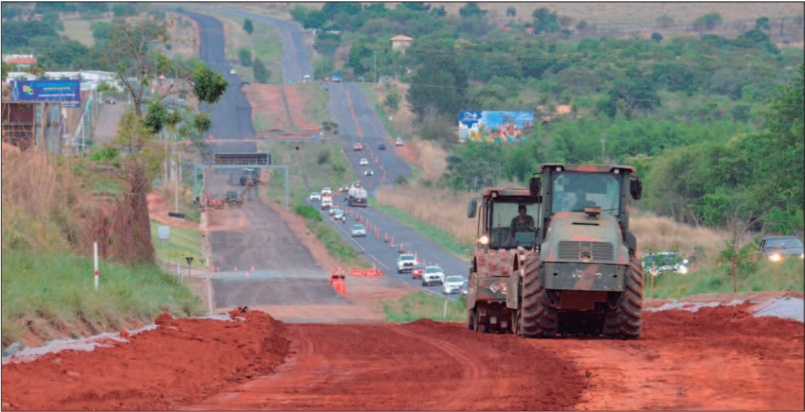
A intenção é que o batalhão possa estender os trabalhos até o município de Rio Quente

“O batalhão está fazendo uma boa condução das obras, dentro da programação estipulada. Ano que vem teremos novo maquinário operando, com equipes ampliadas”, res-