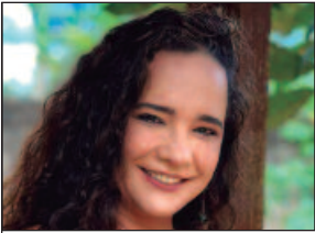
Cíntia Dias é socióloga e presidente do PSOL Goiás