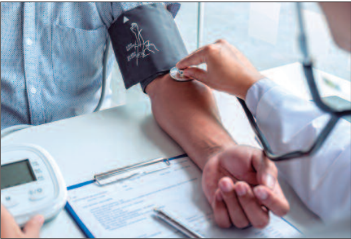
A Secretaria da Saúde de Goiás divulgou, em 2023, que há cerca de 1,135 milhão de goianos com hipertensão arterial