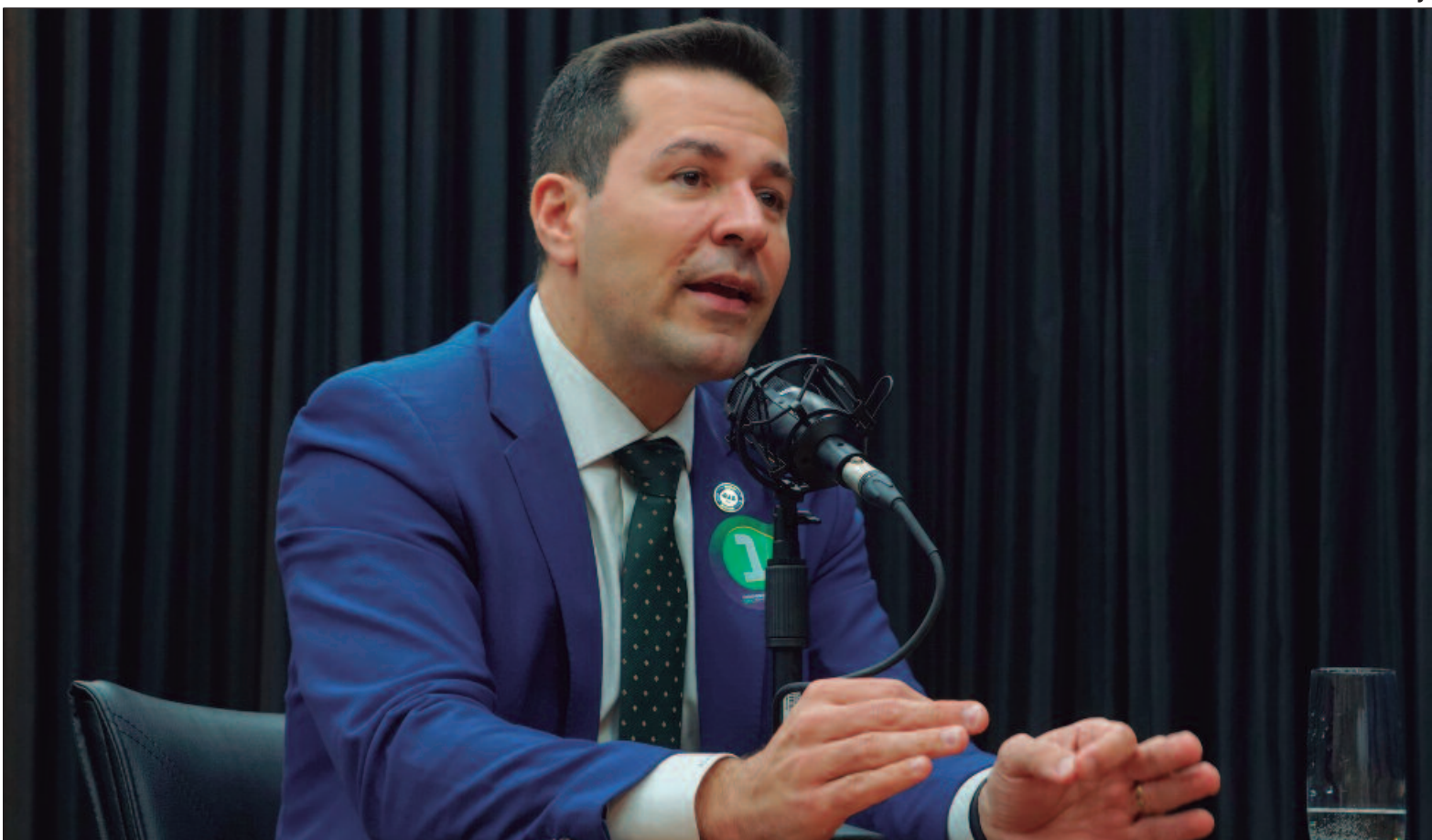
“Também fizemos algo que há muito tempo era sonhado pelas subseções, que é a interiorização da nossa procuradoria de prerrogativas”