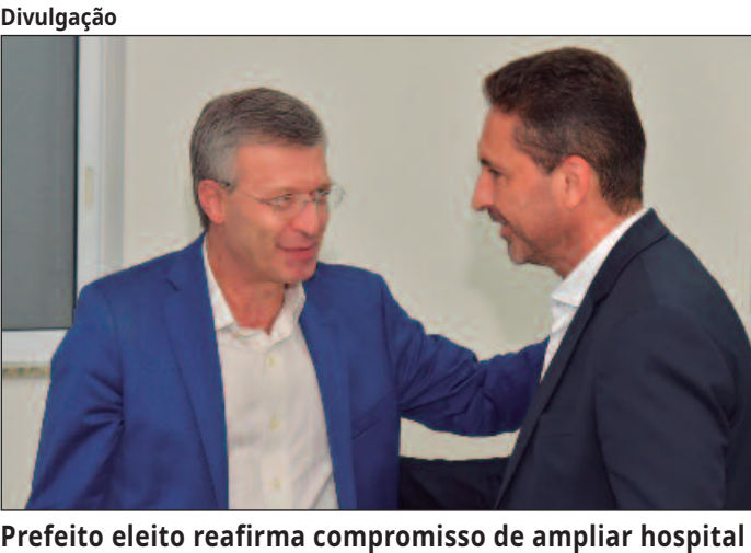
Prefeito eleito reafirma compromisso de ampliar hospital