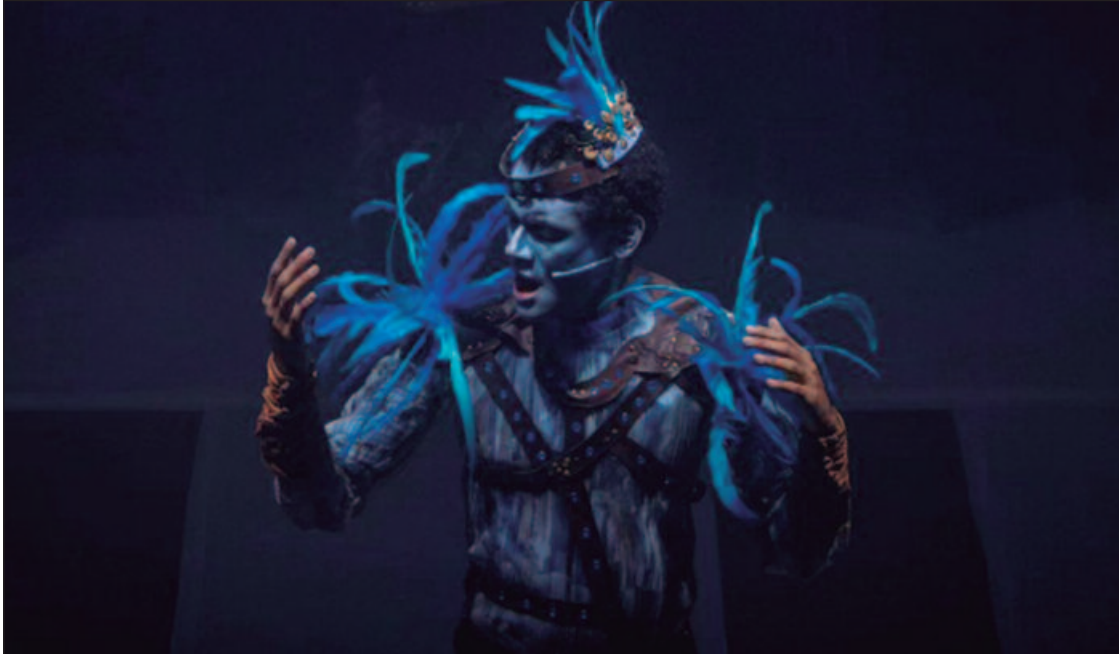
‘O Príncipe Peralta’ visa reconectar as crianças com o teatro