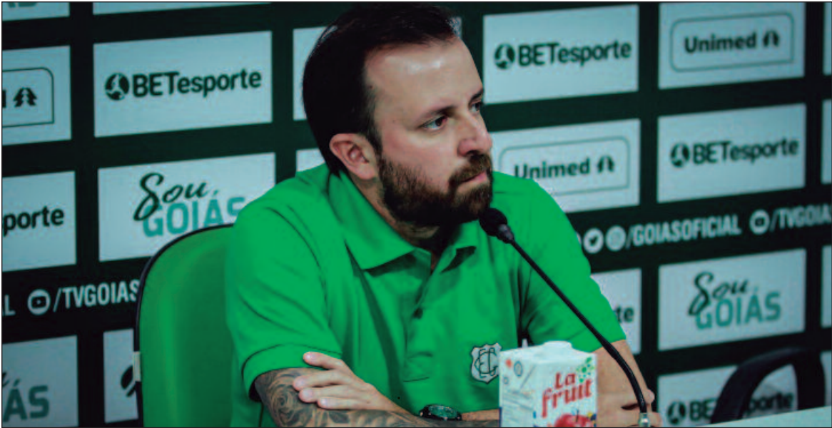
Diretor de futebol confirma foco em permanência de Mancini e busca por novas contratações para 2025