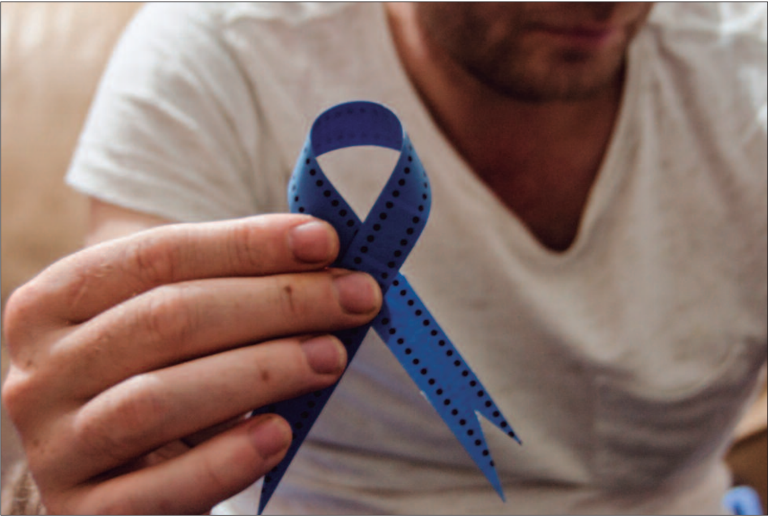
O câncer de próstata é o segundo tipo de câncer mais comum entre os homens no Brasil

O câncer de próstata é o segundo tipo de câncer mais comum entre os homens no Brasil, atrás apenas do câncer de pele não melanoma. No