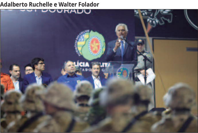
Caiado considerou texto “ação dissimulada para intervir”