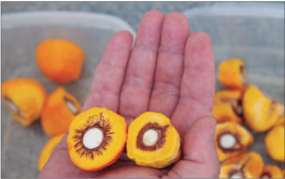
Festivais, eventos e roteiros turísticos foram criados para celebrar o pequi

Para apoiar a reprodução de mudas de pequi, tanto com espinhos quanto sem espinhos, e atender à demanda do mercado, a Emater Goiás irá disponibilizar pressas com gemas para enxertia de cultivares destinadas aos viveiristas. Os interessados deverão se inscrever entre os dias 16 e 31 de outubro, preenchendo o for-