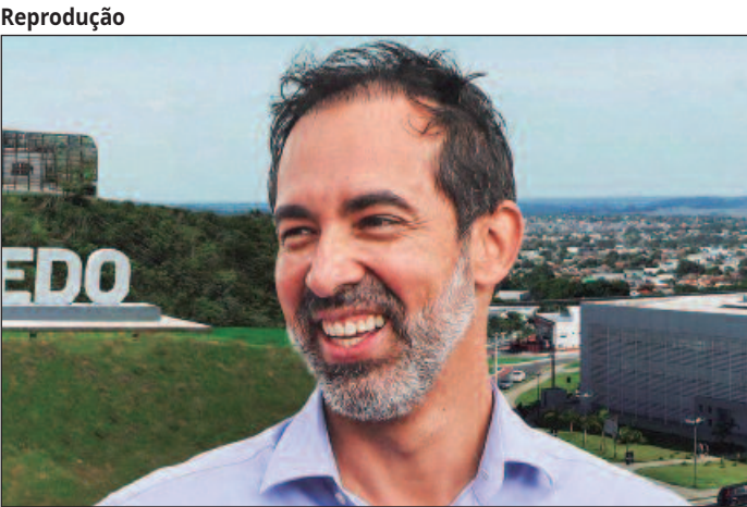
Prefeito reeleito promete concluir projetos em andamento e fazer a cidade avançar mais