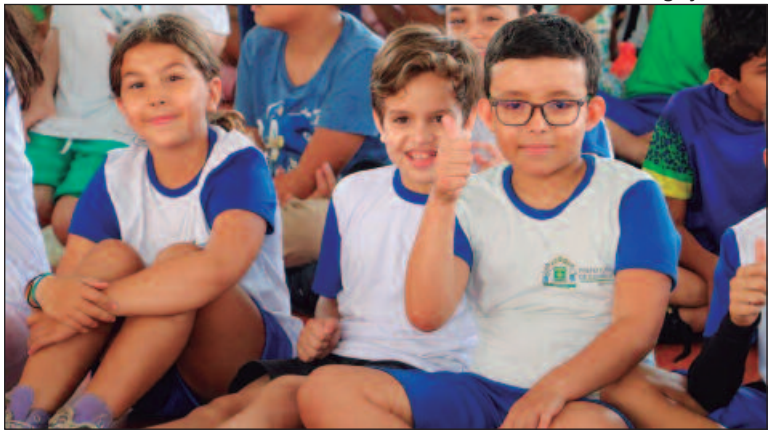
Matrículas para a rede municipal de ensino começam em 10 de dezembro para escolas e 7 de janeiro para Cmeis

O cronograma de matrículas para 2025 prevê, ainda, o início do Cadastro Antecipado para os Centros Municipais de