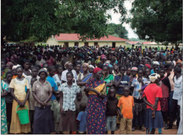
Conflitos e violência são responsáveis por insegurança alimentar

As agências alimentares da Organização das Nações Unidas (ONU) alertaram nesta quinta-feira (31/10) para o possível agravamento da fome nos próximos sete meses em muitas partes do mundo, sendo Gaza, o Sudão, Sudão do Sul, Mali e Haiti as mais preocupantes. Em relatório semestral, a Organização das Nações Unidas para a Alimentação e a Agricultura (FAO) e o Programa Alimentar Mundial (PAM) disseram que os conflitos e a violência armada são responsáveis pela maior parte da insegurança alimentar aguda nas regiões analisadas. As condições meteorológicas extremas são fator importante em outras regiões, enquanto a desigualdade econômica e os elevados níveis de dívida em muitos países em desenvolvimento prejudicam a capacidade de resposta dos governos. É necessária uma ação humanitária urgente para evitar a fome e a morte na Faixa de Gaza, no Sudão, no Sudão do Sul, no Haiti e no Mali, pediram a FAO e o PAM, segundo a agência francesa AFP. "Na ausência de esforços humanitários imediatos e de uma ação internacional concertada para remediar as graves dificuldades de acesso e