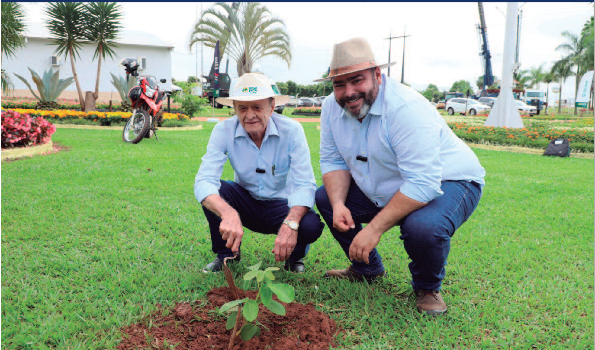
Goiás se consolida como um importante polo produtor de identidade de pequi, o que fortalece sua gastronomia e promove o turismo associado ao fruto