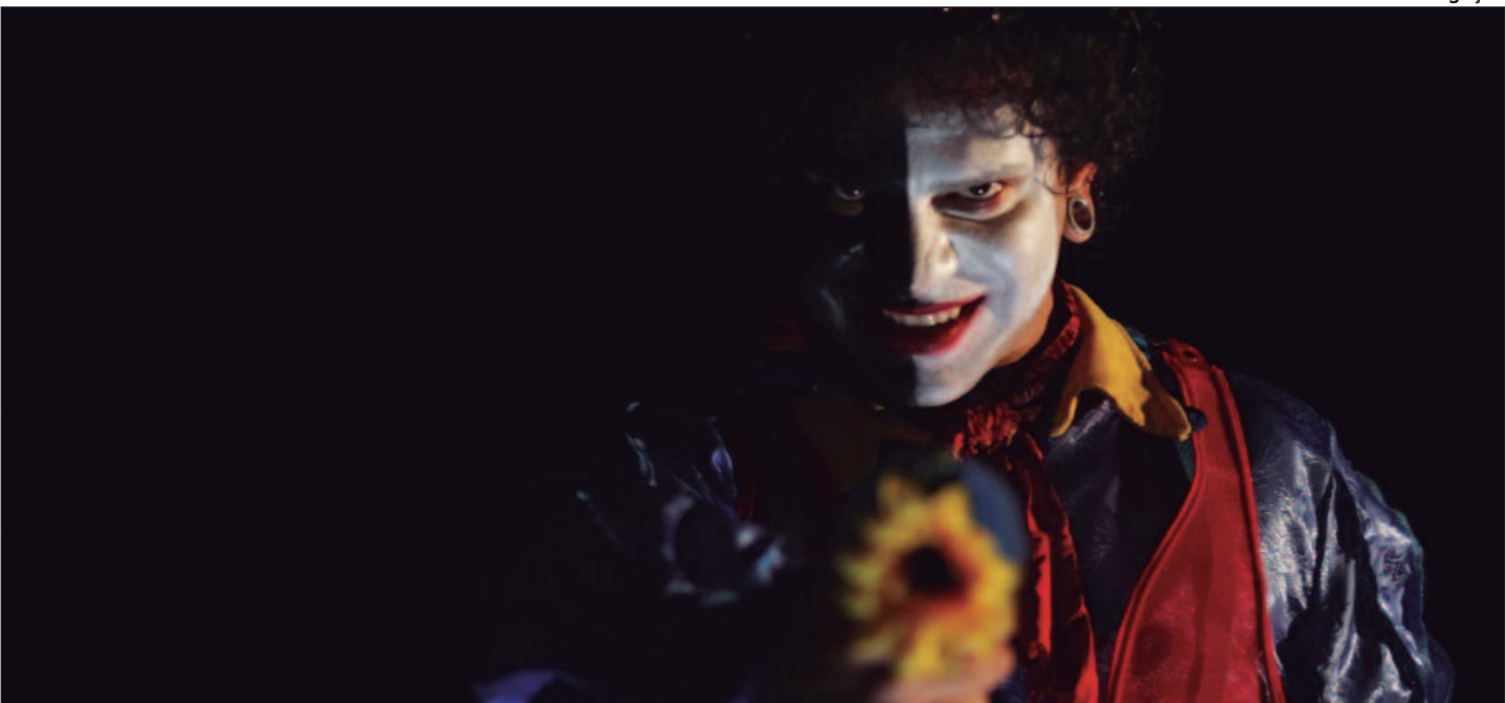
A programação do Morce-GO segue neste sábado (2) e exibe cinco curtas na Mostra Competitiva Goiás

A programação do Morce-GO segue neste sábado (2), no Cine Teatro Ouro, às 16h, com a Mostra Competitiva Goiás com a exibição de cinco curtas. Às 17h, terá a mesa-redonda: ‘O Horror como Espelho Social: Perturbações, Medos e Tabus na Cultura Pop’, com Marcos Debrito, Francisco Gaspar e Marcelo Milici. Às 18h vai ser exibido o longa ‘Amado Pai’, de Léo Miguel e às 20h, ‘Cantos Escuros: A Herança de Pietra’ de Henrique Nuzzi. No teatro, a partir das 19h, o público vai poder bater um papo com os jurados do Morce-GO. Quando: Sábado (2). Onde: R. 3, Nº 1016, St. Central — Goiânia. Horário: 16h, 17h, 18h e 19h. Ingressos: (sympla.com.br).