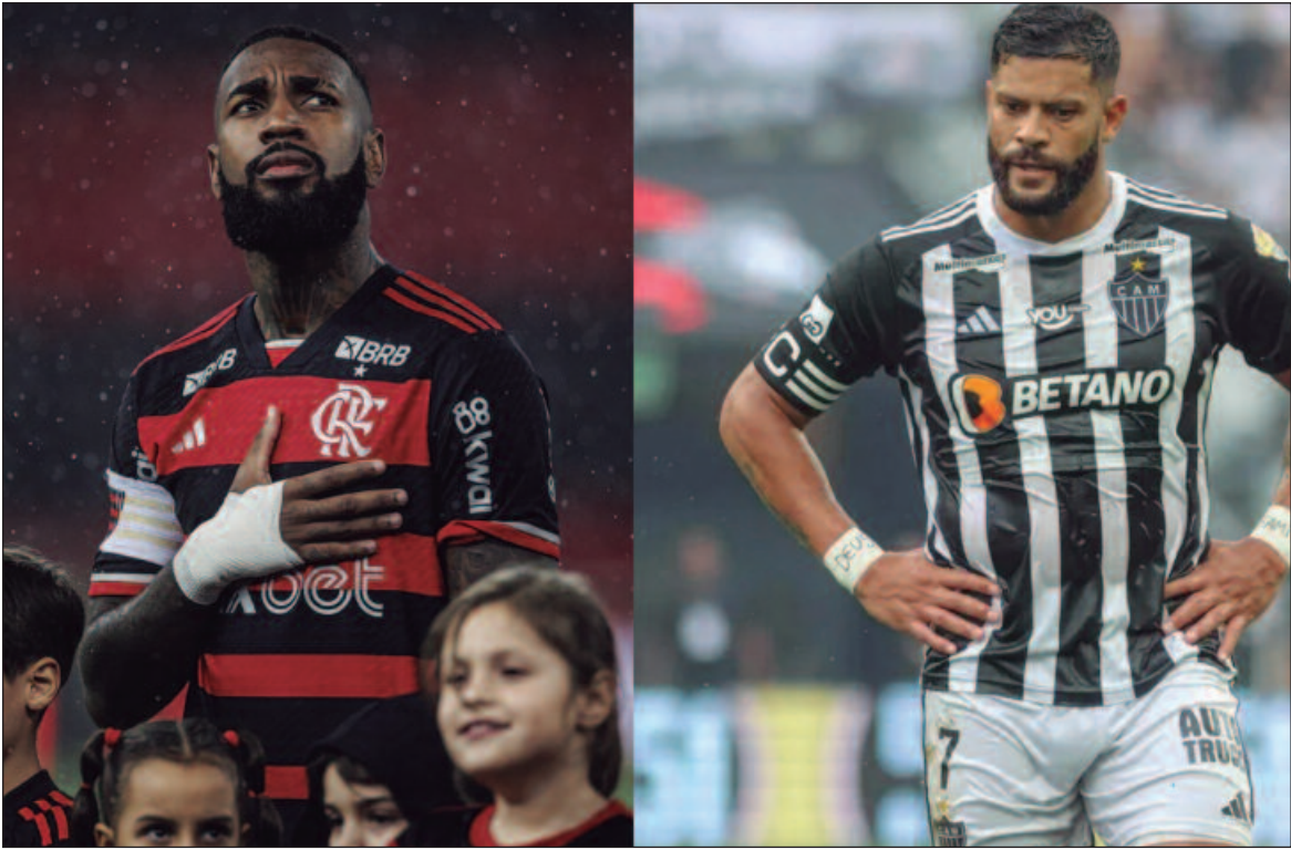
Final promete confronto acirrado entre duas das maiores forças do futebol brasileiro na atualidade