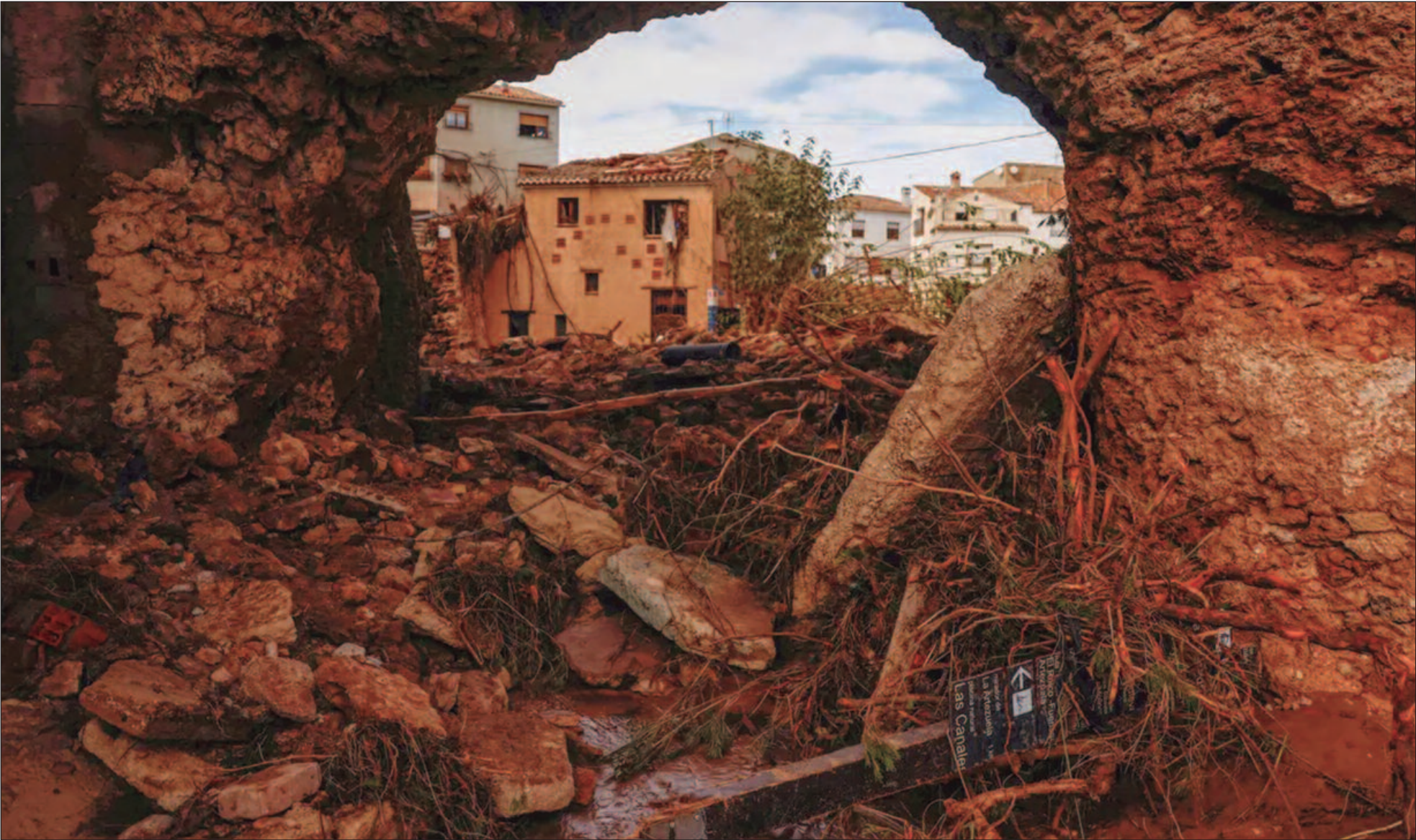
Equipes de resgate espanholas abriram um necrotério temporário em um centro de convenções e lutam para chegar a áreas ainda isoladas, nesta sexta-feira (1º)

gasolina que possamos encontrar", disse um bombeiro que viajou da região sul da Andaluzia para Valência a fim de ajudar nos esforços de resgate, carregando um tubo de plástico e garrafas vazias para coletar a gasolina dos tanques dos carros. Um ano de chuva caiu em apenas oito horas na noite de terça-feira (29/10), destruindo estradas, trilhos de trem e pontes enquanto os rios transbordaram.