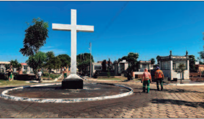
Arquidiocese de Goiânia e Centro Espírita Caridade e Caminho farão cultos nos cemitérios no Dia de Finados