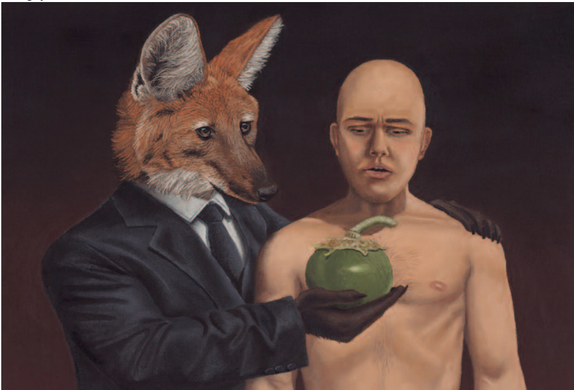
A exposição reúne 21 obras inéditas do artista, divididas em cinco séries

passar por meio de árvores decoradas com luzes, tornando o parque uma extensão do encanto natalino. Quando: Segunda-Feira (4). Onde: Av. T-10, N° 1300, St. Bueno – Goiânia. Horário: 10h. Entrada gratuita.