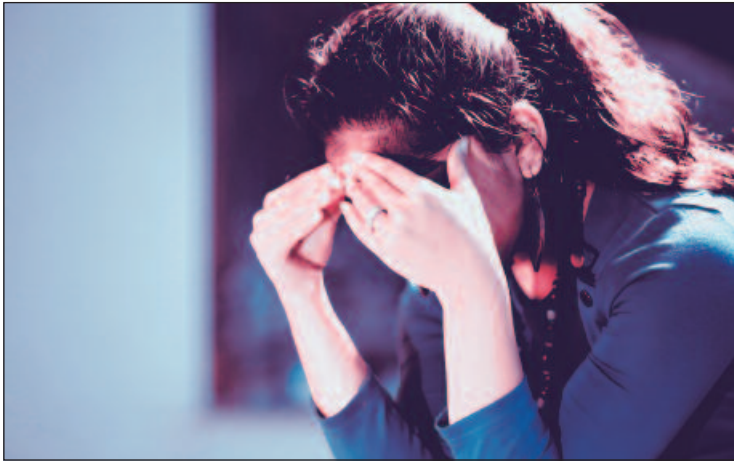
Uma das técnicas mais eficazes é a Programação Neurolinguística, que ajuda a substituir pensamentos negativos por positivos

Quando essa crença se instala, o potencial da pessoa é automaticamente limitado, comprometendo seus resultados.