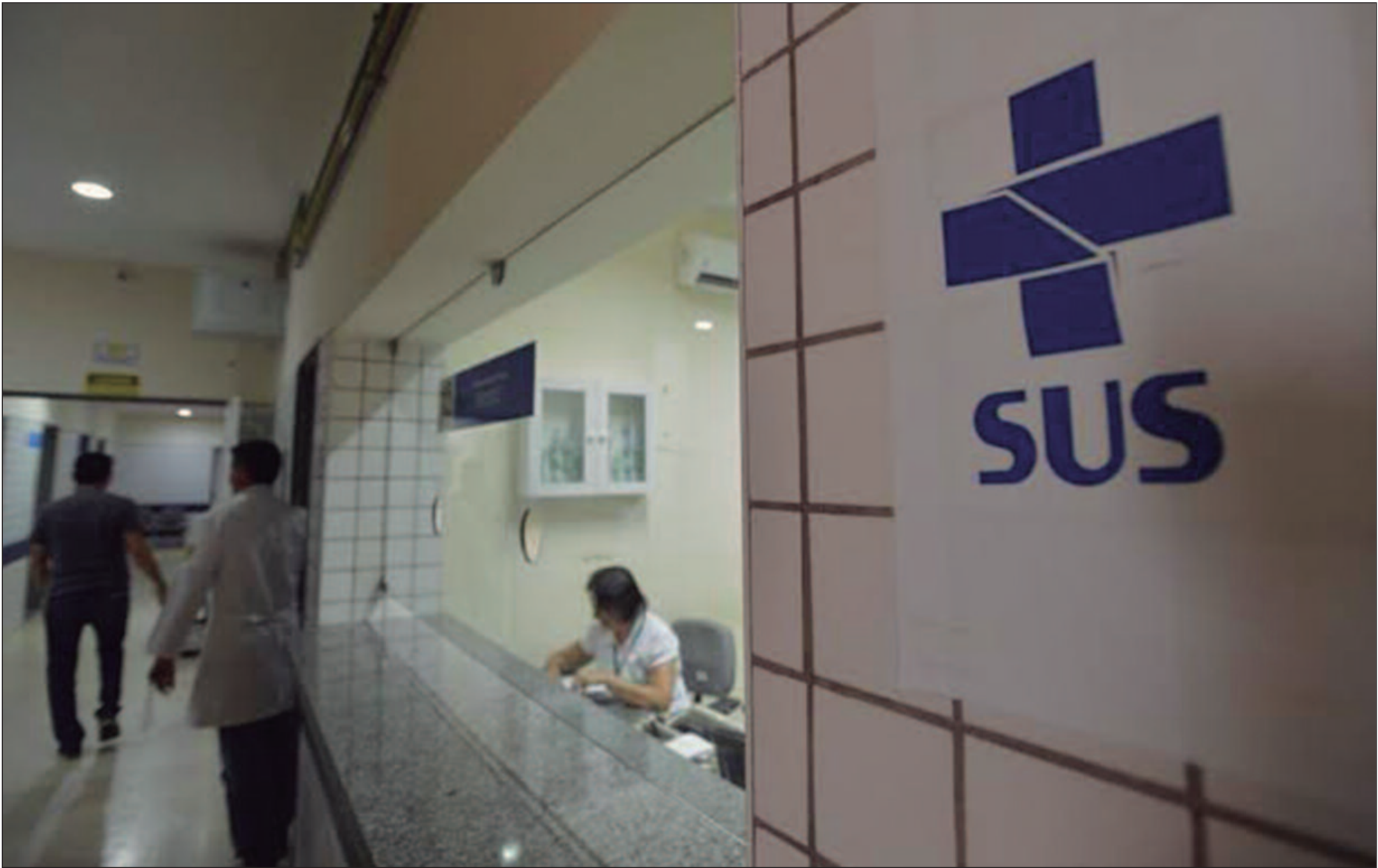
A prevenção contra as ISTs é um aspecto crucial da saúde pública. Cada uma tem suas próprias complicações e riscos associados