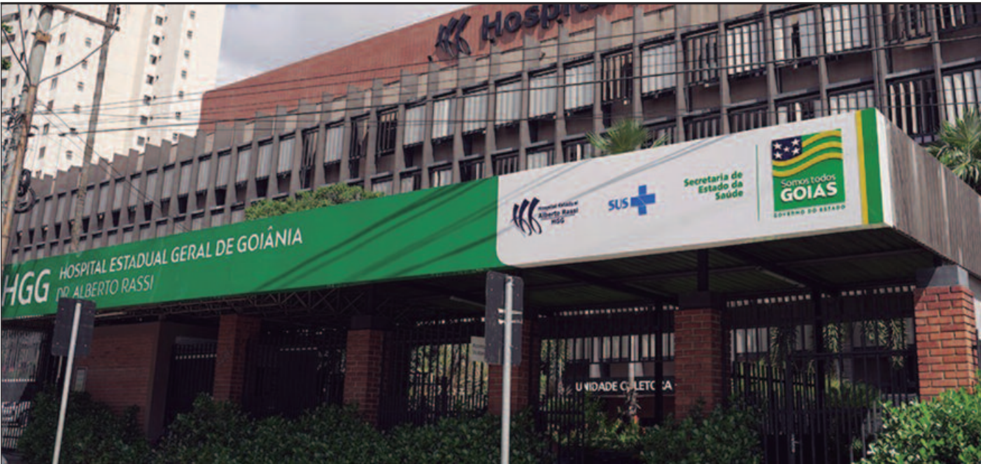
Nayane Gama do Nascimento/Idtech

O valor da inscrição varia entre R$ 250 e R$ 500