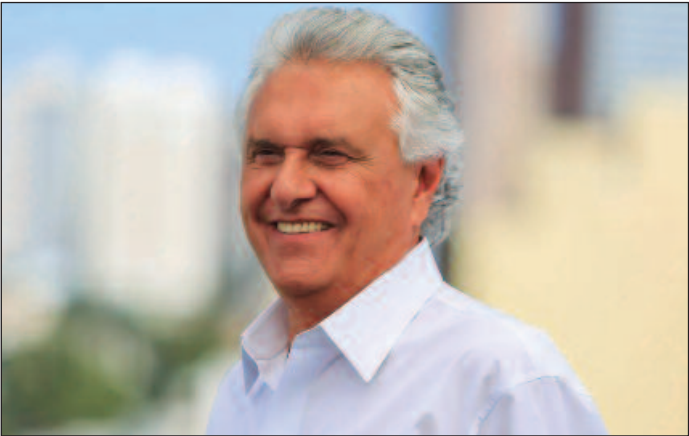
Partido de Caiado é o que mais conquistou prefeituras goianas