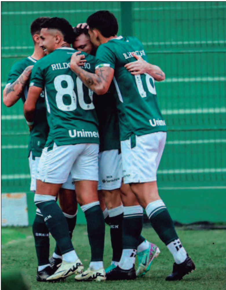
Com torcidas animadas, rivais planejam reforços para 2025 em busca de melhores posições nas competições do próximo ano