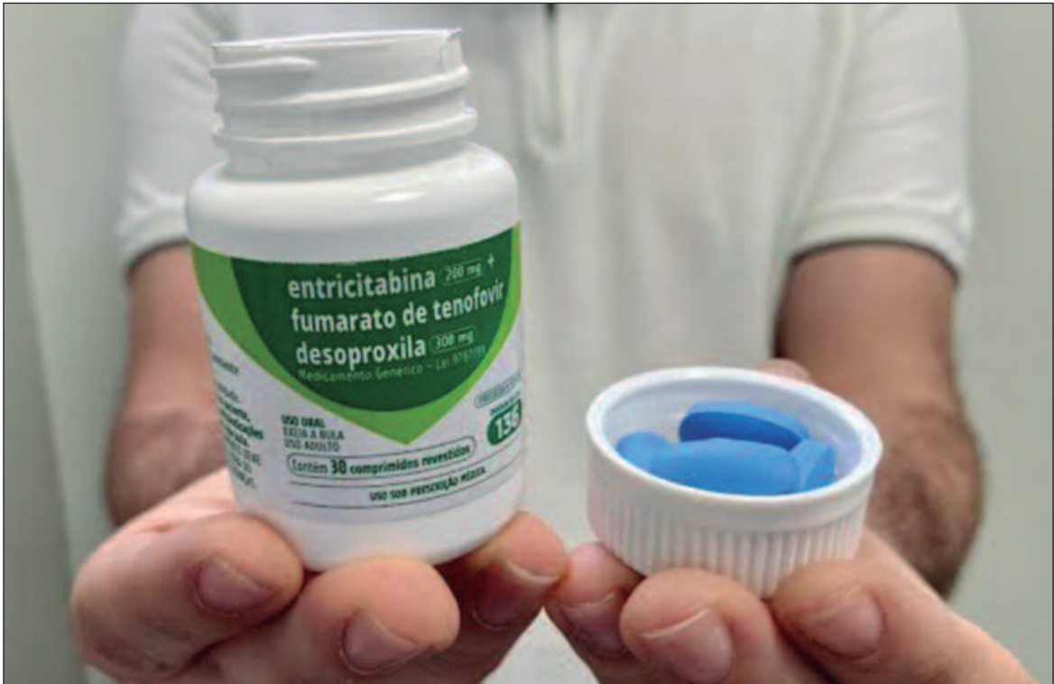
A PrEP é a combinação de dois medicamentos que bloqueiam alguns “caminhos” que o HIV usa para infectar o organismo