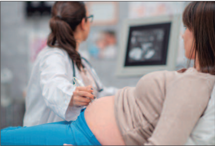
A taxa de maternidade entre mulheres mais velhas tem aumentado no Brasil nos últimos 20 anos