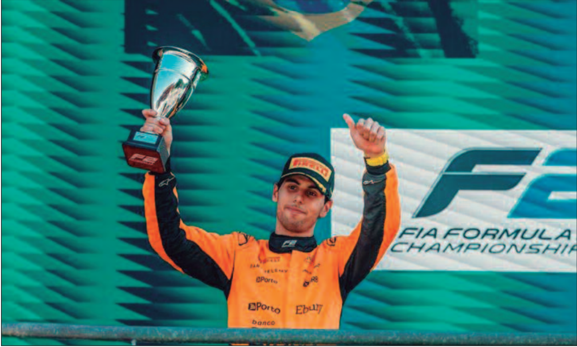
Jovem promessa fecha contrato com equipe suíça, que terá apoio da Audi em 2026, e marca retorno do Brasil