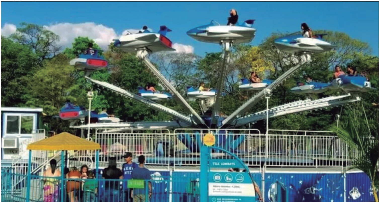
Com mais de 20 atrações em operação, o Mutirama tem capacidade para receber até 10 mil visitantes diariamente