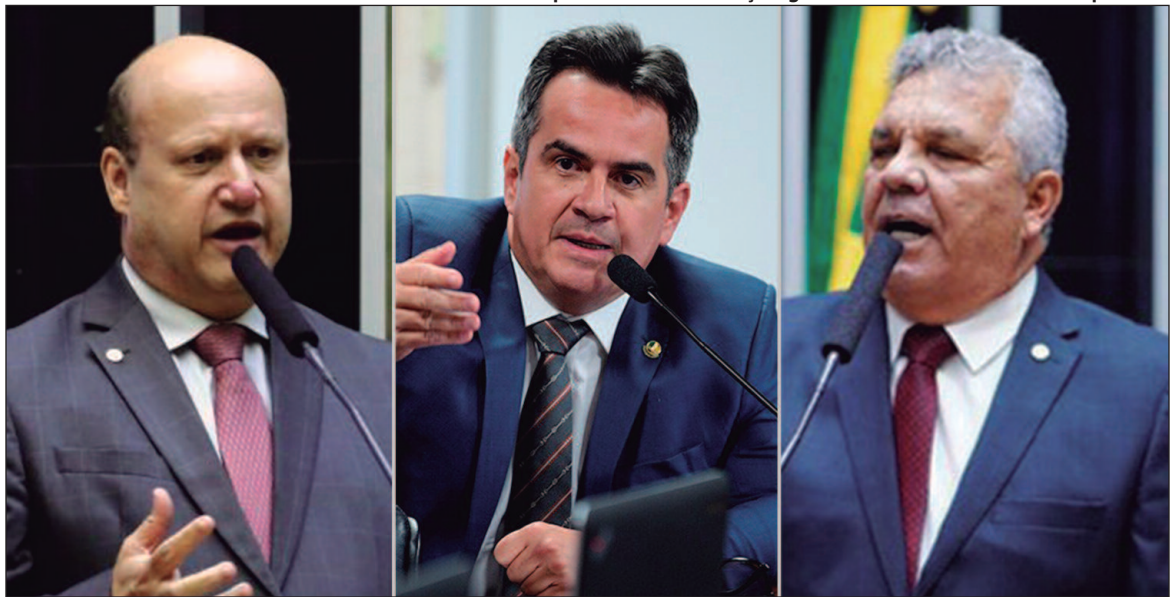
Parlamentares, como Célio Silveira, Ciro Nogueira e Alberto Fraga, fizeram críticas à PEC da Segurança

Para ele, a proposta “é ruim” e não aborda de forma efetiva os problemas enfrentados no combate ao crime organizado e na atuação das forças de segurança. O SUSP, que tem como objetivo coordenar a integração entre a União, os Estados e os municípios na execução de políticas de segurança pública, já