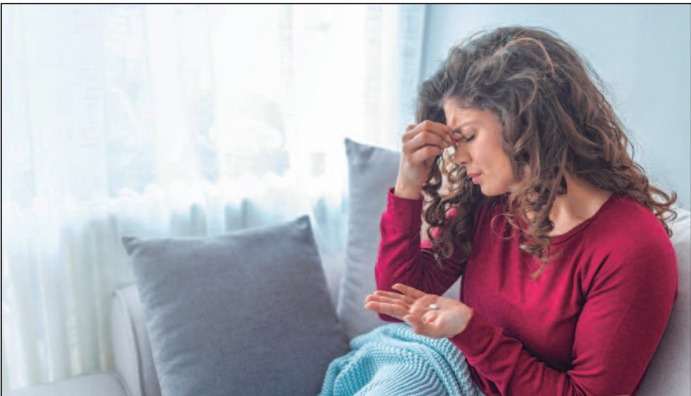
A dor de cabeça é uma das queixas de saúde mais comuns e pode ser desencadeada por uma série de fatores