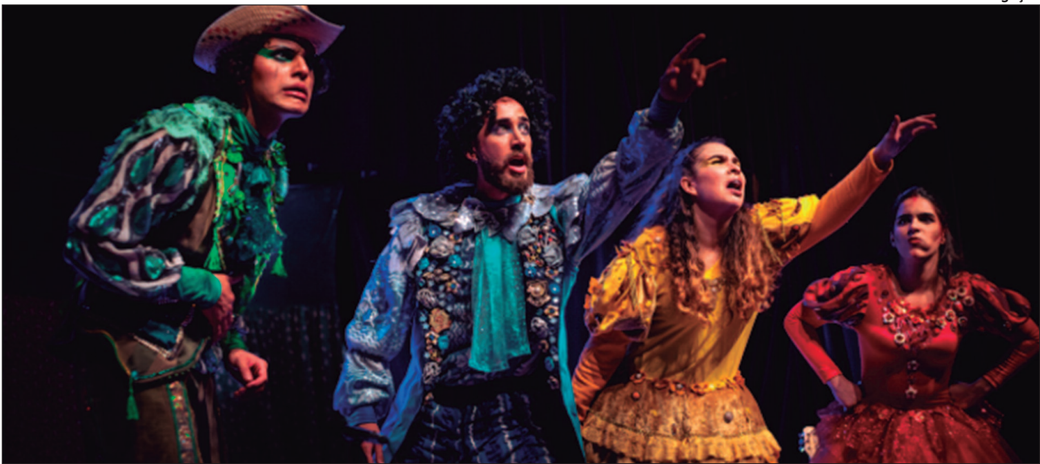
Em 'Histórias para Sonhar Acordado', os atores interpretam histórias dos grandes escritores alemães, os Irmãos Grimm

Em Histórias para Sonhar Acordado os atores interpretam histórias dos grandes escritores alemães, os Irmãos Grimm, que registraram diversas fábulas infantis, utilizando-se de componentes cotidianos, como a juventude, família, a moral e bons costumes, o amor, a amizade, o medo entre outros, conquistando muita notoriedade global. Quando: sábado (9). Onde: Teatro Sesc Centro (Rua 15, 178-298 Setor Central, Goiânia). Horário: 15:00. Para participar há quatro tipos de ingressos: Credencial Sesc, Conveniado, Público Geral e Público Geral (meia-entrada). A compra é realizada na sympla.com.