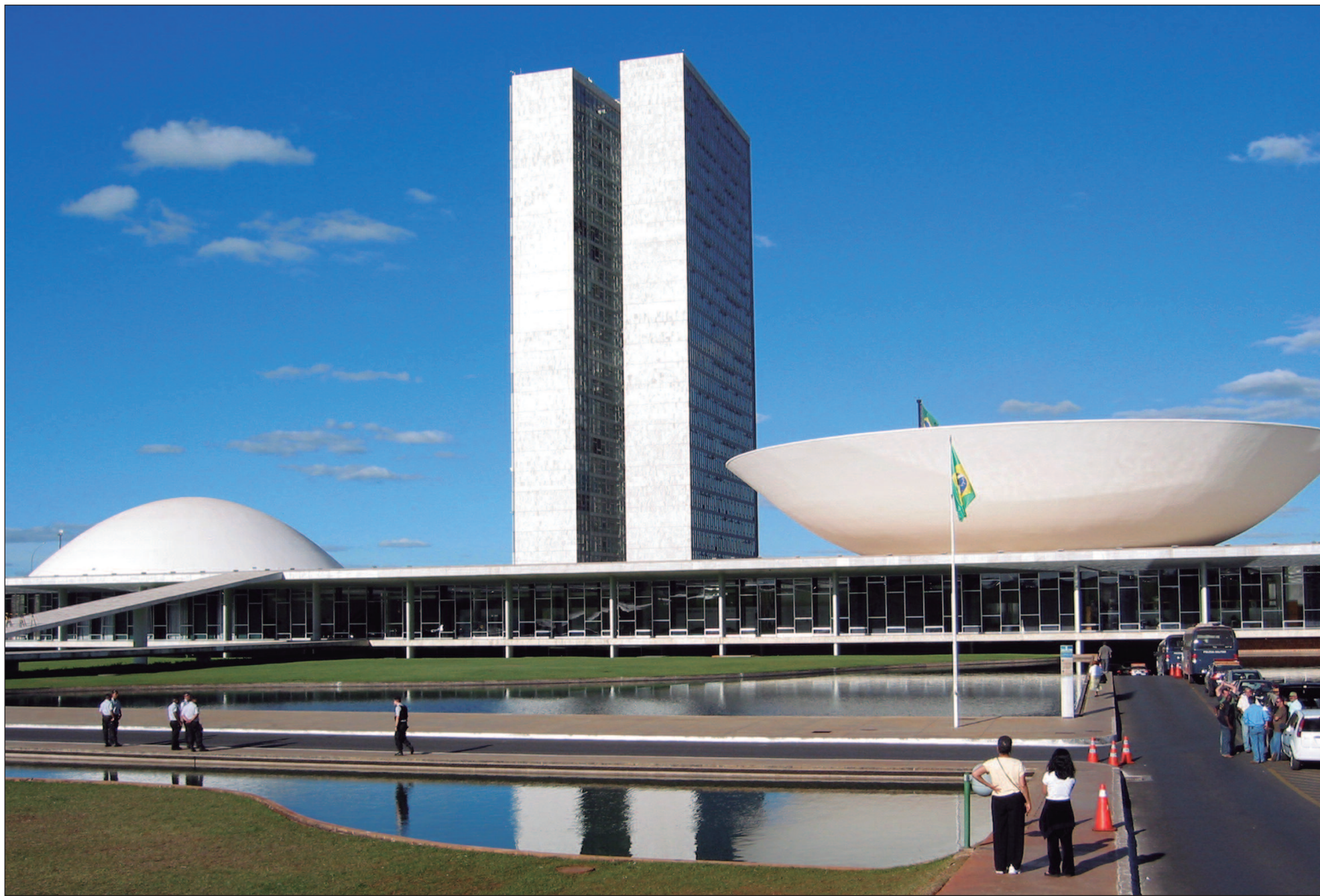
A CCJ, uma das mais importantes comissões permanentes, exerce papel fundamental no Legislativo, sendo responsável por avaliar a constitucionalidade antes que projetos avancem