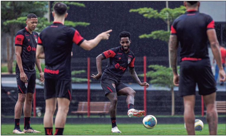
Dragão luta para deixar a última posição da tabela do Brasileirão