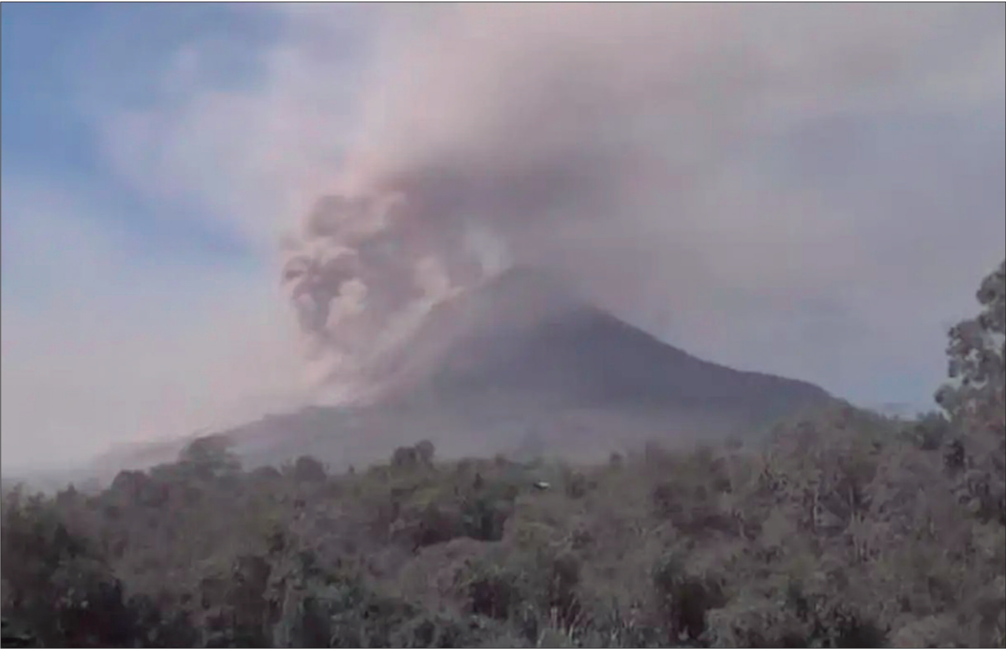
O Monte Lewotobi Laki-laki, na Indonésia, entrou em erupção várias vezes nesta sexta-feira (8), expelindo cinzas vulcânicas que subiram até 10 quilômetros, segundo as autoridades