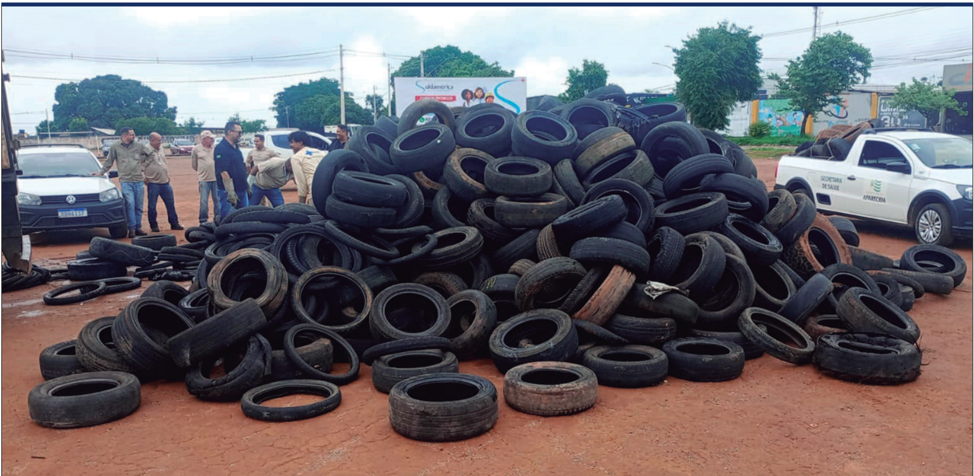
Apenas em Aparecida de Goiânia, mais de 46 mil pneus foram recolhidos de janeiro a novembro deste ano