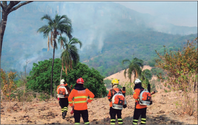
Operações Cerrado Vivo teve ocorrências em áreas não atingidas por incêndios nos últimos anos