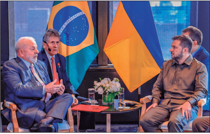
Zelensky não foi convidado para a cúpula