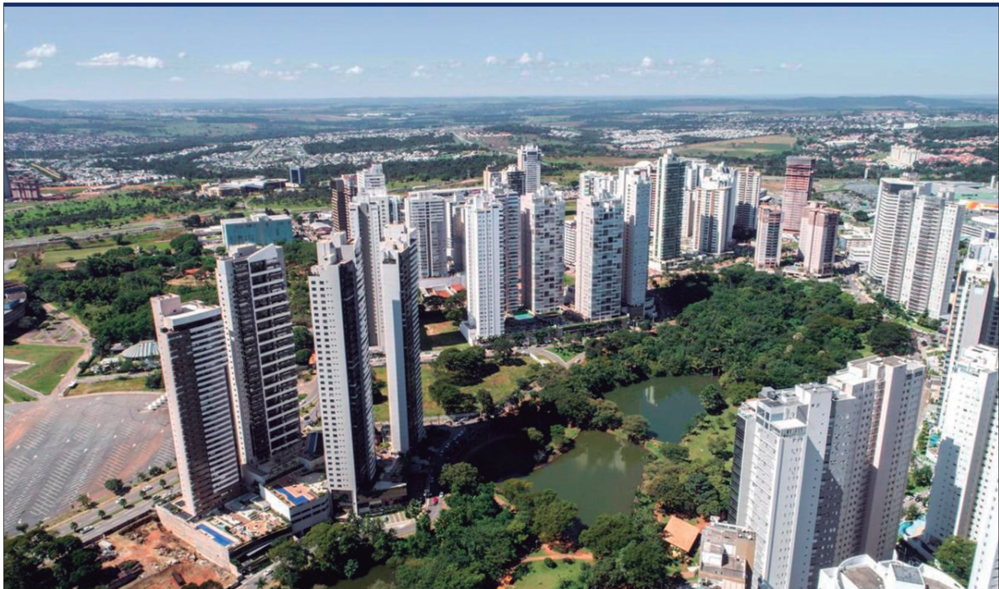
O agronegócio desempenha um papel determinante na expansão das franquias em várias regiões do Brasil, e Goiânia não é uma exceção