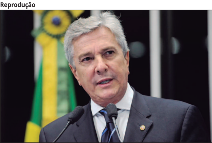
Ex-presidente pode ser preso