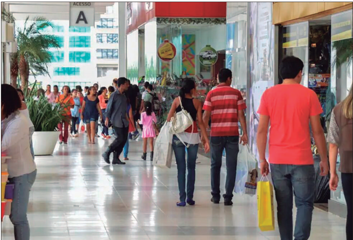
Franquias de diversas áreas encontram um ambiente de negócios próspero e em constante crescimento

De acordo com o estudo da ABF, o agronegócio de-