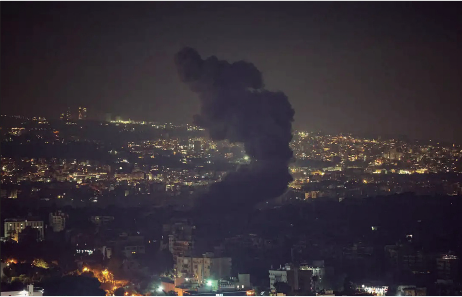
Gaza é controlada pelo grupo islâmico Hamas, que assumiu a autoria pelo atentado terrorista de 7 de outubro de 2023

Forças militares de Israel realizaram ataques em Gaza, no Líbano e na Síria neste fim de semana. O país está em guerra contra os grupos Hamas e Hezbollah, responsáveis por ataques terroristas em seu território e aliados do Irã. Segundo autoridades palestinas da saúde, 44 pessoas morreram em ataques israelenses realizados entre sexta (8) e sábado (9). O ataque ocorreu em Mawasi, uma região costeira do sul da Faixa de Gaza, onde centenas de milhares de pessoas buscaram abrigo depois de Israel tê-las orientado a deixar regiões onde o país faria bombardeios contra o Hamas. Autoridades de saúde palestinas afirmam que a ofensiva israelense sobre a Faixa de Gaza já matou mais de 43.500 pessoas, com mais de 10 mil possivelmente mortas sob escombros de prédios. Gaza é controlada pelo grupo islâmico Hamas, que assumiu a autoria pelo atentado terrorista de 7 de outubro de 2023, quando combatentes furaram as defesas judaicas na fronteira e mataram 1,2 mil pessoas, tomando também 250 reféns, de acordo com contagens de Israel.