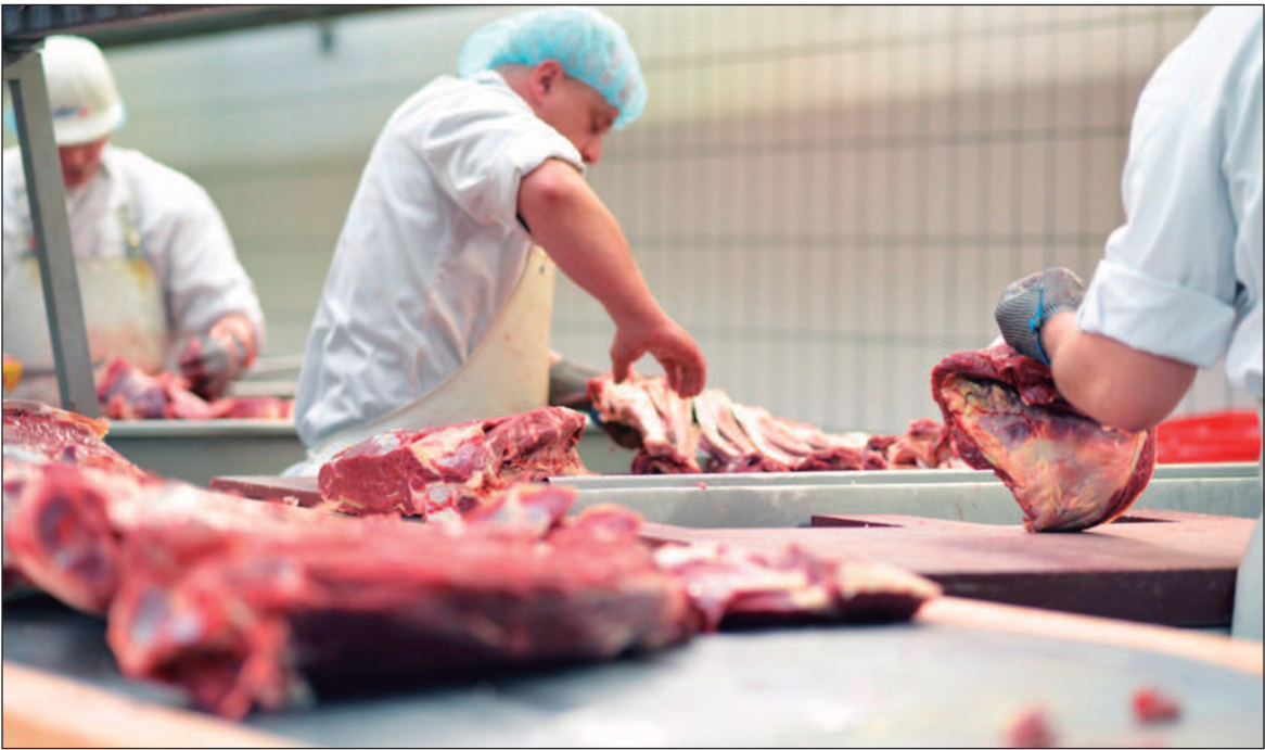
Os preços das carnes subiram 5,81% em outubro em comparação com setembro

De janeiro a setembro, exportações brasileiras de carne bovina totalizaram 2,1 milhões de toneladas, gerando faturamento de US$9,16 bi