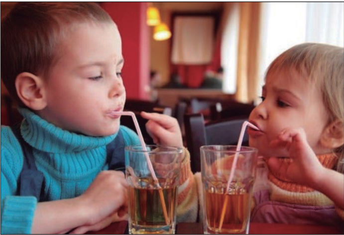
A pesquisa se baseou em dados do Global Dietary Database