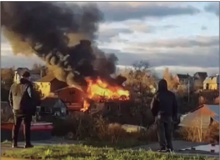
Defesas russas destruíram 50 drones

A Ucrânia atacou Moscou no domingo com pelo menos 34 drones, o maior ataque de drones à capital russa desde o início da guerra, em 2022, forçando o desvio de voos de três dos principais aeroportos da cidade e ferindo pelo menos cinco pessoas. Segundo o Ministério da Defesa, as defesas aéreas russas destruíram outros 50 drones sobre outras regiões da Rússia Ocidental no domingo. “Uma tentativa de Kiev de realizar um ataque terrorista usando drones do tipo avião no território da Federação Russa foi frustrada”, afirmou. A agência federal de transporte aéreo da Rússia informou que os aeroportos de Domodedovo, Sheremetyevo e Zhukovsky desviaram pelo menos 36 voos, mas depois retomaram as operações. Cinco pessoas ficaram feridas na região da capital, disse o Ministério da Defesa. Moscou e seu entorno têm uma população de pelo menos 21 milhões de habitantes e são uma das maiores áreas metropolitanas da Europa, ao lado de Istambul. A Rússia, por sua vez, lançou um recorde de 145 drones durante a noite, disse a Ucrânia. Kiev contou que suas de-