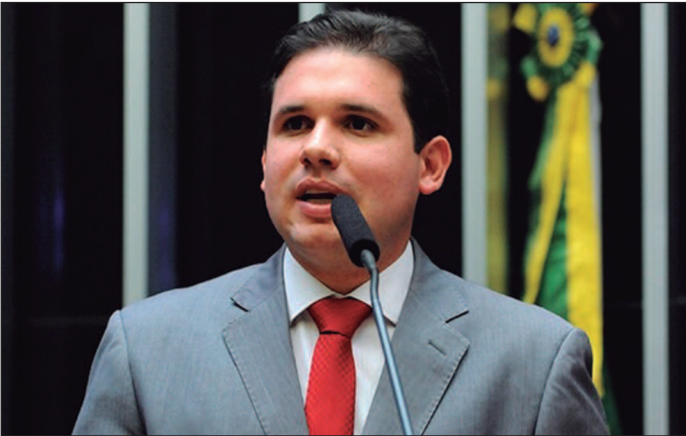
Disputa pela Câmara segue marcada por articulações intensas