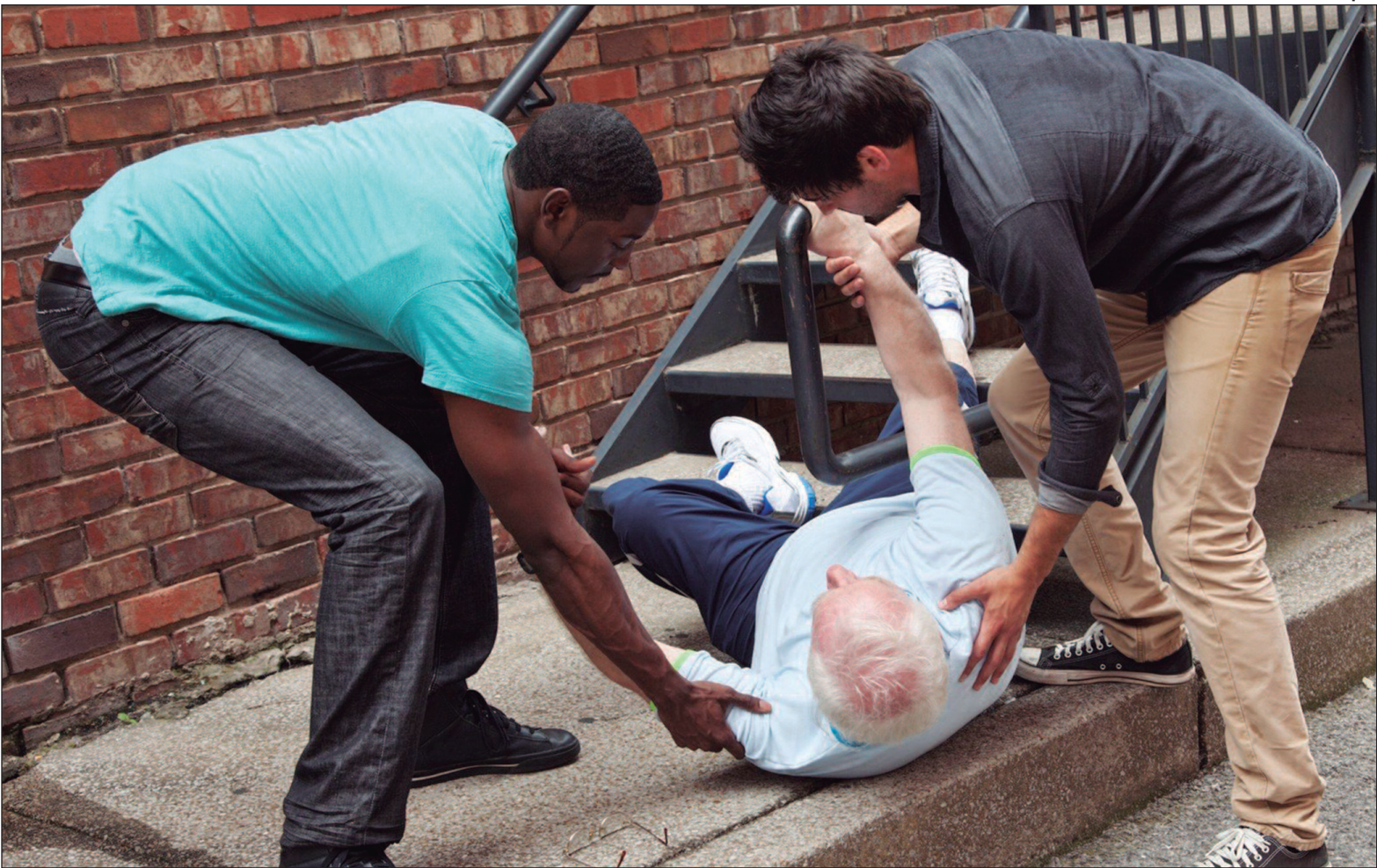
A prática de atividades físicas também é essencial para ajudar no combate às quedas