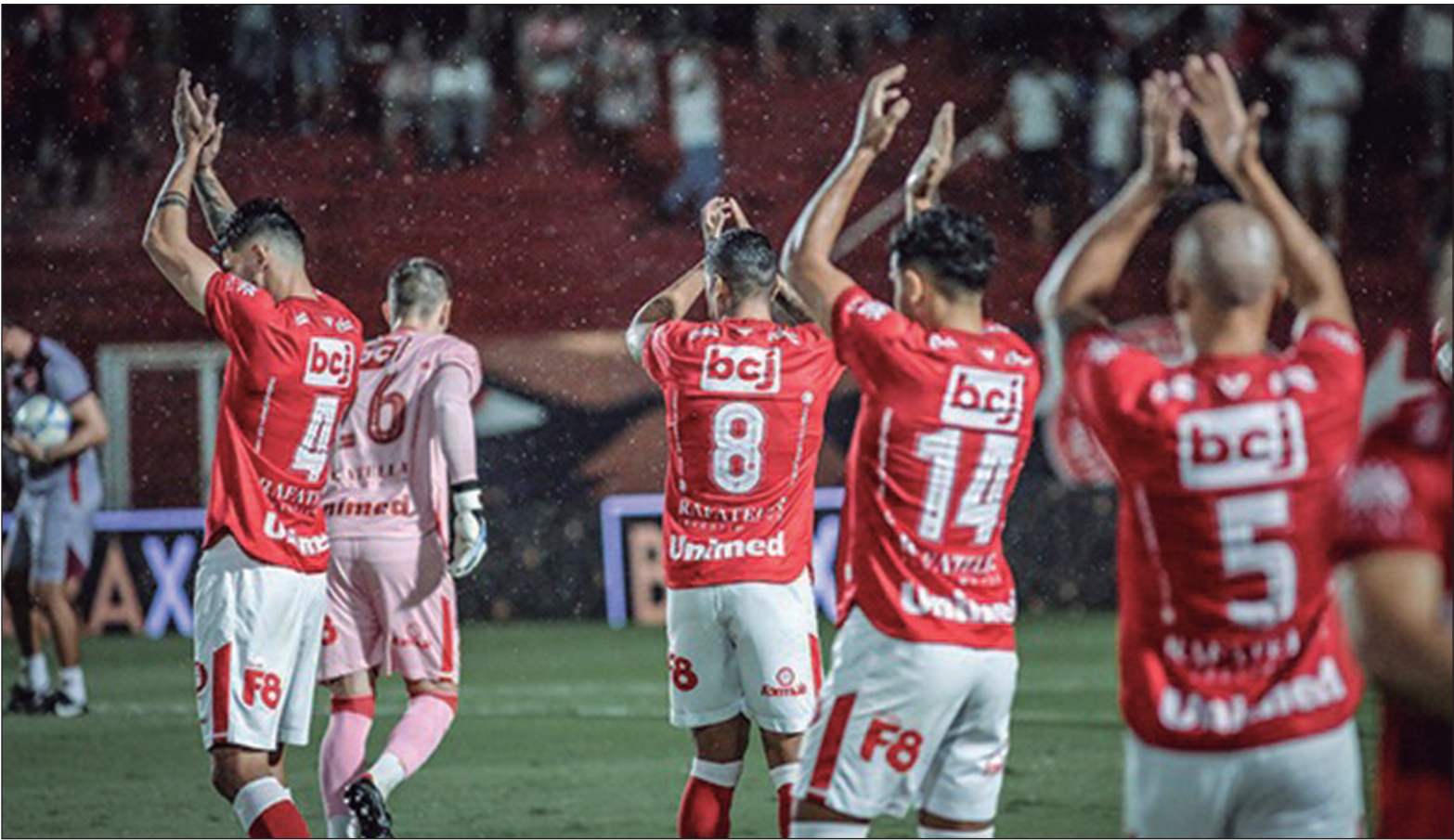
Para ambos os times, o confronto representa muito mais do que três pontos