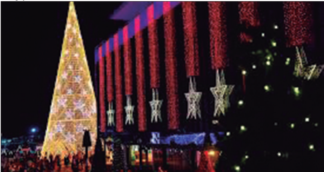
O maior natal gratuito do Brasil já está na cidade

e terá início às 20h. Quando: 21 de novembro. Onde: 132, Goiânia - GO, 74093-210. Horário: 20h. Ingressos: https://www.sympla.com.br/evento/roda-de-samba-do-dimi-gravacao-audio-visual/2709221 .