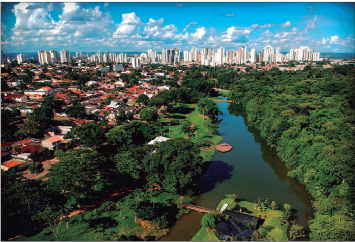
Em 2018, 55% da população mundial residia em áreas urbanas, e esse número está projetado para subir para 68% até 2050