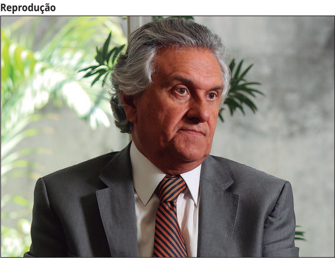
Governador critica a polarização política no Brasil