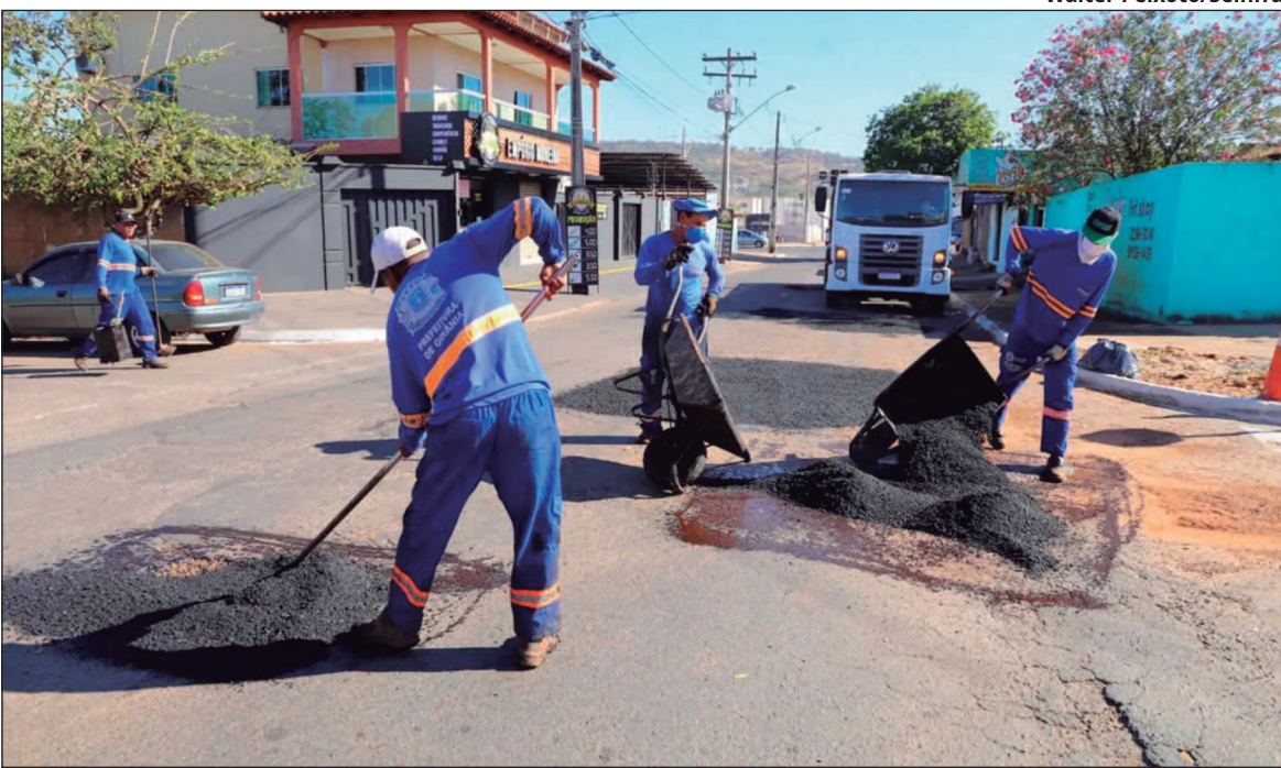
Operação tapa-buracos faz parte da manutenção constante das vias urbanas

Com um total de aproximadamente 1.100 quilômetros de asfalto novo, resultado dos programas 630 KM e 500 KM, a cidade tem investido não apenas na ampliação da pavimentação, mas também na manutenção constante das vias já existentes. Segundo a Seinfra, entre 1º de outubro e 14 de novembro deste ano, foram mapeados 2.151 buracos ou desgastes pela empresa Mapper, além de 877 pedidos registrados no aplicativo Prefei-