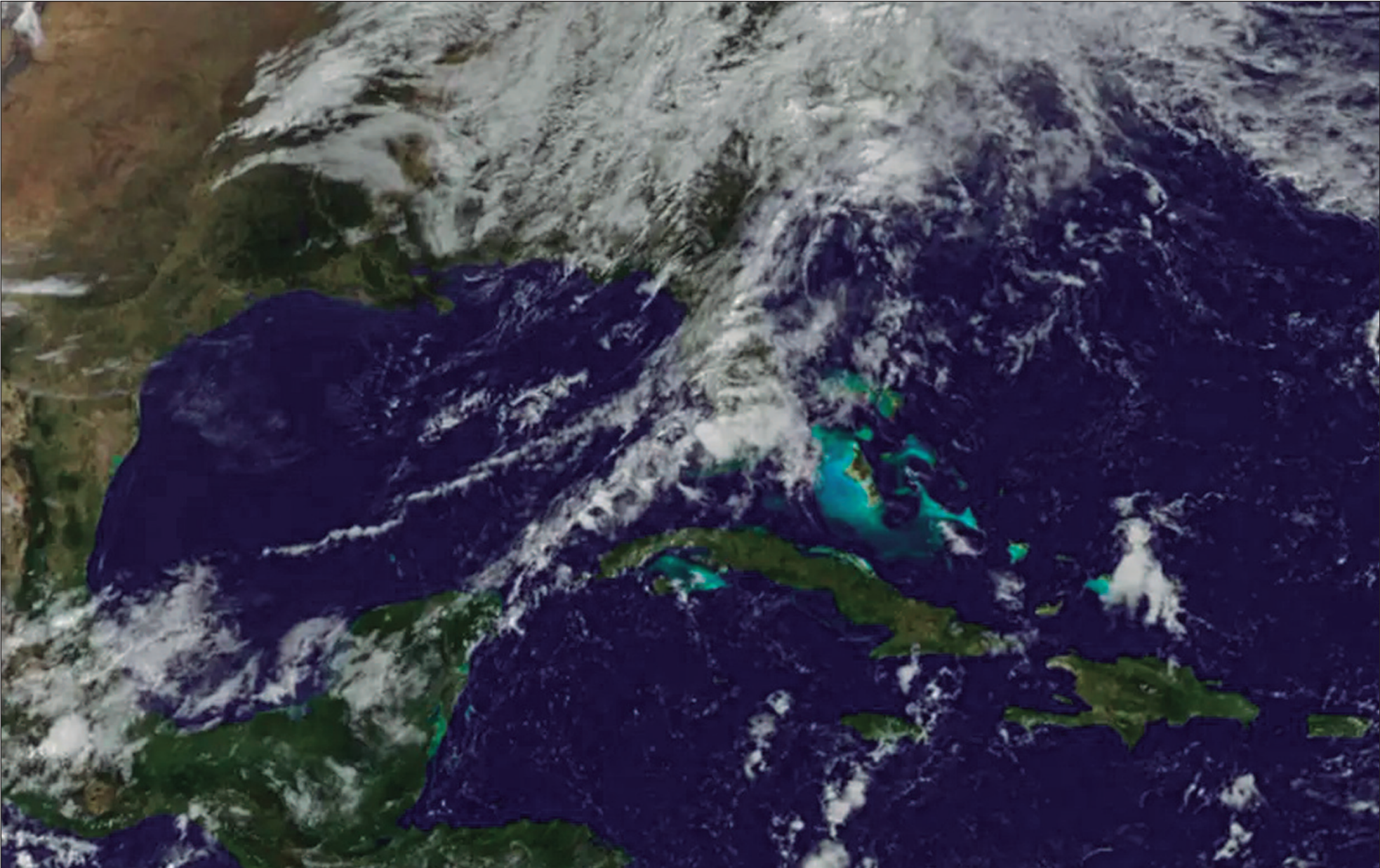
Os ventos, com força de tempestade tropical de 80 quilômetros por hora, derrubaram árvores e linhas de energia durante a noite