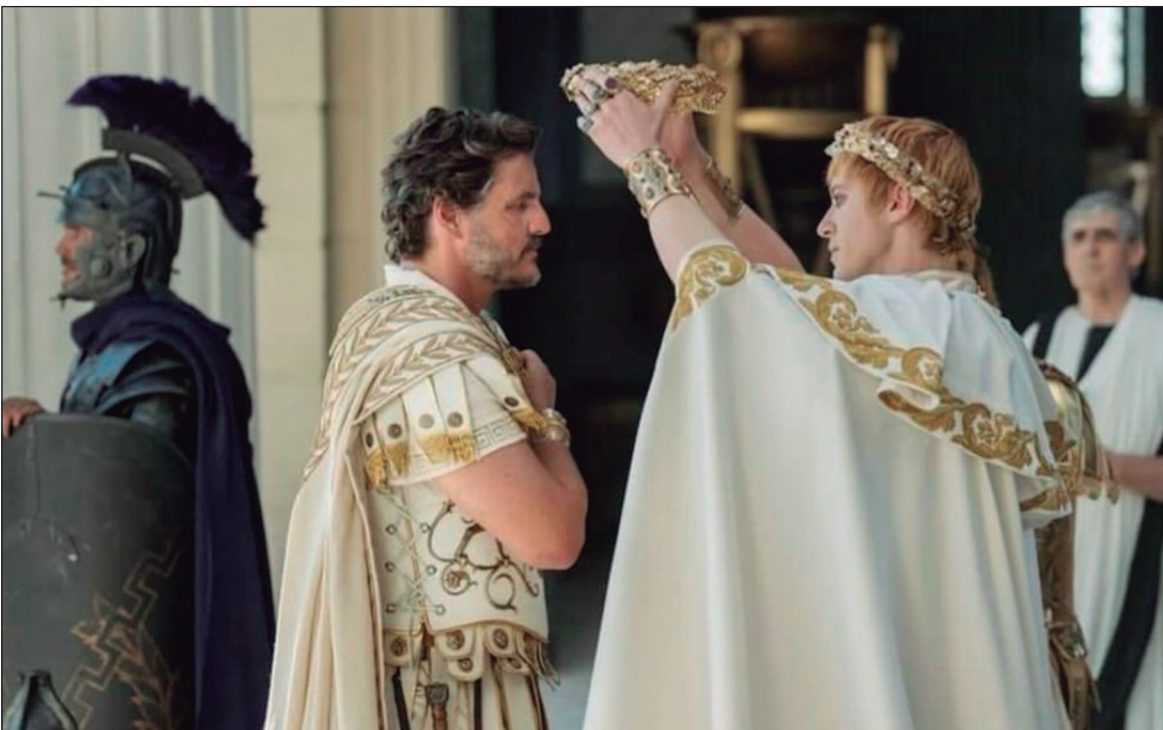
‘Gladiador 2’ é uma sequência direta do aclamado filme dirigido por Ridley Scott

Ainda estou aqui (Ainda estou aqui, 2024, Brasil) duração: 2h17. Direção: Walter Salles. Elenco: Fernand Torres, Fernanda Montenegro, Selson Melo. Gênero: drama, suspense. Cinemark Flamboyant: 13h40, 16h50, 18h15, 20h00, 21h20. Cinemark Passeio das Águas: 18h15, 21h15. Kinoplex Goiânia: 14h40. Cineflix Aparecida: 14h30, 21h50. Moviecom Buriti: 16h00, 18h40, 21h15.