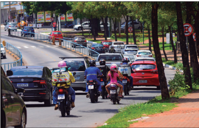
A infração mais cometida no ano foi o excesso de velocidade, que é um dos principais fatores de risco no trânsito

cem os caminhonetes, com 3.010.714 multas, motocicletas com 2.726.437, camionetas com 882.722 e caminhões com 675.961 infrações.