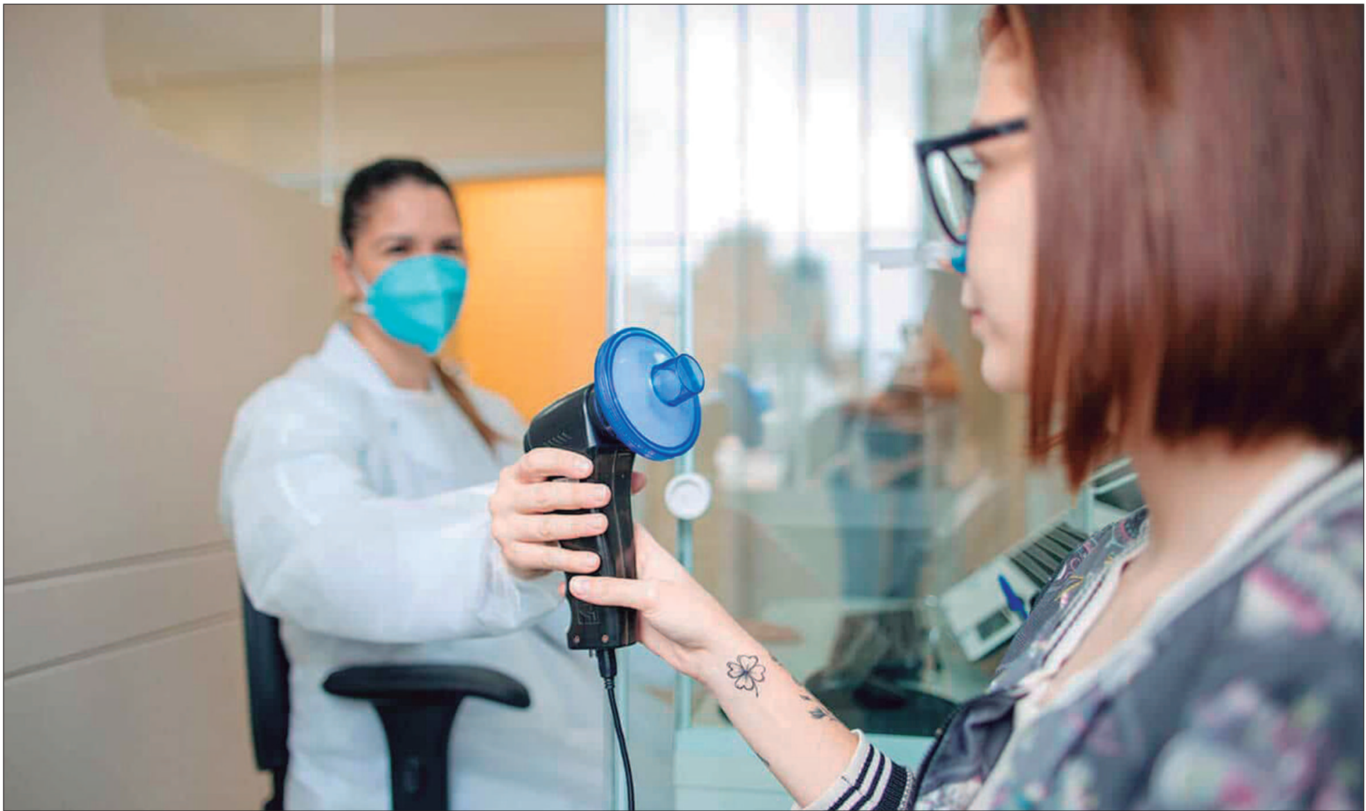
O Dia Mundial da DPOC é lembrado na terceira quarta-feira de novembro como forma de fazer alerta para o diagnóstico