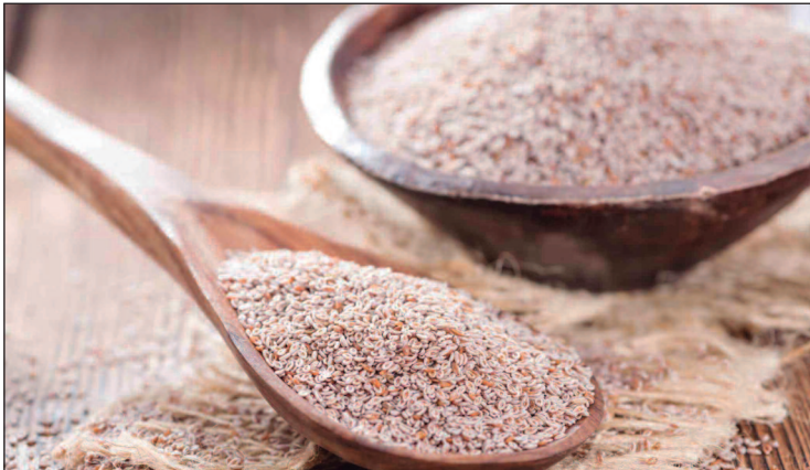
Adote o psyllium no dia a dia e aproveite suas inúmeras vantagens para o corpo e a mente!

de psyllium pode auxiliar na redução do colesterol ruim (LDL) e no aumento do colesterol bom (HDL). Isso ocorre porque o gel formado pela fibra solúvel no sistema digestivo impede que parte do colesterol presente nos alimentos seja absorvido pelo organismo. Como resultado, o risco de doenças cardiovasculares diminui