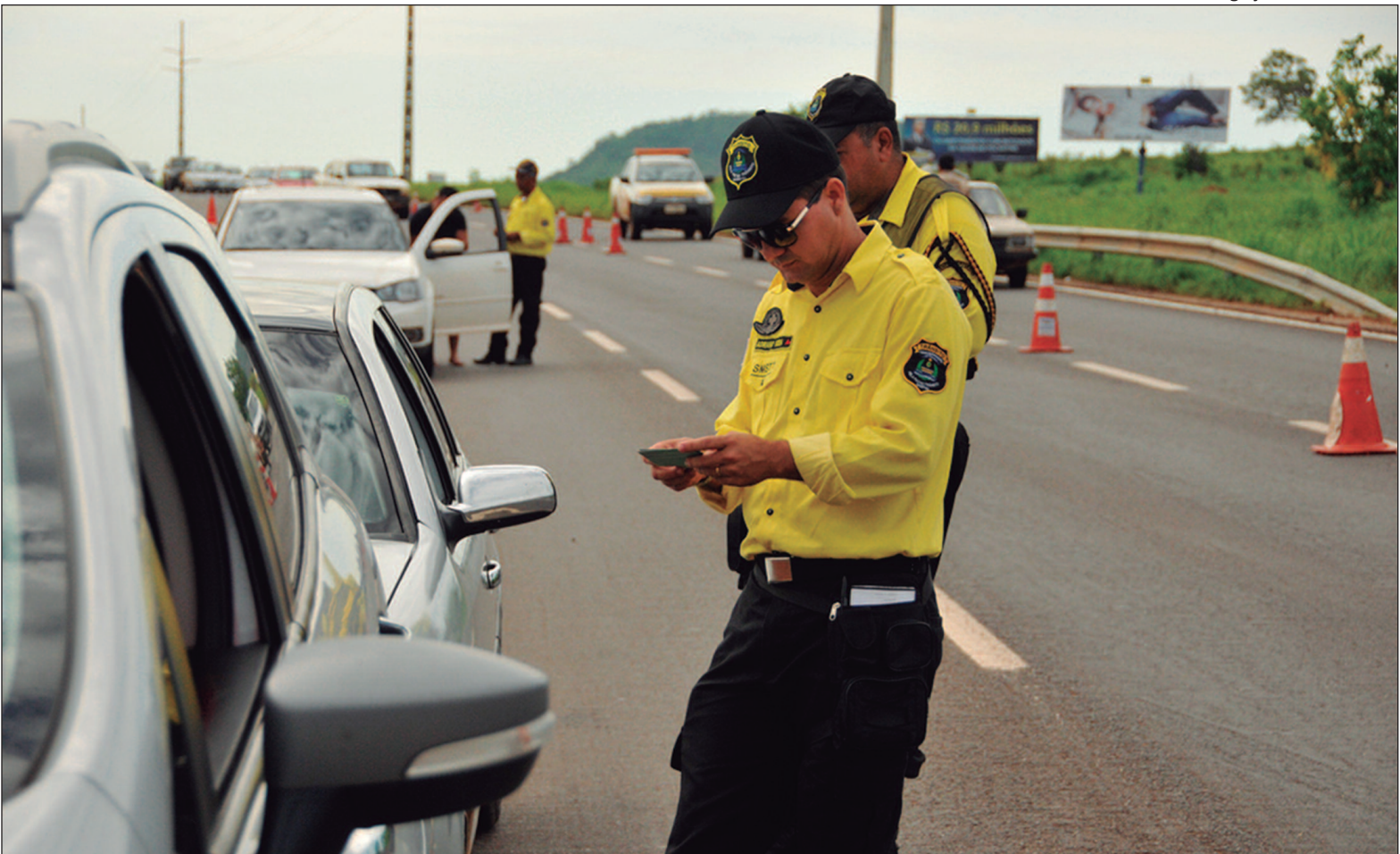
Na categoria de infrações por município, Goiânia lidera com 402.956 multas aplicadas em um ano

De acordo com um levantamento do Detran-GO, os carros lideram em número de multas por tipo de veículo, com 10.373.763 infrações registradas. Em seguida, apare-