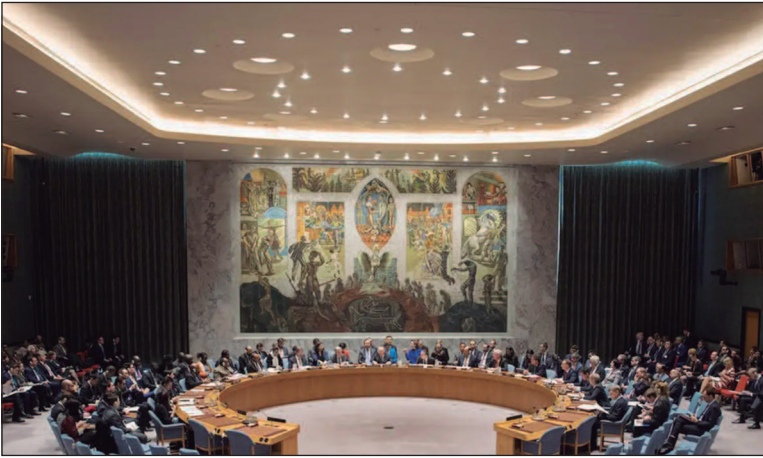
Decisão pedia cessar-fogo imediato, incondicional e permanente