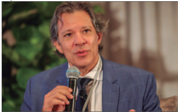
Haddad confirma corte e ajusta detalhes finais com Lula