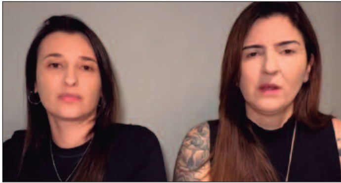
Mulheres relataram o imbróglia da viagem nas redes sociais