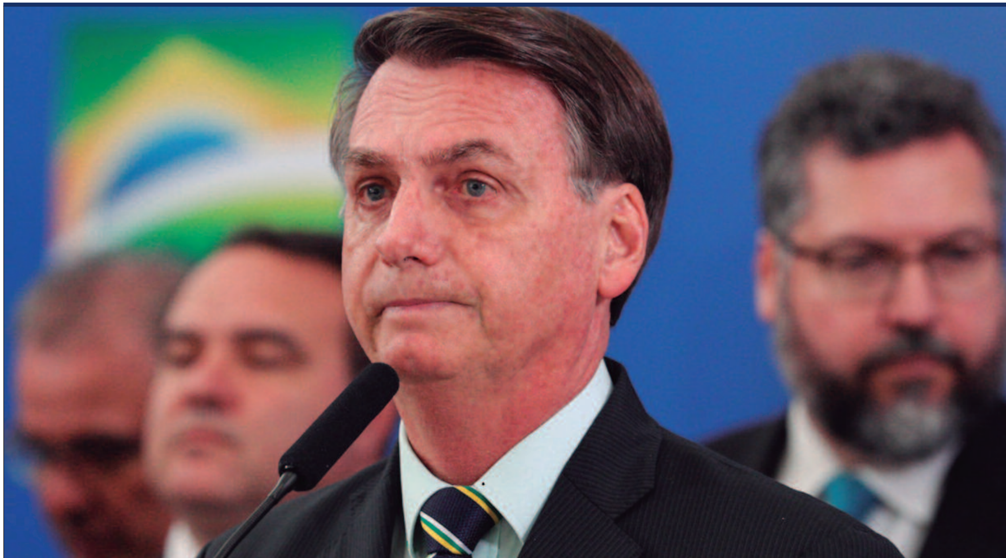
A Polícia Federal indiciou 37 pessoas envolvidas em uma tentativa de golpe de Estado que teria como objetivo minar a ordem democrática após a eleição de Lula