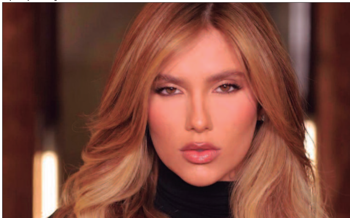
A empresária compartilhou em sua conta no Instagram que consome dez ovos pela manhã

O ovo tem se tornado um elemento essencial na rotina de muitos brasileiros há algum tempo. De acordo com a Tabela Brasileira de Composição de Alimentos (TACO), um ovo inteiro, com aproximadamente 50 gramas, contém cerca de 5,2 gramas de proteína. Esse valor pode variar um pouco dependendo do tamanho do ovo.