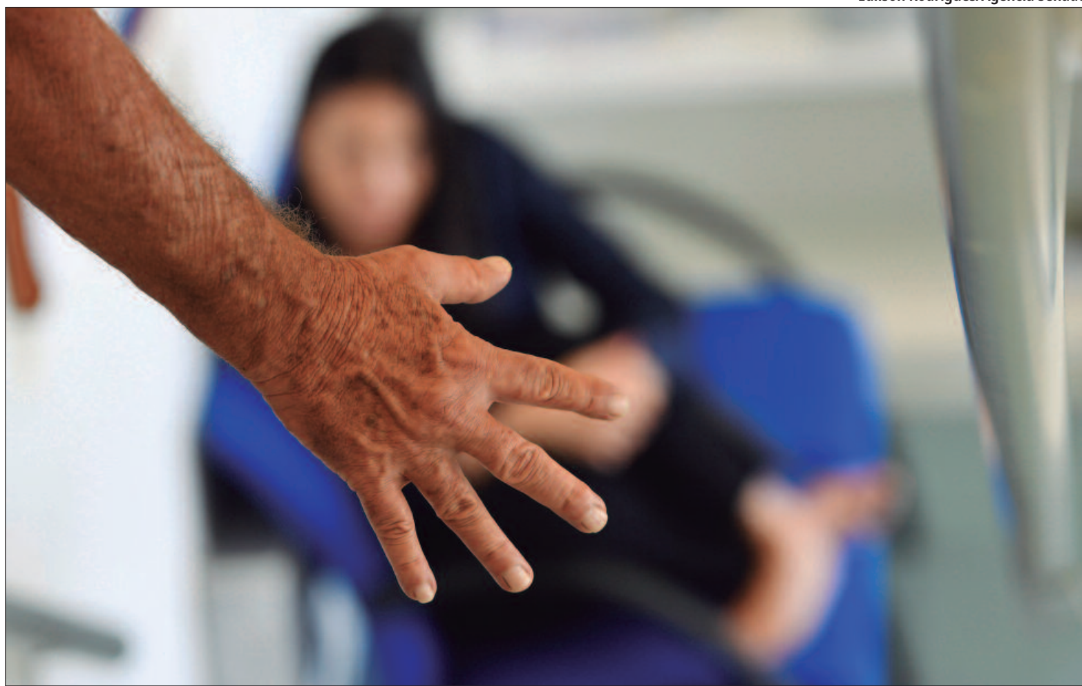
Centro-Oeste ficou em 4º lugar com denúncias de violência contra a mulher enviadas ao número 180

Além disso, a pasta também compilou dados relativos a crimes cometidos em 2018 e também encontrou uma variação negativa. Sobre isso, casos de outro de estupro tiveram uma queda com 584 em 2024 contra 502 no ano em 2018, uma variação de -14,04%. Apesar disso, os índices nacionais continuam altos, como mostrou os dados do 18º anuário, de acordo com o relatório, 20.124 foram violadas se comparado com 19.073 do ano de 2022. Contudo, o estupro de vulnerável registrou 64.237 casos, um aumento de 7,48% em comparação com 2023 que registrou 59.761 casos. Para especialistas em segurança pública, como a Major Dyrlyne Seixas do Batalhão Maria da Penha da Polícia Militar de Goiás (PMGO), o que aconte-