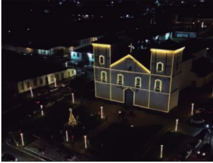
cidade histórica abre as portas para a quarta edição do Natal do Cerrado, evento que já se tornou referência em toda a região

ças da Coleção África, que reúne máscaras, estatuetas e outros objetos de uso cotidiano e ritualístico, com curadoria assinada por Marisa Moreira Salles, Tomas Alvim, Renato Araújo e Danilo Garcia. É uma exposição representativa da arte tradicional africana, incluindo esculturas e conjuntos especiais, como talheres, pentes, polias, mama watas (figura lendária da mitologia africana ocidental, bronzes, adornos, peças ritualísticas, apoios de nuca e tecidos. A entrada é gratuita. Quando: De 21/11/2024