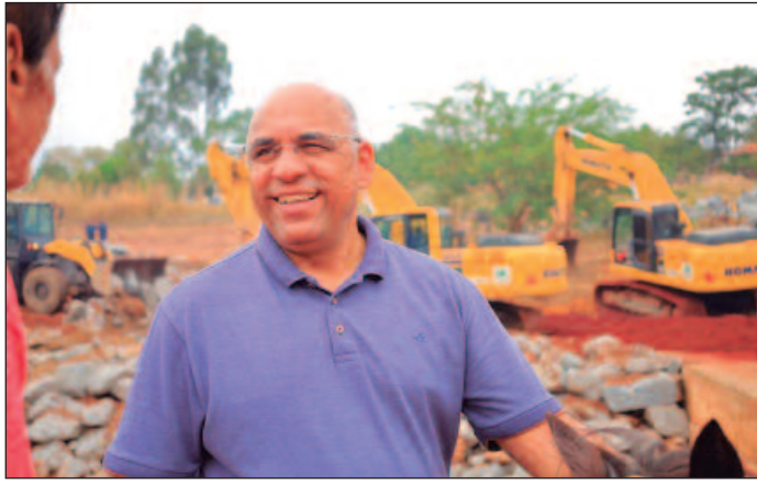
Prefeitura vai inaugurar novo Cras no Jardim Balneário