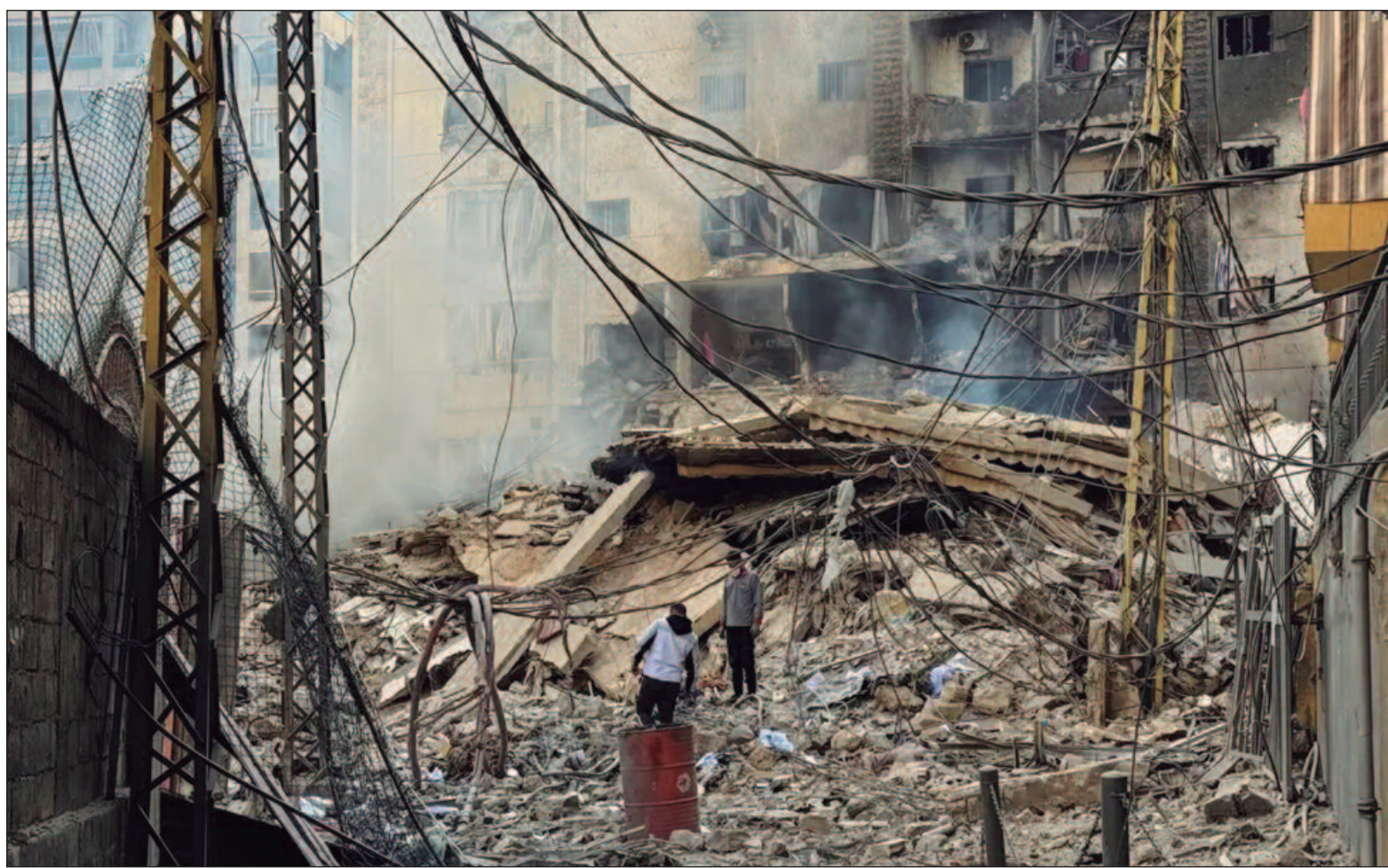
Exército israelense atacou também no sábado à noite a passagem fronteiriça de Jousieh, entre o Líbano e a Síria

Ainda permanece pouco claro o principal objetivo do