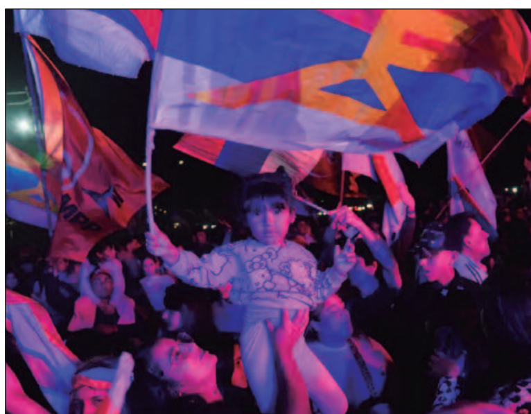
Alto custo de vida, desigualdade e crimes violentos estão entre as maiores preocupações dos uruguaaios

As seções eleitorais abriram às 8h (hora local) e fecham às 19h30, com os primeiros resultados sendo esperados duas horas depois.