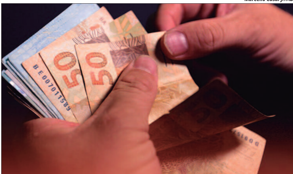
Segundo estimativas do Dieese, salário extra injetará R$ 321,4 bilhões na economia

Segundo a Lei 4.090 de 1962, que criou a gratificação natalina, têm direito ao déci-