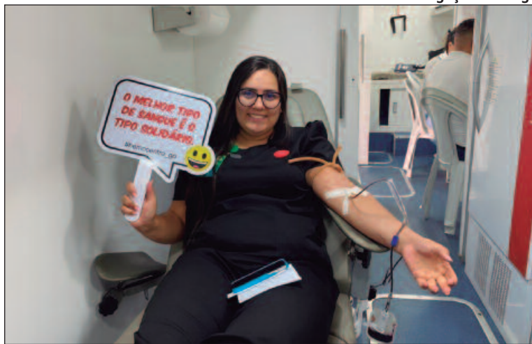
Data destaca a relevância de gestos voluntários que salvam vidas e incentivam a solidariedade