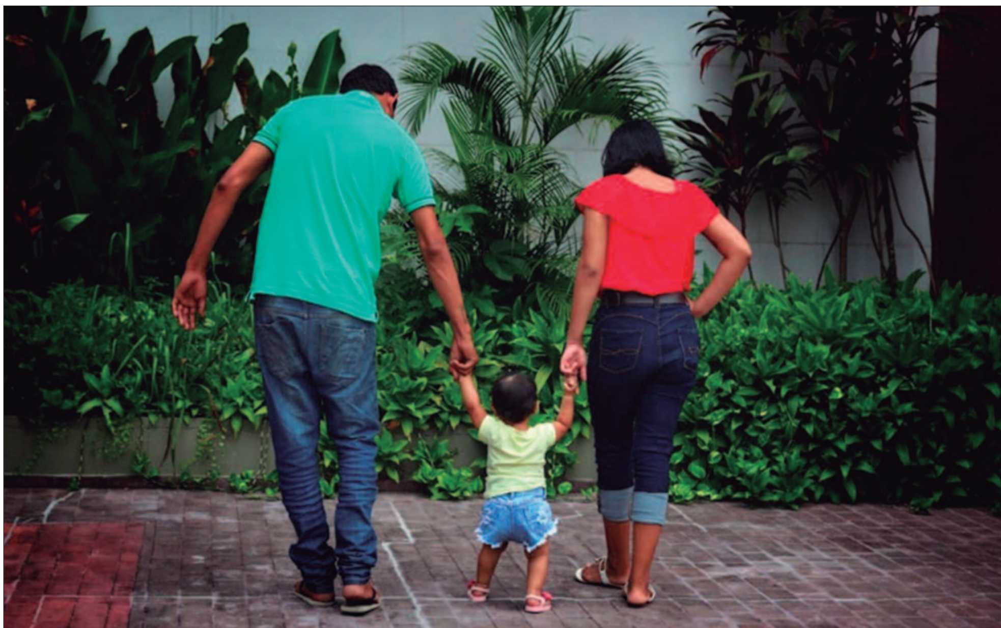
CNJ lançou ferramenta de busca ativa que visa otimizar o processo, garantindo o direito à convivência familiar e comunitária