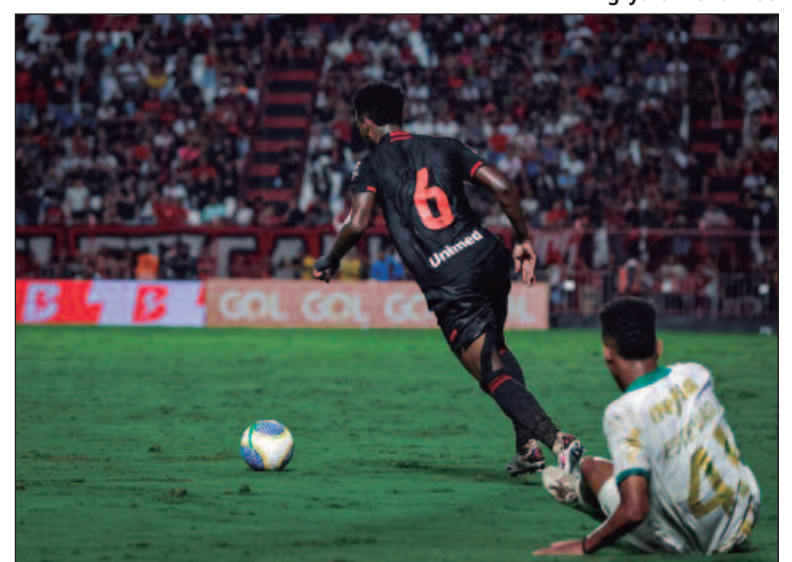
Dragão pode influenciar diretamente na disputa pelo título do Brasileirão 2024

Estão na disputa pelo título Palmeiras, Botafogo, Fortaleza, Flamengo e Internacional. Com apenas três rodadas restantes, o Atlético-GO já enfrentou o Palmeiras e ainda pegará o Fortaleza, ambos os confrontos em Goiânia, no estádio Antônio Accioly, o que