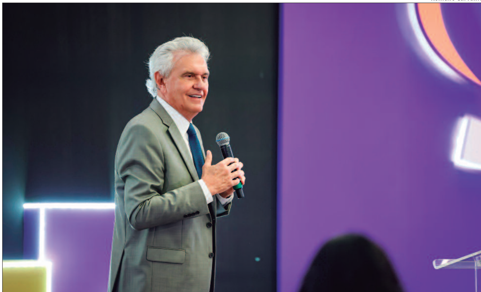
O político também considerou “inadmissível” e “inaceitável” uma articulação de assassinato a qualquer autoridade

Caiado disse ser “inadmissível” e “inaceitável”, uma articulação de assassinato de autoridades. Ele é um dos que defende anistia para os envolvidos nos ataques de 8 de ja-