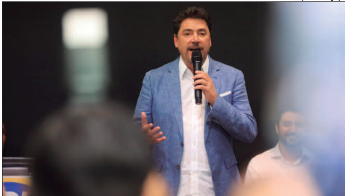
Senador pode disputar governo de Goiás sem precisar deixar o mandato e já aparece com força

“O senador Wilder, que foi eleito em 2022 para mandato até 2030, poderá disputar o governo em 2026 sem necessidade de desincompatibilização do cargo atual. Isso, porque a exigência de renúncia do mandato parlamentar somente se aplica aos casos onde o mandato ultrapassa o período do novo cargo pretendido, conforme expressa a redação do artigo 1º, §4º da Lei das Inelegibilidades (LC 64/90)”, inicia. “Como seu mandato de senador vai até 2030 e o man-