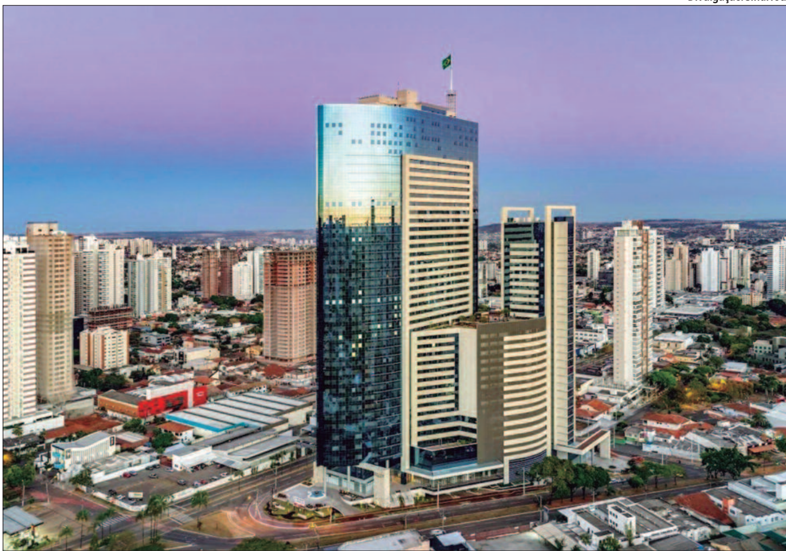
Dados do Censo Hoteleiro de 2022 mostram que 57% dos turistas que chegam à cidade têm razões de saúde entre os principais motivos da visita