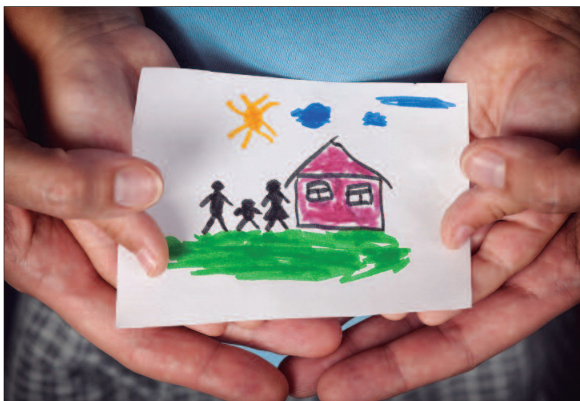
Atualmente, existem mais de 5 mil crianças em processo de adoção, e mais de 32 mil famílias em busca de adotar

Edvania detalha como funciona o processo de triagem para as famílias interessadas. “Quando a família pretendem