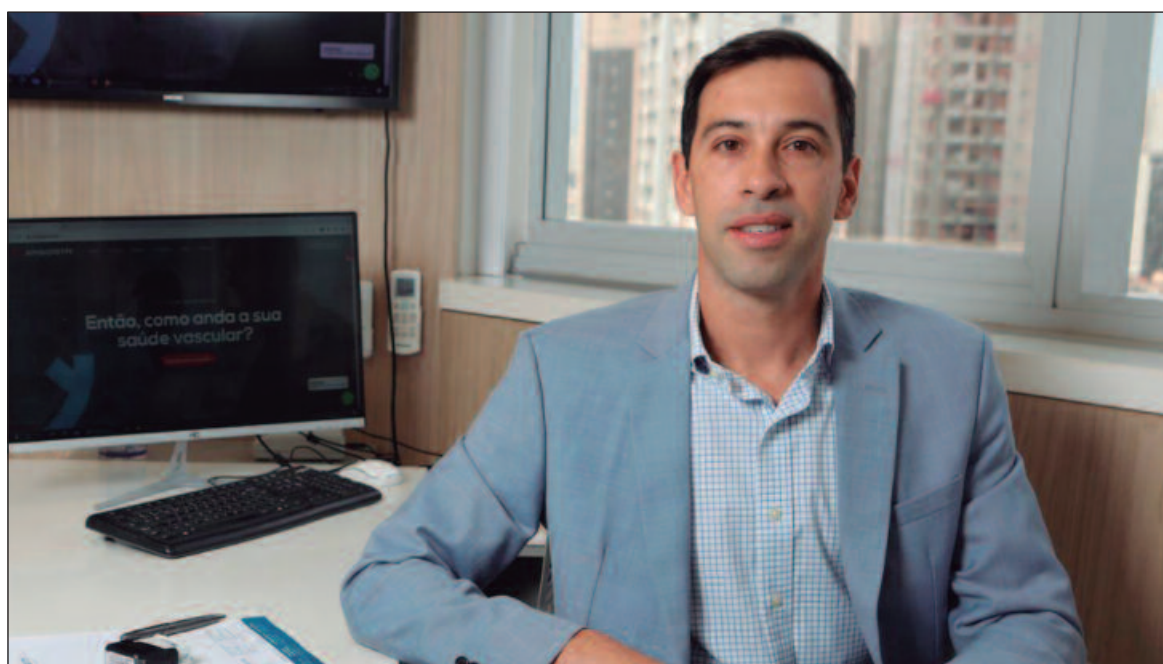
Angiologista explica que as varizes podem ser causadas por uma combinação de fatores hereditários

O diagnóstico das varizes é realizado por meio de um processo que combina coleta de histórico clínico, exame físico e exames complementares. O