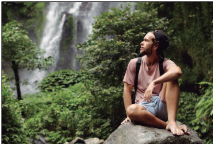
A conexão com o verde revitaliza o corpo e a mente