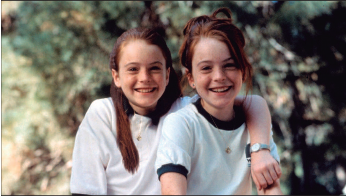
A atriz de Hollywood optou por não revelar os segredos de sua beleza