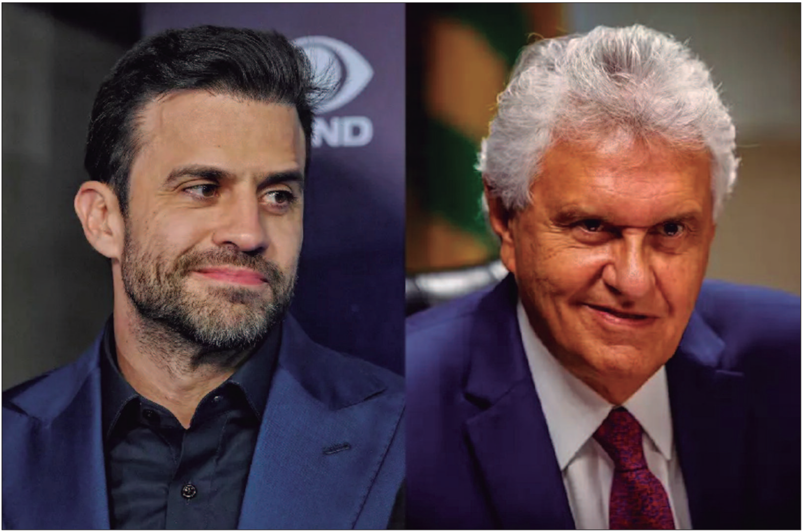
O intuito de Marçal seria viabilizar seu projeto para disputar a presidência, visto que o União Brasil é a segunda maior sigla de direita na Câmara

É preciso dizer, a questão Marçal no União Brasil ainda depende de processos que o tornem inelegível. Um dos casos que pode impedi-lo de concorrer ao Planalto em 2026 foi a divulgação de laudo médico falso contra Guilherme Boulos (PSOL) para tentar associar o então candidato à prefeitura de São Paulo ao uso de drogas. A publicação ocorreu na véspera do primeiro turno das eleições.