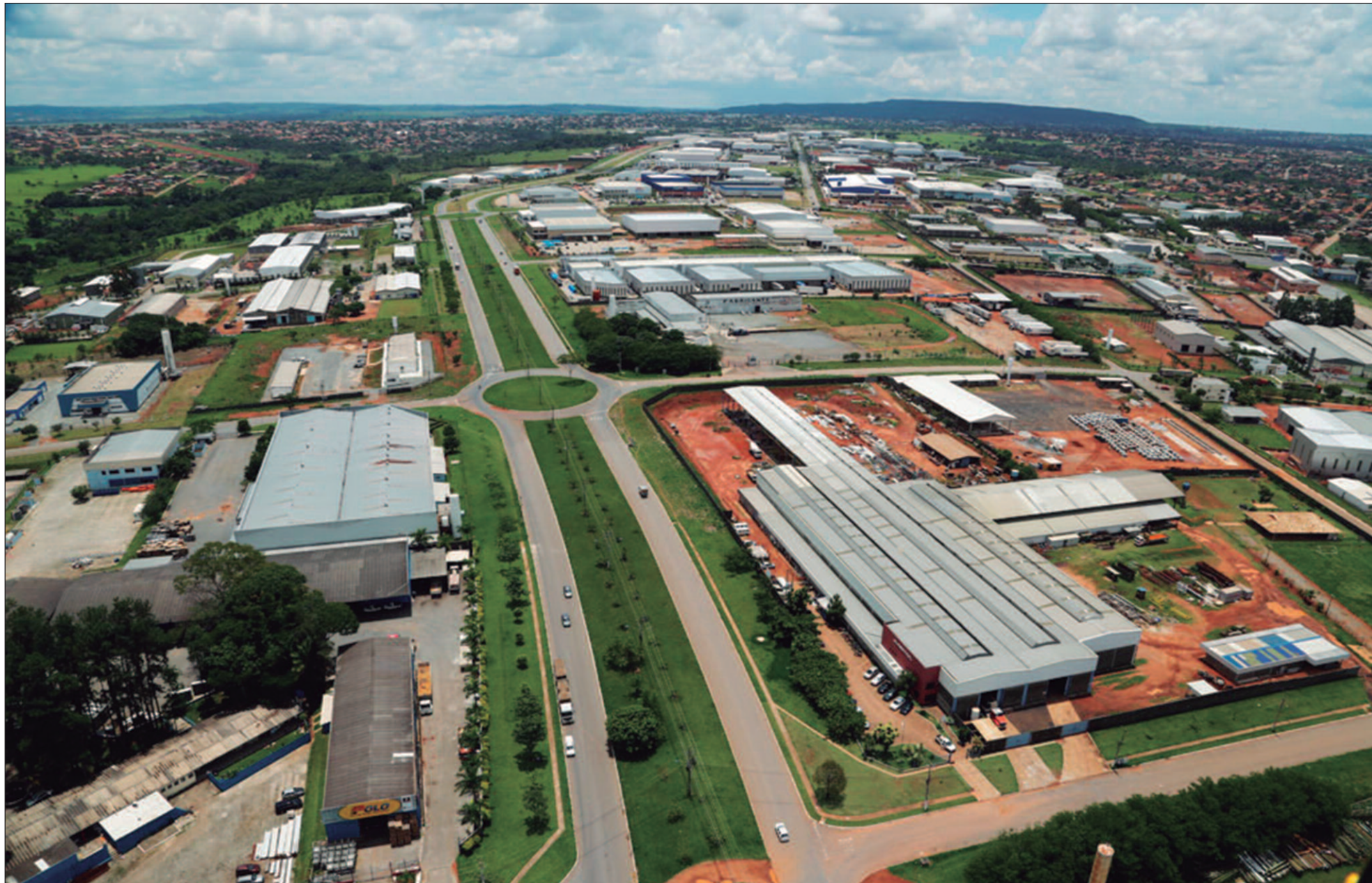
Prefeito eleito de Aparecida de Goiânia, Leandro Vilela terá como desafio fortalecer a administração e aprimorar a transparência no uso dos recursos públicos