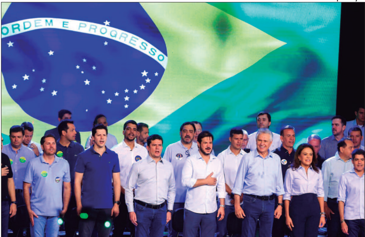
A escolha da capital baiana é vista como a oportunidade de o governador ampliar a sua visibilidade nacional

Esse tema é particularmente relevante na Bahia, que enfrenta altos índices de violência. Em 2023, o estado liderou em homicídios no Brasil, com 4.848 casos, segundo o Fórum