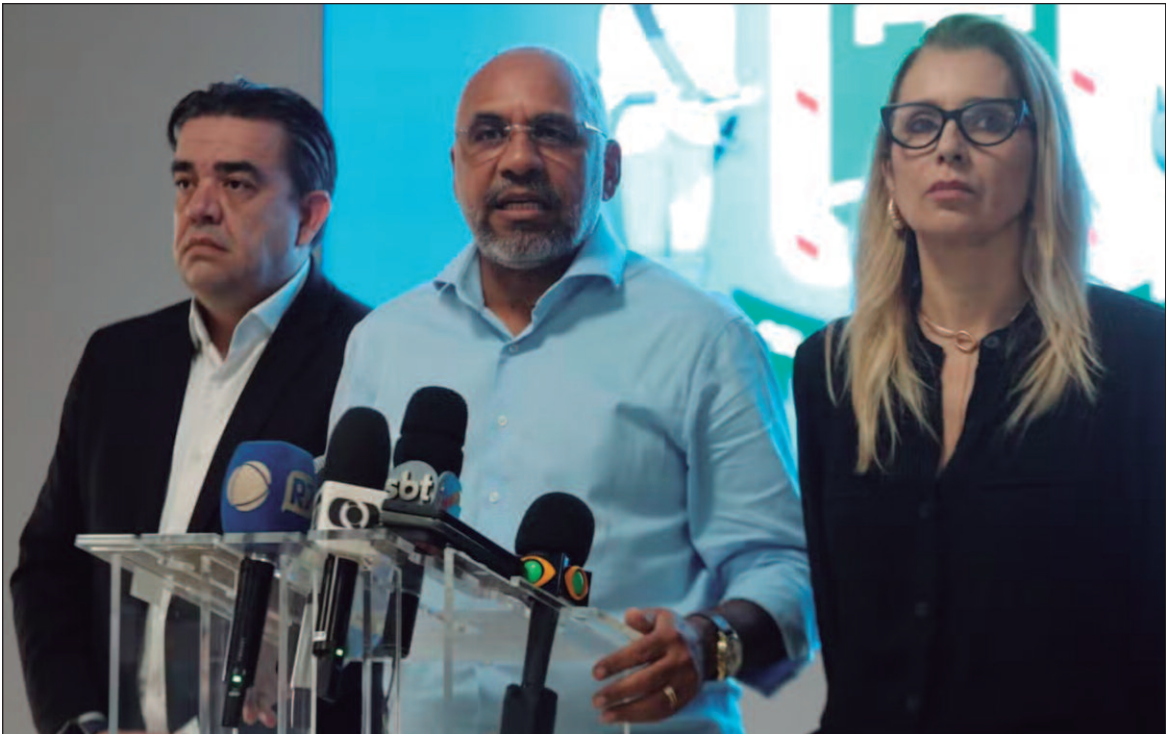
Com pouco mais de 30 dias para o fim da gestão, prefeito precisou encontrar novo nome para pasta