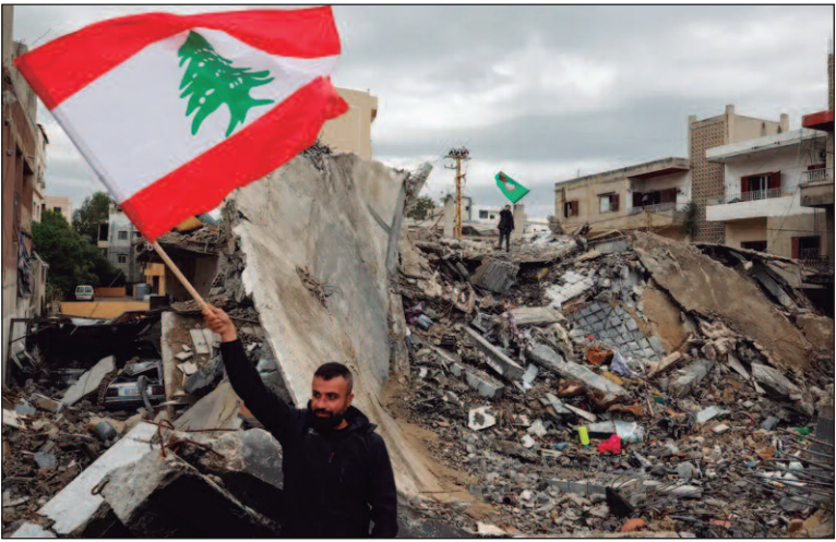
Grupo palestino se ofereceu para ajudar a encerrar a guerra no enclave

O Hamas considera que o acordo do Hezbollah com Israel, “sem cumprir as condições que o inimigo estabeleceu, é um marco importante para destruir as ilusões de Netanyahu de mudar o mapa do Oriente Médio”. Inicialmente, Israel pretendia destruir completamente as capacidades militares do Hezbollah. O grupo armado palestino também saudou a atuação do grupo libanês. “Elogiamos o papel fundamental desempenhado pela Resistência Islâmica no Líbano, em apoio à Faixa de Gaza e à resistência palestina, e os grandes sacrifícios feitos pelo Hezbollah e sua liderança, liderados pelo falecido secretário-geral Sayyed