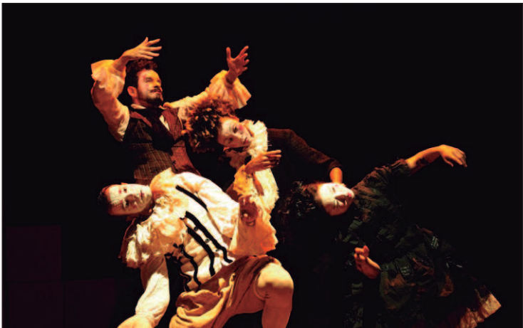
Trabalho, voltado para crianças, traz bonecos que exploram emoções em uma aventura repleta de dança e brincadeiras

e participou da New York Art Book Fair no MoMa, Nova York. A artista também participou de residências artísticas no Núcleo de Artes Visuais do Centro Oeste, em Goiás, e na Argentina. Entrada gratuita. Quando: quinta-feira (28). Onde: Galeria Sebastião dos Reis, Centro Cultural Octo Marque, Rua 4, 515, Ed. Partenon Center, Sobreloja. Horário: 09h às 17h.