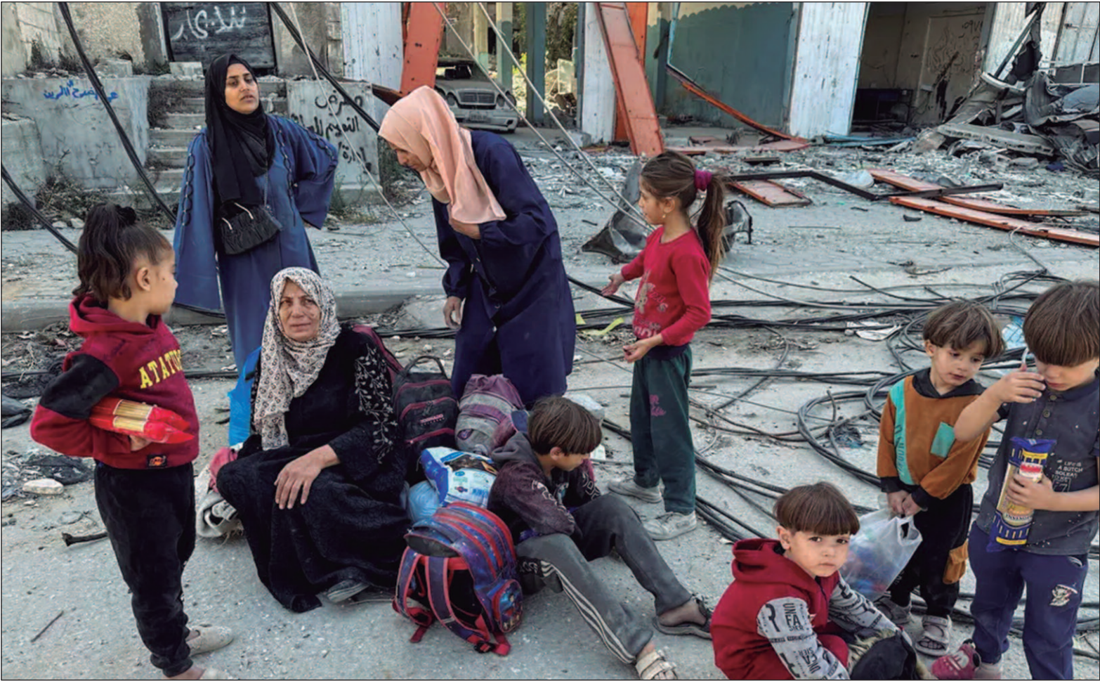
“Nossa equipe em Gaza tem tentado, desesperadamente, por quase dois meses, alcançar civis famintos”, disse o diretor-executivo da Oxfam

O termo limpeza étnica é usado para descrever a remoção ou eliminação de determinados grupos étnicos de uma região. A Oxfam faz parte de um grupo de agências internacionais que denunciam que são impedidas de entrar no norte de Gaza desde que Israel intensificou o cerco ao local, a partir de 6 de outubro. “Israel está construindo infraestrutura para uma presença militar de longo prazo - uma anexação de fato da terra - e destruindo qualquer esperança restante de uma solução justa e pacífica”, denuncia Behar.