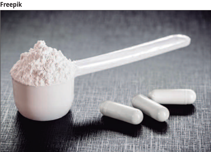
Conheça mais sobre o suplemento que tem se tornado um aliado na rotina de quem busca uma vida mais saudável