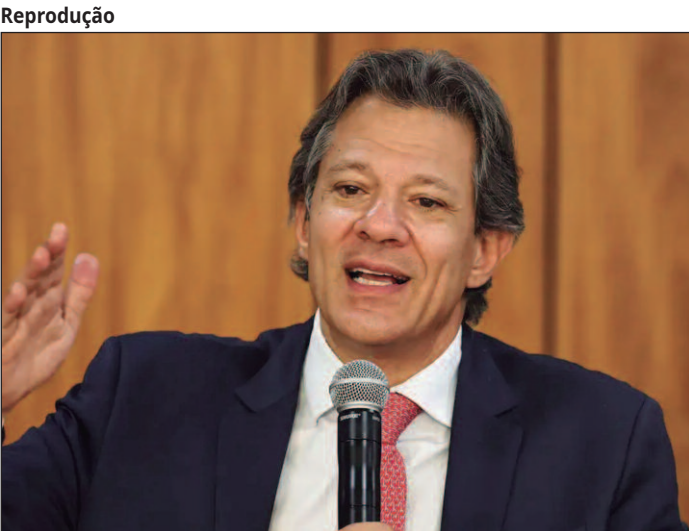
Pacote fiscal, que também foi anunciado, inclui limite para reajustes do salário mínimo e cortes de gastos