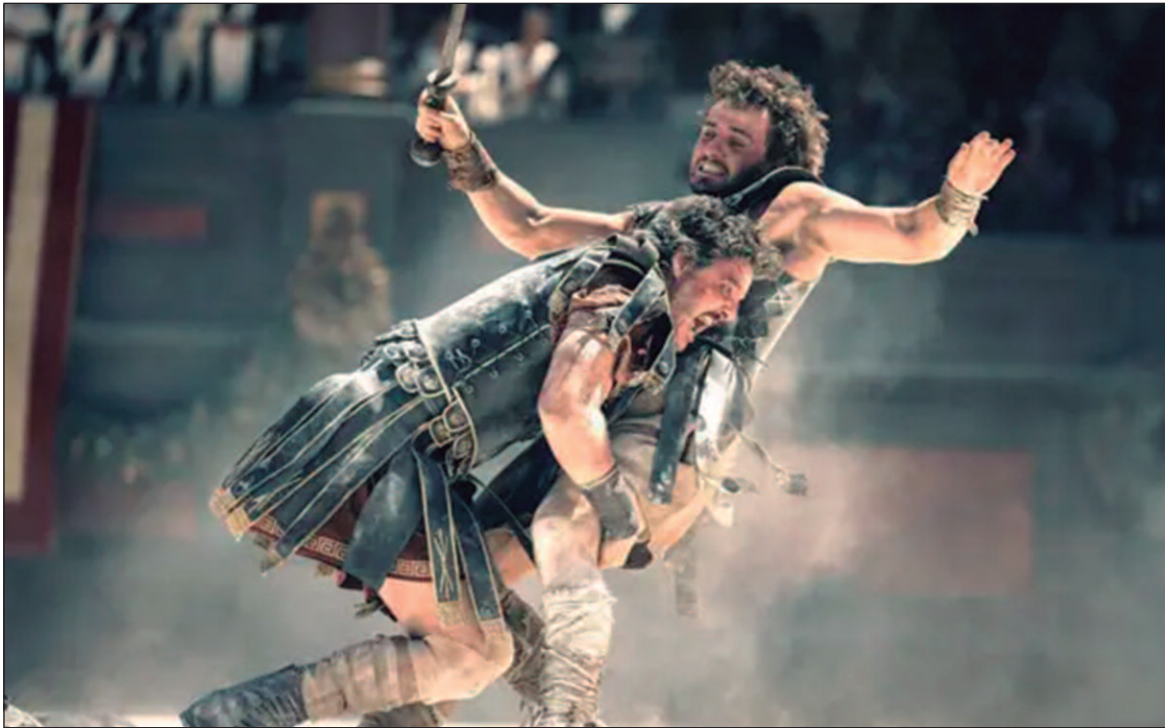
'Gladiador 2' é um filme dirigido por Ridley Scott com Paul Mescal e Pedro Pascal

ção: 2h17. Direção: Walter Salles. Elenco: Fernanda Torres, Fernanda Montenegro, Selton Mello. Gênero: drama, suspense. Cinemark Flamboyant: 13h40, 17:05, 20h00, 21h15. Cinemark Passeio das Águas: 18h00. Kinoplex Goiânia: 13h00, 15h45, 18h10, 21h15. MovieCom Buriti: 16h10, 18h50. Cineflix Aparecida: 19h10. Moviecom Buriti: 16h00, 18h40, 21h15.