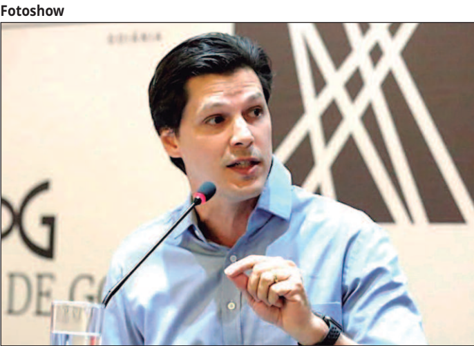
Vice-governador chegará às urnas com respaldo de seu mentor político, Ronaldo Caiado