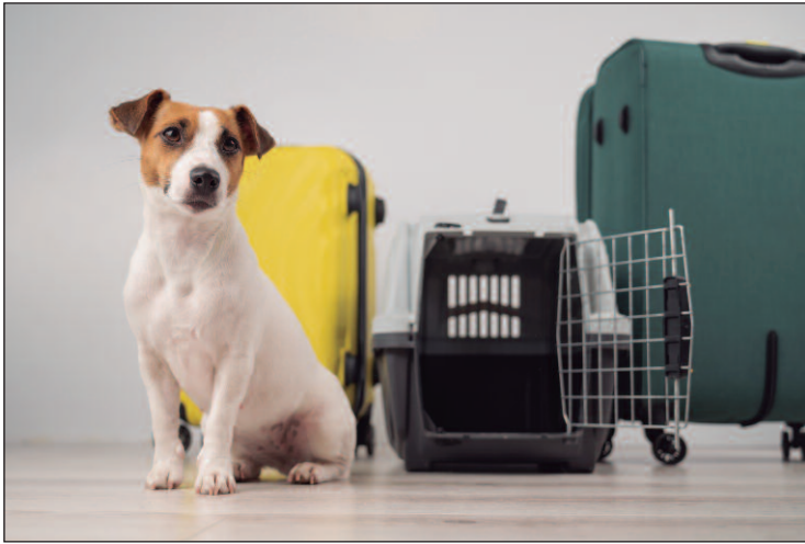
Locais adequados de transporte garantem segurança e conforto ao animal