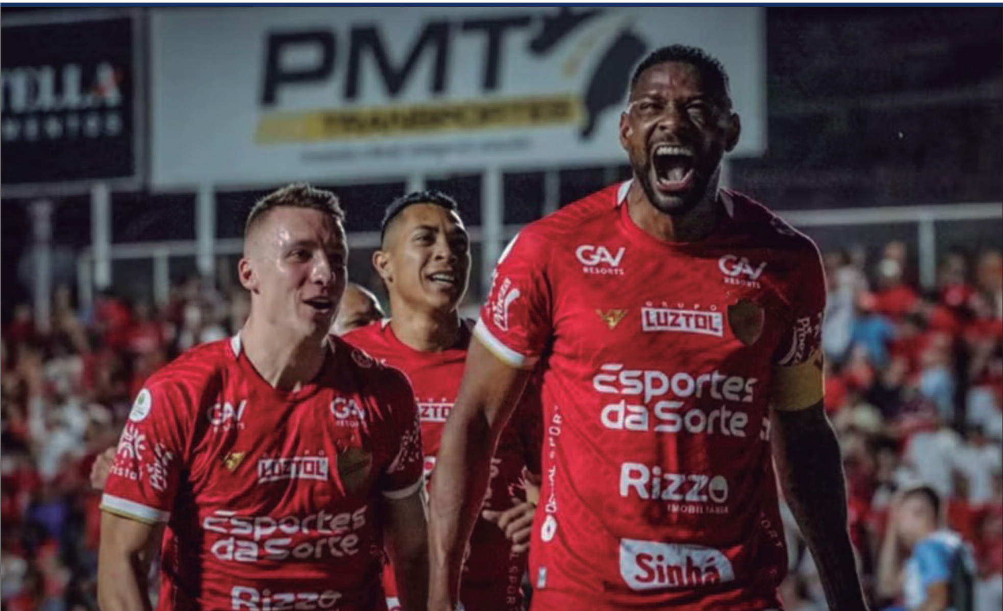
Novos nomes podem ser anunciados em breve no elenco do Vila Nova para a temporada 2025