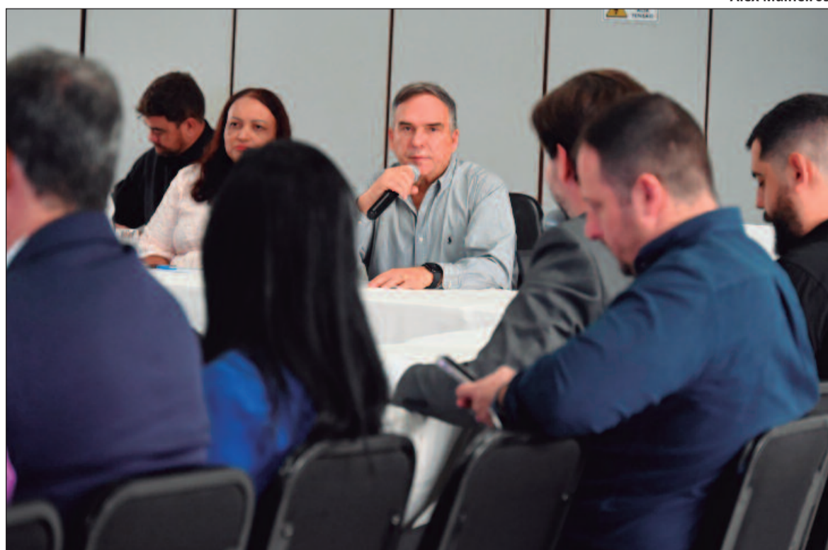
Representantes das duas gestões se reuniram com órgãos como a Sedec, CGM, PGM e o Procon

O órgão também expôs termos de cooperação técnica fir-