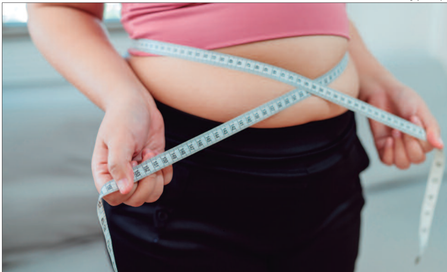
Os dados fazem parte de uma pesquisa divulgada pela Fundação Oswaldo Cruz (Fiocruz) durante o Congresso Internacional sobre o tema

“A obesidade é reconhecida como uma doença crônica multifatorial, caracterizada pelo acúmulo excessivo de gordura corporal que pode prejudicar a saúde. Sua etiologia é complexa, envolvendo fatores genéticos, metabólicos, comportamentais e ambientais, que influenciam a regulação do balanço energético”, afirma a