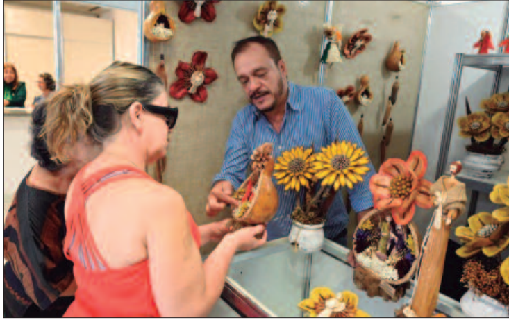
Feira de artesanato, Goiás Feito à Mão realizará edição especial com mais de 30 estandes variados, incluindo esculturas

uma temporada mágica com o Natal do Bem 2024, que oferece 53 dias de programação gratuita no Centro Cultural Oscar Niemeyer. O evento espera atrair cerca de 1,5 milhão de visitantes, proporcionando uma experiência natalina única para moradores e turistas. O evento é projetado para ser inclusivo, com rampas de acesso, piso tátil e intérpretes de Libras, garantindo que todos possam participar. Além disso, equipes de saúde e segurança estão