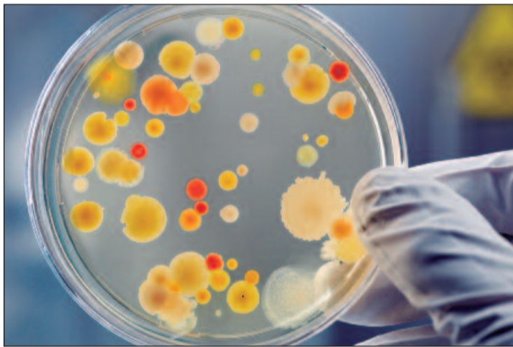
De acordo com a Organização Mundial de Saúde, a resistência bacteriana foi a causa direta de 1,27 milhão de mortes em 2019

ria", tornando-se multirresistente e espalhando-se rapidamente. Ela é resistente aos carbapenêmicos, antibióticos de última linha usados apenas em casos críticos, o que agrava ainda mais a dificuldade de tratamento.