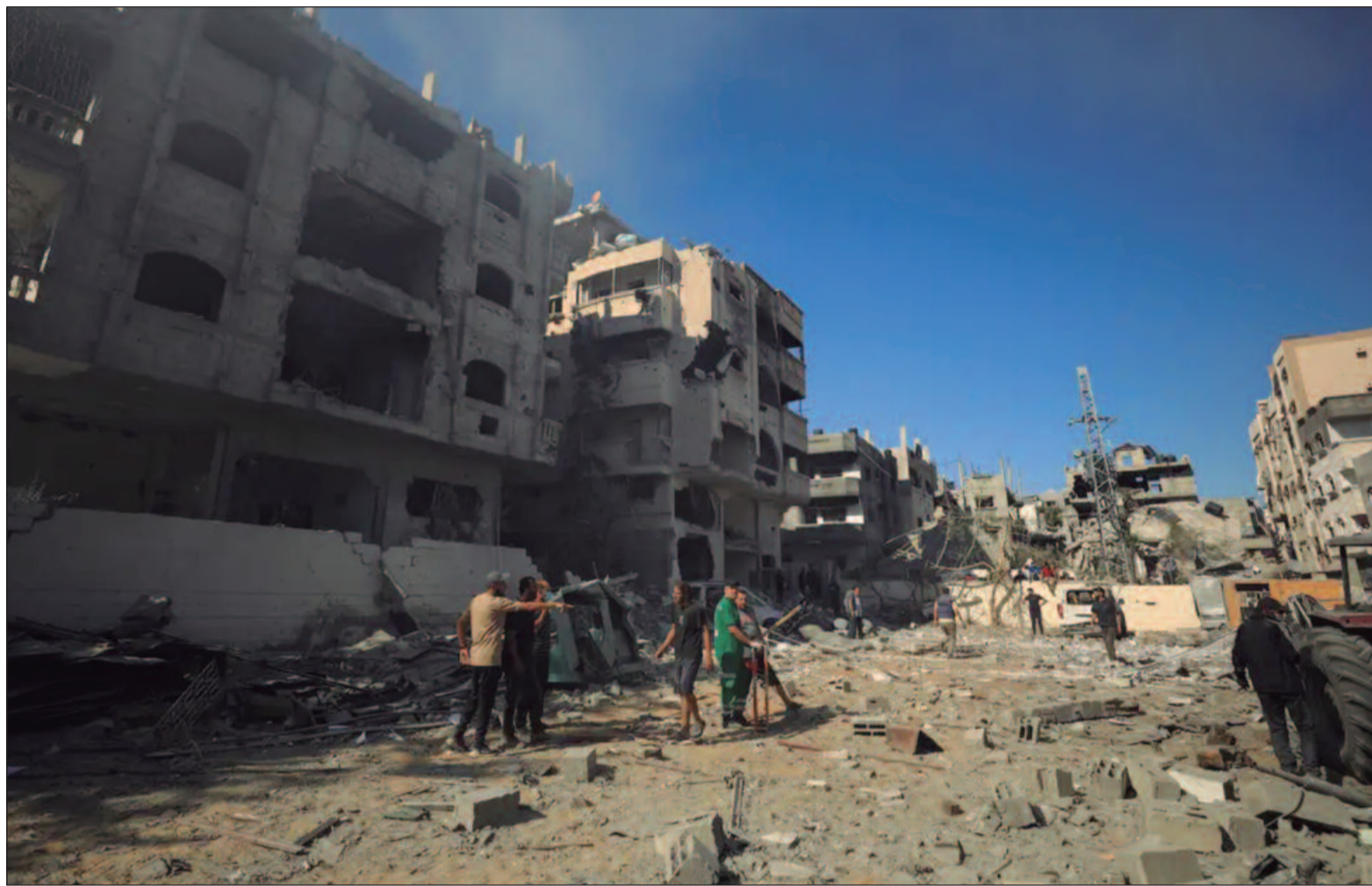
caminho que estamos sendo arrastados atualmente é conquistar, anexar e realizar uma limpeza étnica”, afirmou Moshe ao Democrat TV

“As FDI [Forças de Defesa de Israel] atuam de acordo com o direito internacional e evacuam uma população de acordo com a necessidade operacional e temporariamente,