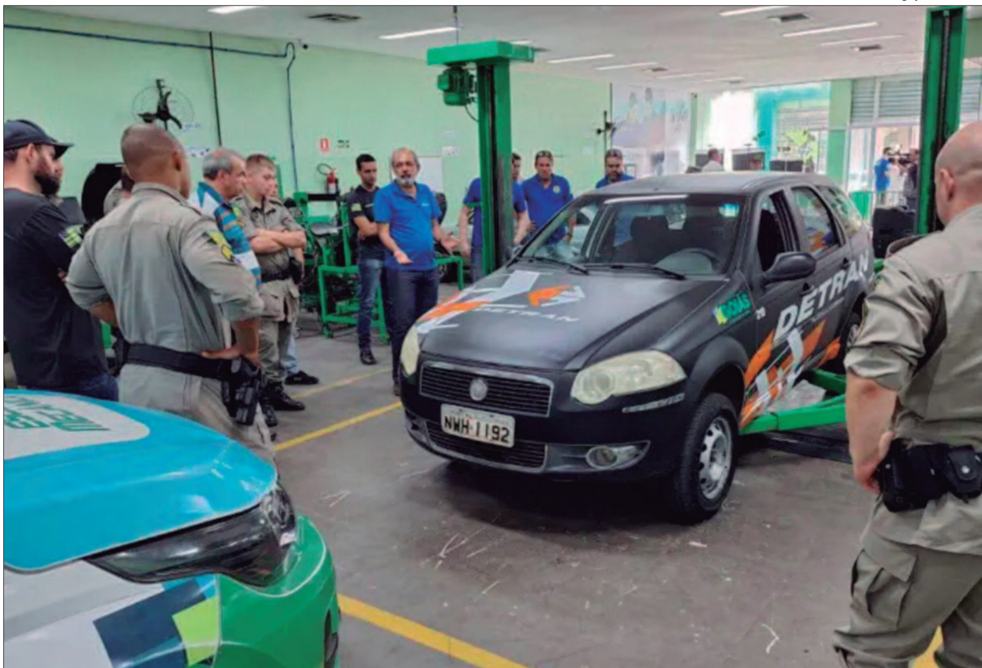
Código exige que todas as peças comercializadas possuam um selo de rastreamento, comprovando sua origem