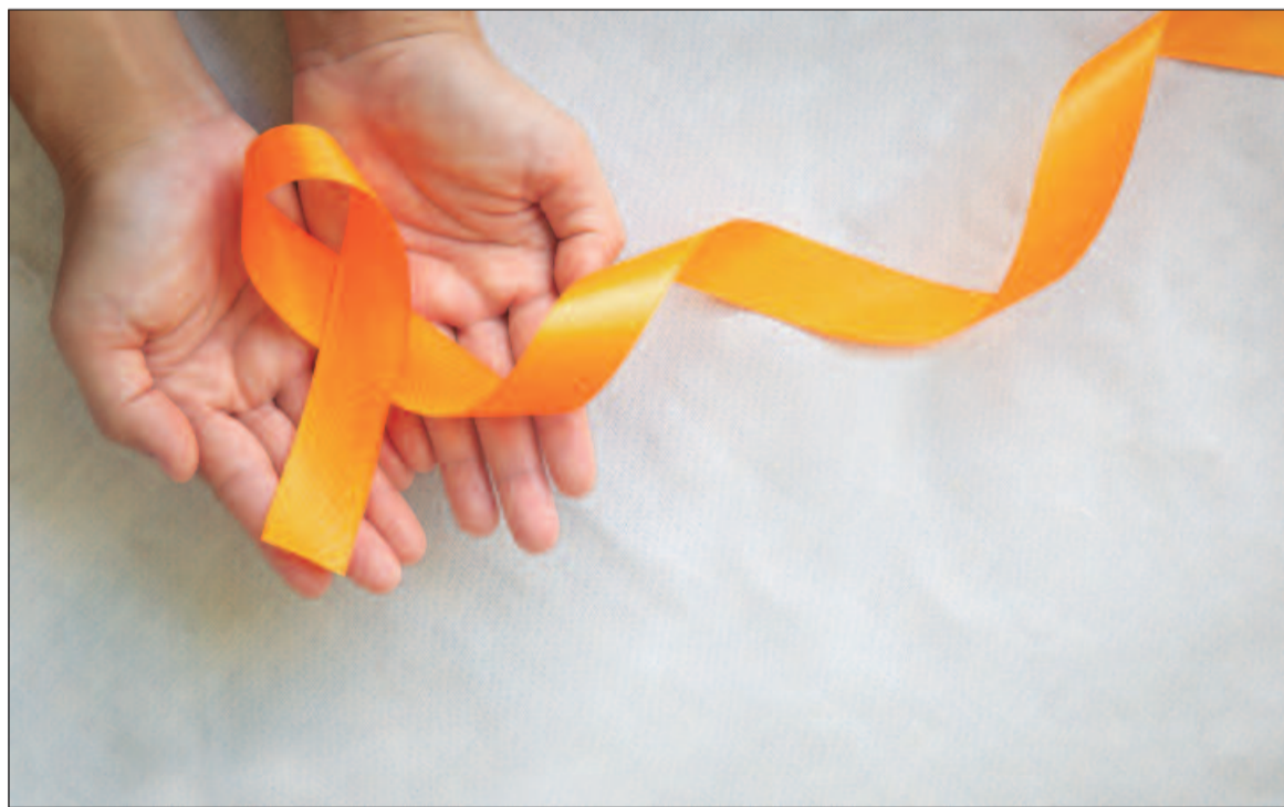
Especialista diz que campanha Dezembro Laranja é fundamental para educar a população

De acordo com o INCA, o câncer de pele não melanoma afeta mais mulheres, com cerca de 118.570 casos anuais, em comparação aos homens, que abrangem 101.920 casos por ano. Uma explicação para essa maior incidência entre as mulheres é que elas costumam procurar o médico com mais frequência, o que possibilita um diagnóstico precoce e mais frequente. Ainda assim, os cânceres de pele, em geral, são causados principalmente pela exposição crônica à radiação ultravioleta, que provoca danos cumulativos no DNA das células. O risco ainda é maior em pessoas acima de 60 anos, que tiveram exposi-