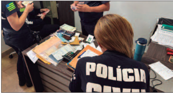
Casal aplicou golpe em produtores rurais de Rio Verde