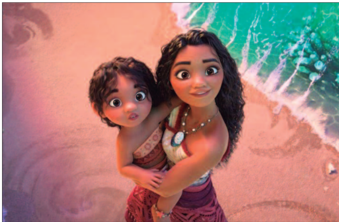
Depois de receber um chamado inesperado de seus ancestrais, Moana deve viajar a lugares perigosos

Moana 2 (Moana 2, 2024, EUA) Duração: 1h 40min. Direção: David G. Elenco: Any Gabrielly, Auli'i Cravalho, Saulo Vasconcelos. Gênero: Aventura, Animação, Família. Cinemark Flamboyant: 11h50, 12h10, 13h10, 13h40, 14h10, 15h, 15h40, 16h10, 16h40, 17h30, 18h10, 18h40, 19h10, 20h, 20h40. Cinemark Passeio das Águas: 12h, 13h10, 13h50, 14h30, 15h, 15h40, 16h20, 17h, 17h30, 18h10, 18h50, 19h30, 20h, 20h40. Kinoplex Goiânia: 13h, 14h, 14h30, 15h10, 16h10, 16h40, 17h20, 18h20, 18h50, 19h30, 20h30. Cineflix Aparecida: 14h30, 14h55, 16h50, 17h05, 17h30, 19h10, 19h15, 19h40, 21h30. Moviecom Buriti: 14h50, 15h50, 17h, 18h, 18h40,