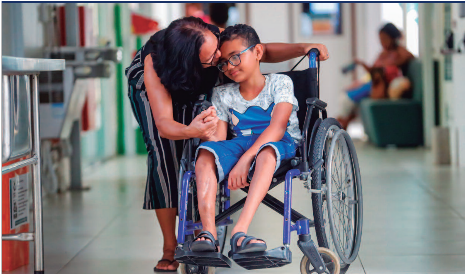
As pessoas com deficiência enfrentam barreiras que vão além das físicas, como o preconceito e exclusão social