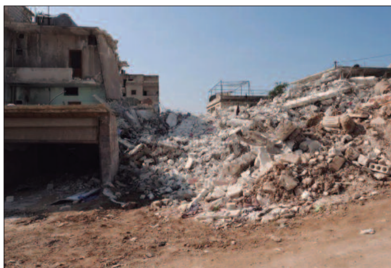
Pelo menos 25 pessoas morreram no norte, entre elas 10 crianças

Segundo os Capacetes Brancos, o número total de mortos em ataques sírios e russos desde 27 de novembro subiu para 56, incluindo 20 crianças. O Exército sírio e a Rússia, sua aliada, têm como alvo os esconderijos de grupos