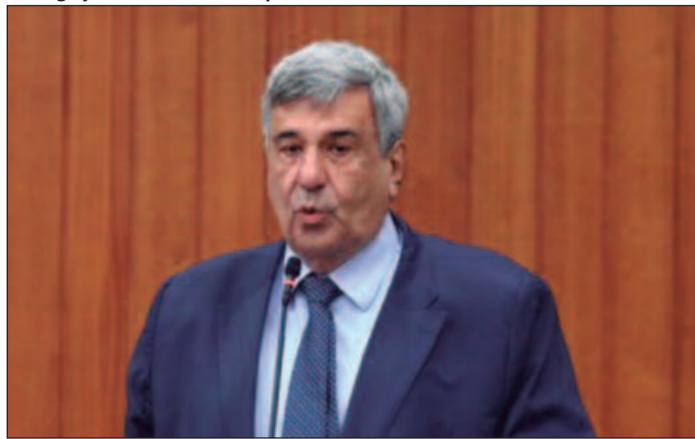
Ex-secretário de Saúde da capital passou por angioplastia