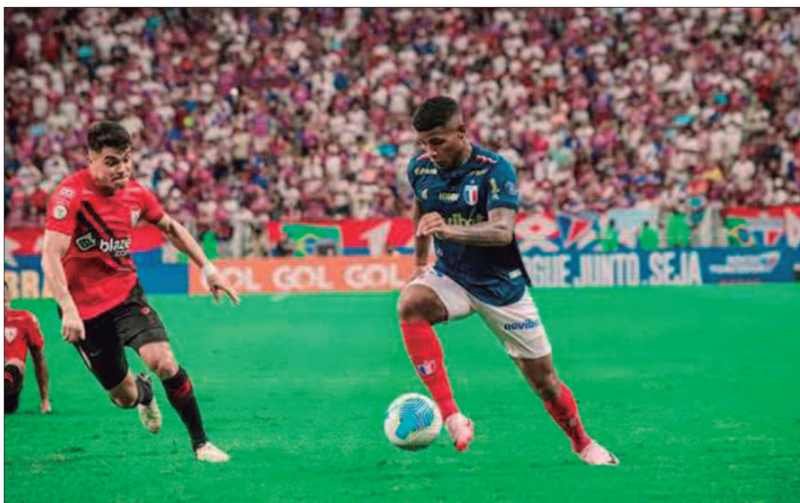
Atlético-GO e Fortaleza se enfrentam pela penúltima rodada do Brasileirão

vive uma situação completamente diferente. Em 5º lugar com 65 pontos, o Leão já garantiu vaga direta na fase de grupos da Libertadores 2025 e agora mira melhorar sua posição histórica no Brasileirão.