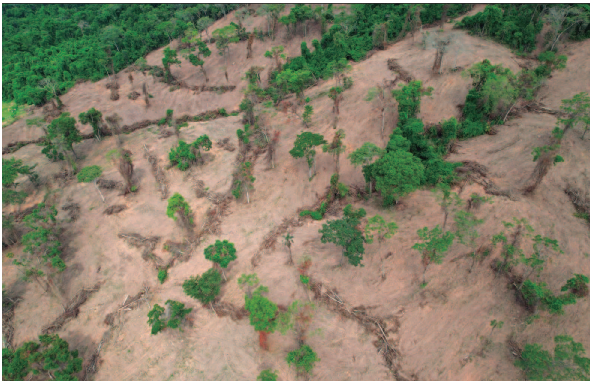
O sistema Prodes, do Inpe, revelou que Goiás registrou em 2024 o menor índice de desmatamento desde o início do monitoramento, em 2001