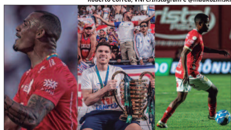
Roberto Corrêa, VNFC/Instagram e @maukozlinski

Assim como Halls, Arilson permanecerá no Vila Nova para a temporada de 2025 e cumprirá o contrato vigente, que se estende até o final do próximo ano. A transparência da continuidade do jogador reforça o planejamento do clube para manter peças importantes do elenco, especialmente atletas