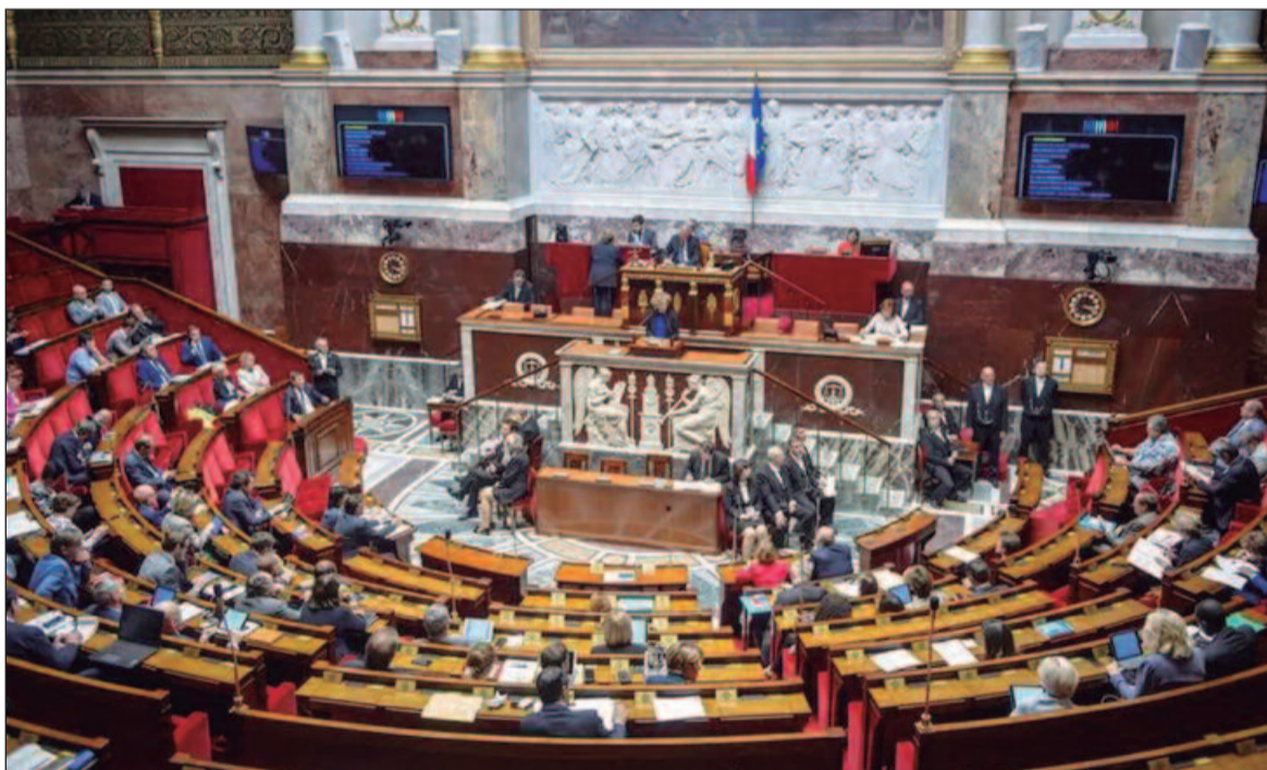
A esquerda e a extrema-direita juntas têm votos suficientes para derrubar Barnier