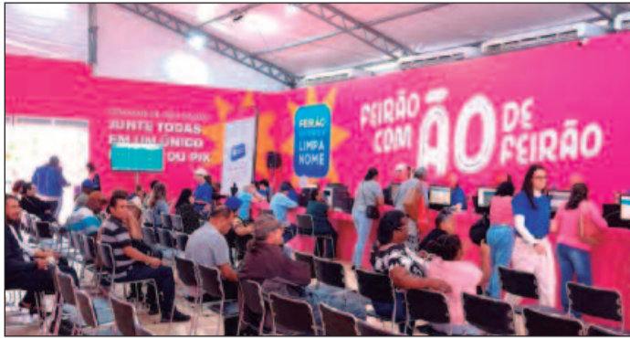
As ofertas do Feirão Limpa Nome do Serasa foram estendidas até dia 20 de dezembro