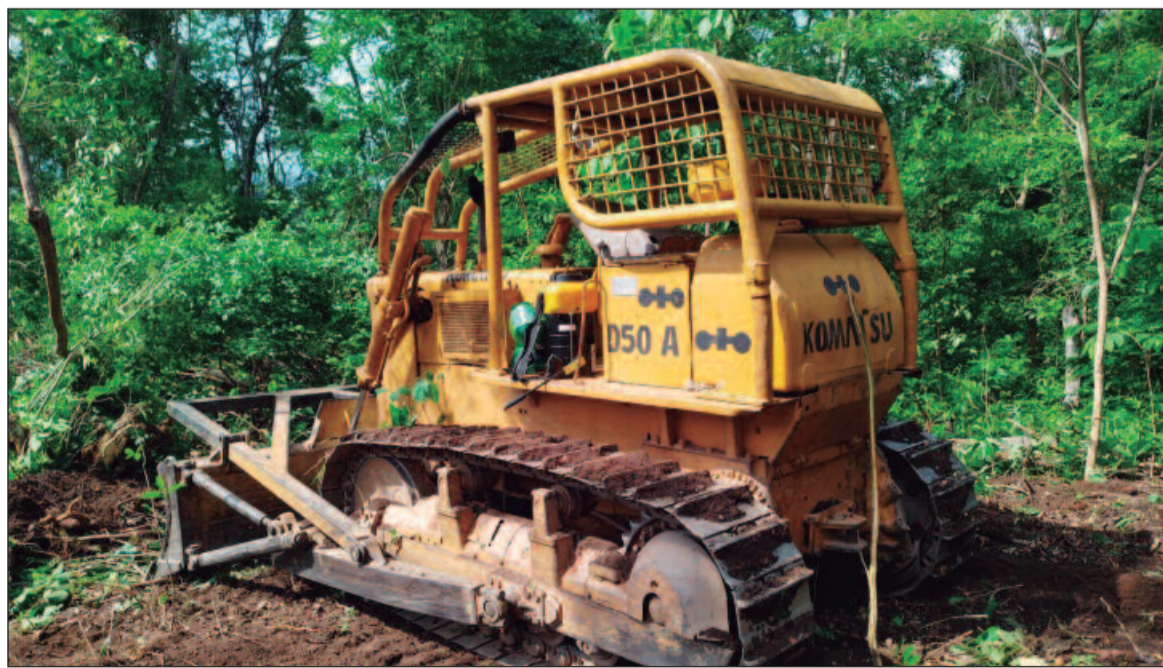
“Esses esforços de preservação devem ser integrados e contínuos”, diz especialista

O desmatamento em Goiás continua sendo uma preocu-