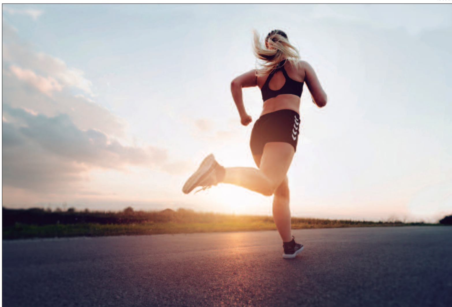
Exercícios regulares aumentam a produção de substâncias essenciais para o bem-estar que podem ser eficazes no combate à depressão

Os benefícios dos exercícios estão ligados à liberação de neurotransmissores como