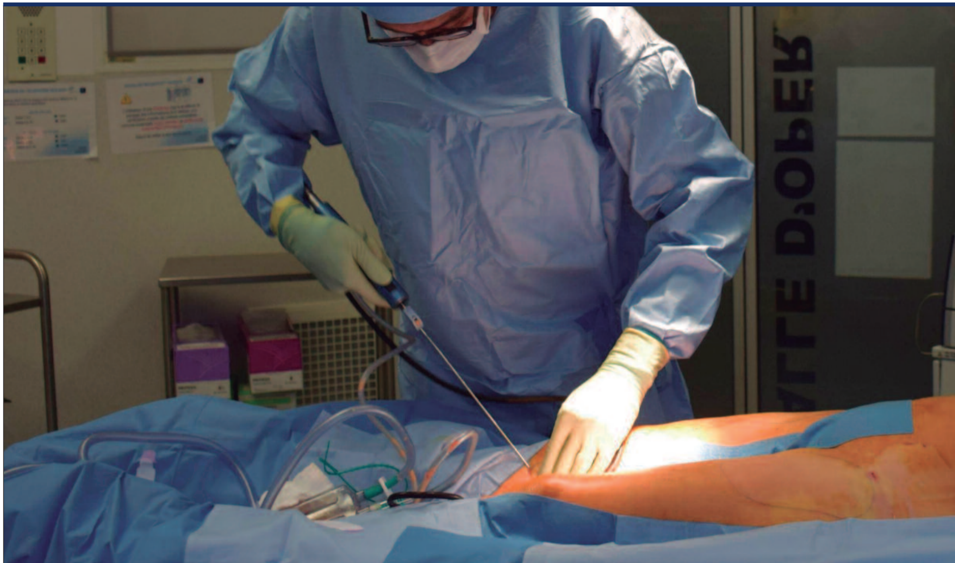
A lipoaspiração é um procedimento destinado à remoção de gordura localizada em áreas específicas do corpo