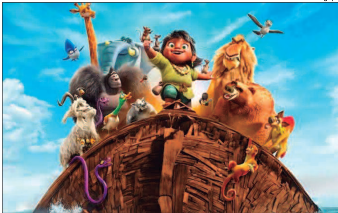
Arca de Noé é um filme animado e musical, fruto de uma colaboração entre Brasil e Índia

Moana 2 (Moana 2, 2024, EUA) Duração: 1h 40min. Direção: David G. Elenco: Any Gabrielly, Auli'i Cravalho, Saulo Vasconcelos. Gênero: Aventura, Animação, Família. Cinemark Flamboyant: 11h50, 12h10, 13h10, 13h40, 14h10, 15h, 15h40, 16h10, 16h40, 17h30, 18h10, 18h40, 19h10, 20h, 20h40. Cinemark Passeio das Águas: 12h, 13h10, 13h50, 14h30, 15h, 15h40, 16h20, 17h, 17h30, 18h10, 18h50, 19h30, 20h, 20h40. Kinoplex Goiânia: 13h, 14h, 14h30, 15h10, 16h10, 16h40, 17h20, 18h20, 18h50, 19h30, 20h30. Cineflix Aparecida: 14h30, 14h55, 16h50, 17h05, 17h30, 19h10, 19h15, 19h40, 21h30. Moviecom Buriti: