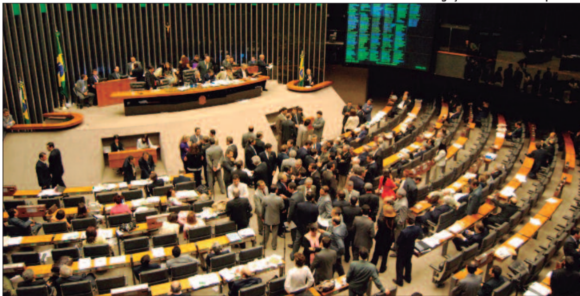
Matéria será votada nesta quarta-feira (4), podendo abrir caminho para novos investimentos no estado

Nelto explicou que a proposta trará um alívio significativo à dívida de Goiás, que atualmente soma R$ 24 bilhões, sendo mais da metade referente a juros. "Com uma auditoria, a real dívida seria de R$ 11,5 bilhões. O Propag permitiria que o estado reduza essa carga e amplie os investimentos em áreas essenciais", afirmou o parlamentar. Ele também destacou que a bancada goiana está 100% alinhada com o governador no apoio ao projeto.