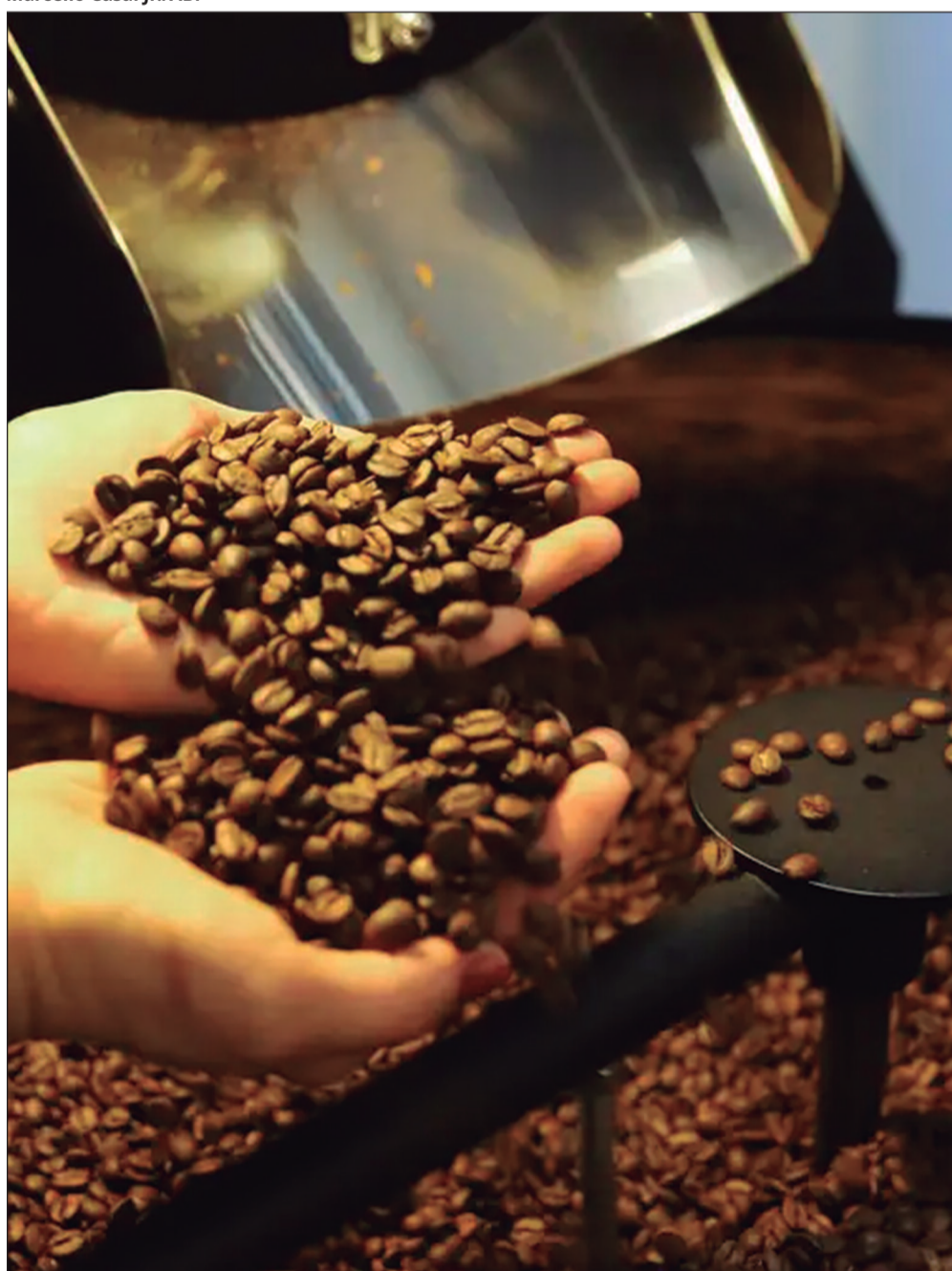
Marcello Casal Jr./ABr