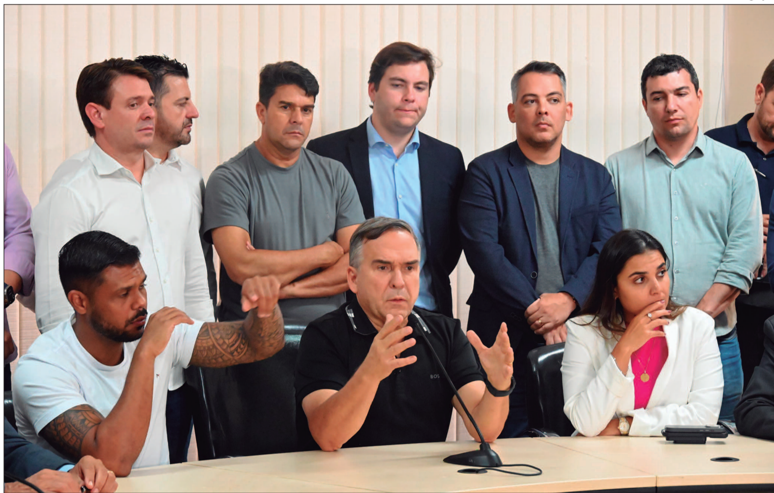
Prefeito eleito reforça que as mudanças foram pensadas para garantir a sustentabilidade da gestão com compromisso e responsabilidade

De acordo com o projeto, a Secretaria de Finanças reassume o conceito de Fazenda, em caráter mais amplo relacionado às diretrizes nacionais, assumindo a condução da política econômica municipal, e torna-se a Secretaria Municipal da Fazenda. A Secretaria de Mobilidade passa a se chamar Secretaria Municipal de Engenharia de Trânsito, a fim de ressignificar a gestão da mobilidade