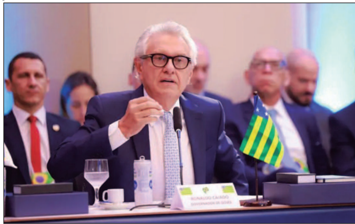
Governador defende manutenção da autonomia estadual