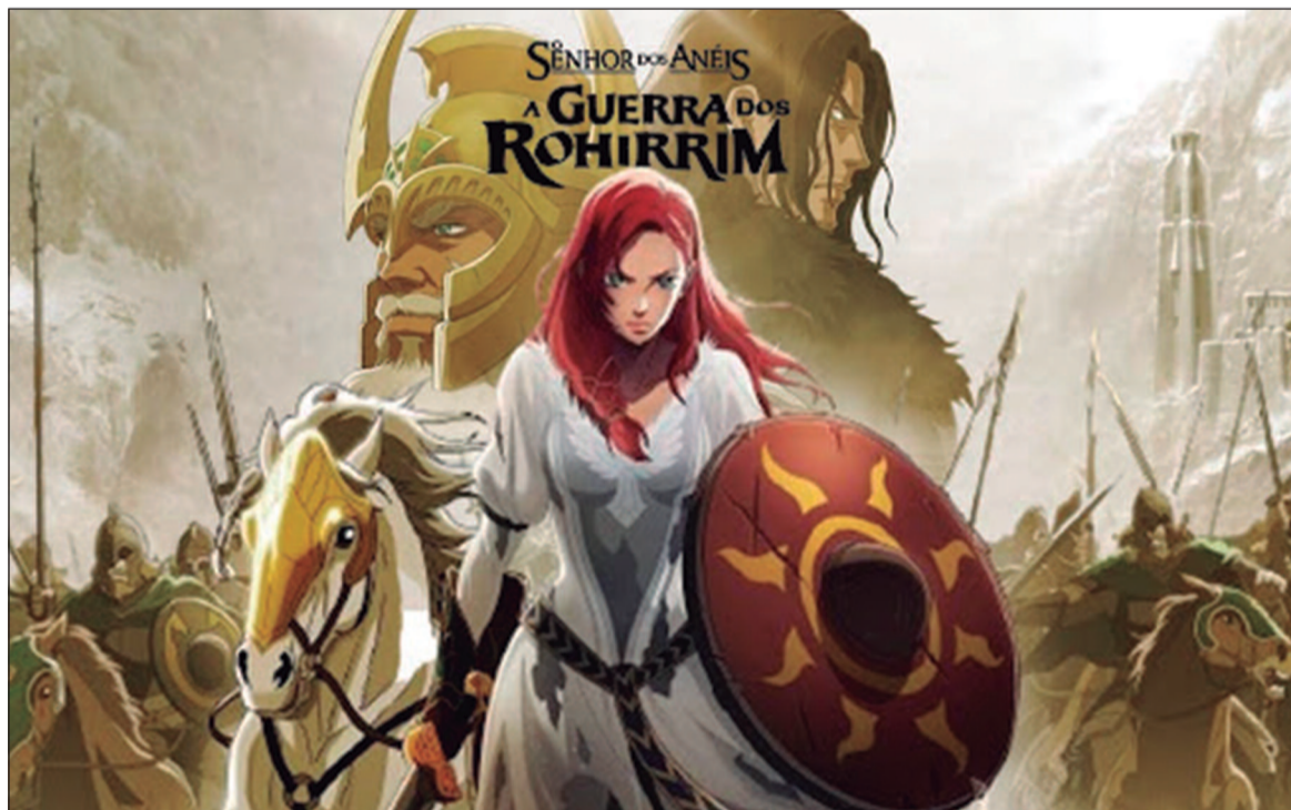
O Senhor dos Anéis: A Guerra dos Rohirrim acontece 183 anos antes das aventuras de Frodo e dos eventos da trilogia original de filmes, O Senhor dos Anéis

O Senhor dos Anéis: A Guerra dos Rohirrim (The Lord Of The Rings: The War Of the Rohirrim, 2024, EUA) Duração: 2h 14min. Direção: Kenji Kamiyama. Elen-