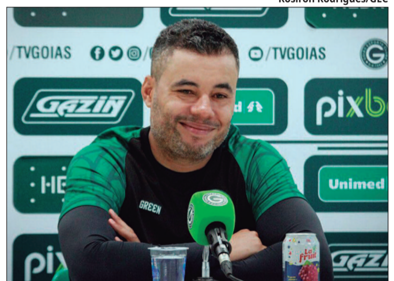
Jair Ventura retorna ao Verdão para comandar a equipe em busca de títulos e acesso à Série A

De acordo com o jornalista André Rodrigues, Leonardo Pacheco já iniciou suas atividades nesta segunda-feira (9). Sua missão será estabelecer um planejamento eficiente e reconquistar a confiança da torcida.