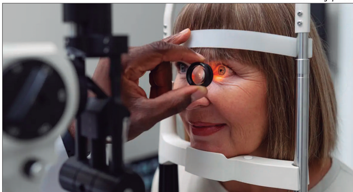
Este exame é realizado principalmente em pessoas com mais de 40 anos, pode detectar precocemente doenças como o glaucoma