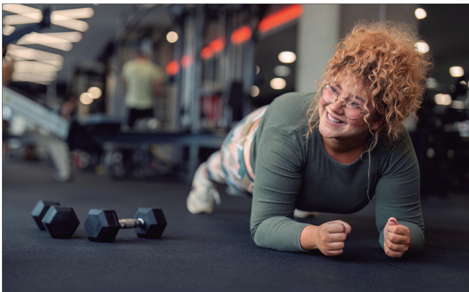
Melhorar a saúde metabólica e preservar funções cognitivas, pode ser uma aliada essencial para uma vida longa e saudável

Os benefícios da musculação estão amplamente documentados. Em termos de saúde metabólica, um estudo da Unicamp aponta que a musculação melhora a produção de insulina, sendo essencial no controle