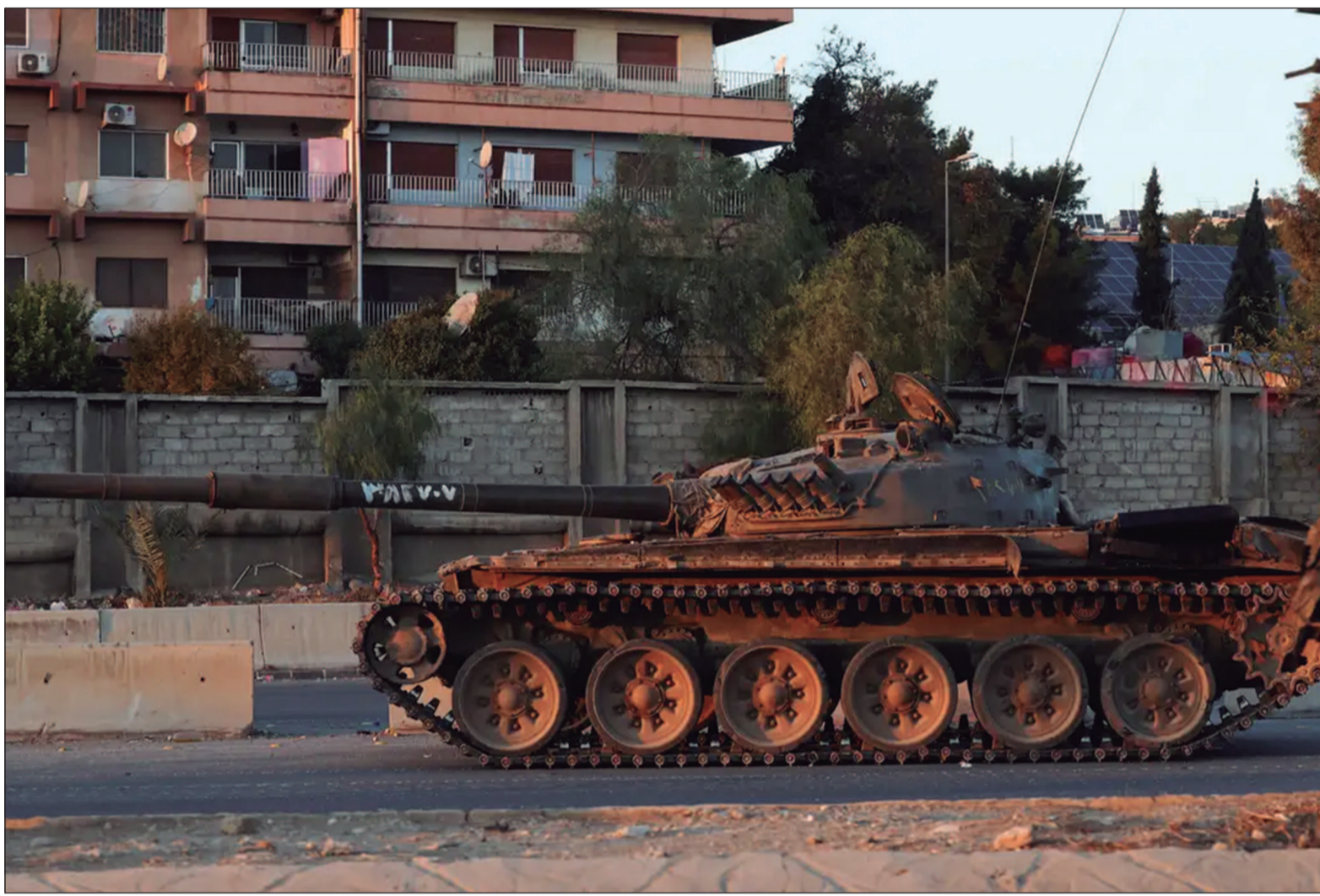
“Estima-se que os israelenses estão a 20 quilômetros de Damasco e avançando”, diz professor de relações internacionais

área montanhosa que fica entre as fronteiras de Israel, Síria e Líbano, próximo às Colinas de Golã.