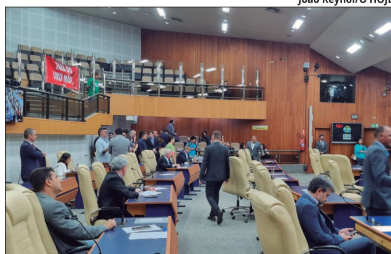
João Reynol/O HOJE