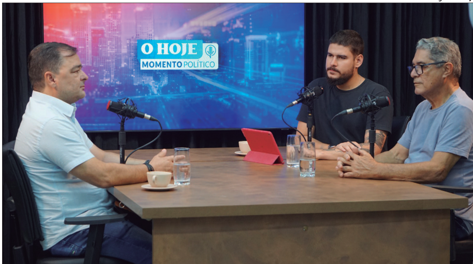
Prefeito eleito em Jataí falou das expectativas para o novo mandato, bem como das movimentações em busca de recursos para o ano que vem

Assim, ele afirmou que trabalhará para preparar sucessores, enfatizando a relevância de renovar lideranças e trazer novas perspectivas para a administração. Embora mantenha uma relação próxima com