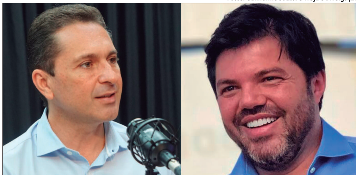
As posses de ambos os prefeitos estão confirmadas para a próxima quarta-feira (1º/1/2025)