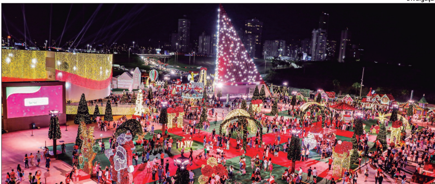
Uma celebração natalina gratuita que reúne arte, cultura e talento goiano