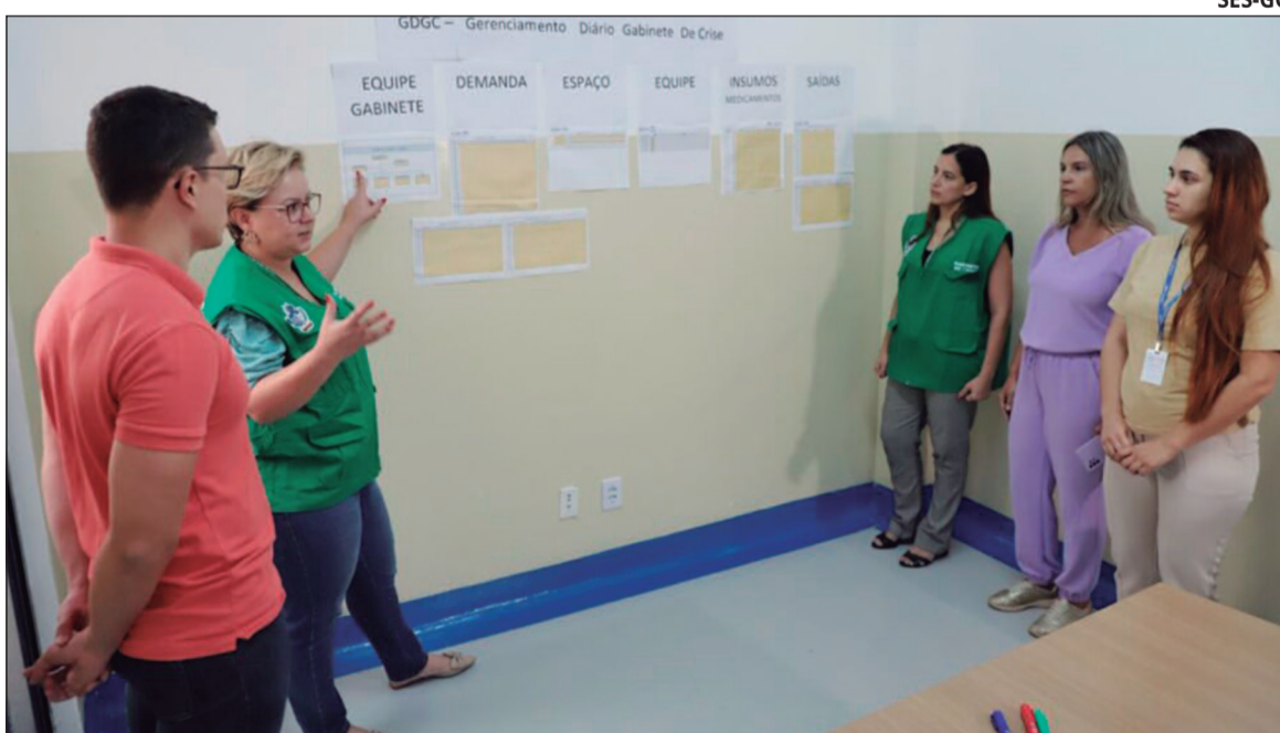
Gabinete de crise da Saúde de Goiânia consegue zerar fila de UTI na capital em esforço conjunto do Governo do Estado e município

Após a instalação do gabinete, houve a abertura de 20 novos leitos de UTI e a reati-