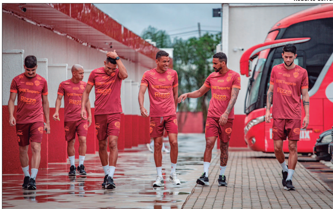
Time retornando aos trabalhos após recesso pós Série B