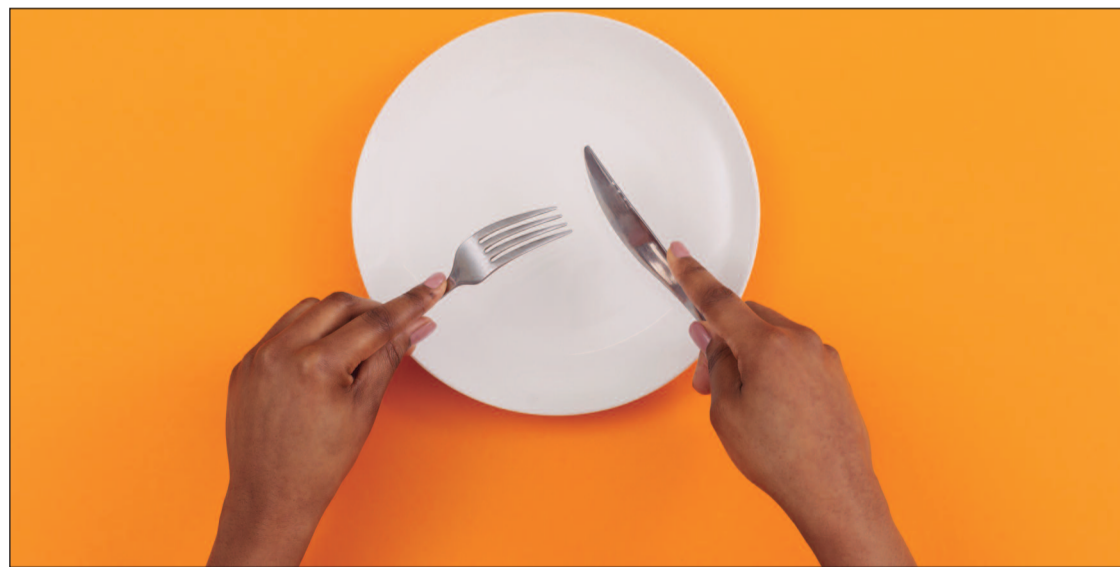
A pesquisa envolveu 458 estudantes da USP

estudantes da USP e comparou comportamentos de jejum com níveis de restrição cognitiva, compulsão alimentar, desejos por alimentos e consumo de alimentos "proibidos". Através de entrevistas online, a equipe analisou a relação entre as horas de jejum e características de distúrbios alimentares. Os resultados mostraram que pessoas com compulsão alimentar passaram 115% mais tempo em jejum do que aqueles sem esse comportamento. Além disso, a duração do jejum foi 29% maior entre par-