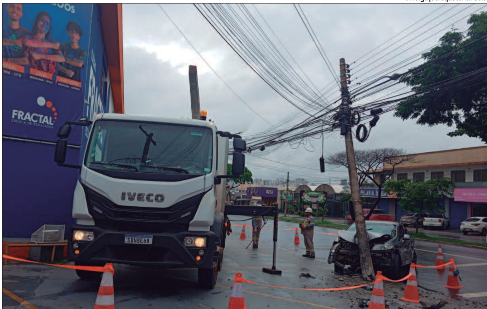
Esses acidentes causam danos significativos à infraestrutura elétrica, provocando interrupções no fornecimento de energia

Esses acidentes causam danos significativos à infraestrutura elétrica, provocando interrupções no fornecimento para residências, comércios e