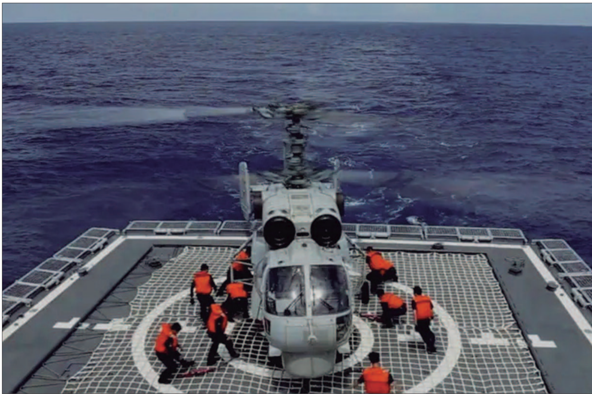
A China considera Taiwan, governado democraticamente, como seu próprio território. Mas o governo de Taiwan rejeita as reivindicações de Pequim