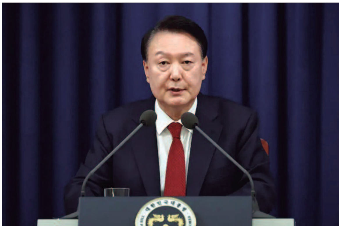
Yoon Suk Yeol tentou impor lei marcial ao país

Yoon está enfrentando uma investigação criminal sobre possíveis acusações de insurreição. O tribunal se recusou a comentar.