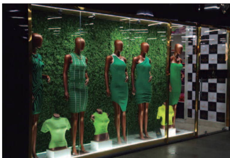
Pequenos negócios no setor de moda impulsionam a economia local e fortalecem o segundo maior polo de confecção do Brasil

A Região da 44 se destaca como um dos maiores centros de venda de moda no Brasil, conectando produtores e consumidores