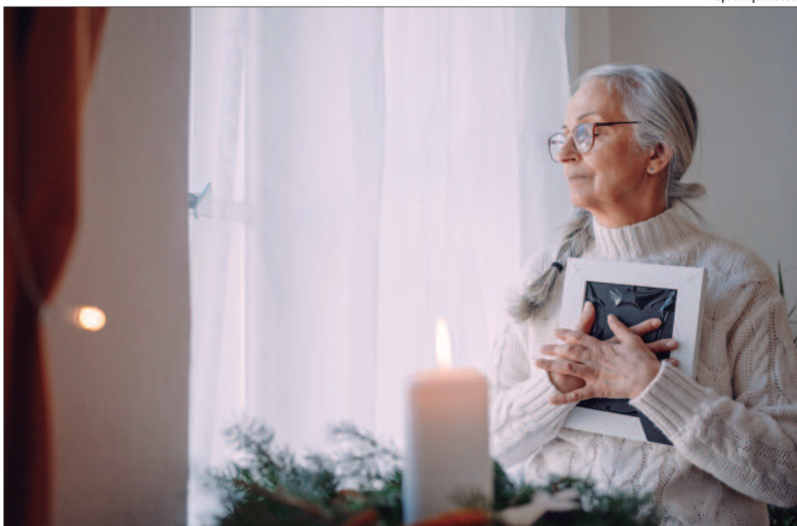
Em adolescentes, a raiva associada à perda pode se manifestar por meio de irritabilidade e problemas de comportamento

Considerado uma reação natural a momentos de perda, o luto pode se tornar um problema de saúde quando é intenso e se prolonga por muito tempo. A Organização Mundial da Saúde (OMS) classifica o luto prolongado como um transtorno mental na Classificação Internacional de Doenças (CID). Essa condição também passou a ser reconhecida como um transtorno mental no manual de diagnósticos da Associação Americana de Psiquiatria (APA).