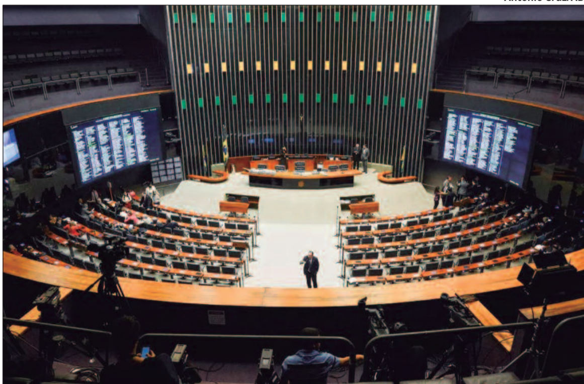
Congresso retoma atividades em fevereiro para analisar orçamento, ajuste fiscal, reforma tributária e mudanças previdenciárias

O governo Lula (PT) avançou em 2024 com a aprovação da primeira etapa da reforma tributária, que unifica cinco