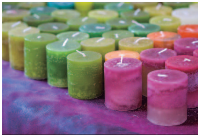
A vela verde promove a cura e a conexão com a natureza