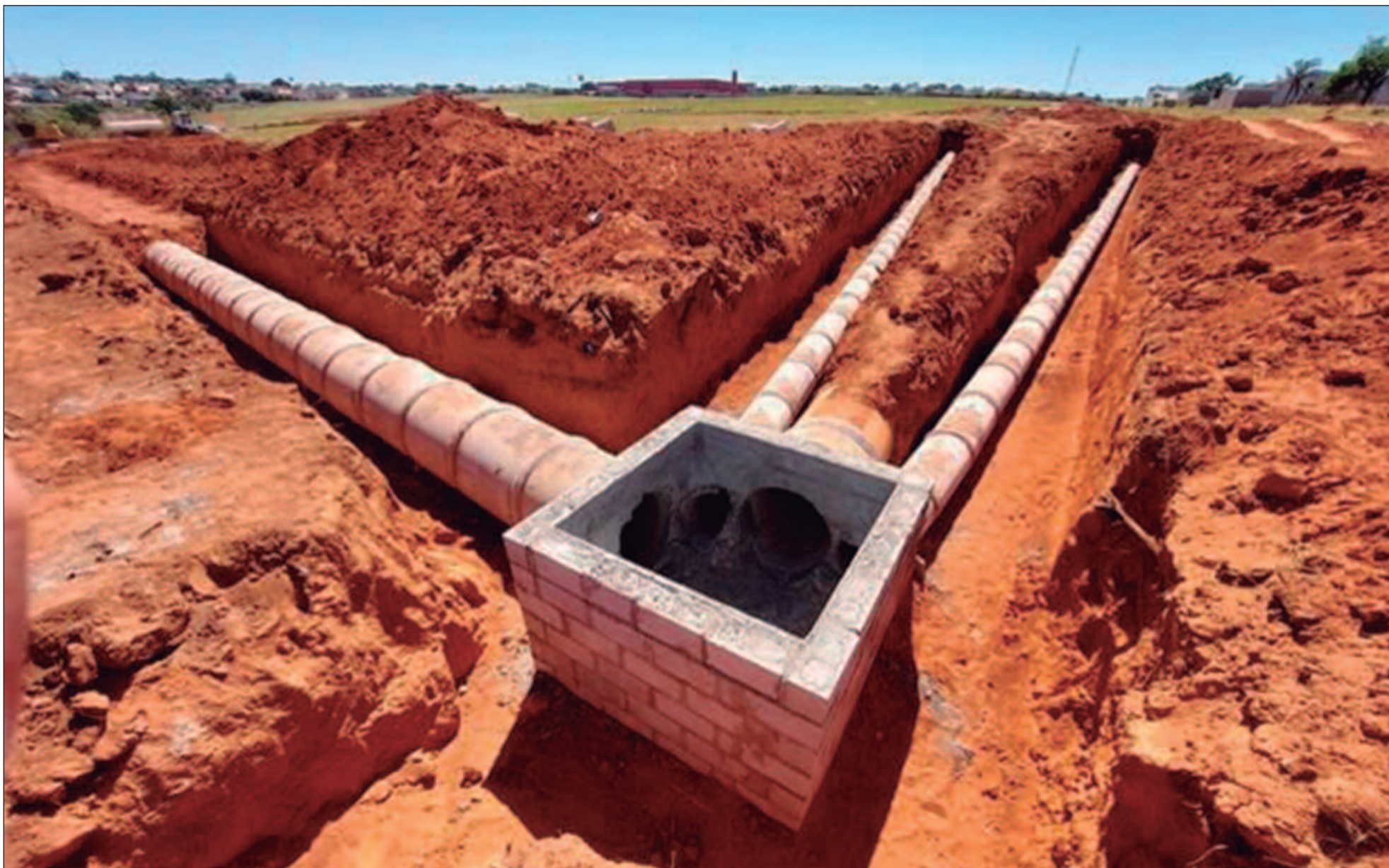
Obras de instalação de drenagem pluvial avançam, promovendo melhorias na infraestrutura e prevenindo alagamentos em áreas urbanas