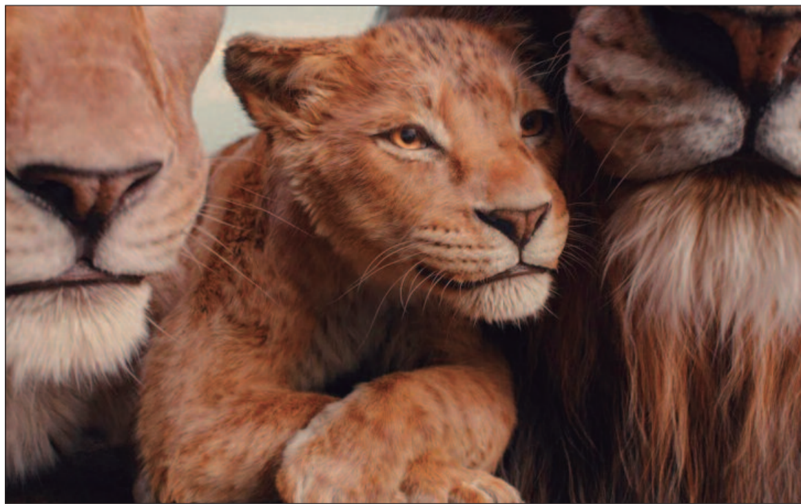
O filme 'Mufasa: O Rei Leão' narra a jornada de Mufasa desde sua origem humilde até se tornar rei

O Auto da Compadecida 2 (2021, BRA) Duração: 1h 54min. Direção: Guel Arraes, Flavia La-