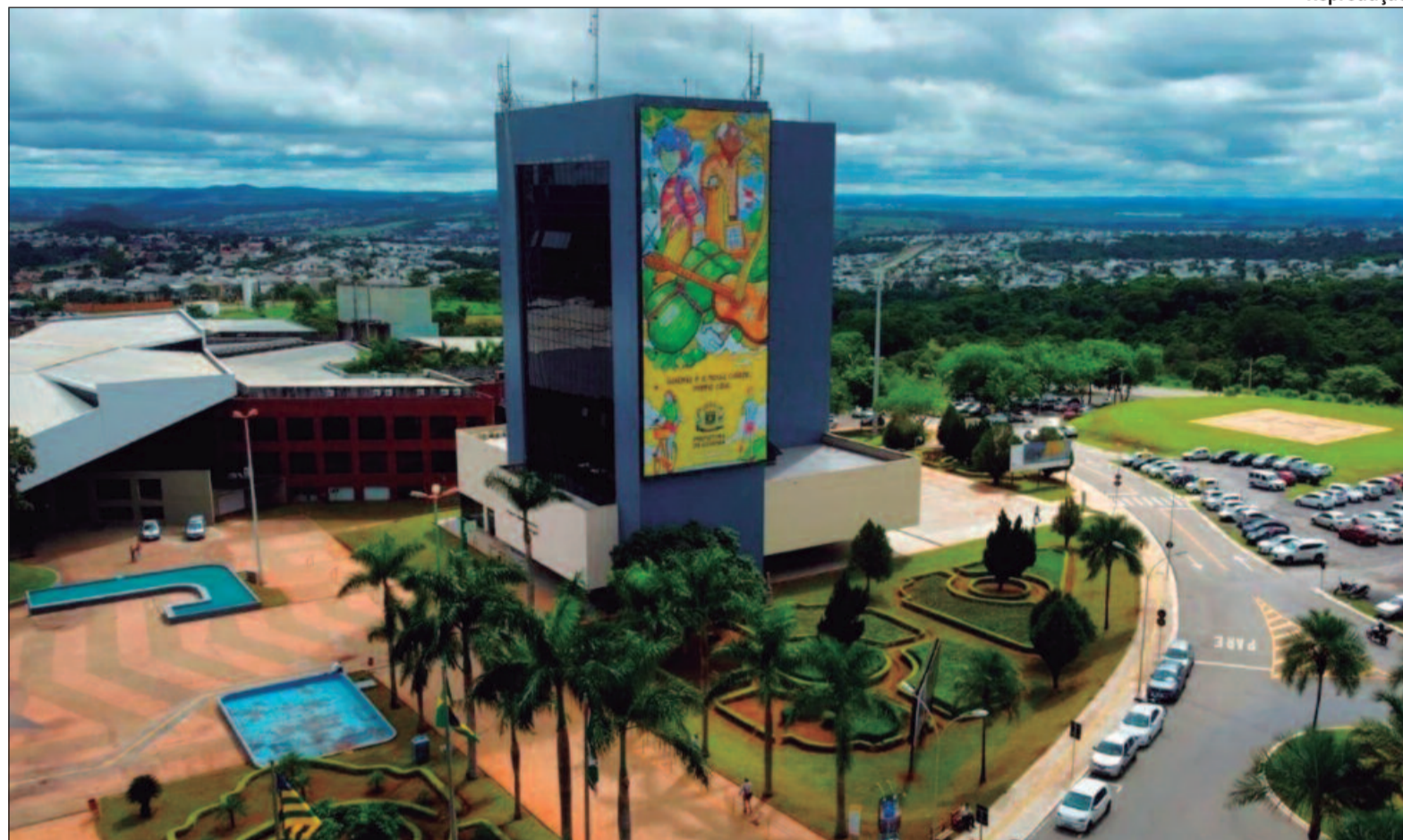
Sandro Mabel será realizada no Paço Municipal de Goiânia, às 17h

A agenda começará às 14h com a Solenidade de Posse, que ocorrerá no Centro de Cultura e Eventos Ricardo Freua Bufaiçal, localizado no Câmpus II da Universidade Federal de Goiás (UFG). A transmissão do cargo de Rogério Cruz (Solidariedade) para Sandro Mabel será realizada no Paço Municipal de Goiânia, às 17h.