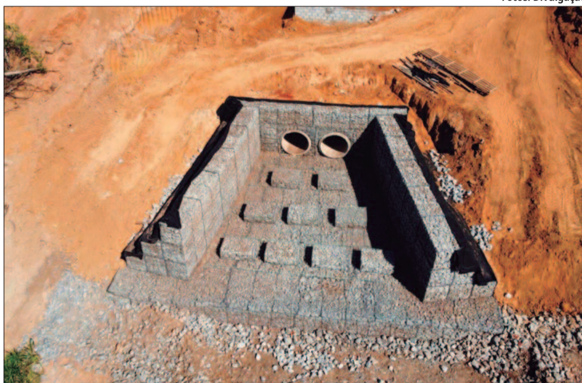
O acesso à água potável de qualidade, é fundamental para a saúde e o bem-estar da comunidade

Catalão, situada no sudeste de Goiás, tem se consolidado como referência em saneamento básico no Brasil. Segundo o Sistema Nacional de Informações em Saneamento