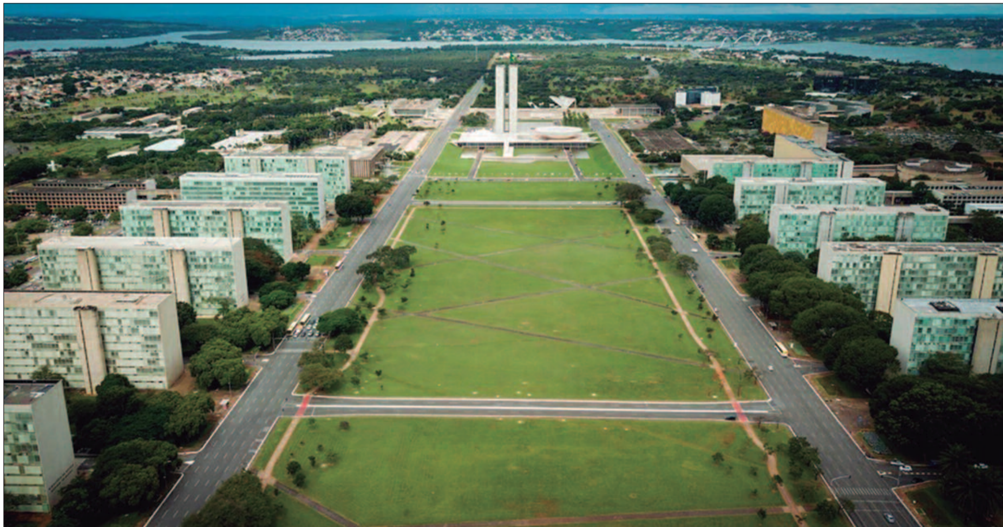
Trocas ministeriais podem redefinir articulação política no Congresso