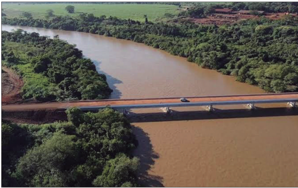
Avanços, desafios e os investimentos planejados para o futuro do escoamento viário goiano

Em entrevista exclusiva para O HOJE, a Goinfra informou que irá lançar um novo programa de implantação e de restauração de Obras de Artes Especiais (OAEs - pontes, viadutos e bueiros celulares), visando a substituição das estruturas que ainda são de madeira, a implantação de novas OAEs e a manutenção/recuperação de OAEs mais antigas.