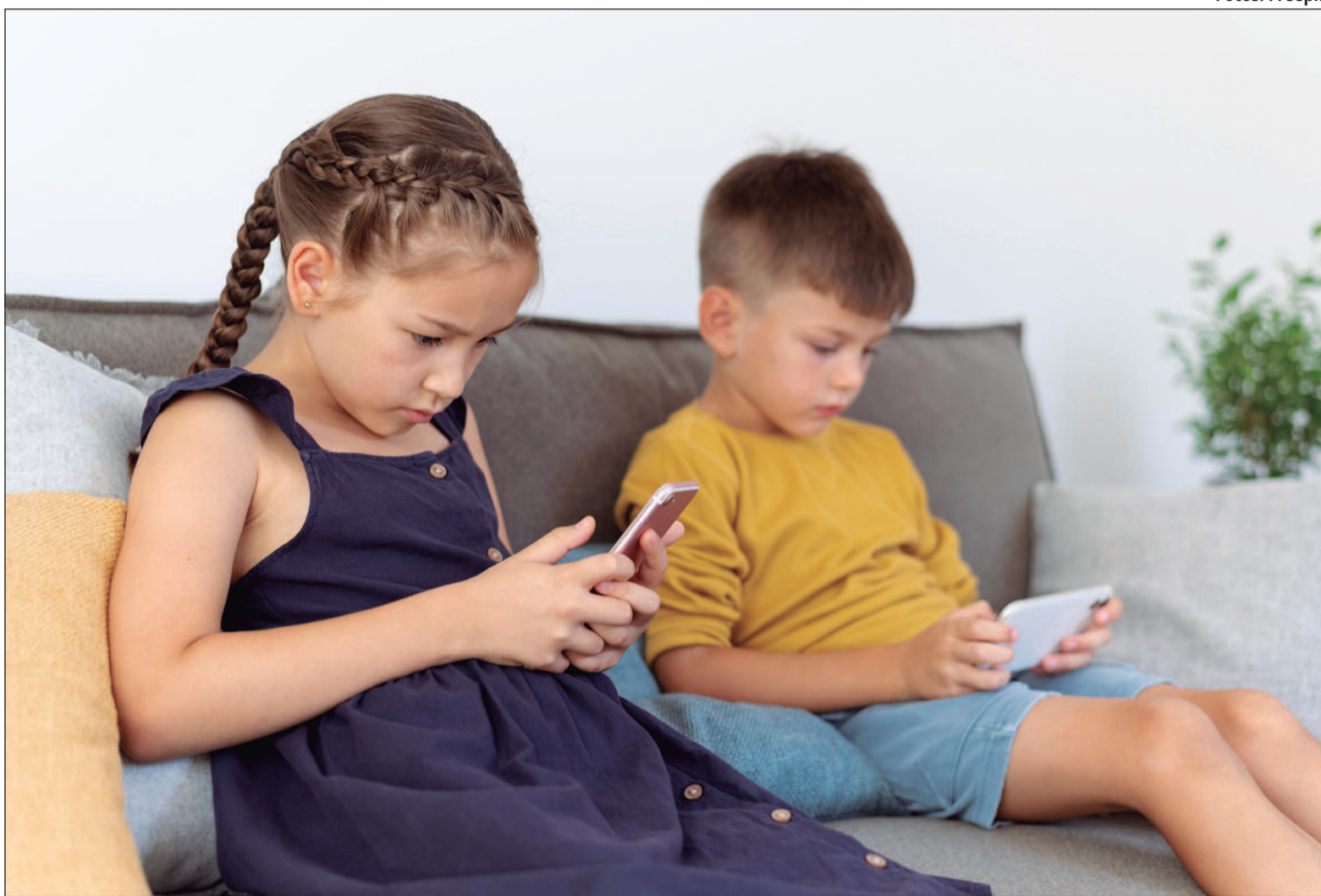
Pesquisa revela pela primeira vez, frequência do uso de plataformas digitais por crianças e adolescentes

Em seguida, aparecem o YouTube, com 66% (43% “várias vezes ao dia” e 23% “todos os dias ou quase todos os dias”); o Instagram, com 60% (45% “várias vezes ao dia” e 15% “todos os dias ou quase