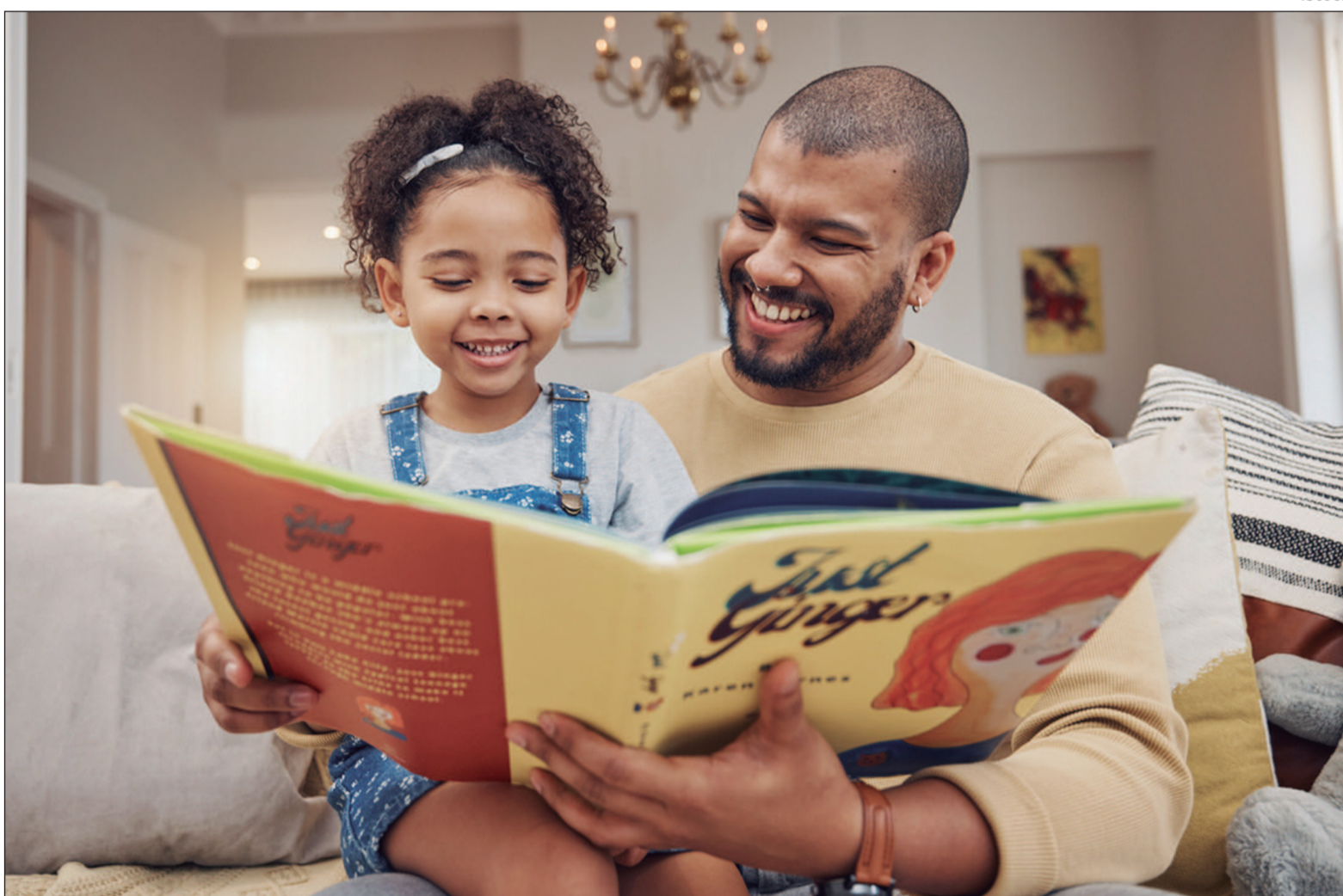
Ler histórias juntos, transforma a leitura em uma experiência prazerosa e cria uma rotina