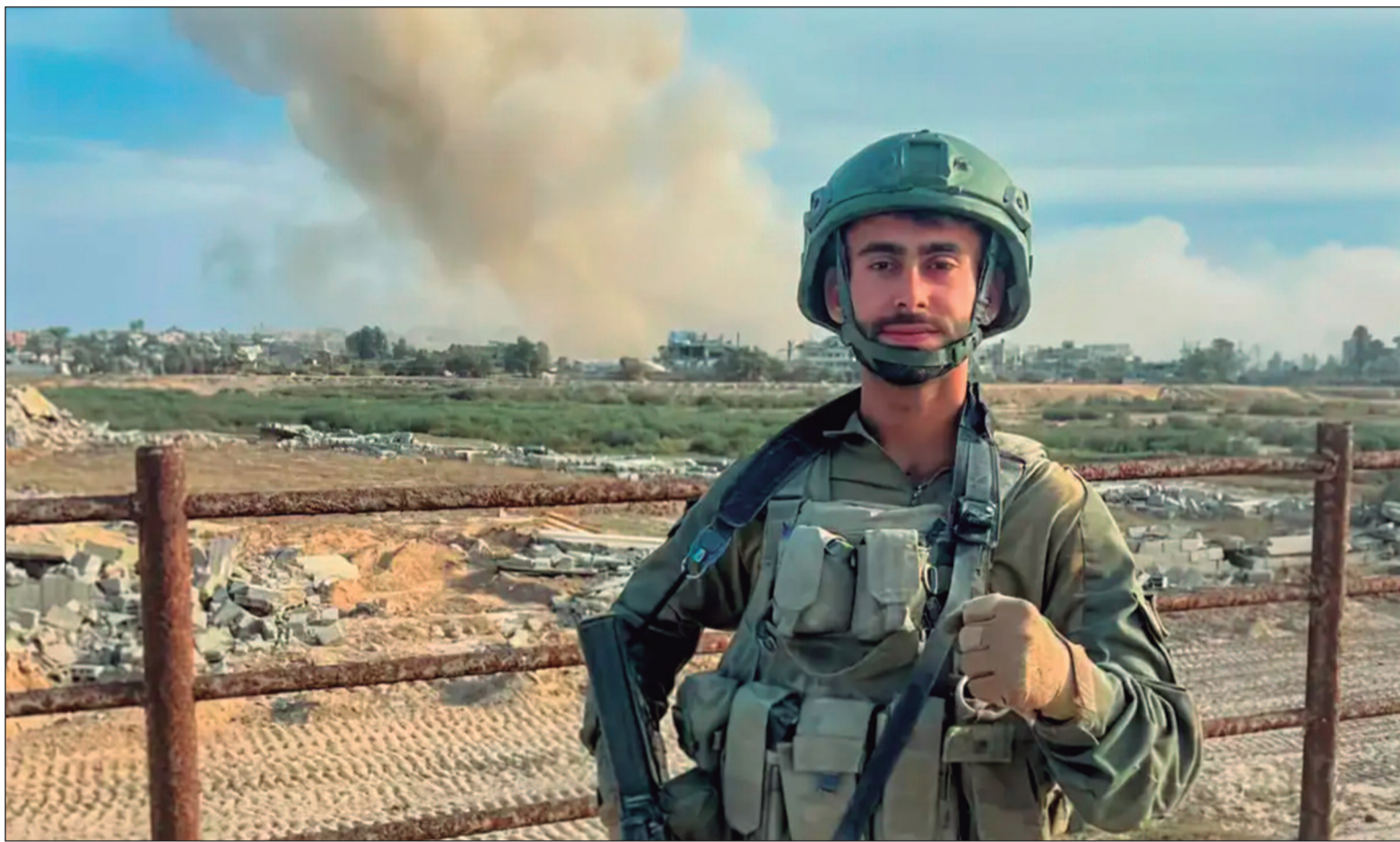
Fepal (Federação Árabe Palestina do Brasil) acusou o governo israelense e a embaixada do país no Brasil de promover a fuga do acusado

“Esses materiais provam, sem sombra de dúvida, o envolvimento direto do suspeito nesses atos hediondos. Esses atos são parte de um esforço mais amplo para impor con-