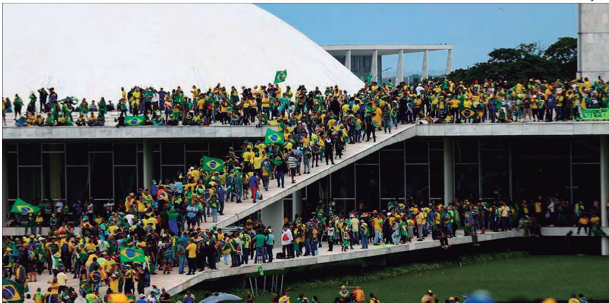
Dados da pesquisa feita pela Genial/Quaest foram revelados na última segunda-feira, 6. O índice é 8 pontos menor do que o divulgado há dois anos na mesma pesquisa