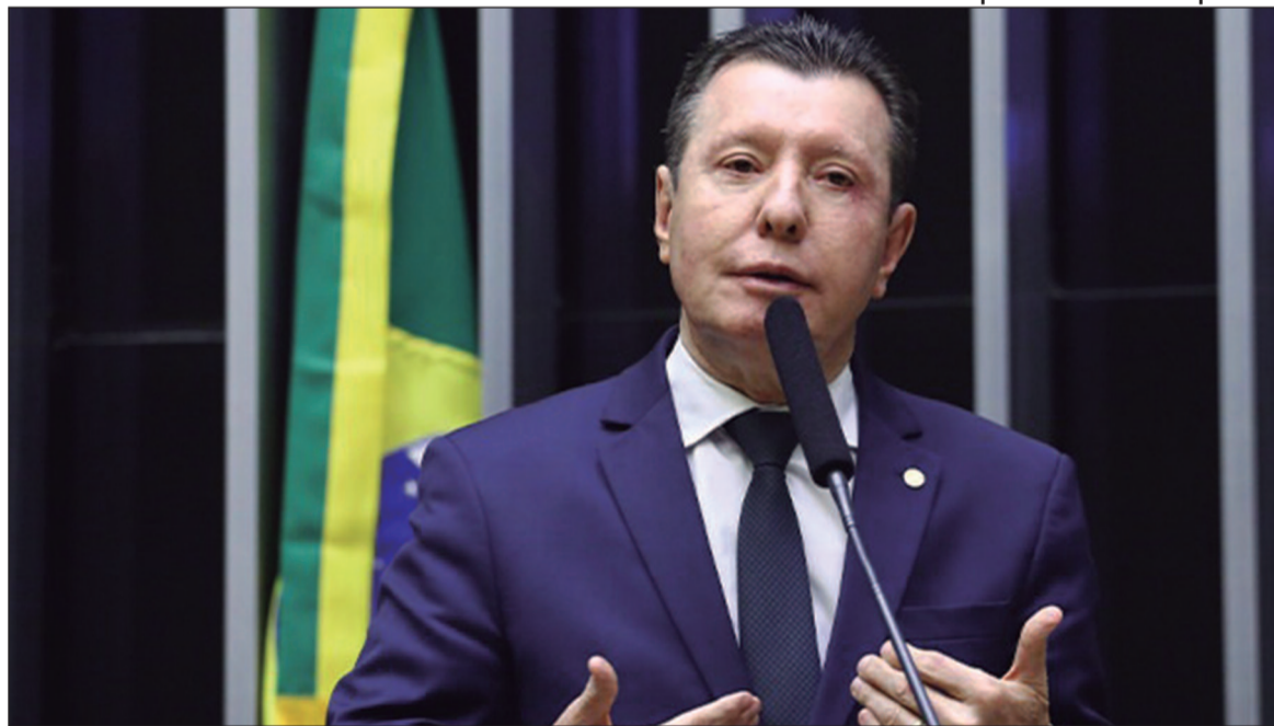
Ao O Hoje, deputado goiano afirmou ser “praticamente impossível” a fusão dos três partidos, mas avalia uma federação partidária como “viável”

Quanto às fusões, o deputado apontou que PSDB e PSD devem ser as próximas legendas a se unirem para formar um grande partido. Embora tenham sido protagonistas na política brasileira, ambos perderam força nos últimos anos. Segundo ele, a fusão entre as legendas deve ocorrer entre março e abril.