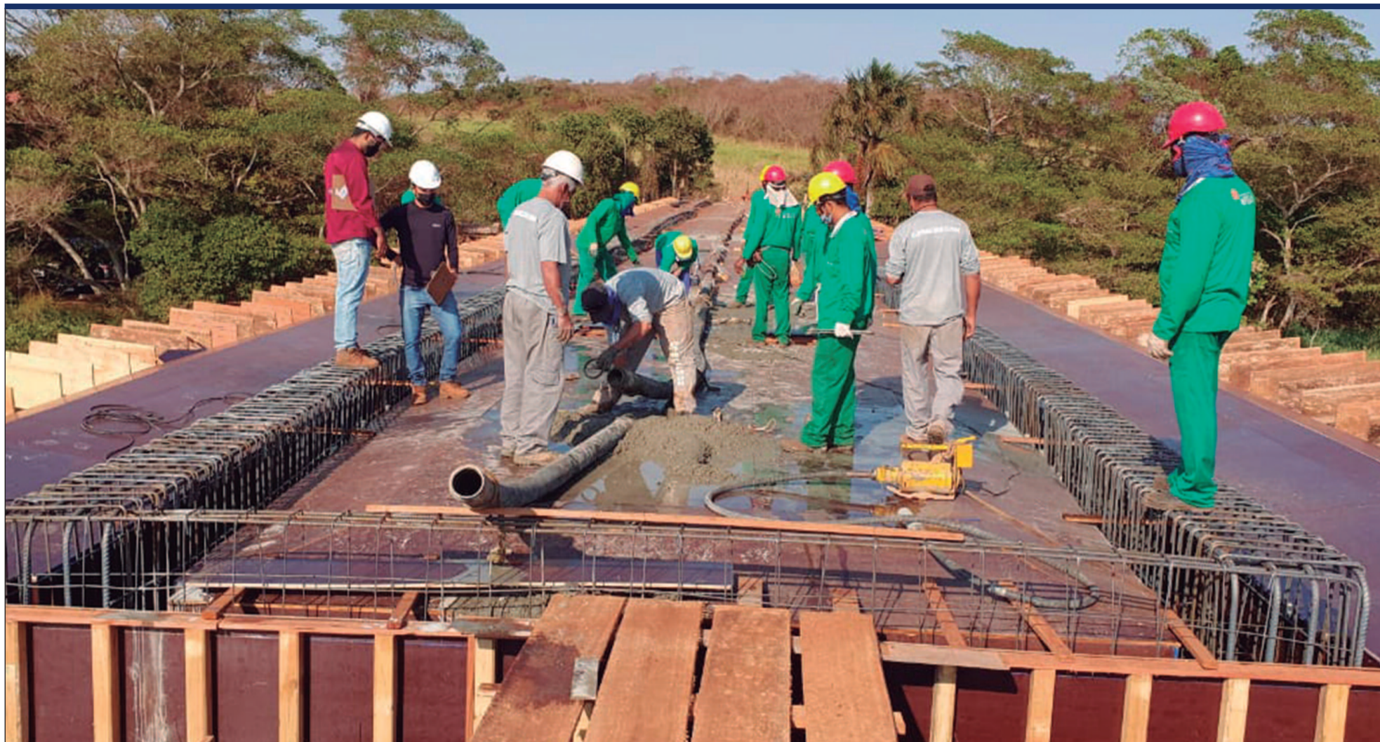
Da madeira ao concreto: a transformação das pontes rodoviárias em Goiás deve ser finalizada em 2025