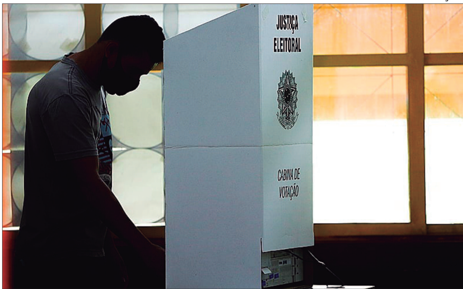
Entrevistados da pesquisa são recrutados durante navegação de rotina na web em territórios geolocalizados pelo próprio dispositivo