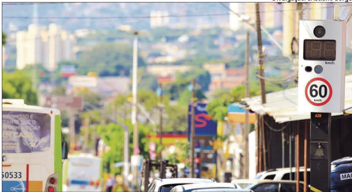
A implementação dos dispositivos para monitorar as 602 faixas de tráfego da cidade deve acontecer em um prazo máximo de 12 meses

A previsão é que tudo esteja em plena operação dentro de uma semana. A introdução dos novos equipamentos visa aprimorar a segurança viária, diminuir o número de acidentes e assegurar um fluxo mais eficiente nas ruas das cidades. (Thais Teixeira, especial para O Hoje)