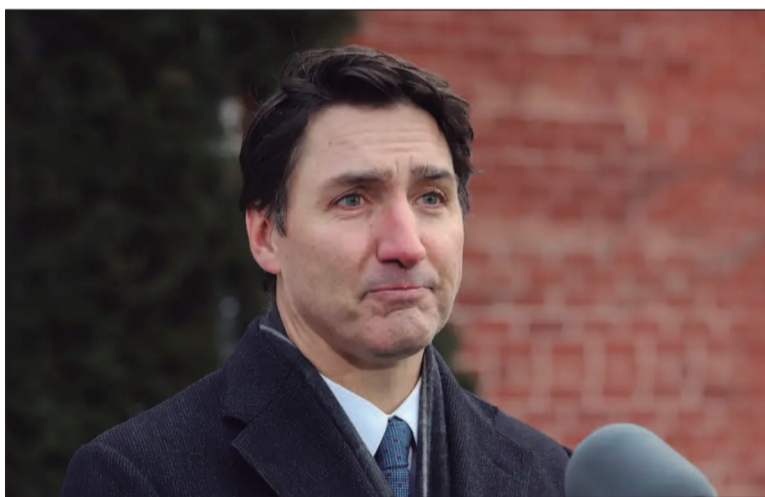
Trump ameaçou impor tarifas que prejudicariam a economia do país

As pesquisas mostram que os liberais perderão com folga para os conservadores da oposição oficial em uma elei-