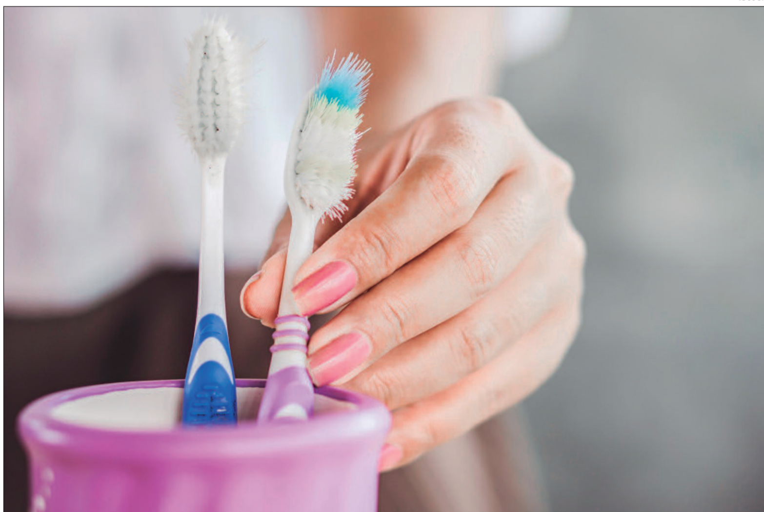
O dentista destaca a importância de uma consulta odontológica periódica

Para evitar que uma escova contaminada recontamine o usuário, especialistas reco-