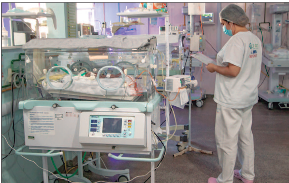
Na maioria dos casos os bebês ficam internados nas incubadoras de UTIs ou CTIs para amadurecer os órgãos

Vários fatores contribuem para o surgimento da prematuridade, abrangendo aspectos substâncias ilícitas durante a gravidez. O risco é ainda maior em gestações múltiplas e quando a placenta está posicionada de forma inade-