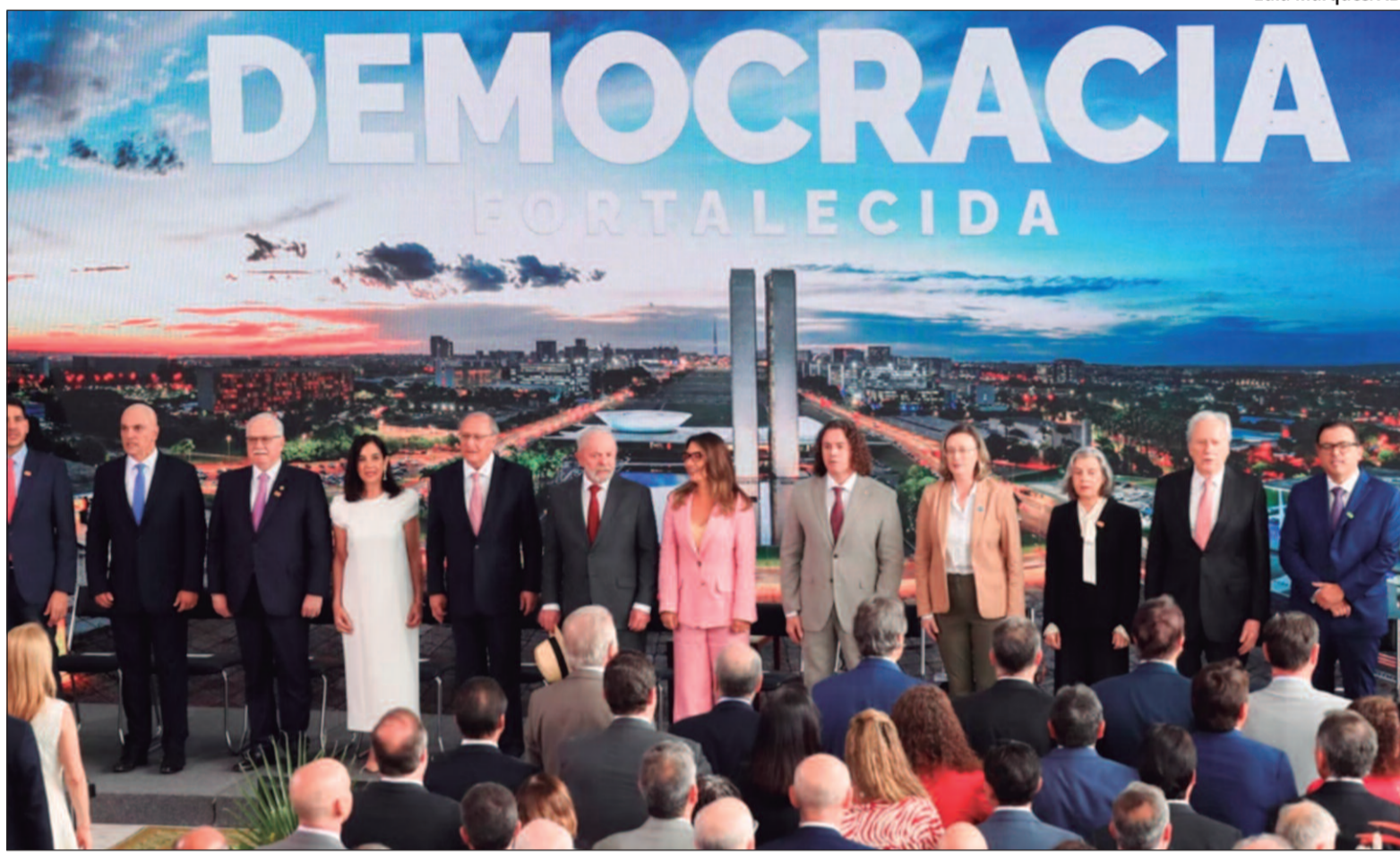
O que chamou a atenção foi a ausência da cúpula dos demais líderes dos Três Poderes

Além disso, o evento contou com a participação de 31 ministros do governo - os quais a presença foi uma exigência