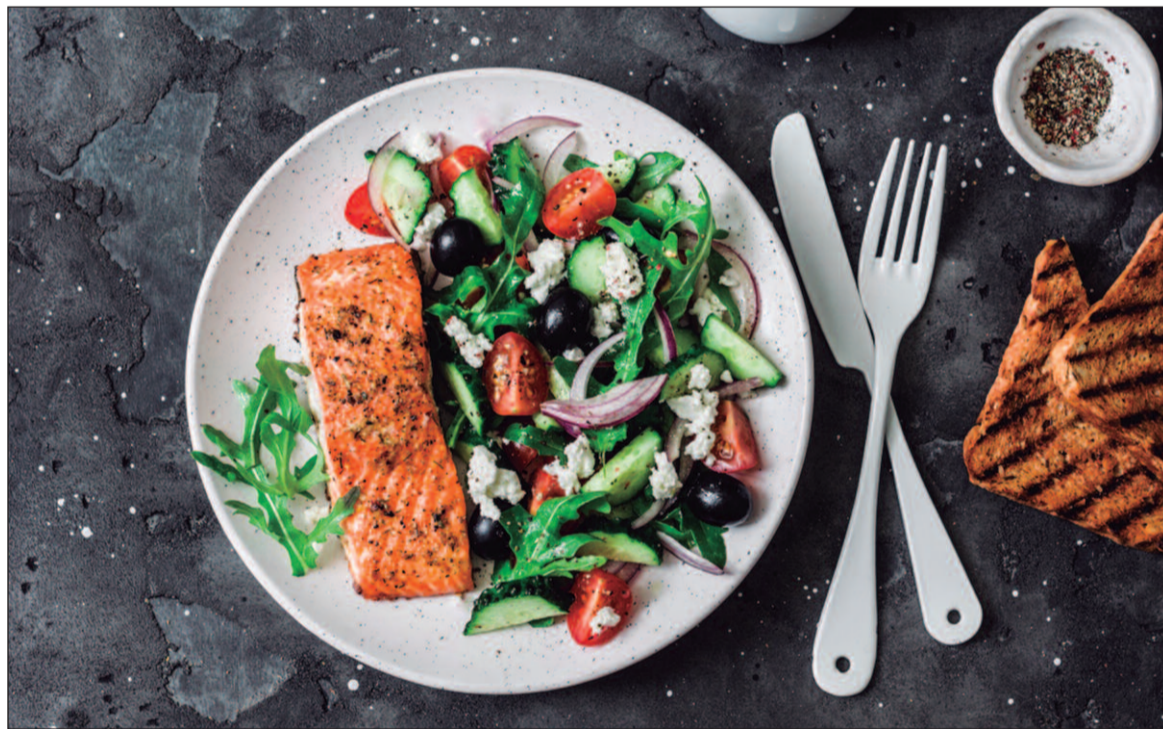
Os peixes, ricos em ômega-3 e proteínas que promovem a saúde do coração, são uma ótima escolha

A pesquisa foi realizada com camundongos, cujas idades equivalem a cerca de 18 anos em humanos. Ao longo de 14 semanas, os roedores alimentados com uma dieta mediterrânea rica em azeite de oliva, peixes e fibras apresentaram um aumento significativo de quatro tipos de bactérias benéficas no intestino, além da redução de cinco