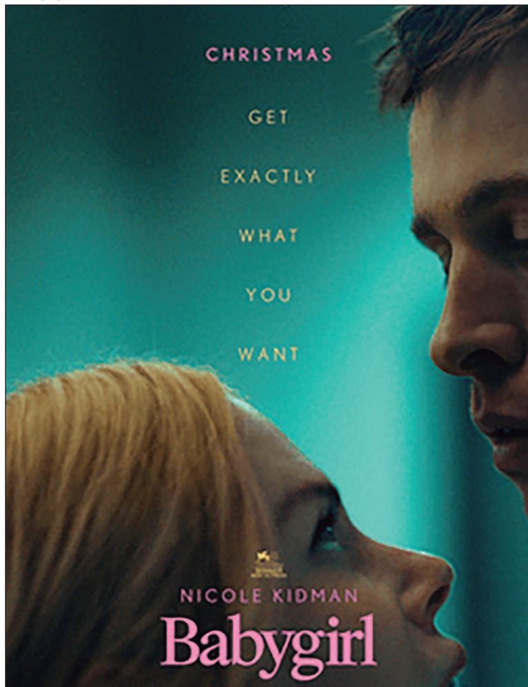
Em Babygirl, uma empresária coloca sua família e carreira em risco em nome de um caso com seu estagiário

Sonic 3 - O Filme (Sonic The Hedgehog 3, 2024) Duração: 1h 49 min. Direção: Jeff Fowler. Elenco: Ben Schwartz, Idris Elba,