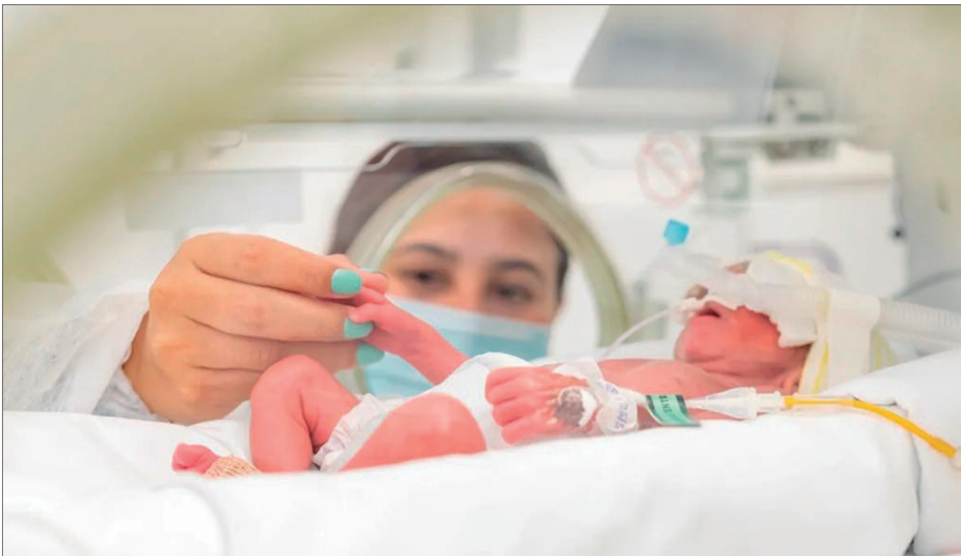
A prematuridade é caracterizada pelo nascimento que acontece antes do término da 37ª semana de gestação