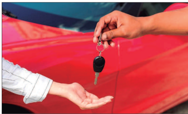
A questão econômica é um fator predominante no quesito compra ou troca de veículos

O mês de dezembro de 2024 sozinho contabilizou 1,47 milhão de unidades negociadas, um aumento de 15,9% em relação a novembro. Esses números renovam o otimismo do setor para 2025, com expectativas de manutenção e ampliação desse crescimento.