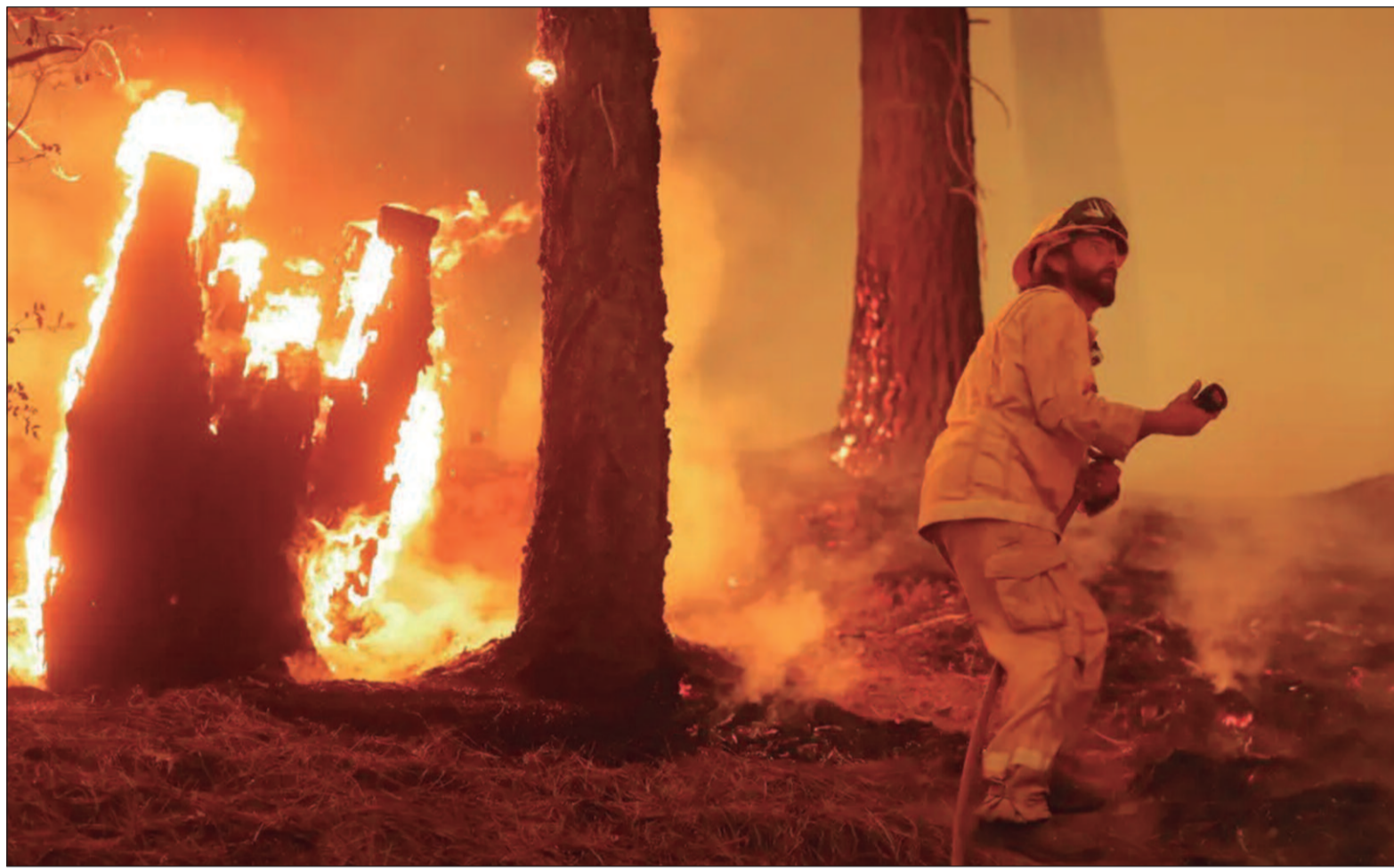
Na madrugada, o incêndio de Eaton tinha queimado rapidamente quatro quilômetros quadrados, disseram os bombeiros

As estradas ficaram intransitáveis quando muitas pessoas em busca de refúgio abandonaram seus veículos e fugiram a