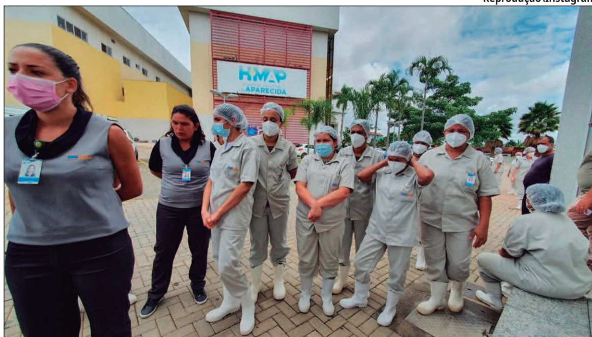
Uma assembleia com indicativo de greve está prevista para a manhã desta quinta-feira (9)

Na terça-feira (7), o Sindicato convocou uma assembleia com os servidores da saúde municipal para discutir o atraso salarial e outras demandas, como a progressão no Plano de Carreiras, atrasada há mais de um ano. Durante o encontro, foi formada uma co-