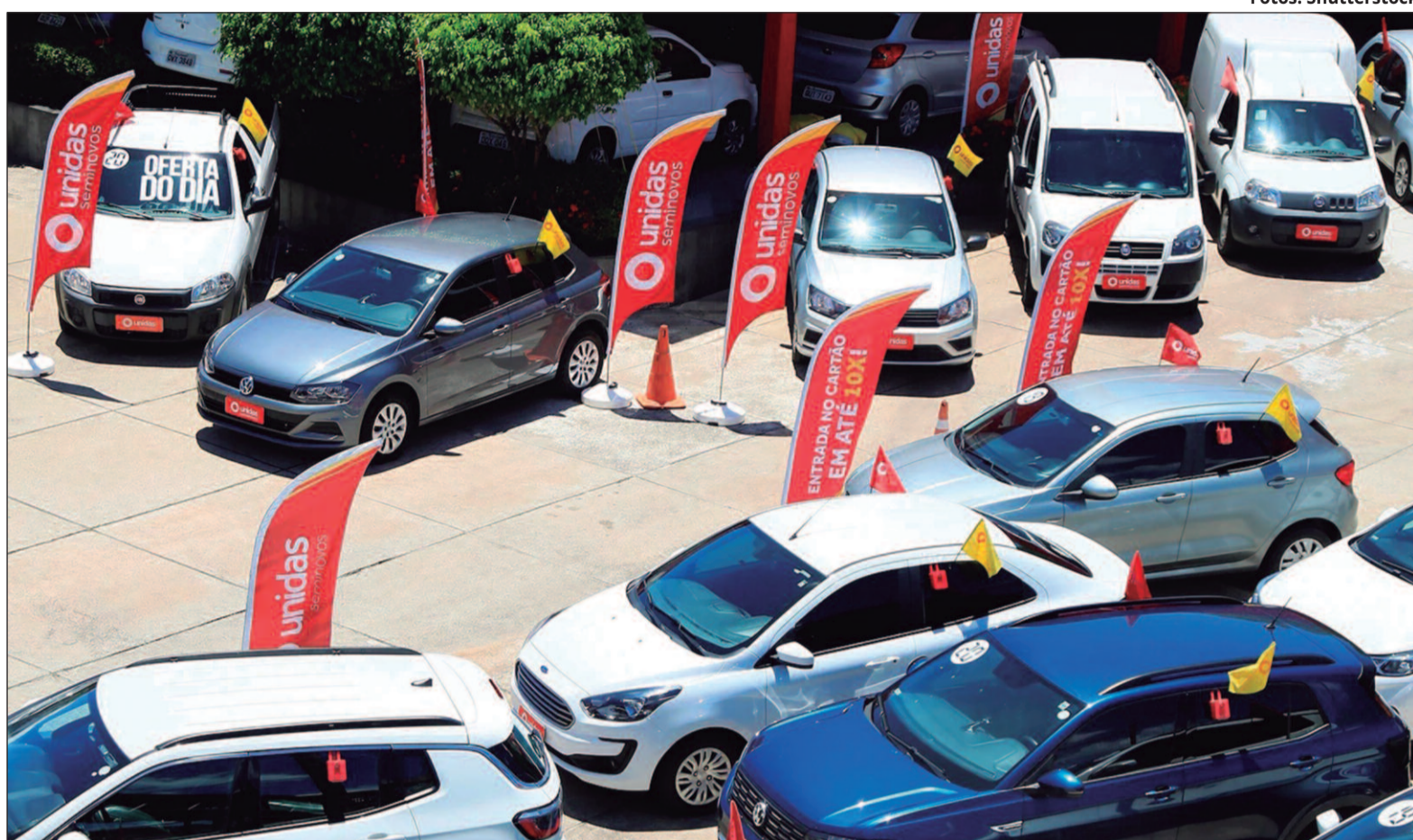
O período entre o final e o início do ano é apontado por especialistas como uma das melhores ocasiões para trocar de carro

De acordo com a Fenauto (Federação Nacional das Associações dos Revendedores de Veículos Automotores), o mercado brasileiro de carros usados e seminovos registrou um recorde histórico em 2024, com 15,7 milhões de unidades vendidas, representando um crescimento de 9,2% em relação a 2023.