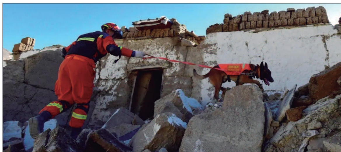
Sabe-se que pelo menos 126 pessoas morreram e 188 ficaram feridas

O terremoto foi tão forte que parte do terreno ao redor do epicentro deslizou até 1,6 metro em uma distância de 80 km, de acordo com uma análise do Serviço Geológico dos Estados Unidos.