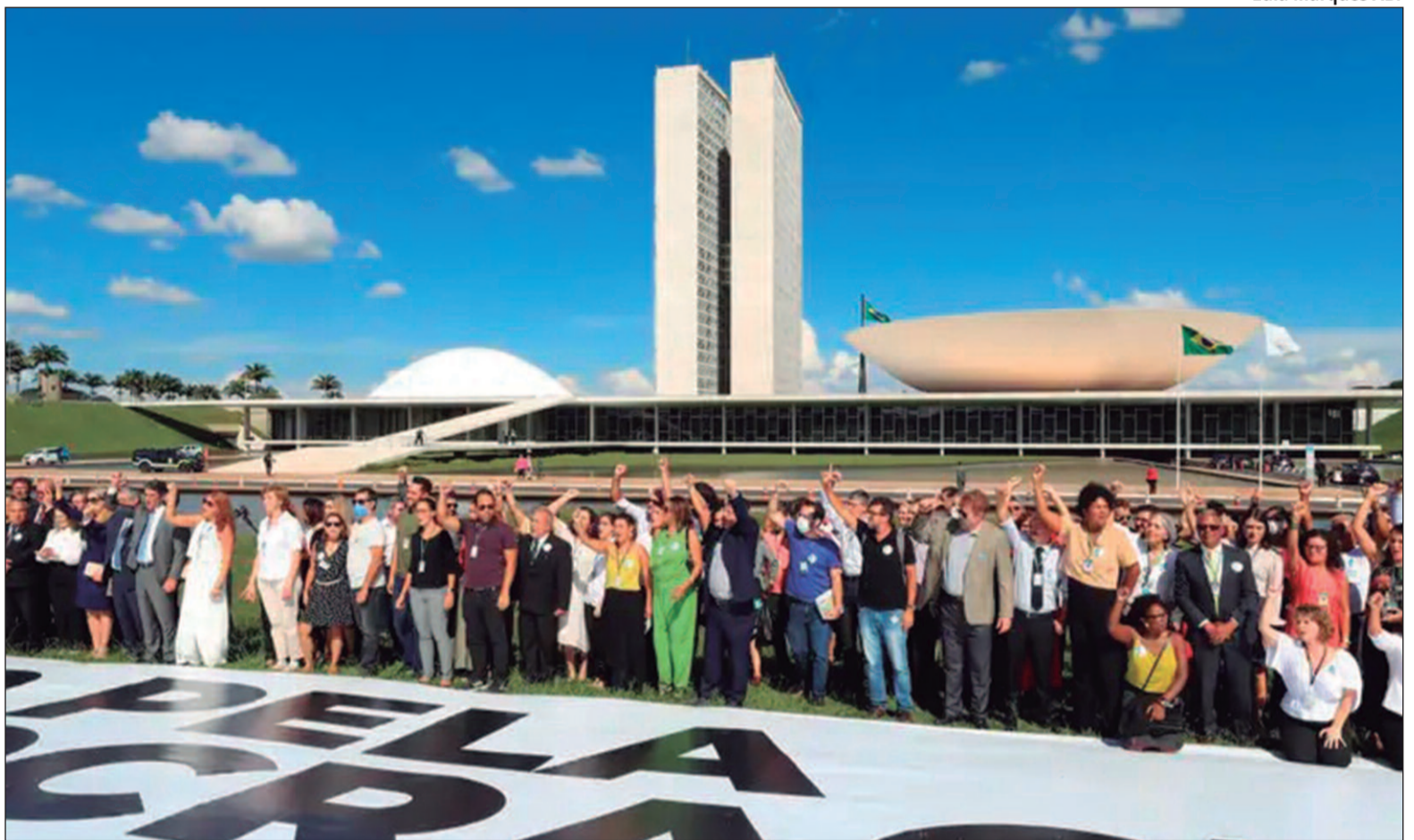
Partidos intensificam articulações por fusões e federações de olho em 2026

Segundo explica o Lehninger, para a democracia é saudável que os eleitos se identifiquem com algum partido, que o partido funciona como uma espécie de atalho informacional para as pessoas, porque informações a todo momento têm um custo alto. “Se tem um partido que agrada, pela forma que expõe as ideias, na maioria do tempo, isso é um atalho informacional que facilita a tomada de decisões eleitorais, decisões racionais no caso, para votar em candidatos que real-