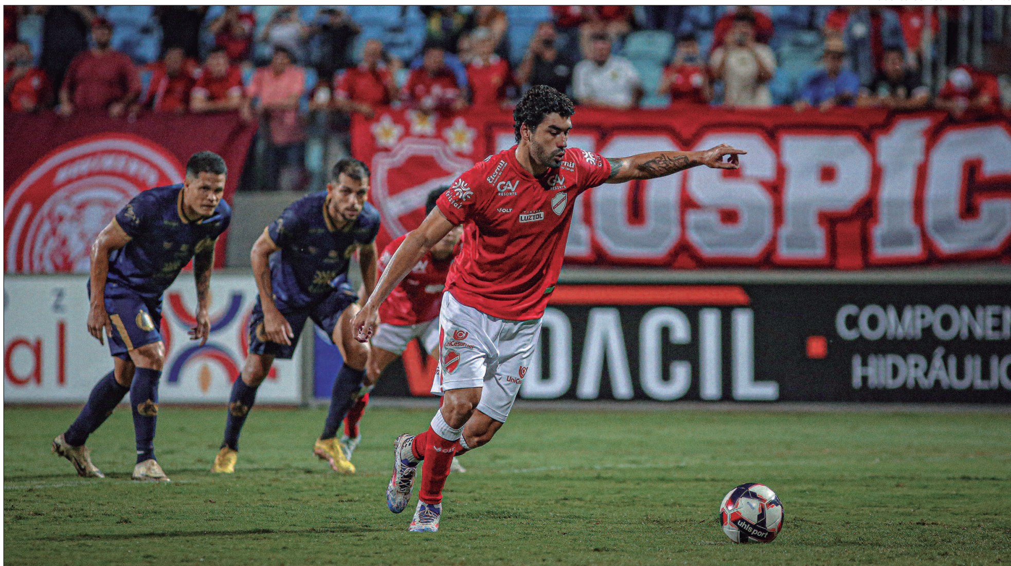
Primeira rodada do Goianão 2025 termina com vitórias de Goiatuba, Vila Nova, Inhumas e ABECAT; Atlético-GO empata, e Goiás decepciona na abertura