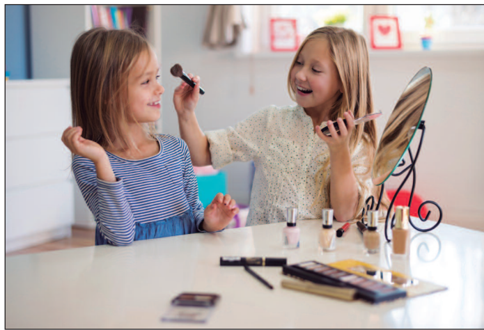
A busca precoce pela perfeição estética rouba a infância e a autenticidade