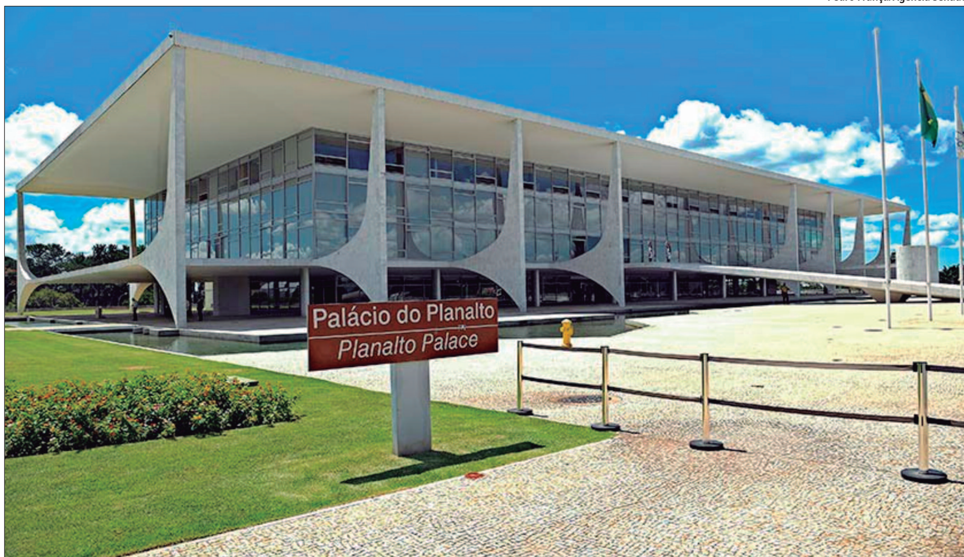
Projeto de Lei Orçamentária Anual (PLOA) de 2025 (PLN 26/2024) não foi votado, em decorrência da ausência de tempo hábil para a matéria ser tratada