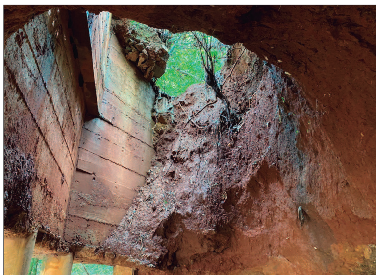
O buraco nas duas laterais da pista e da ponte se abriu há cerca de um mês, e possui mais de 6 metros de profundidade

acidentes. “Mais para frente, quando as chuvas melhorarem, a gente vai intervir, vai abrir, vai melhorar. Porque tem estacas a céu aberto, vamos colocar caminhões. E vamos reaterrar e recompor essa capa. Fica uma situação mais definitiva”.