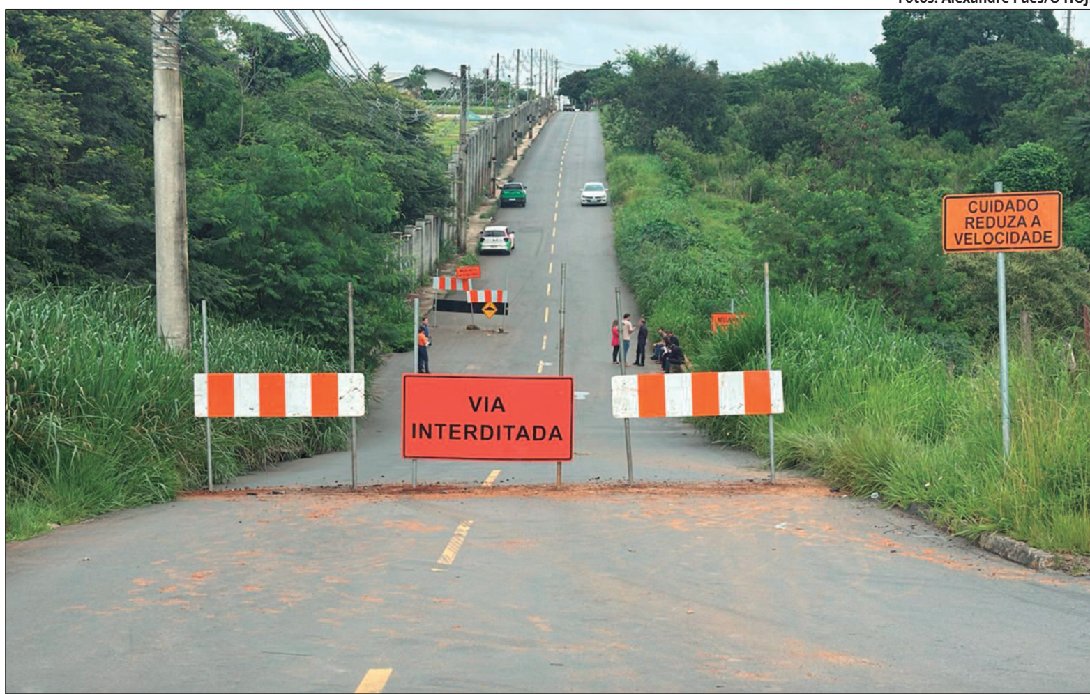
A ponte fica localizada na Avenida Toledo, no trecho entre o Cemitério Jardim da Paz e o Atacadão, acesso para quem sai da BR-153

Ele acrescenta que o trabalho atual tem o objetivo de trazer mais estrutura para o local e segurar o período chuvoso, além de evitar possíveis