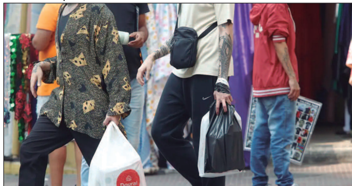
A constatação faz parte da Pesquisa Mensal de Serviços (PMS)