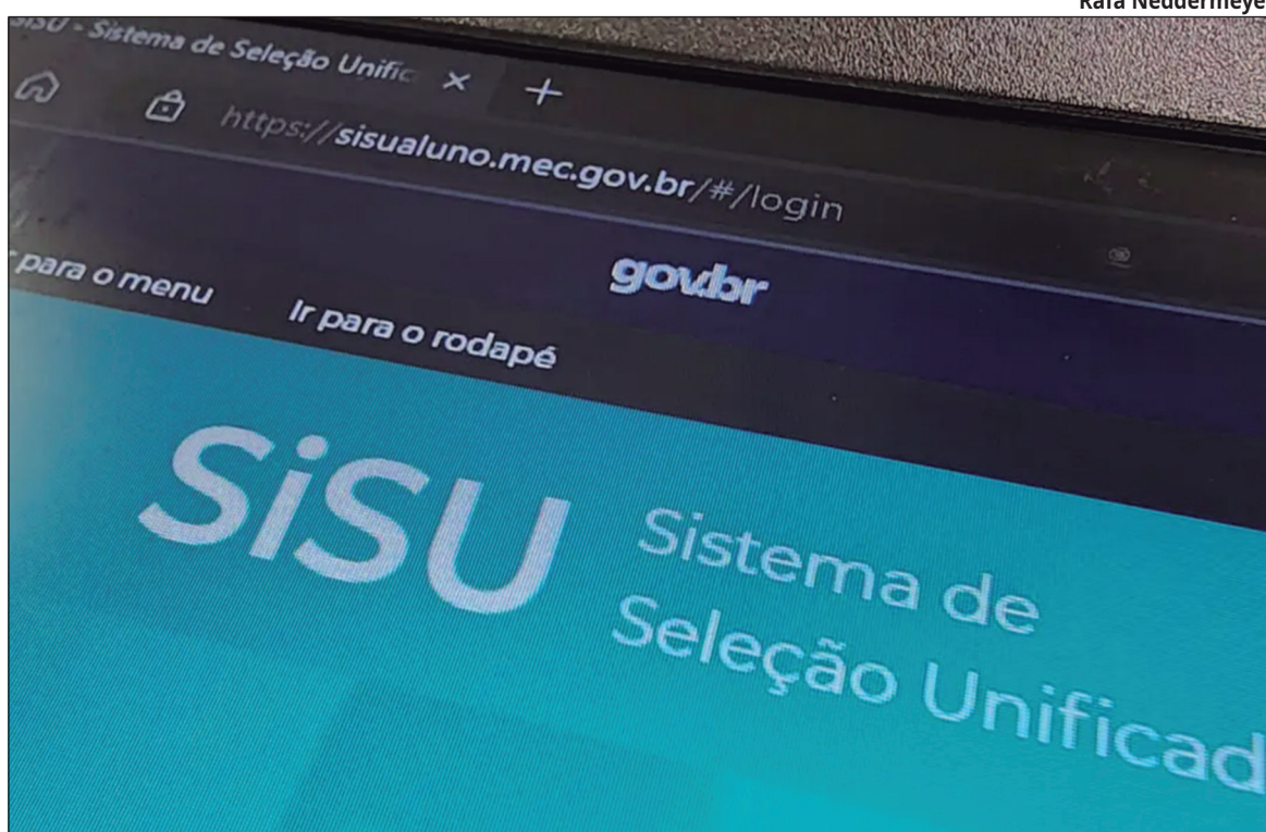
O prazo para participar da lista de espera vai de 26 a 31 de janeiro

A inscrição é gratuita e feita exclusivamente pela internet.