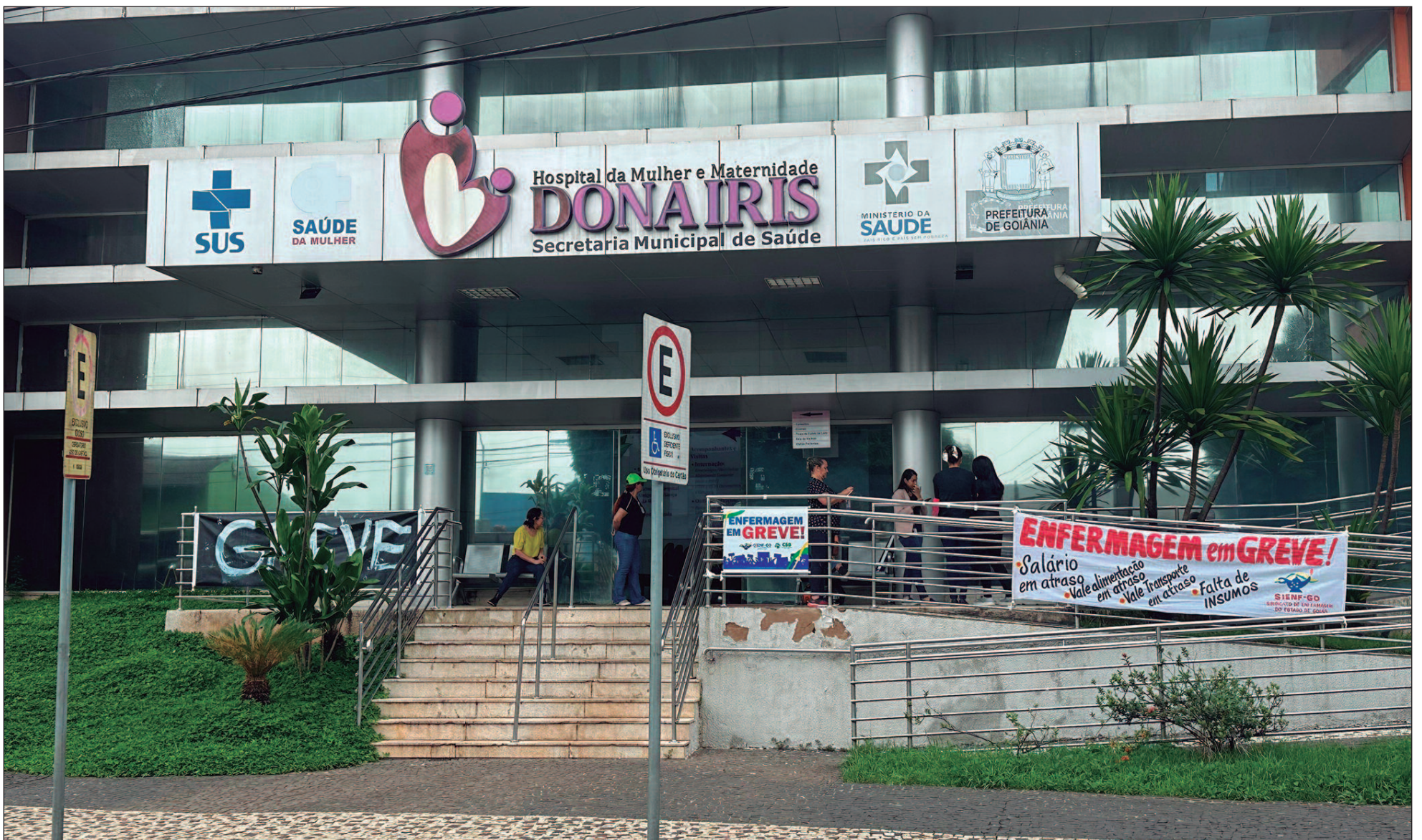
Os profissionais e saúde reclamam das condições de trabalho que tem enfrentado