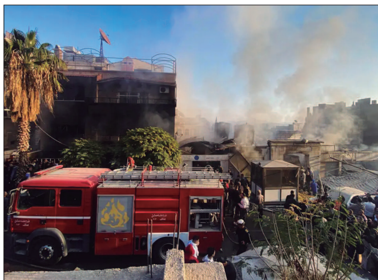
Mais de 70 palestinos foram assassinados e outros 200 ficaram feridos

Autoridades israelenses informaram que o acordo não será oficial por parte de Israel até que ele seja votado pelo