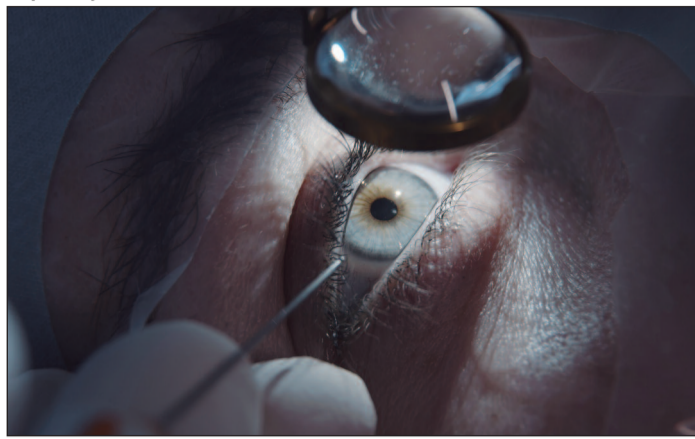
O tratamento das lesões oculares depende da gravidade do trauma