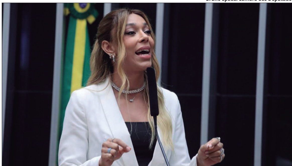
PSOL deve trazer três players de Brasília para qualificar os filiados para o ano 2026