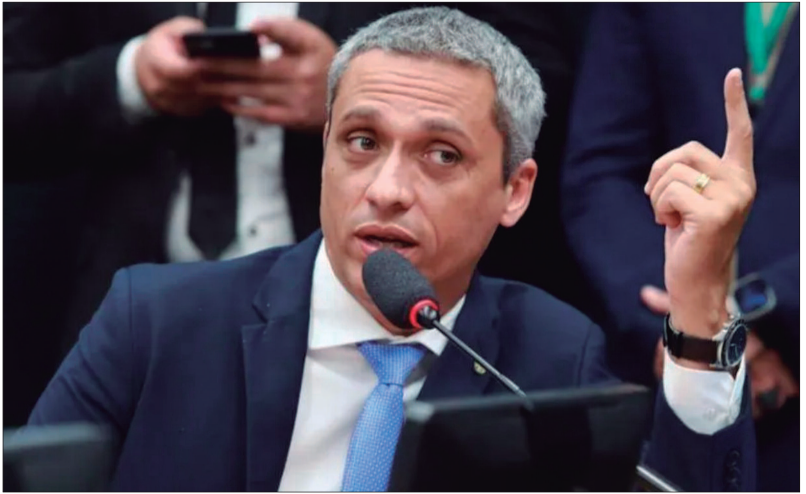
Solenidade ocorre na próxima segunda-feira (20), em Washington. A ideia é alavancar as próximas candidaturas de todos os presentes no evento

Conforme analistas, o deputado federa, o segundo mais votado em Goiás, em 2022, é mais conhecido nos grandes centros urbanos, como Goiânia, Aparecida de Goiânia e Anápolis. Essa movimentação pode contribuir para levá-lo aos 246 municípios goianos, fator determinante para uma eleição ao Senado.