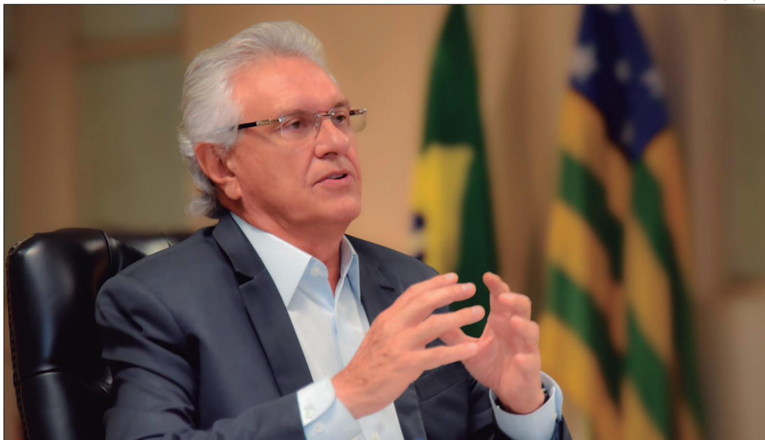
Ronaldo Caiado busca trazer outras pautas além da segurança para alavancar seu nome na disputa de 2026

Na busca incessante pela cadeira mais cobiçada da política brasileira, Caiado tem como principal estratégia a apresentação dos resultados