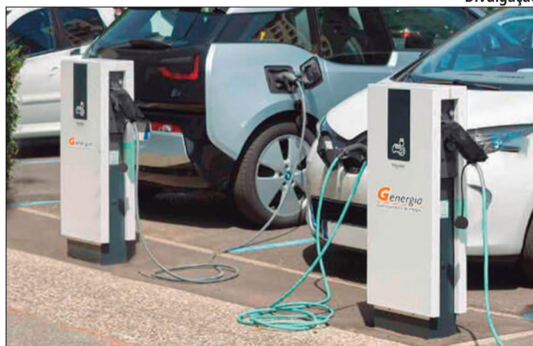
39% dos carros vendidos em Goiás no ano de 2024 são elétricos