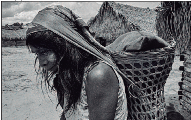
As imagens levam o público a adentrar em um universo de histórias silenciosas, de tradições milenares

ferir o lançamento da biografia de MacGregor, escrita por Silveira, fruto de ampla pesquisa. A iniciativa é uma homenagem ao legado artístico de MacGregor, que faleceu há uma década. Entrada gratuita. Quando: Terça-feira (4). Onde: Museu de Arte de Goiânia, no Bosque dos Buritis. Horário: das 8h às 12h e das 13h às 17h.