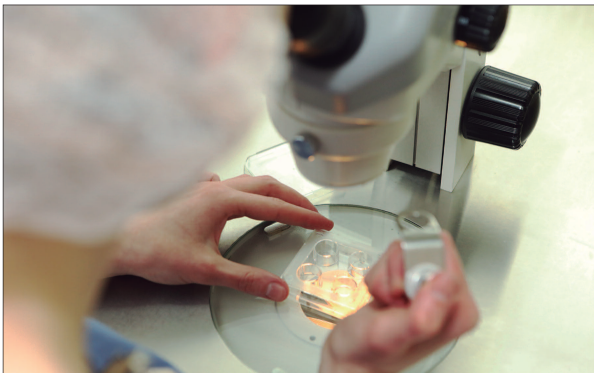
A fertilidade da mulher está, de fato, diretamente relacionada à sua idade

Enquanto isso, os homens também enfrentam os efeitos do tempo, embora de maneira menos intensa. A produção de espermatozoides tende a diminuir com a idade, mas esse impacto é mais suave e gradual do que nas mulheres. No entanto, a ideia de que a fertilidade feminina é uma "corrida contra o tempo" tem sido desafiada pelos avanços na medicina reprodutiva, que proporcionam novas possibilidades para mulheres que dese-