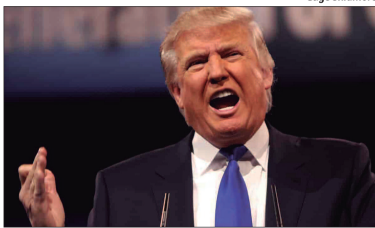
Corte de US$ 400 milhões será discutido pelos membros da OMS

Em resposta, a OMS iniciou uma série de medidas para conter os impactos financeiros dessa perda de financiamento. As ações incluem uma revisão estratégica de prioridades e um plano de redução de custos que visa garantir a continuidade de sua missão, especialmente em países em desenvolvimento que dependem da assistência e orientação da organização. A proposta de corte no orçamento será debatida durante a 76ª Assembleia Mundial da Saúde, com foco em ajustar as operações sem comprometer a qualidade dos ser-