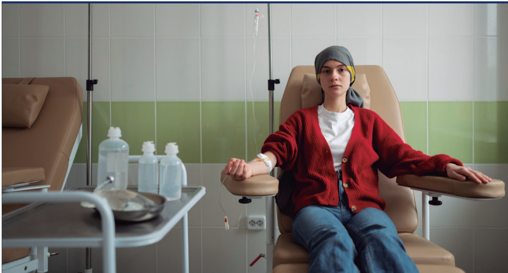
Inca estima mais de 25 mil diagnósticos ocorrerão em Goiás em 2025; confira a lista abaixo