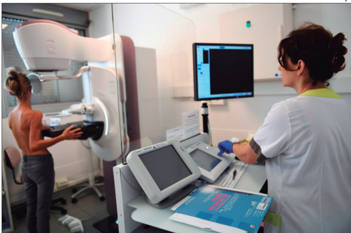
A realização de exames regulares ajudam a identificar a doença em estágios iniciais

Segundo informações do Instituto Nacional do Câncer (Inca), mais de 700 mil novos casos são esperados para 2025