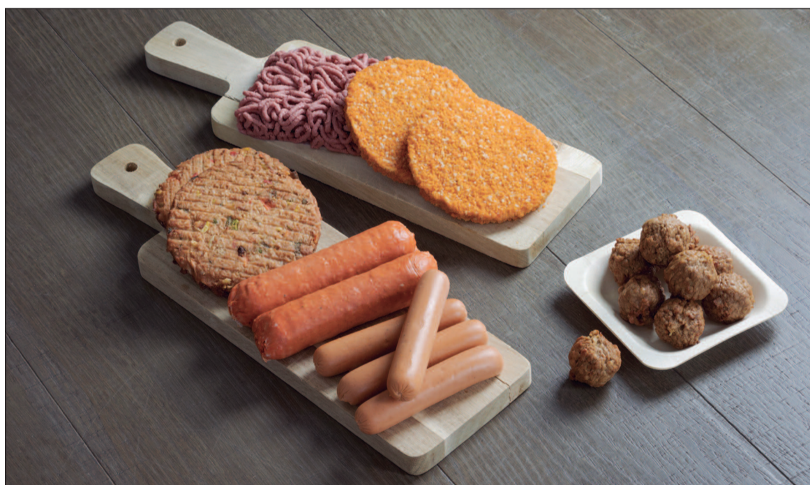
Em 2019, 57 mil mortes prematuras ocorreram devido ao consumo excessivo de ultraprocessados

Os resultados mostraram que 66% das calorias diárias dos veganos vêm de alimentos in natura e minimamente processados, que são os que passam por pouca ou nenhuma alteração, como adição de sal ou açúcar. Por outro lado, aqueles que consumiam mais alimentos ultraprocessados estavam mais propensos a não atingir a quantidade ideal de proteínas. Esse achado faz sentido, pois fontes vegetais inteiras, apesar de ricas em nutrientes, tendem a ter menor