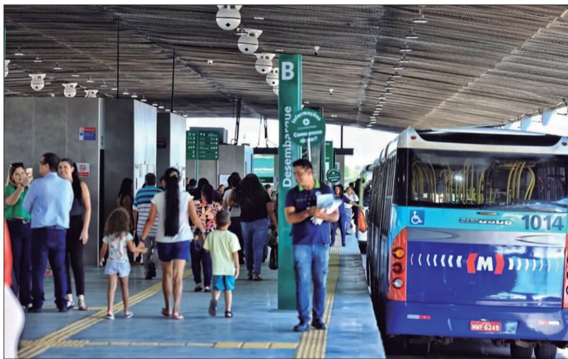
Goiânia possui a oitava tarifa mais acessível entre as capitais brasileiras no transporte coletivo

Por outro lado, Trindade e Goianira ainda não apresentaram medidas concretas para retomar os repasses ou negociar os atrasados. Essa postura pode comprometer o projeto de modernização do sistema, afetando diretamente benefi-