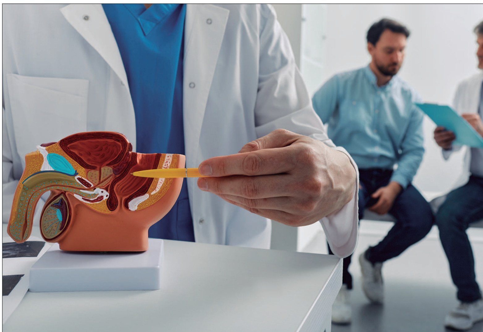
De acordo com a Sociedade Brasileira de Urologia, 57% dos homens desconhecem a existência da andropausa.

A andropausa, ou Deficiência Androgênica do Envelhecimento Masculino (DAEM), é caracterizada pela redução gradual da testosterona no corpo masculino. Esse hormônio é essencial para diversas funções vitais, como o desenvolvimento muscular, a libido, a saúde óssea e a produção de células sanguíneas. O processo de envelhecimento afeta essa produção, com uma média de queda de 1,2% ao ano nos níveis de testosterona, normalmente entre os 40 e 55 anos. Entre os sintomas mais comuns estão a perda de energia, diminuição da massa muscular, disfunção