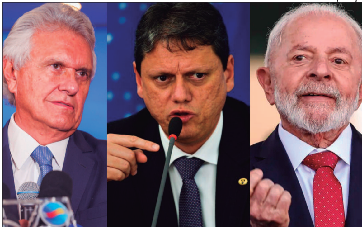
União Brasil têm se dividido entre Caiado e o governo Lula, enquanto o Republicanos parece seguir com Tarcísio e o Planalto tentando neutralizar opositoristas

Com seu retorno à presidência do Senado, Alcolumbre terá papel central na condução de alguns projetos, como a PEC dos militares, a segunda fase da Reforma Tributária e o novo Código Eleitoral. No entanto, sua liderança será testada pela