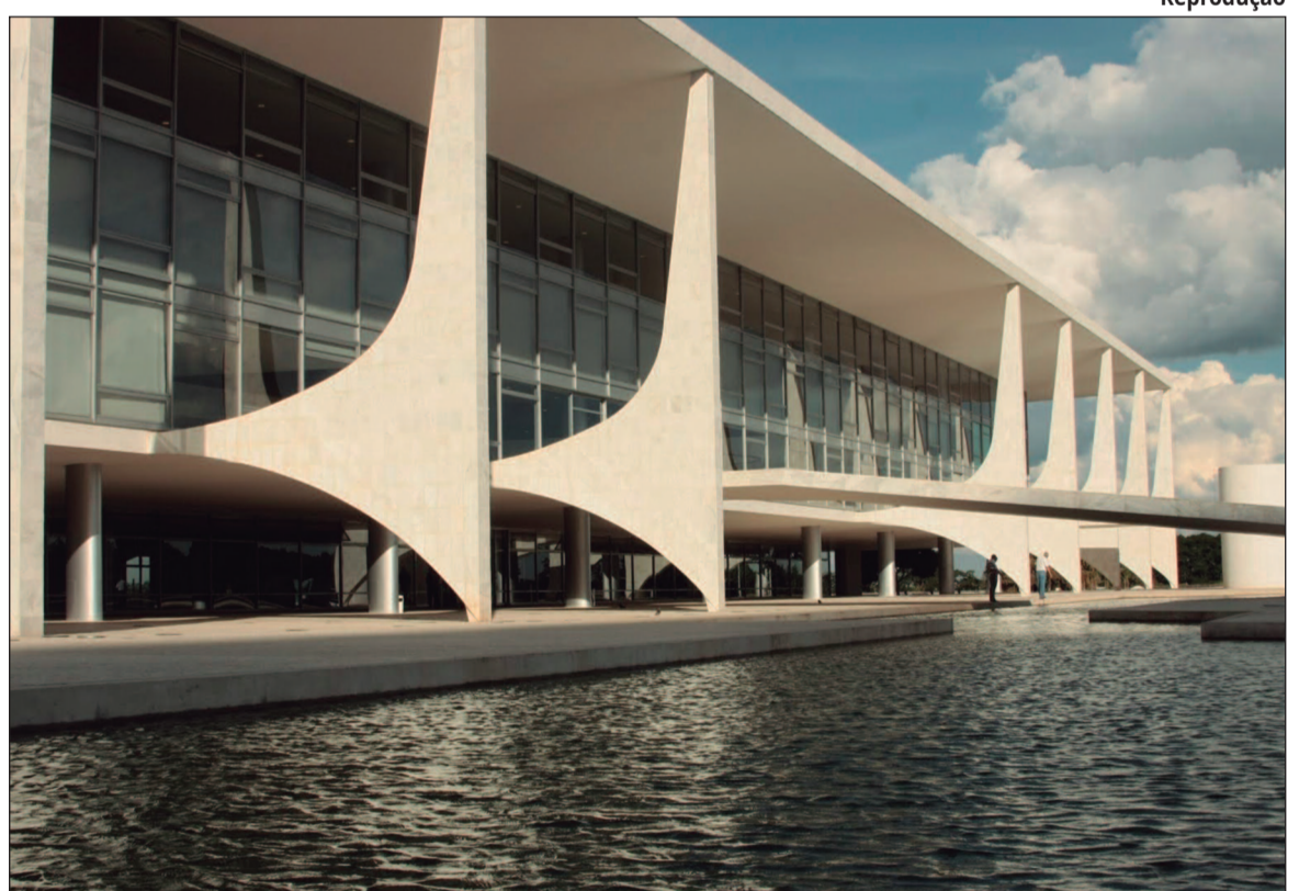
Lula fez as declarações em uma rodada de entrevista em rádio de Minas Gerais