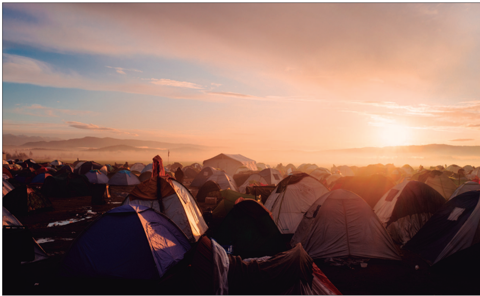
Desafios crescem para nações receptoras

A crise de refugiados está diretamente ligada aos conflitos geopolíticos, como a guerra na Síria, que gerou uma das maiores crises migratórias da história, e à violência em países como o Afeganistão, Somália e República Democrática do Congo. No entanto, um novo fator vem agravando ainda mais essa situação: as mudan-