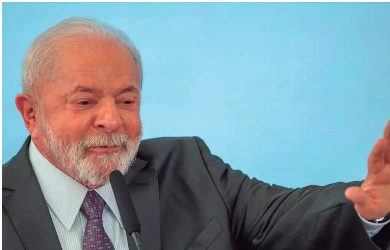
Lula segue como representante único no campo da esquerda

Com o ex-presidente Jair Bolsonaro (PL) fora da disputa, devido à condenação do Tribunal Superior Eleitoral (TSE) que o tornou inelegível, o campo direitista não apresenta um nome como unanimidade entre os eleitores. Com isso, diversos nomes são especulados na disputa presidencial, como o governador de Goiás, Ronaldo Caiado (União Brasil); o governador de São Paulo, Tarcísio de Freitas (Republicanos); o governador de Minas Gerais, Romeu Zema (Novo); o governador do Paraná, Ratinho Jú-