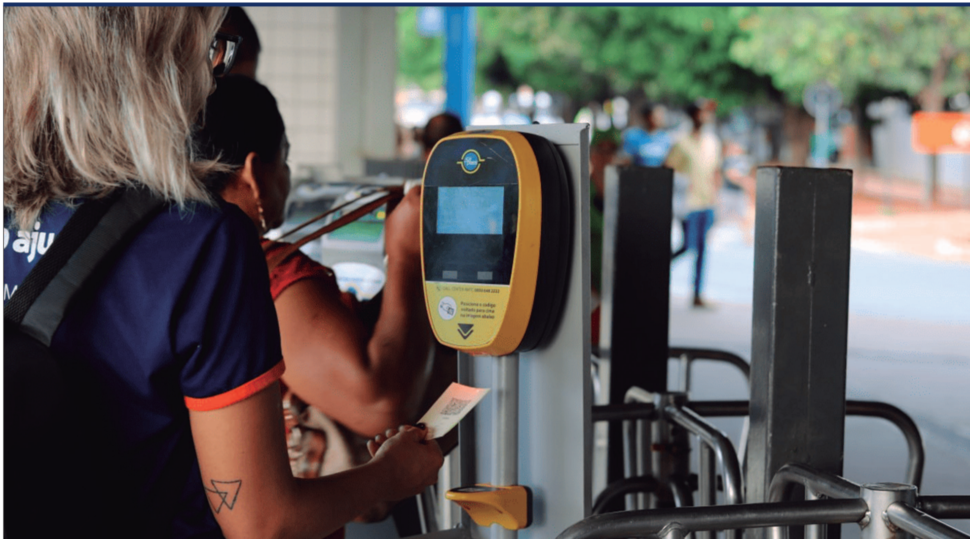
O subsídio ao transporte coletivo é uma parceria entre o Governo de Goiás e as prefeituras da capital e região metropolitana