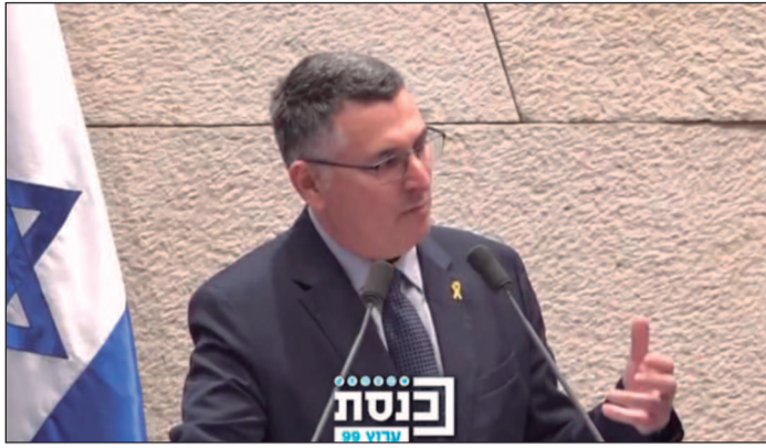
Ministro de Relações Exteriores do país, Gideon Sa'ar, oficializou saída dos israelenses do conselho