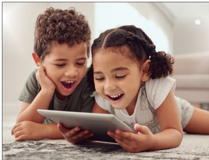
Aplicativo lúdico promove a higiene bucal de forma interativa