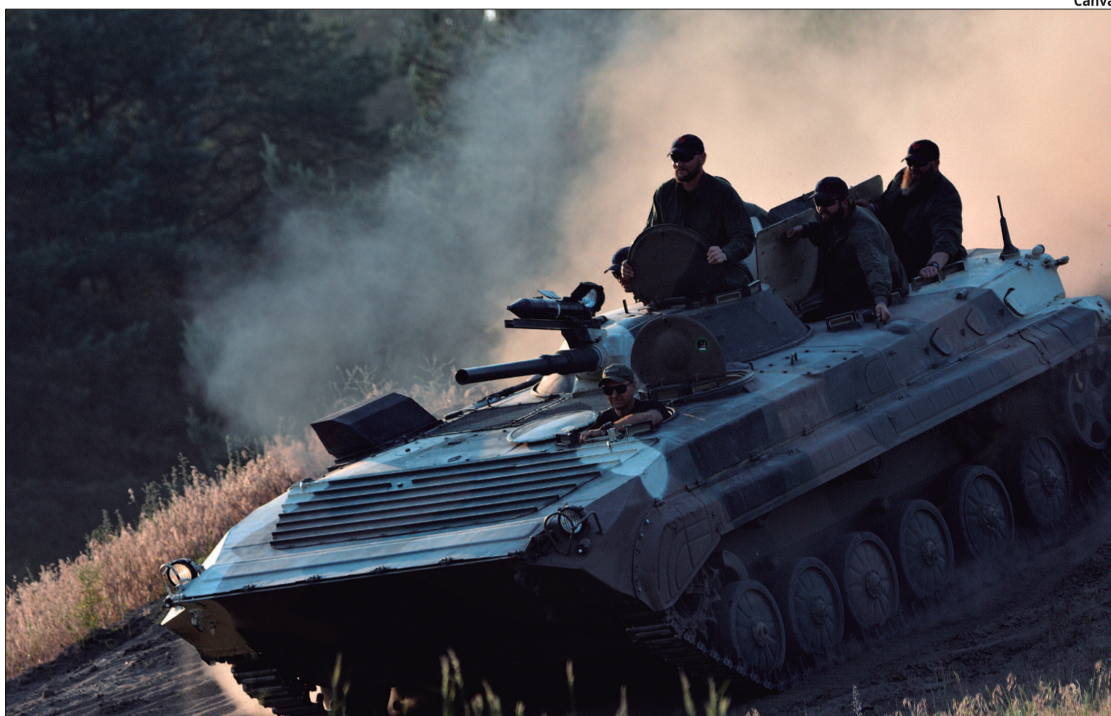
Os países ampliam orçamentos de defesa para enfrentar novas ameaças globais

Os Estados Unidos continuam a ser o maior gastador militar do mundo, com um orçamento de defesa de US$ 877 bilhões, o que representa cerca