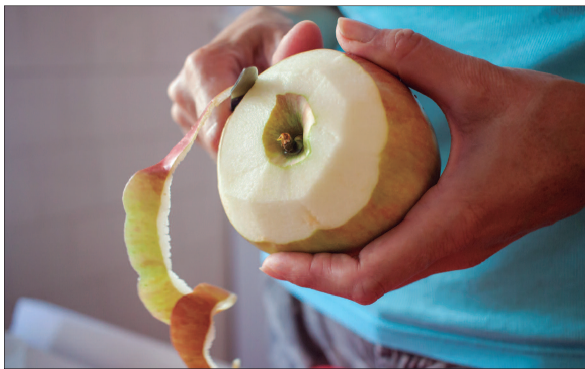
A indústria tem demonstrado interesse em aproveitar melhor os nutrientes e a energia das cascas

Uma solução para mitigar esse impacto seria redirecionar os resíduos alimentares para a compostagem, em vez de enviá-los aos aterros, o que ajudaria a reduzir a emissão de metano. No entanto, muitas vezes, o que consideramos resíduos é, na verdade, comestível. A indústria ali-