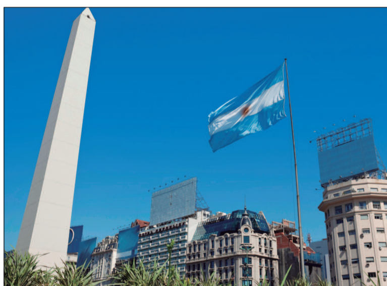
O Congresso argentino está se preparando para votação histórica

A proposta recebeu apoio de diversos setores da sociedade, incluindo movimentos populares, organizações de direitos humanos e partidos de oposição, que consideram