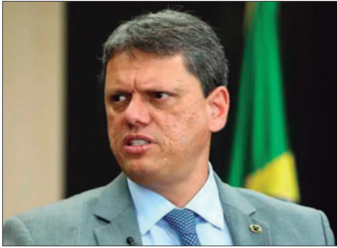
Governador de SP elogiou redução da criminalidade e avanço da educação