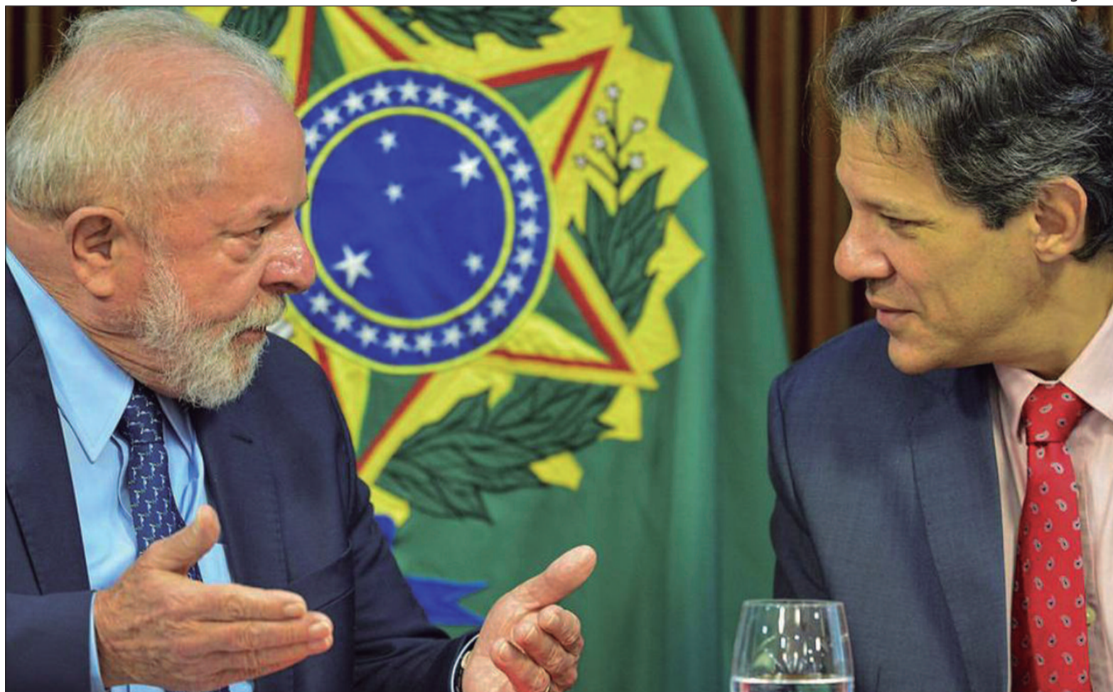
Ação governista tenta diminuir poder do parlamento sobre o orçamento público. Lula (esquerda) e Haddad (direita)

Em agosto do ano passado, o Partido Socialismo e Liberdade (Psol) entrou com uma ação para aumentar a transparência das emendas, que estavam sendo repassadas sem critérios, para os estados e as prefeituras. À época, a ação foi acolhida pelo ministro Flávio Dino que bloqueou imediatamente o pagamento específico de 5.449 emendas de comissão. Dessa forma, entendendo como uma ação governista de diminuição do poder do parlamento sobre o orça-