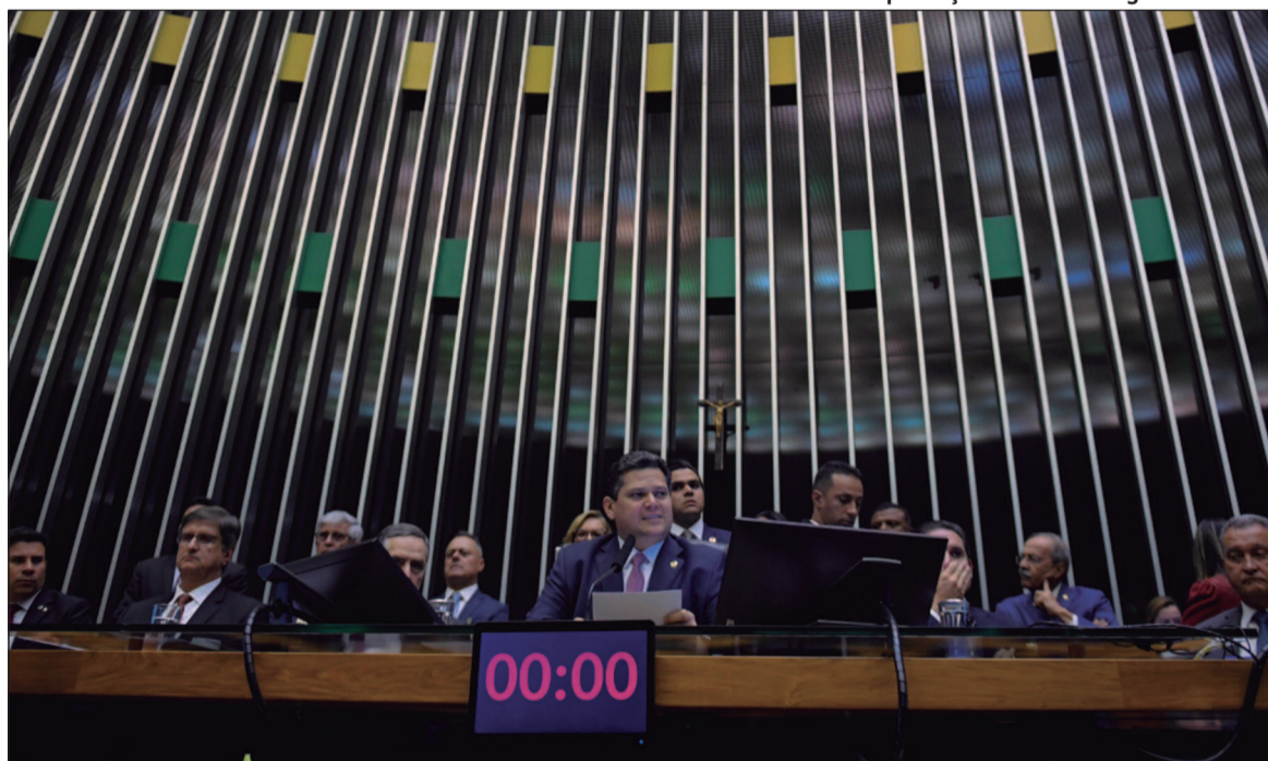
PLP deve ser votado em plenário antes de outubro para que seja integrada na eleição de 2026

Organizações como a Instituto Marielle Franco, Instituto de estudos socioeconômicos (INESC), Transparência Partidária, Transparência Eleitoral