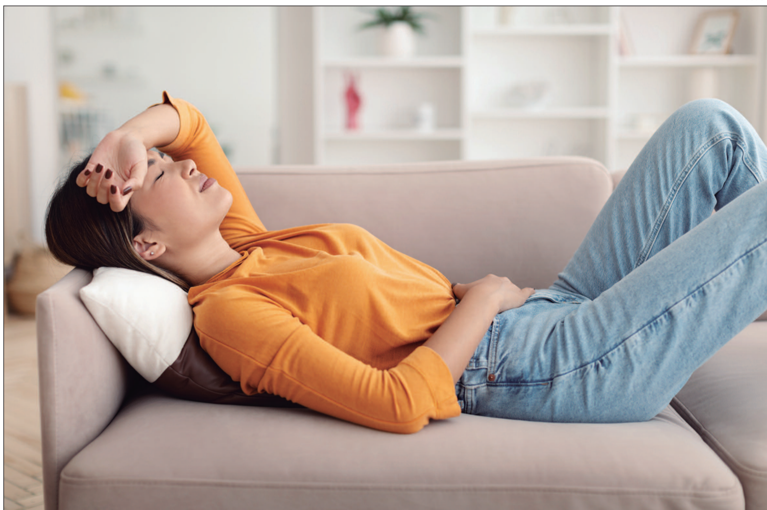
Cerca de 50% das mulheres sofrem de cólicas menstruais, com 15% enfrentando dores intensas que impactam suas atividades diárias.

A dor é causada pela liberação de prostaglandinas, substâncias químicas que provocam as contrações uterinas.