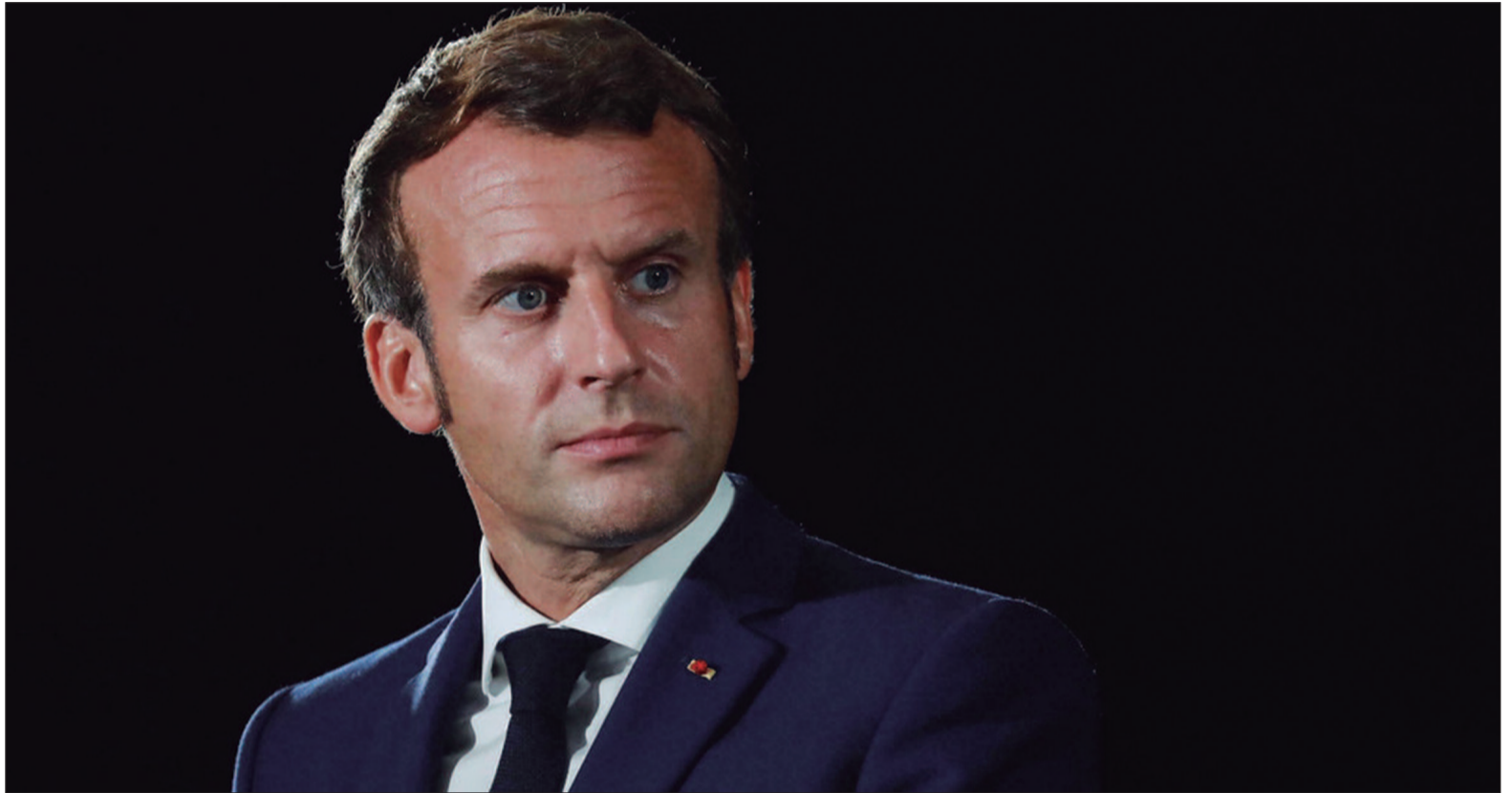
A França pondera fortalecer a defesa com armas nucleares

Macron, que sempre defendeu a soberania da França dentro da União Europeia e o fortalecimento das suas capacidades de defesa, agora enfatiza a importância de integrar as potências nucleares europeias, com a França à frente desse esforço. Durante a entrevista, ele afirmou que, em tempos de instabilidade global, a dissuasão nuclear não deve ser vista apenas como um escudo para o país, mas como um mecanismo para garantir a segurança coletiva. A expansão des-