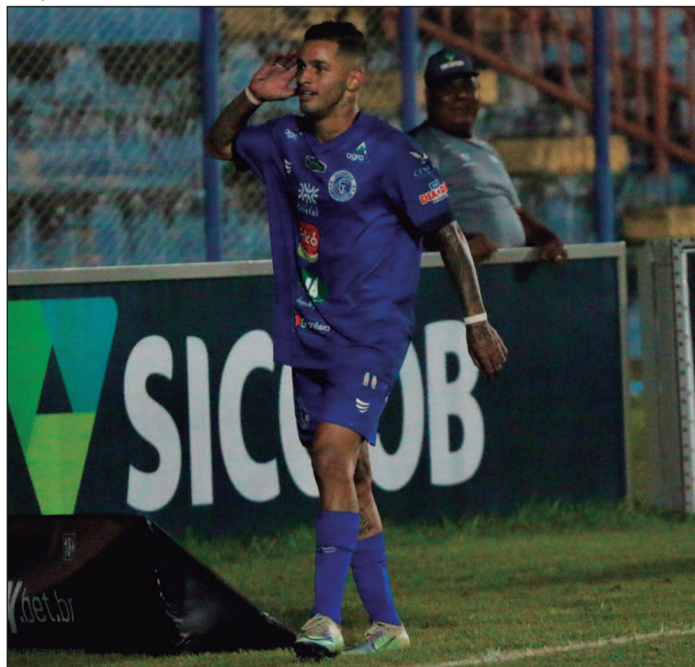
A estreia do Goianésia será no dia 12 de abril contra o Ceilândia-DF