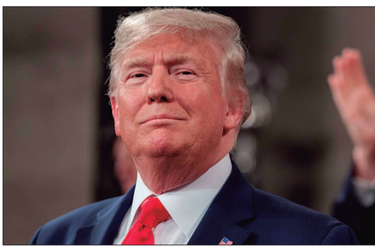
Mudança visa reduzir a intervenção federal na educação pública

Ao anunciar a assinatura da ordem executiva, Trump reiterou que o desmonte do