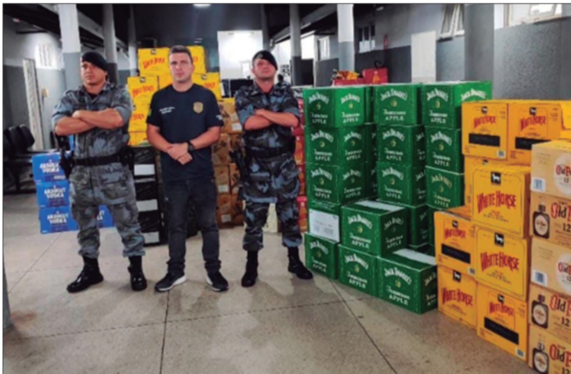
A Polícia Civil e a PM de Goiás apreenderam 211 caixas de bebidas adulteradas em Goiânia, que seriam vendidas a preços baixos

As investigações revelaram que as bebidas estavam armazenadas em garrafas de uísque e vodca de marcas famosas e seriam vendidas durante o Carnaval a preços muito abaixo do mercado. A origem dos líquidos foi rastreada até o es-