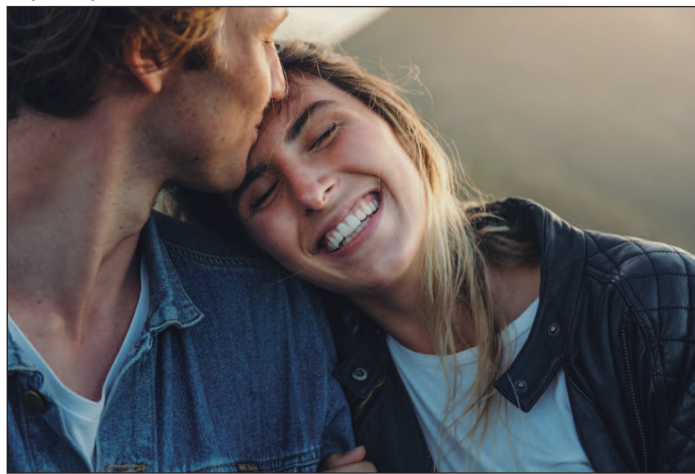
O amor por estranhos gerou a menor ativação cerebral