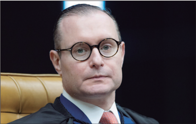
Ministro do STF rejeita habeas corpus coletivo da oposição