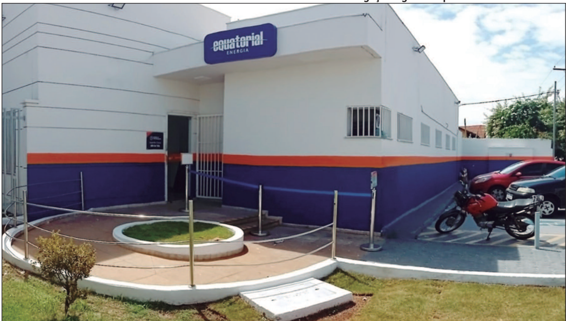
Divulgação/Agência Equatorial Goiânia Sudoeste

Em 2024, a empresa registrou 1,19 — número inferior aos 1,66 do ano anterior, mas ainda acima do limite regulatório. O consumidor goiano ficou, em média, 15,91 horas