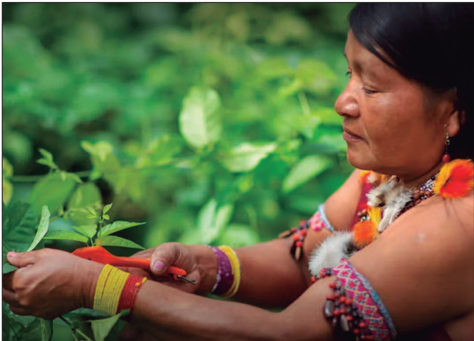
Estudo aponta que vegetação nativa é mais conservada em territórios indígenas