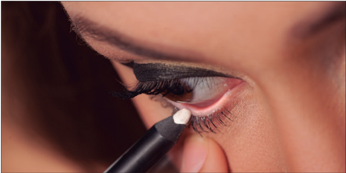
É importante adotar uma rotina de higiene adequada

Além disso, o uso diário do lápis de olho é desaconselhado, pois pode prejudicar a saúde ocular. O contato frequente de substâncias cosméticas com a linha d'água pode gerar instabilidade no filme lacrimal, inflamação nas margens das