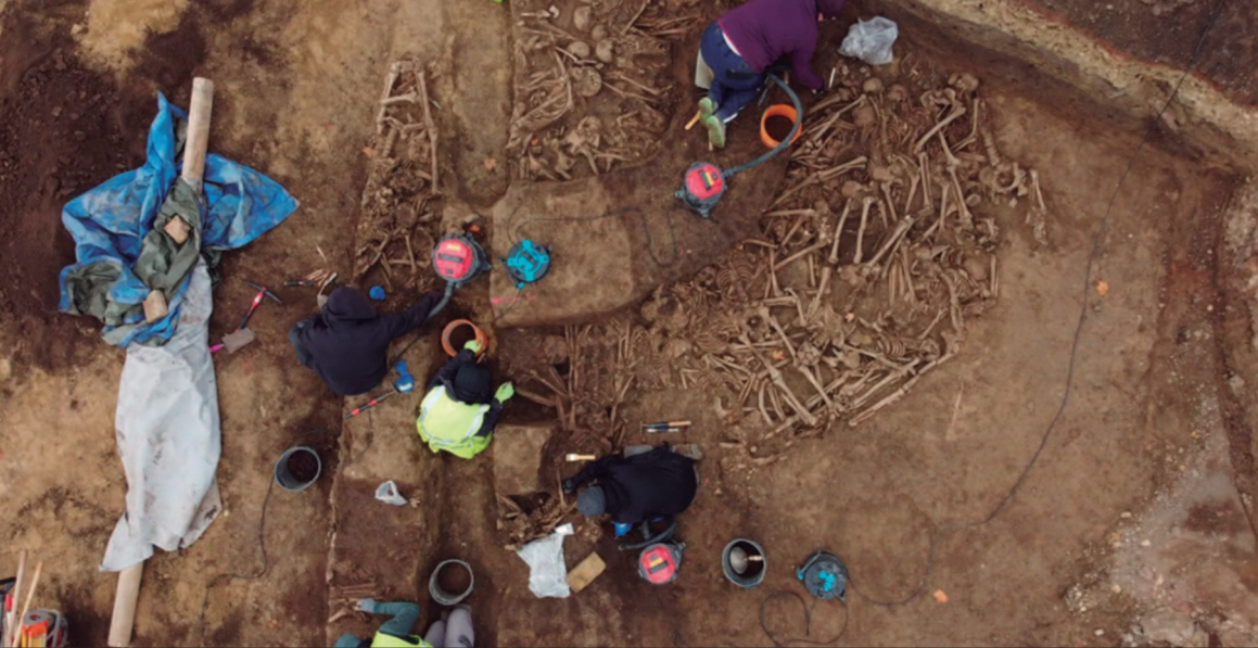
ONU denuncia restrições impostas pelo governo militar, agravando crise humanitária