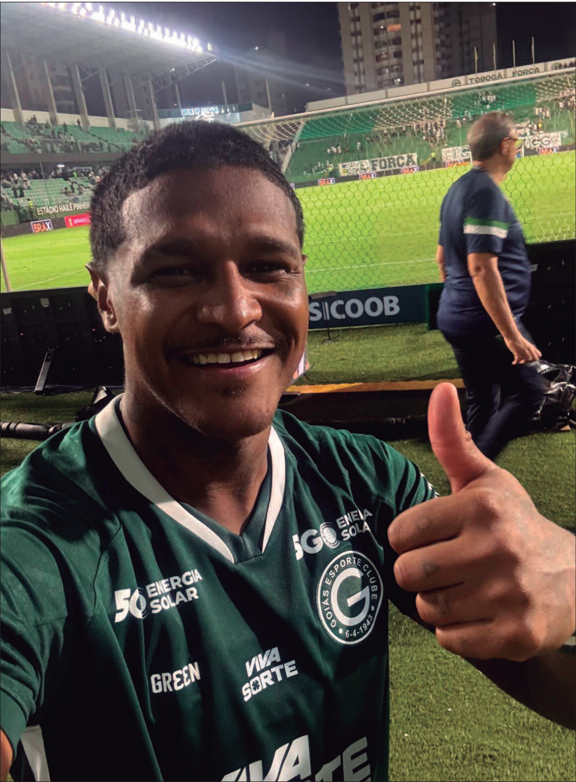
A equipe esmeraldina entrou em campo determinada a impor seu ritmo