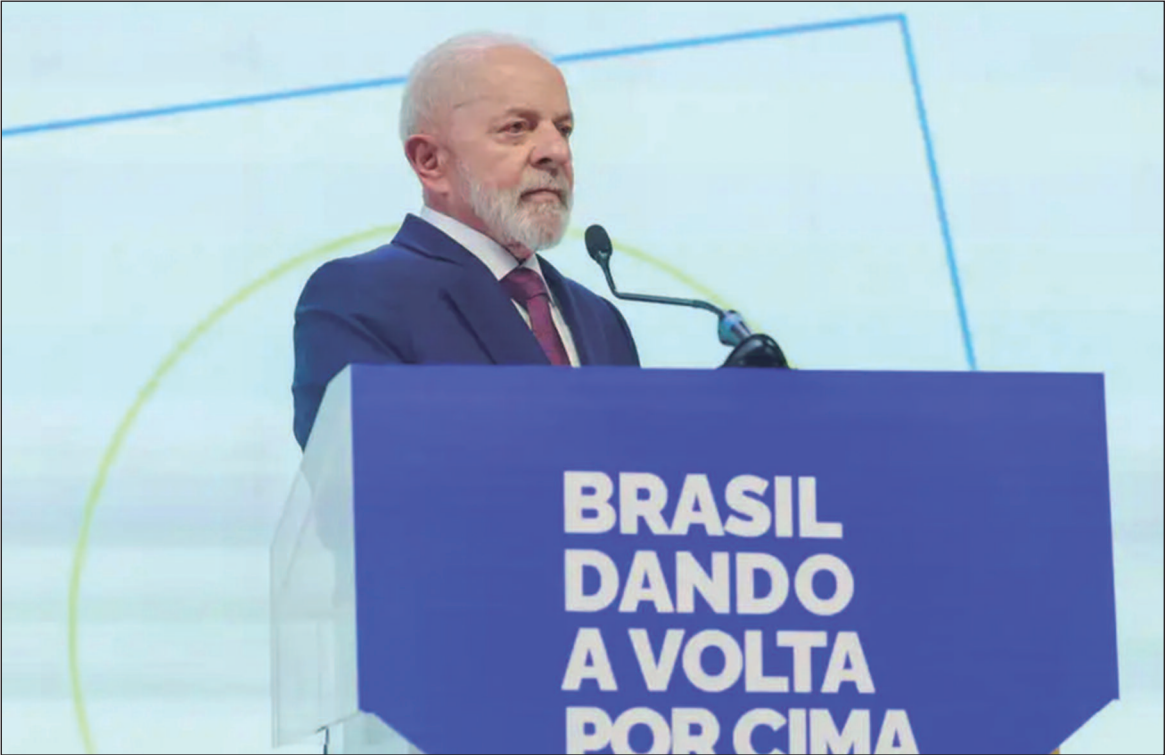
Em um movimento político, governo federal amplia faixa de adesão

Em meio à queda nas pesquisas de popularidade, o governo Lula (PT) a ampliação do programa Minha Casa Minha Vida, elevando o limite de renda familiar de R$ 8 mil para R$ 12 mil. A medida, apresentada no evento “O Brasil dando a volta por cima”, busca reconquistar o apoio da classe média, segmento onde o presidente tem perdido espaço. A expansão do programa foi viabilizada com recursos do Fundo Social do Pré-Sal, que agora financiará as faixas mais altas do projeto. Com a mudança, famílias poderão adquirir imóveis de até R$ 500 mil, com prazo de pagamento em 35 anos e taxa de juros de 10,5% ao ano. A iniciativa deve bene-