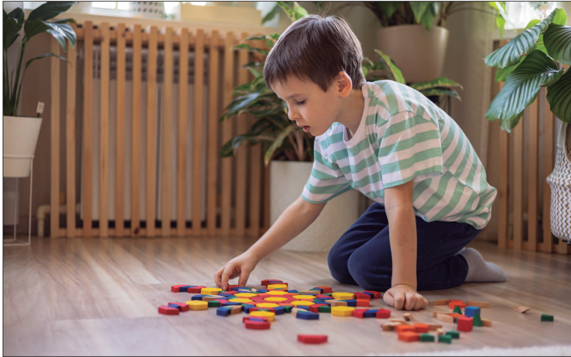
Pais e responsáveis ainda têm dificuldades para identificar os primeiros sinais do autismo

Neste contexto, novos avanços científicos oferecem esperança. Recentemente, surgiram propostas de tratamentos inovadores que podem ajudar a melhorar a qualidade de vida de indivíduos com autismo.