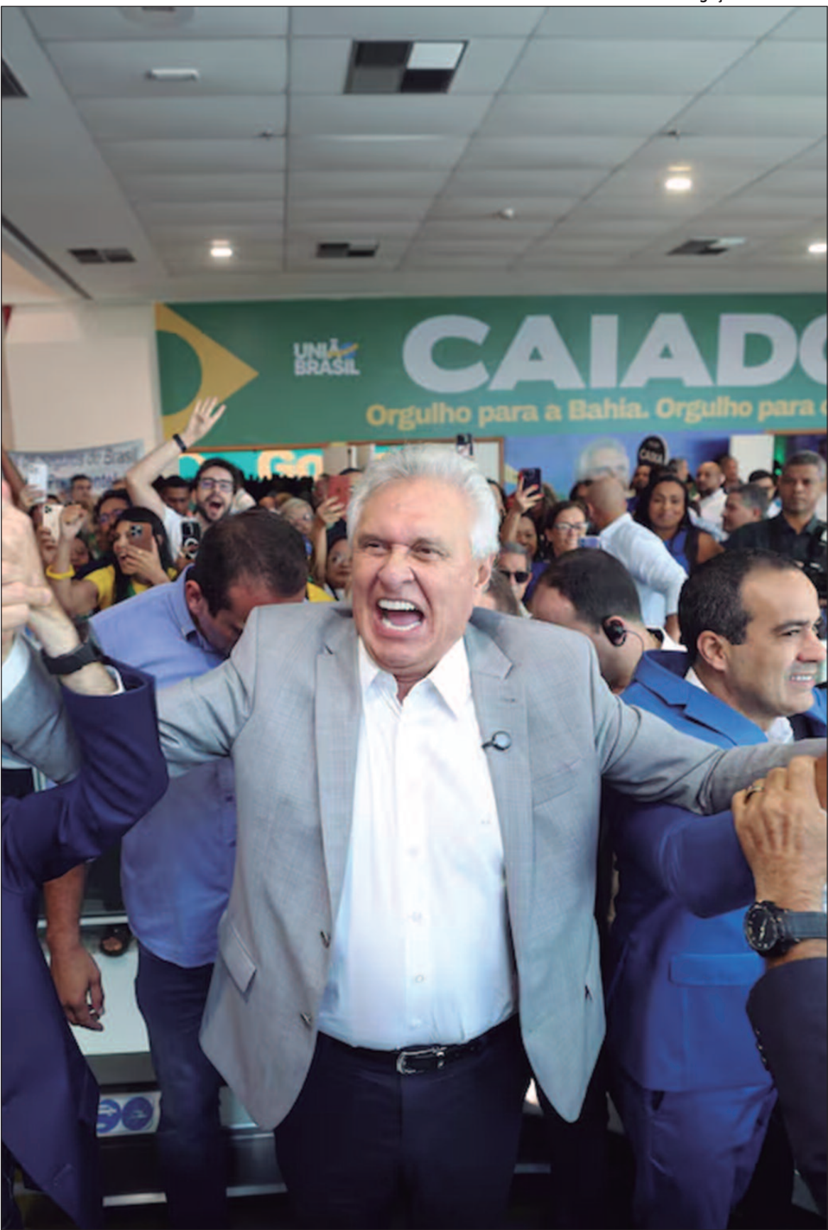
Governador também foi homenageado com o título de Cidadão Baiano e a Comenda 2 de Julho, a mais alta honraria concedida pela Assembleia Legislativa da Bahia