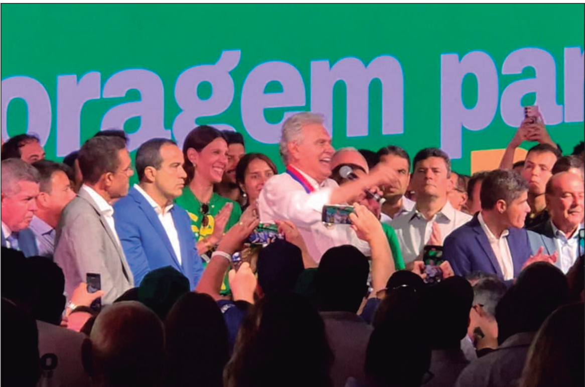
Caiado afirmou que deve deixar a gestão estadual dentro de um ano, sem especificar uma data

Caiado tem experiência parlamentar, tenho sim, porque nós aprendemos no parlamento que precisamos ter maioria construída. É uma grande escola. Ninguém é dono. Ninguém aprova projeto se não tiver maioria, se não tiver capacidade de diálogo. É no argumento que se vence e foi assim que nós superamos todas as dificuldades daquele estado", continuou.