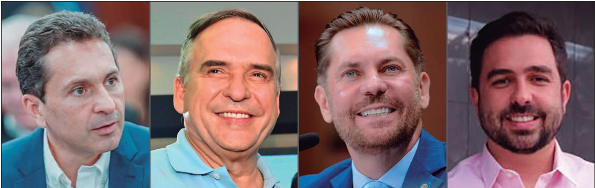
Lideranças nacionais e mais de 100 prefeitos goianos prestigiaram o ato político