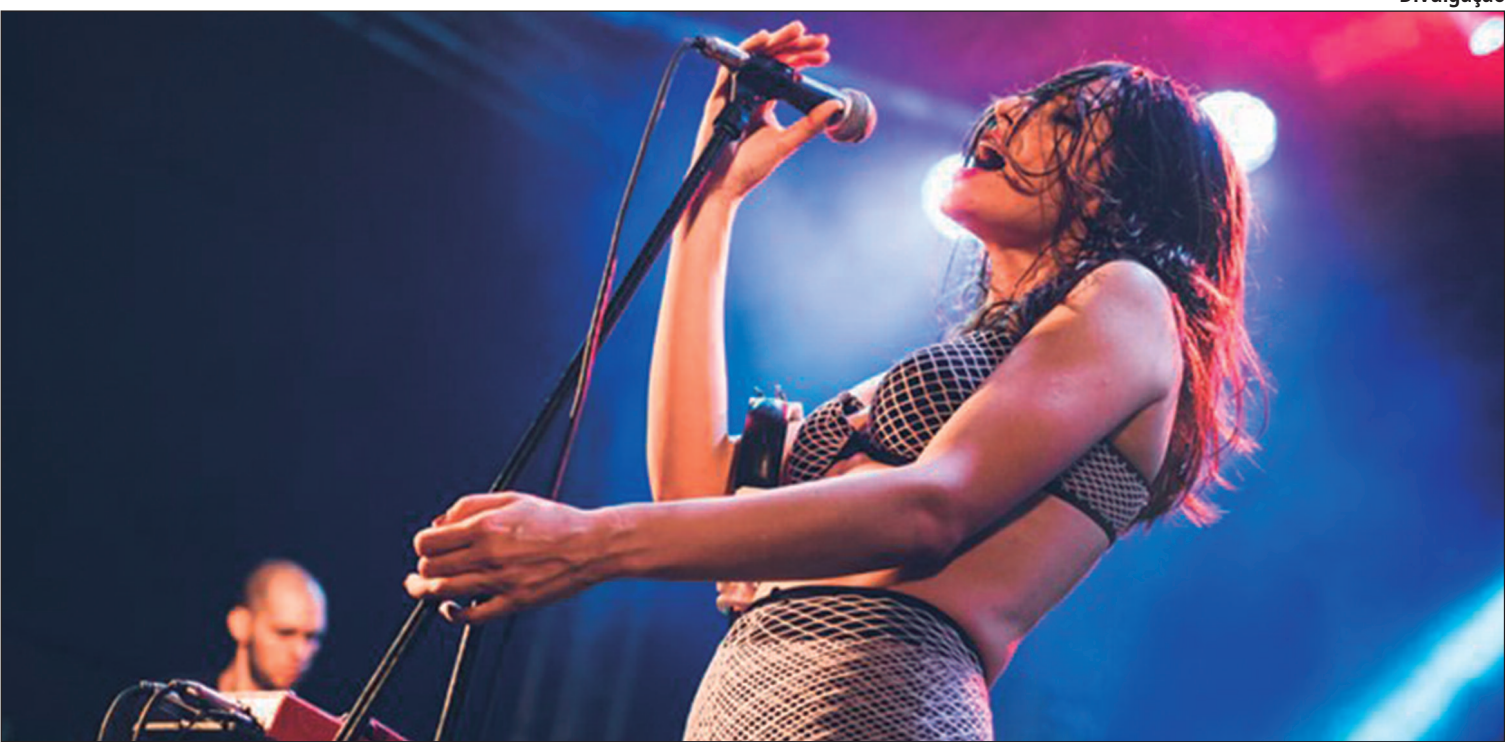
Banda goiana celebra 10 anos de carreira neste sábado (5), no Cidade Rock

A banda goiana Carne Doce celebra uma década de carreira neste sábado (5), com um show especial no Centro Cultural Martim Cererê, como parte do evento Cidade Rock. Além da banda, sobem ao palco Pink Opala, Synx, Sangra D'Água e Prehistoric Music Department. A entrada é gratuita até as 20h, mediante doação de 1 kg de alimento. Após esse horário, os ingressos custam R$ 30,00, com meia-entrada válida mediante doação. Quando: Sábado (5). Onde: Travessa Bezerra de Menezes, Setor Sul, Goiânia. Horário: 19h. Ingressos: Gratuitos até as 20h (com doação de 1 kg de alimento). Após esse horário, R$ 30,00 (meia-entrada válida com doação).