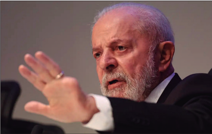
Para ele, economia continuará a crescer acima do previsto