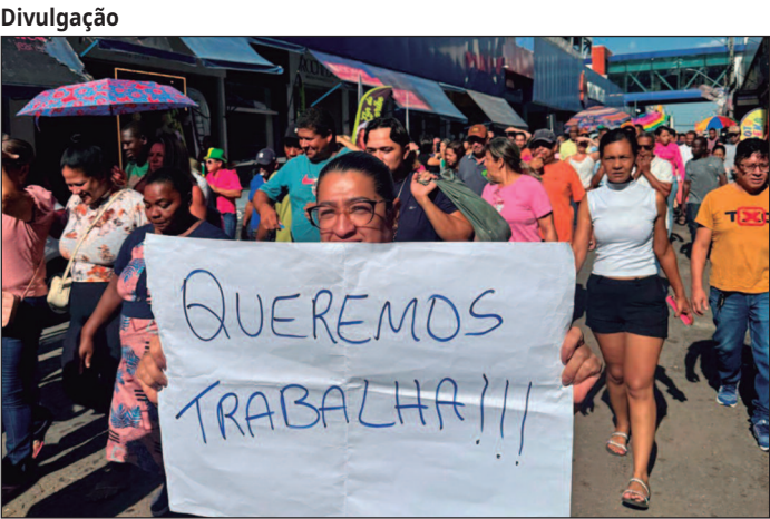
Grupo exige alternativas de trabalho