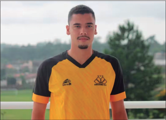
Até o momento o clube já anunciou dois reforços

ta atuou antes de ser contratado pelo Azulão. Em sua última temporada na Série A3, Jhoninha participou de 17 jogos com três gols e duas assistências. No Goianão 2025, o Goiatuba quase conseguiu classificar para a fase de mata-mata da competição, para isso o Azulão precisava entrar no G8, porém na classificação geral o clube ocupou a nona colocação na tabela com 13 pontos, mesma pontuação que a Jataiense e a Abecat Ovidoreense, sétimo e oitavos colocados respectivamente. Pelo Brasileiro Série D, o Goiatuba faz sua estreia neste sábado (12), contra a Inter de Limeira no Estádio Divino Garcia Rosa. Até o momento, o clube já anunciou onze reforços para reforçar o clube na competição nacional. (Thais Teixeira, especial para O Hoje)