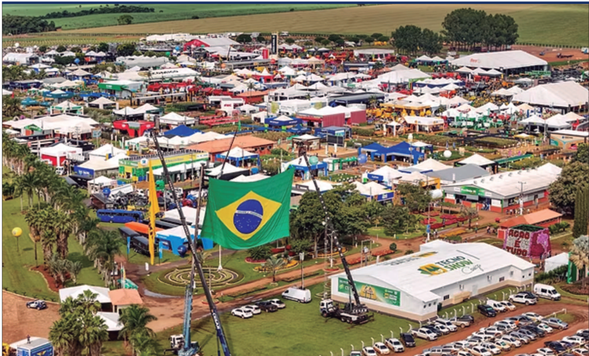
A abertura oficial marca o início de uma semana intensa, dedicada à inovação, ao conhecimento e às oportunidades no agronegócio nacional