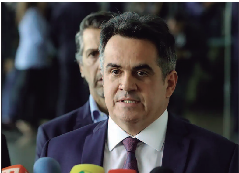
A federação também afetaria diretamente as pré-campanhas presidenciais

Um movimento em curso no Congresso pode redesenhar completamente o tabuleiro político para as eleições de 2026. O Progressistas (PP) e o União Brasil (UB) estão em fase final de negociações para formar uma federação partidária que, se concretizada, se tornaria a maior força legislativa do país, com potencial para complicar os planos de reeleição do presidente Luiz Inácio Lula da Silva (PT) e redefinir as estratégias da oposição. O novo bloco reuniria 108 deputados federais – superando o PL (92), atual maior bancada da Câmara –, 13 senadores, seis governadores e cerca de 1.400 prefeitos, espalhados por todos os estados. A força numérica viria acompanhada de um ali-