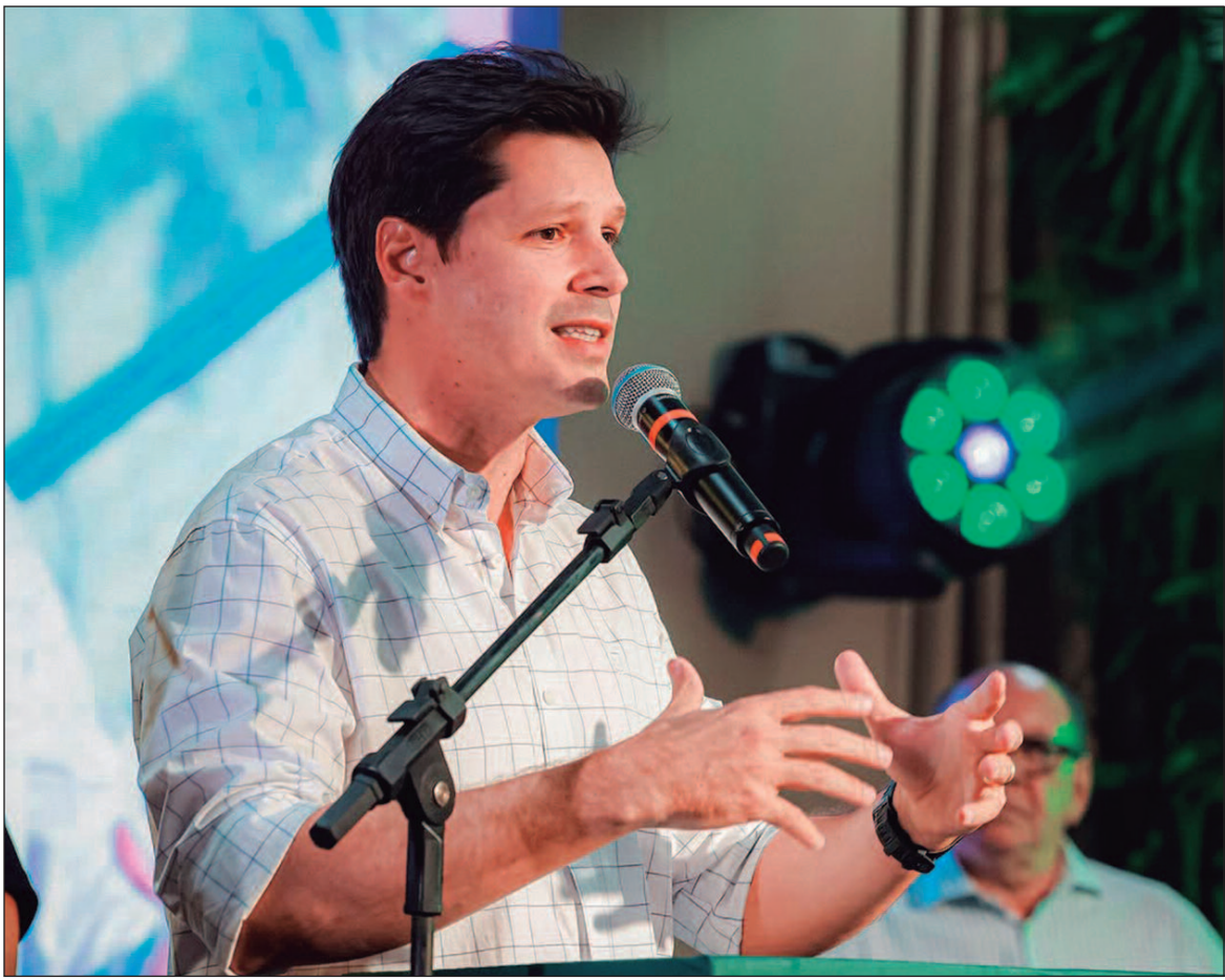
A feira segue até o dia 11 de abril, funcionando diariamente das 8h às 18h, com entrada e estacionamento gratuitos para o público

A abertura oficial marca o início de uma semana intensa, dedicada à inovação, ao conhecimento e às oportunidades no agronegócio nacional. Um dos destaques do evento é o lançamento da ferramenta Dris COMIGO, plataforma voltada