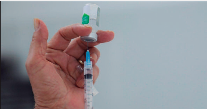
Goiás também realizará o Dia D da vacinação contra a gripe no dia 10 de maio, com mobilização em todo o estado