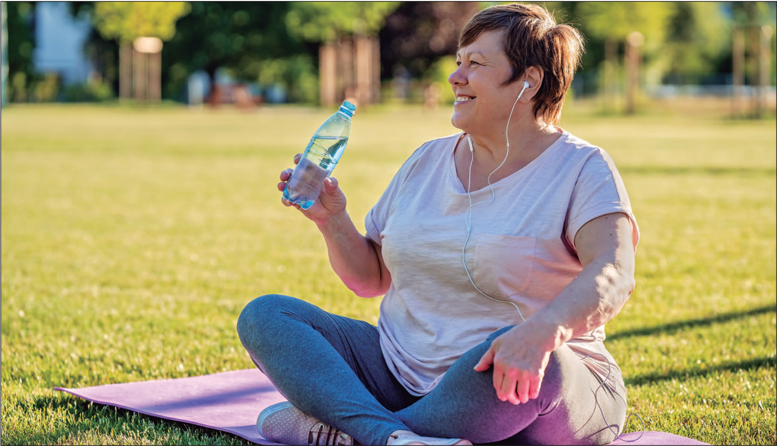
A caminhada é indicada para melhorar a saúde cardiovascular e respiratória

A musculação é um dos exercícios mais recomendados durante a menopausa, pois fortalece os músculos, que são fundamentais para o suporte das articulações, prevenindo doenças musculoesqueléticas. Ela também contribui para a prevenção da perda de massa óssea e do desenvolvimento de osteoporose, além de acelerar o metabolismo, evitando o aumento de peso e o acúmulo de gordura abdominal. A musculação também ajuda