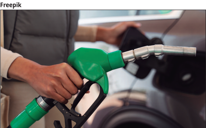
A queda de preços aconteceu em 12 estados e no Distrito Federal. Em seis estados, o combustível ficou mais caro