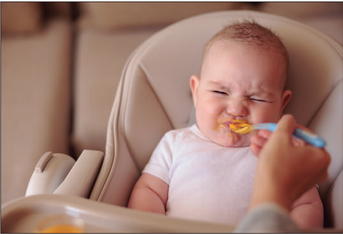
As coletas ocorreram entre 2016 e 2017