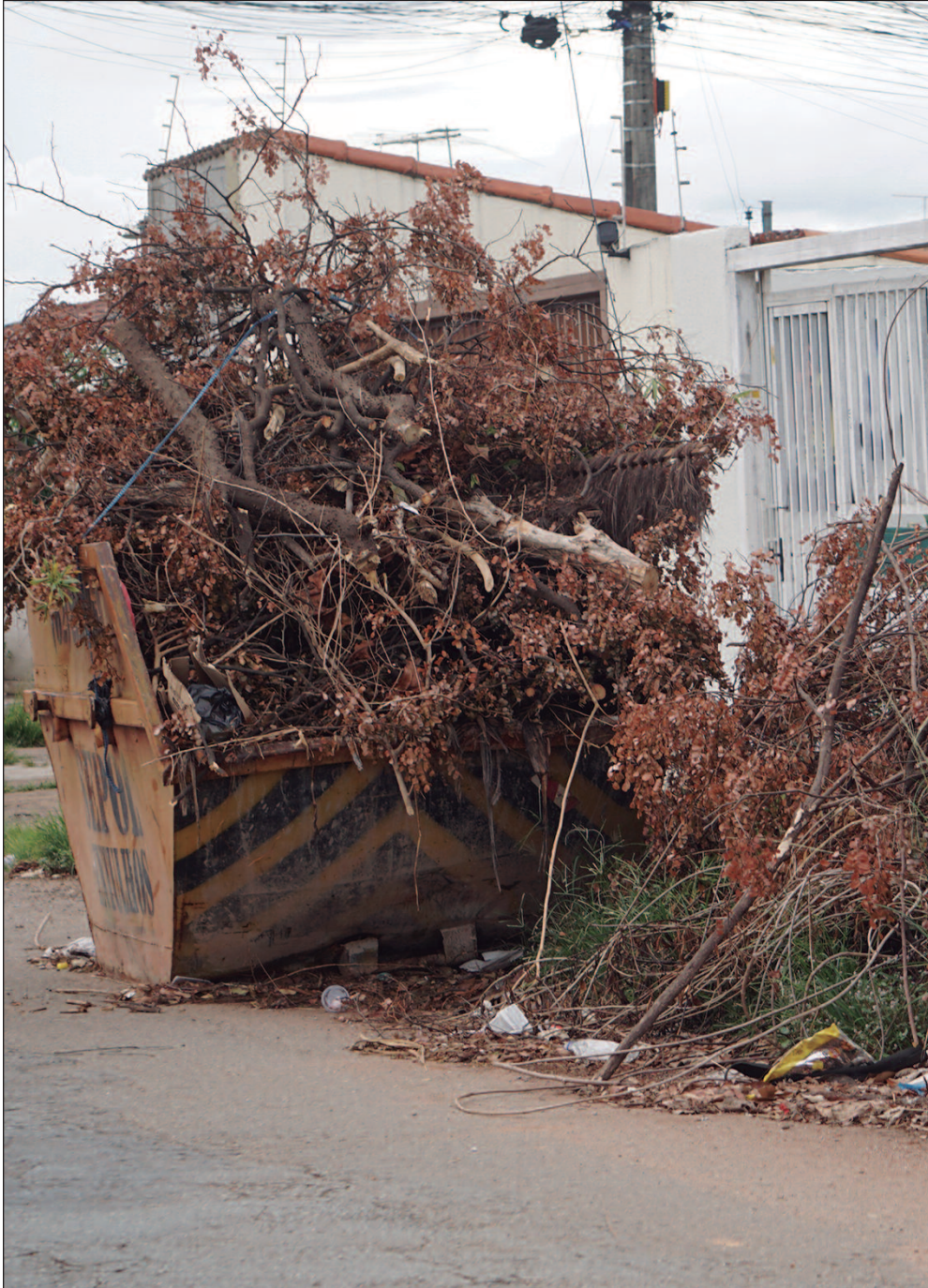
Eduarda Leão/O HOJE