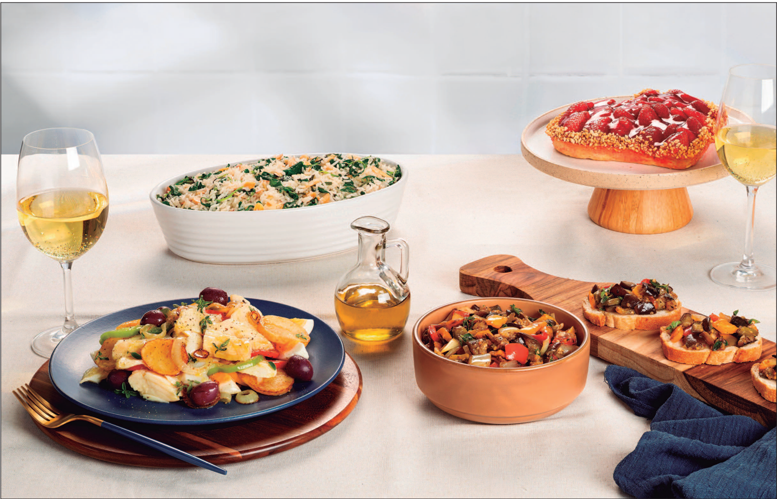
Mais do que um prato típico, o bacalhau à mesa representa tradição, sabor e cuidado com a saúde