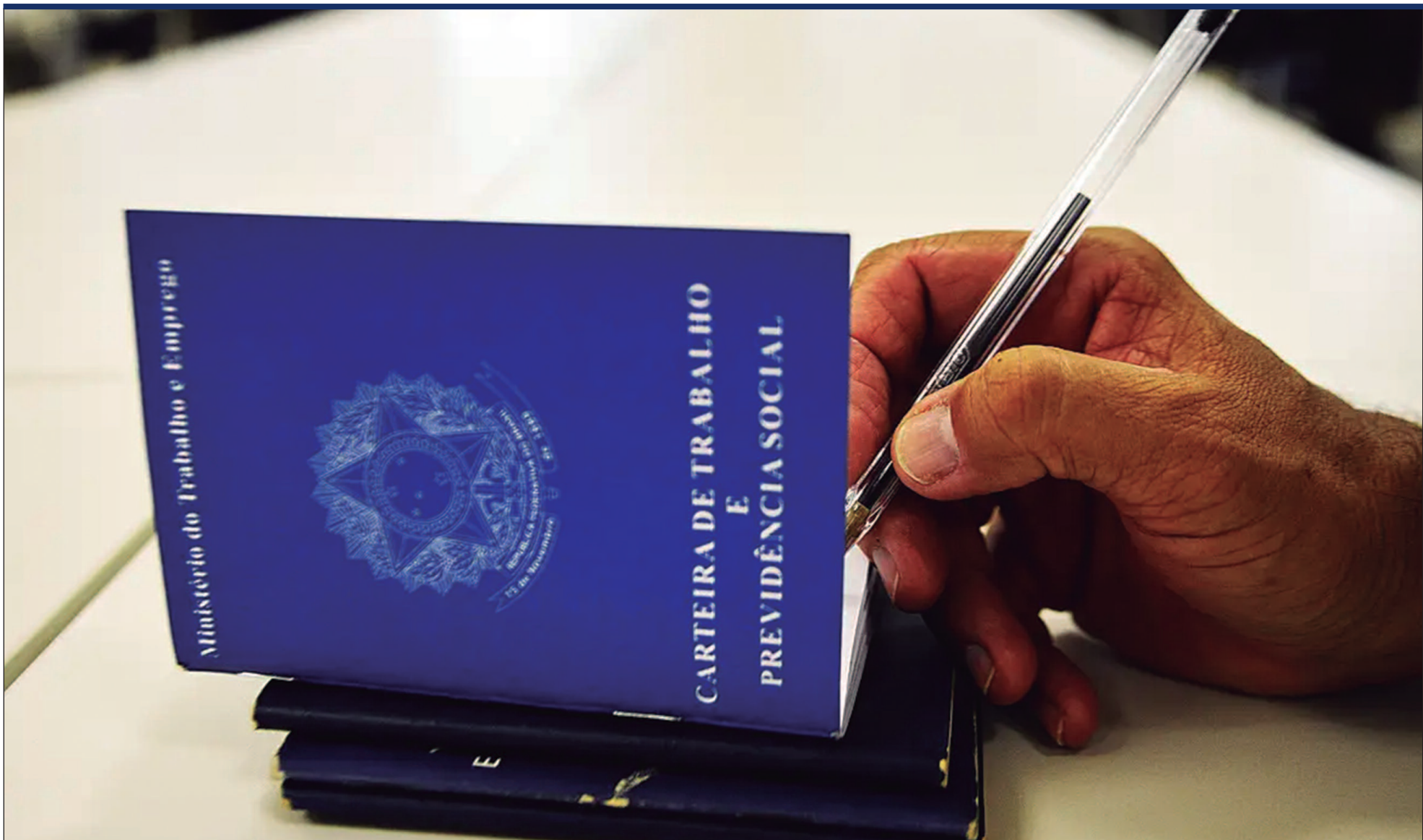
STF decide suspender todos os processos trabalhistas que discutem a legalidade ou ilegalidade da pejetização no país