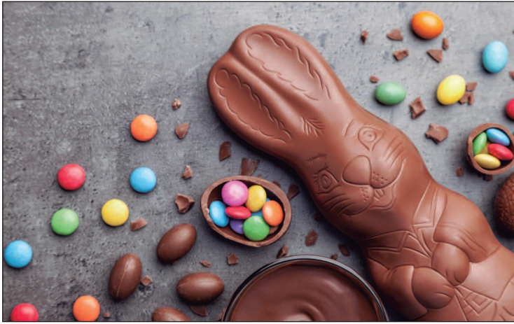
É possível criar sobremesas inclusivas deliciosas

As gorduras boas também devem estar presentes, com alimentos como abacate, azeite de oliva extravirgem, cas-