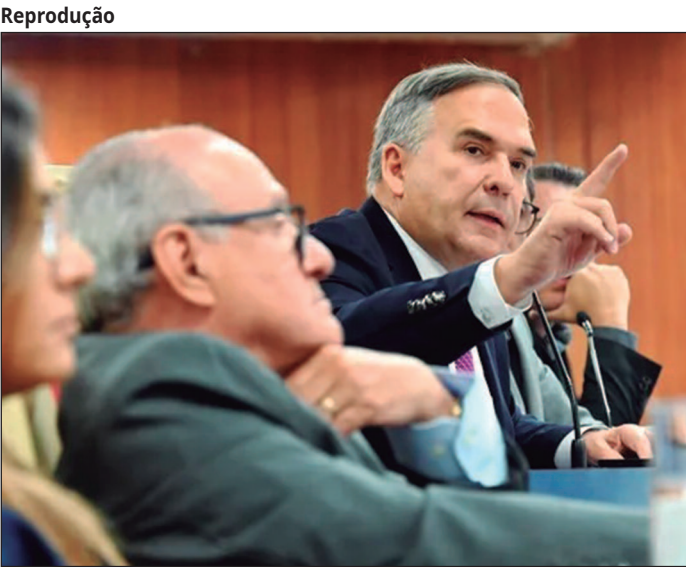
Prefeito de Goiânia solicitou abertura de à Câmara Municipal de Goiânia