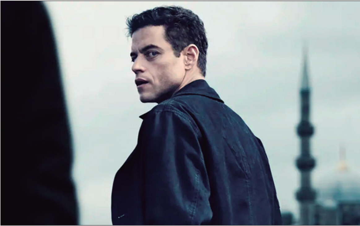
Em Operação Vingança , após a trágica morte de sua esposa em um ataque terrorista em Londres, Charles Heller (Rami Malek), um criptógrafo altamente capacitado da CIA

Flamboyant:22h10. Cinemark passeio das Águas: 11h55, 20h15, 20h50, 21h40 e 21h45. Cineflix Aparecida: 19h e 21h20. Kinoplex: 16h20 e 21h30. Moviecom Buriti:17h40 e 21h50.