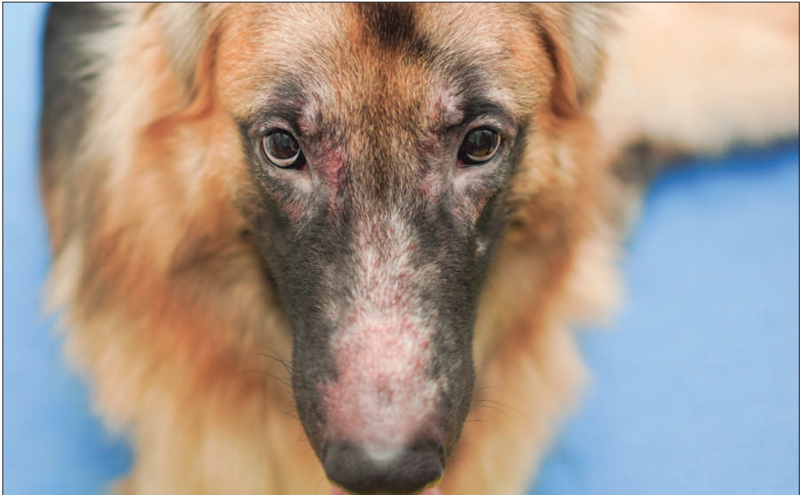
A dermatite é uma inflamação cutânea que pode ter diferentes origens