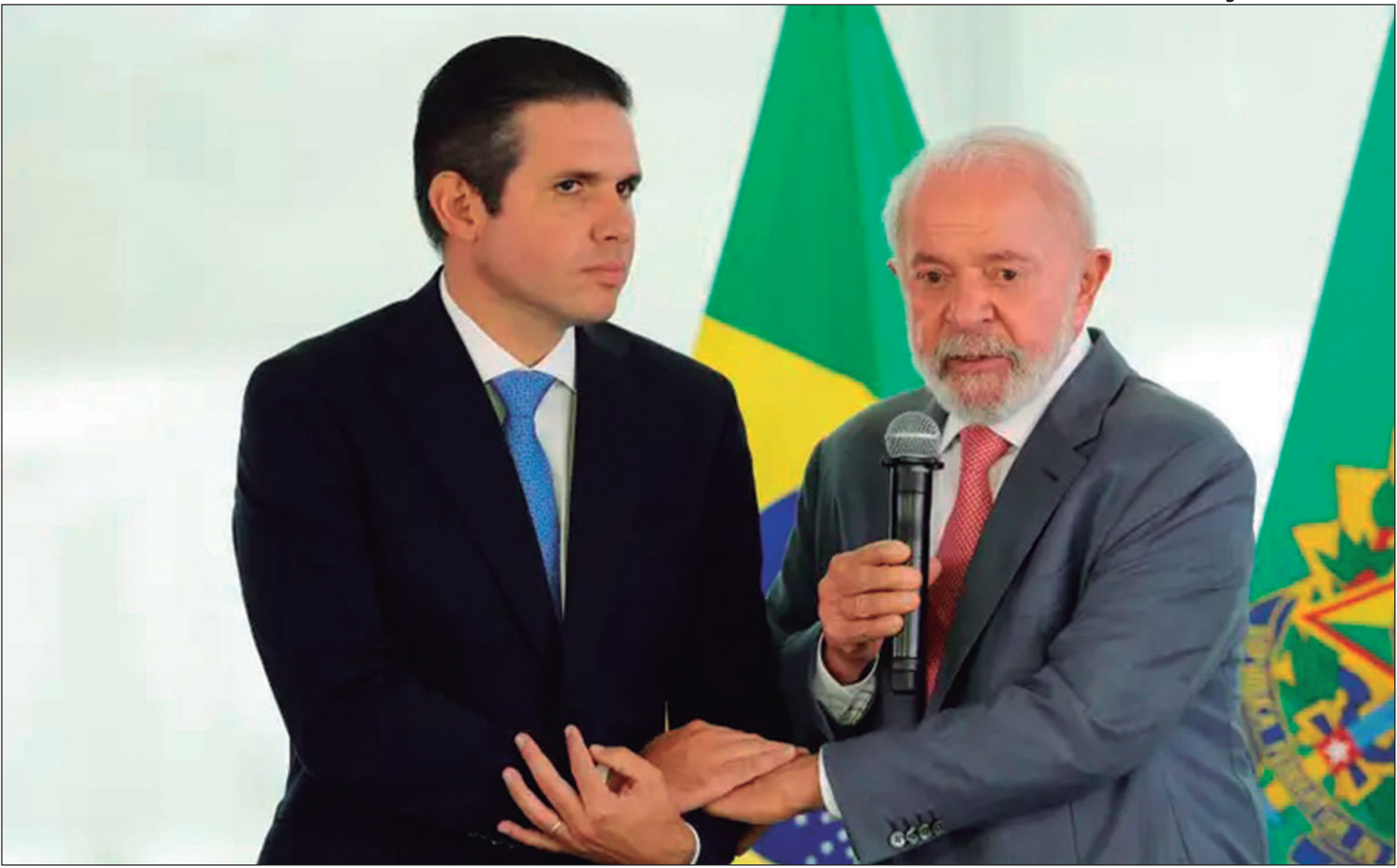
Cabe ao presidente da Casa, Hugo Motta (Republicanos-PB), decidir se leva ou não o texto ao plenário

Na segunda-feira (24), o líder do PL na Câmara, Sós-tenes Cavalcante (RJ), protocolou o requerimento de urgência do projeto que pre-