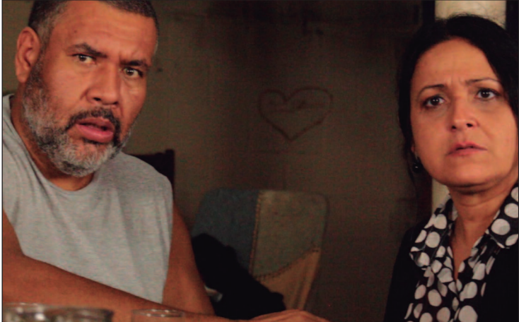
No roteiro, seis histórias de coragem unidas por uma cédula de dinheiro