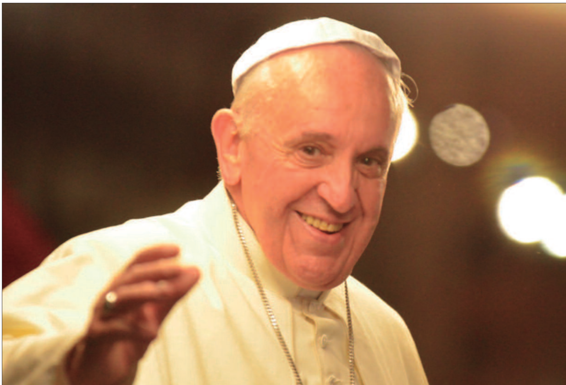
O papado de Francisco reposicionou o Vaticano como uma potência mergulhada em debates contemporâneos