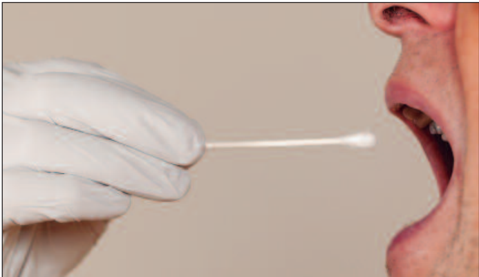
Foram observadas 130 variações genéticas ligadas ao risco da doença