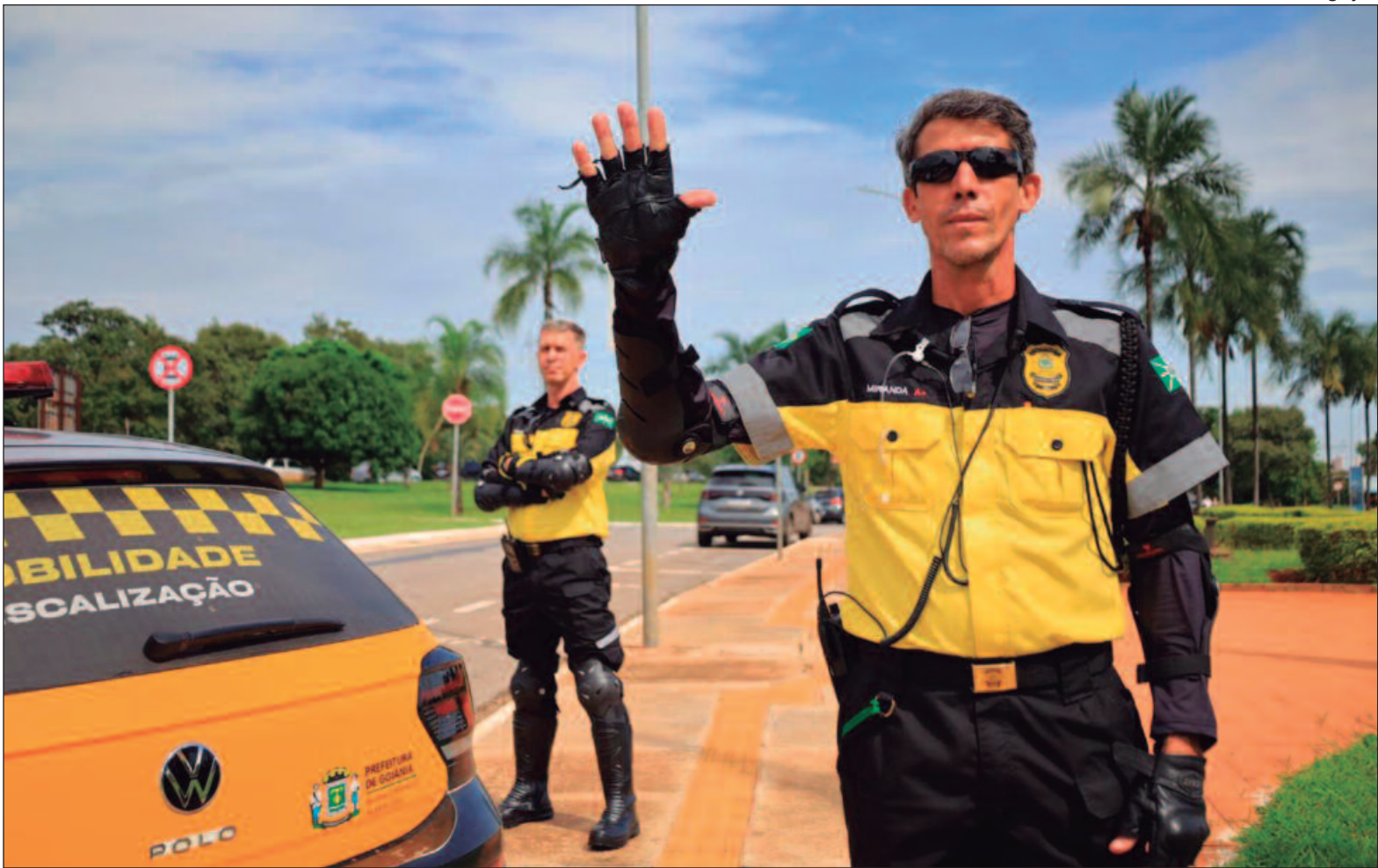
Mesmo com a flexibilização do avanço de sinal, os números de autuações por excesso de velocidade seguem altos em Goiânia