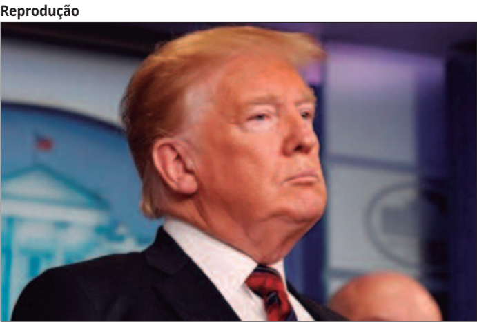
Países do bloco têm enfrentado tarifaço dos EUA