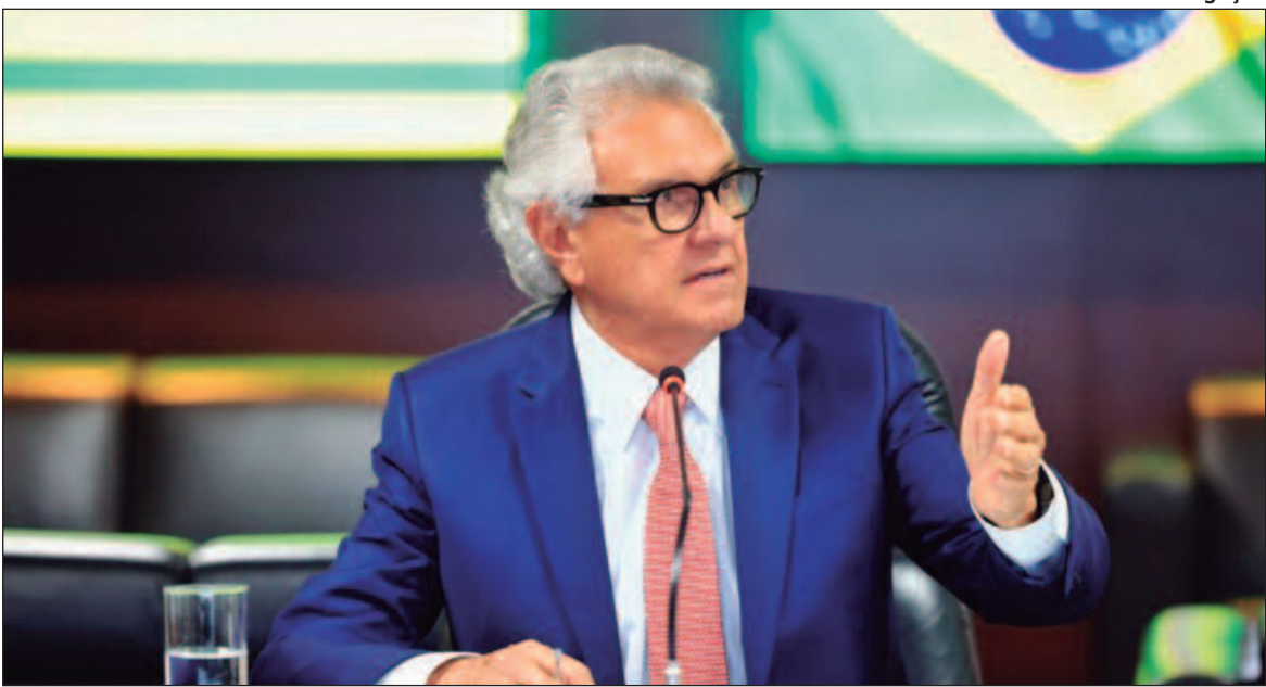
Goiás figura entre as unidades da federação com os melhores índices de segurança do país

51% dizem confiar pouco, e 19% afirmam não confiar. Apenas 22% demonstram plena confiança na atuação das forças de segurança. Em meio a esse cenário de tensão, ganha força a figura de políticos que colocam o combate à violência como prioridade em suas agendas — entre eles, está o governador de Goiás, Ronaldo Caiado. O gestor, que é pré-candidato à presidência da República, é hoje uma das principais vozes da direita quando o assunto é segurança. Sua trajetória política sempre esteve alinhada com pautas de endurecimento contra o crime, e, em seu estado, os números, de fato, jogam a seu favor. Goiás figura entre as unidades da federação com os melhores índices de segurança do país, resultado de uma política de enfrentamento direto ao crime, investimento em tecnologia, valorização das forças policiais e uma gestão focada em resultados. O governador não esconde que vê a segurança como sua principal bandeira. Em discursos e entrevistas, costuma dizer que o cidadão de bem precisa