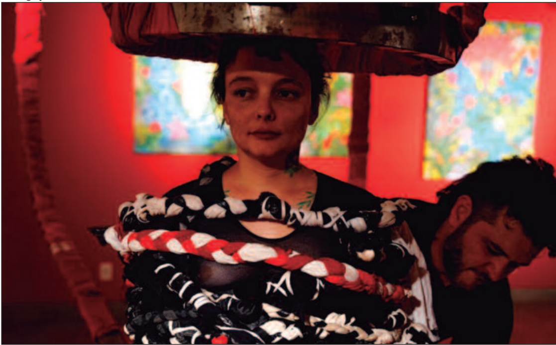
“Entremeio” convida o público a refletir sobre conexões temporais entre passado, presente e futuro