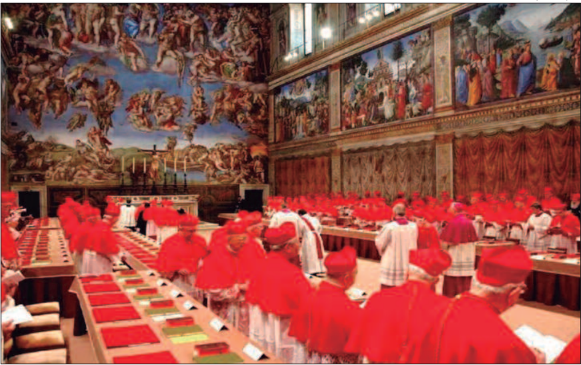
Enquanto fiéis rezam, Igreja se prepara para o conclave que elegerá novo Papa

Ainda durante a manhã, devotos começaram a se reunir no Santuário Basílica do Divino Pai Eterno. Embora nenhuma cerimônia oficial