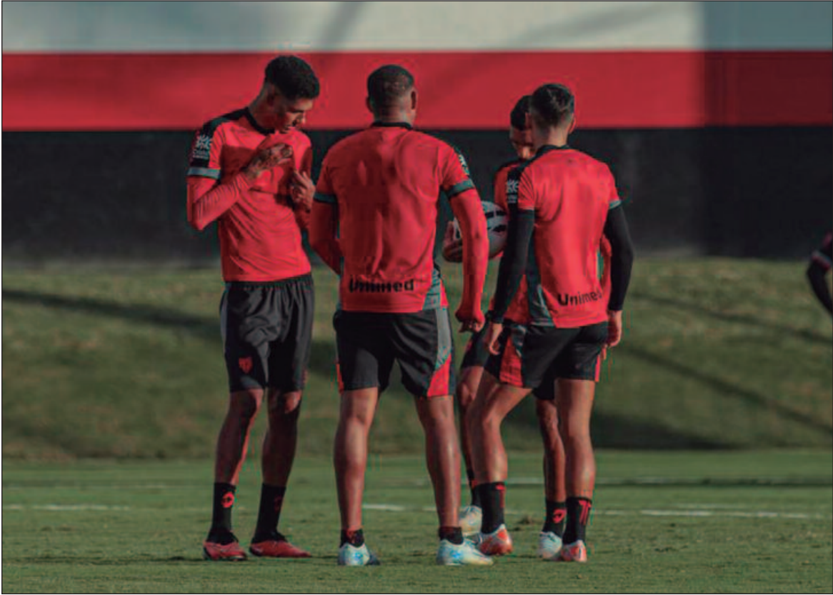
Estádio Antônio Accioly, recebe partida válida pela 4ª rodada da Série B