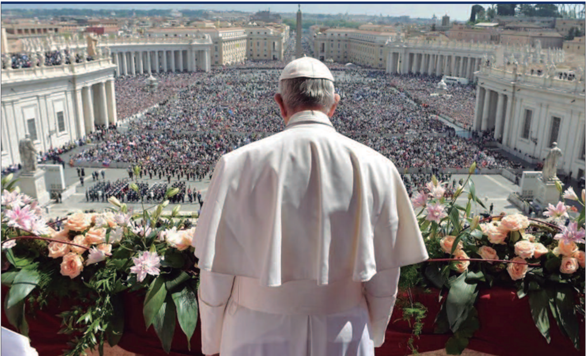
Trindade, Capital da Fé, reuniu fiéis em celebrações emocionadas e destacou a ligação histórica do Papa Francisco com a cidade