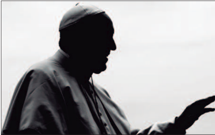
Conclave deve ocorrer em até três semanas no Vaticano

O Colégio dos Cardeais, formado por líderes da Igreja com menos de 80 anos, será responsável por eleger o novo papa em conclave secreto, que deve começar dentro de duas a três semanas. Atualmente, 138 cardeais estão aptos a votar — número superior ao tradicional limite de