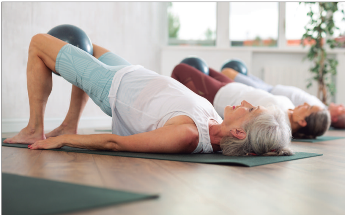
As reservas de aulas de pilates aumentaram 92% em 2023, refletindo sua crescente popularidade

Desenvolvido inicialmente na Europa e amplamente difundido nos Estados Unidos, o método foi incorporado à rotina de bailarinos, artistas e pacientes em processo de re-