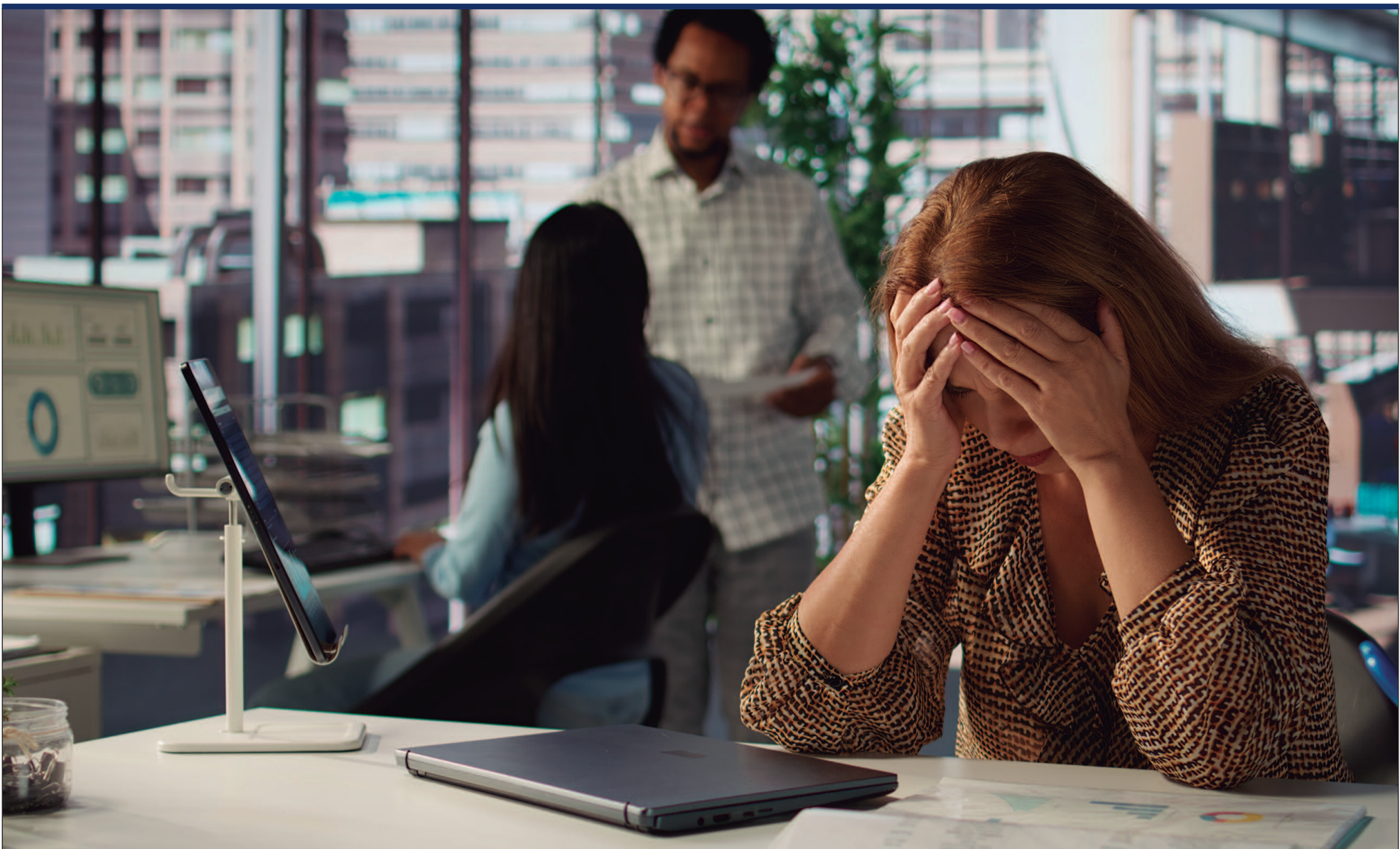
Medida busca reduzir afastamentos por transtornos mentais, que dobraram em uma década