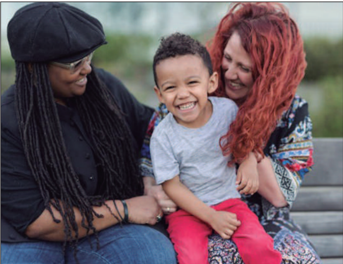
Diversidade de arranjos familiares amplia o conceito de maternidade no País