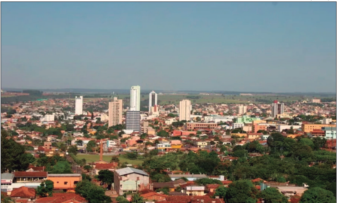
Município cresceu rapidamente como cidade-dormitório e enfrenta os desafios de um grande centro urbano

Complexo Tecnológico Brasil-China, em parceria com a cidade chinesa de Zhongshan. A primeira fase, com início previsto para julho, inclui o polo industrial Sol Nascente e o Instituto de Tecnologia e Comércio (Ittec), além de rodoviária e boulevard, marcando um esforço para diversificar a economia local, hoje centrada nos setores de serviços e construção civil. Na educação, a Prefeitura garantiu o novo piso salarial dos professores, distribuiu mais de 25 mil kits escolares e inaugurou duas novas creches. Iniciativas como o Cinema Itinerante, a implementação da Educação de Jovens e Adultos (EJA) no presídio regional e programas de alimentação saudável nas escolas demonstram o foco da gestão na inclusão social. Na infraestrutura, foram entregues mais de 57 mil m² de pavimentação em bairros carentes, além da nova Praça do Jardim Pérola, a construção da sede da APAE, ciclovias e o início das obras de um mini estádio no bairro Campo Clube. Apesar dos avanços, gargalos estruturais persistem. A