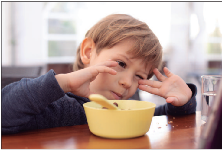
Autistas têm apego a determinadas texturas e sabores

nutrientes essenciais como vitamina D, ferro, ômega-3 e zinco, comprometendo o funcionamento cognitivo, o equilíbrio comportamental e a saúde física.