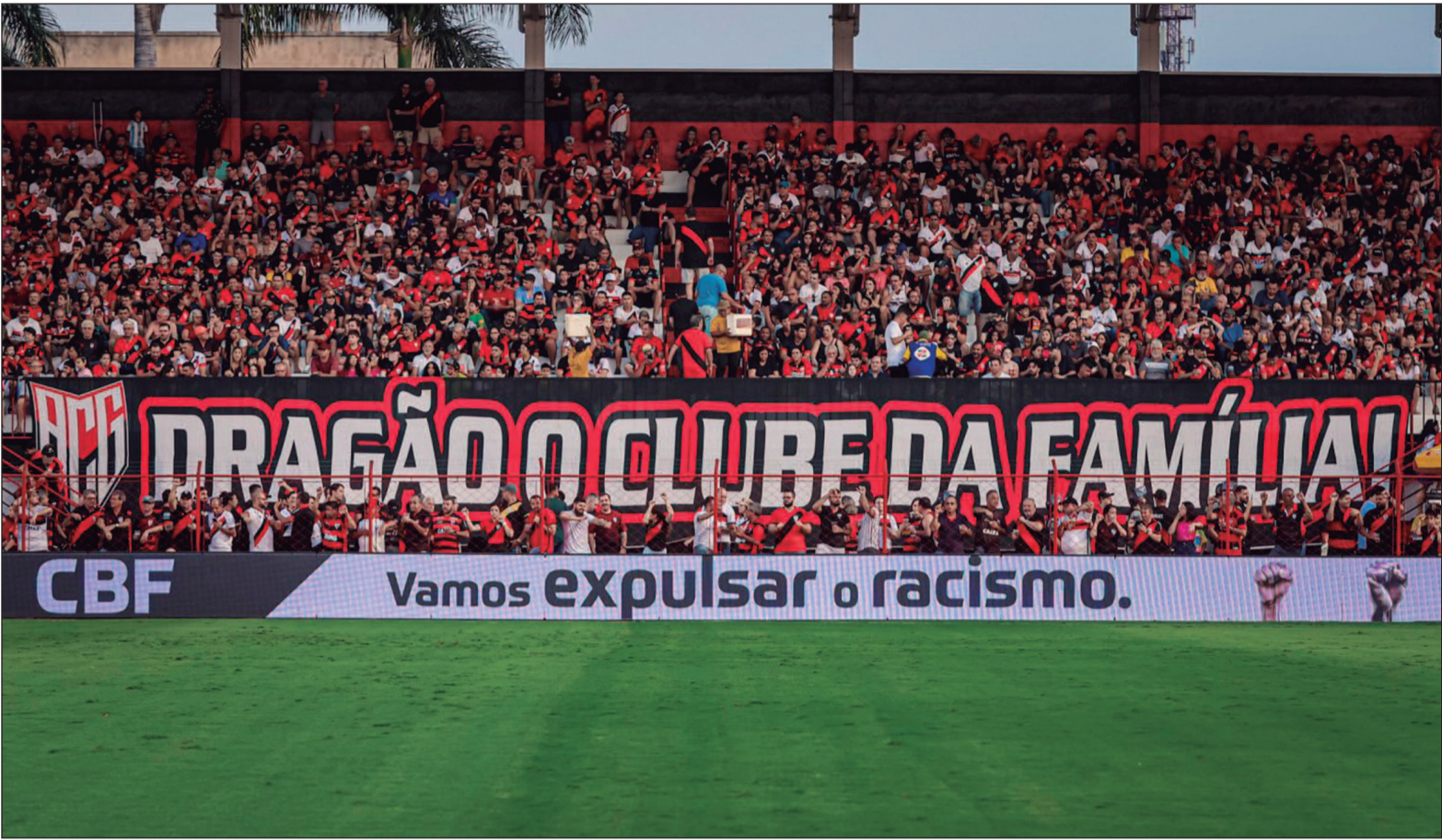
O Atlético Goianiense venceu o Novorizontino no último domingo (4) em partida disputada no Estádio Antônio Accioly, na capital goiana

De acordo com as imagens, o homem havia acabado de estacionar sua motocicleta em frente ao condomínio quando foi abordado por dois suspeitos. Um deles vestia uma camisa que remete à torcida organizada do Goiás Esporte Clube. Mesmo com a criança ainda na garupa, os agressores arancaram o menino dos braços do pai, derrubaram a moto com os dois em cima e iniciaram uma violenta sequência de agressões. A vítima foi espancada com socos e chutes, teve a camisa do Atlético ar-