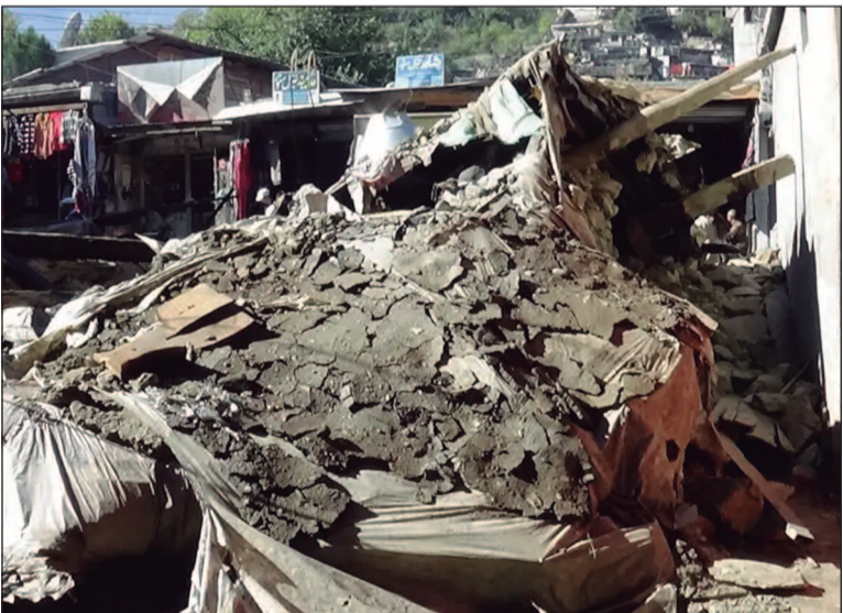
Exércitos trocaram intensa artilharia em fronteira na Caxemira

A Índia atacou nove locais no Paquistão e na Caxemira paquistanesa nesta quarta-feira (horário local), com pelo menos três mortes registradas. O Paquistão disse que está preparando uma resposta, conforme os piores combates em anos eclodiram entre os inimigos de longa data. Os exércitos dos vizinhos que têm armas nucleares trocaram intensa artilharia e pesados tiros em sua fronteira na disputada Caxemira em pelo menos três lugares. A ofensiva da Índia ocorreu em meio ao aumento das tensões, após um ataque a turistas hindus na Caxemira indiana no mês passado. Homens armados islâmicos mataram 26 pessoas no ataque de 22 de abril, a pior violência contra civis na Índia em quase duas décadas. O Paquistão disse que a Índia lançou mísseis em três locais, mas um comunicado do governo indiano não detalhou a natureza dos ataques. A Índia informou que atingiu a "infraestrutura terrorista" onde os ataques contra ela foram planejados e dirigidos. "Há pouco, as Forças Armadas indianas lançaram a