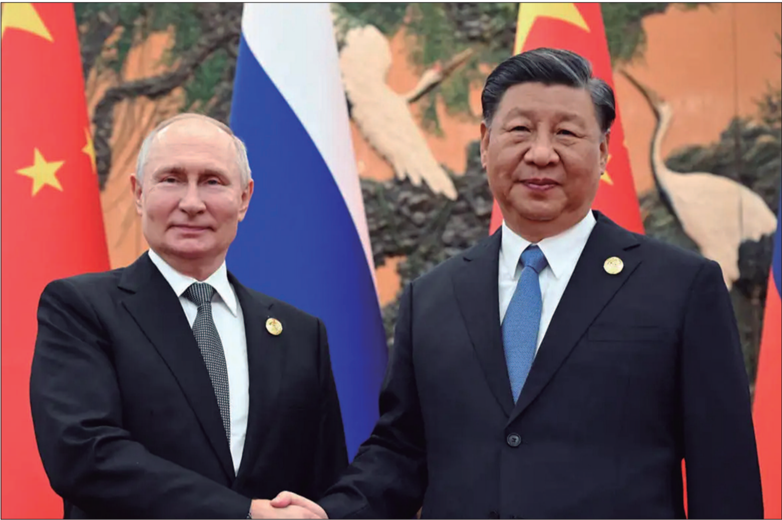
Xi defendeu conversações para acabar com a guerra na Ucrânia e acusou os Estados Unidos de fomentar ataques com o fornecimento de armas

Quando perguntado durante uma coletiva de imprensa sobre os ataques aéreos de ambos os lados às capitais um do outro, o porta-voz do Ministério das Relações Exteriores da China não comentou sobre a viagem de Xi, dizendo apenas que a "prioridade máxima" é evitar uma escalada nas tensões. O Kremlin disse que as tentativas de ataques ucranianos a Moscou mostram a tendência de Kiev de cometer "atos de terrorismo" e que os serviços de inteligência e as Forças Armadas da Rússia estavam fazendo tudo o que era necessário para garantir a segurança das comemorações do 80º aniversário da vitória da União Soviética e seus aliados sobre a Alemanha nazista.