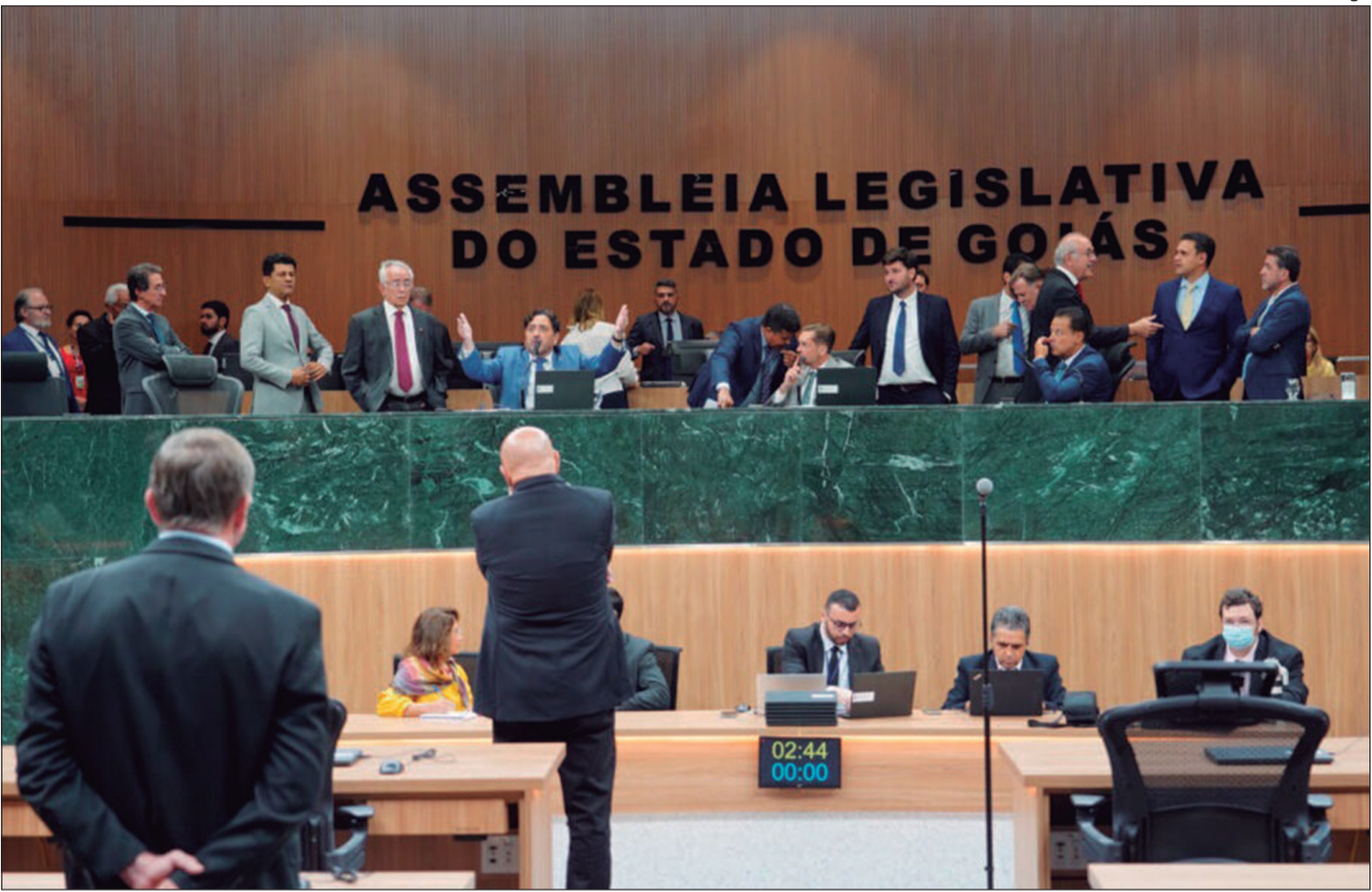
O texto prevê a criação de uma reserva especial de natureza financeira e contábil vinculada à Secretaria de Estado da Economia

Essa estabilização se daria via reserva financeira do pro-