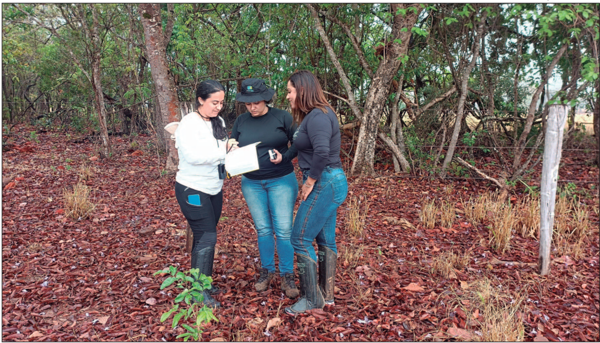
O Atlas dos Remanescentes de Vegetação Nativa promete transformar políticas ambientais e fortalecer ações de conservação no Cerrado

O projeto é uma iniciativa do Laboratório de Processamento de Imagens e Geoprocessamento (Lapig), da Universidade Federal de Goiás (UFG), em parceria com a Secretaria de Estado de Meio Ambiente e Desenvolvimento Sustentável (Semad), com apoio da Fundação de Apoio à Pesquisa (Funape). O levantamento visa quantificar a cobertura vegetal e qualificá-la em termos de fitofisionomia. A Semad declarou que o pro-