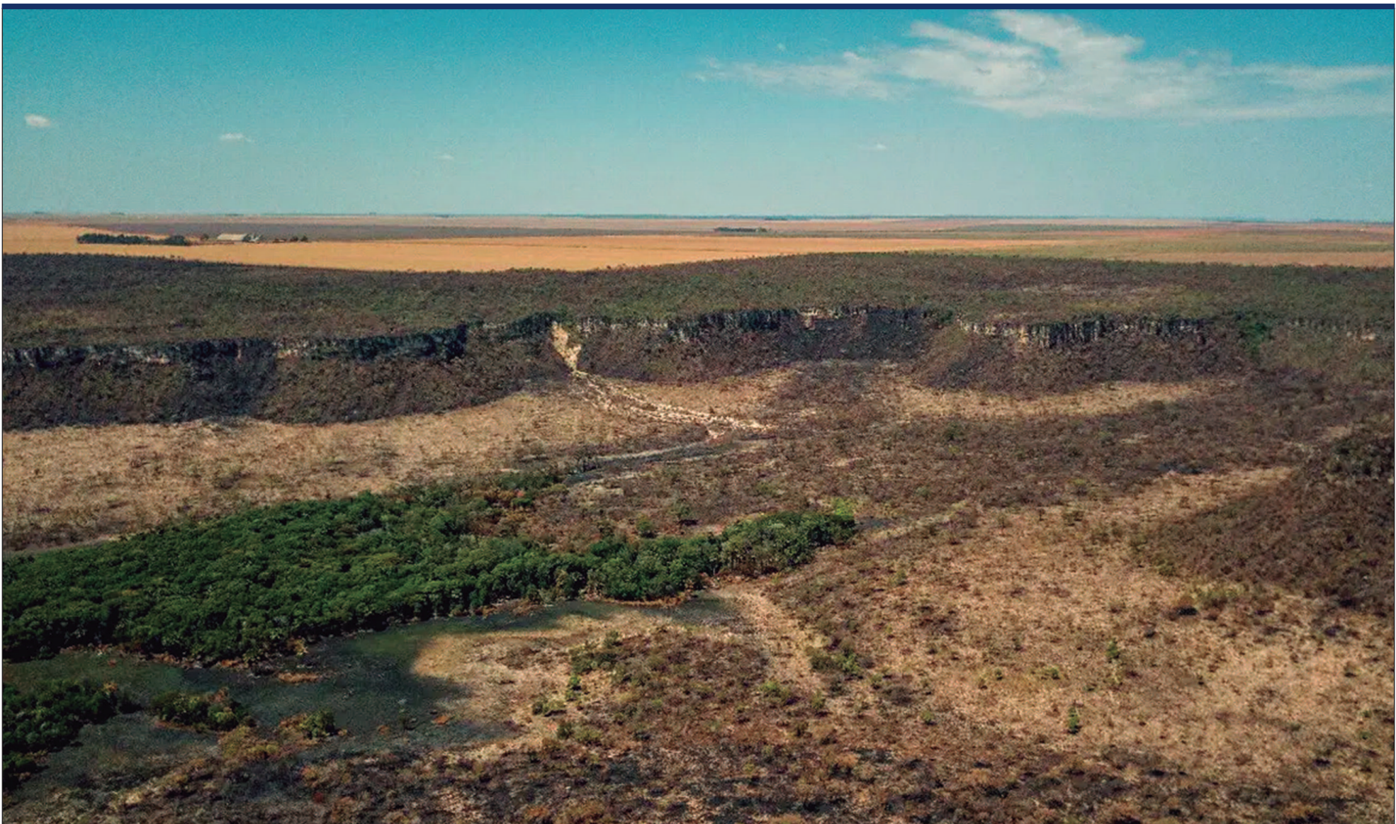
Mapeamento com imagens de satélite de alta resolução e inteligência artificial revela fragmentos do Cerrado antes invisíveis