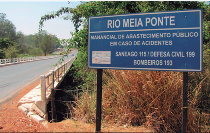
Queda na vazão reflete impactos da seca, que atinge 96% do território goiano e exige monitoramento constante