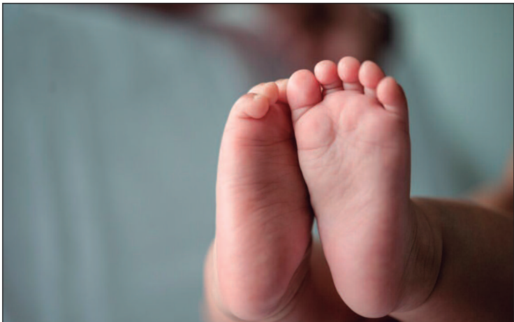
Lei da Política Nacional de Humanização do Luto Materno e Parental é sancionada

A legislação, originada do Projeto de Lei 1.640/2022, prevê também a criação de protocolos clínicos para atendimento humanizado, capacitação das equipes de saúde, oferta de exames