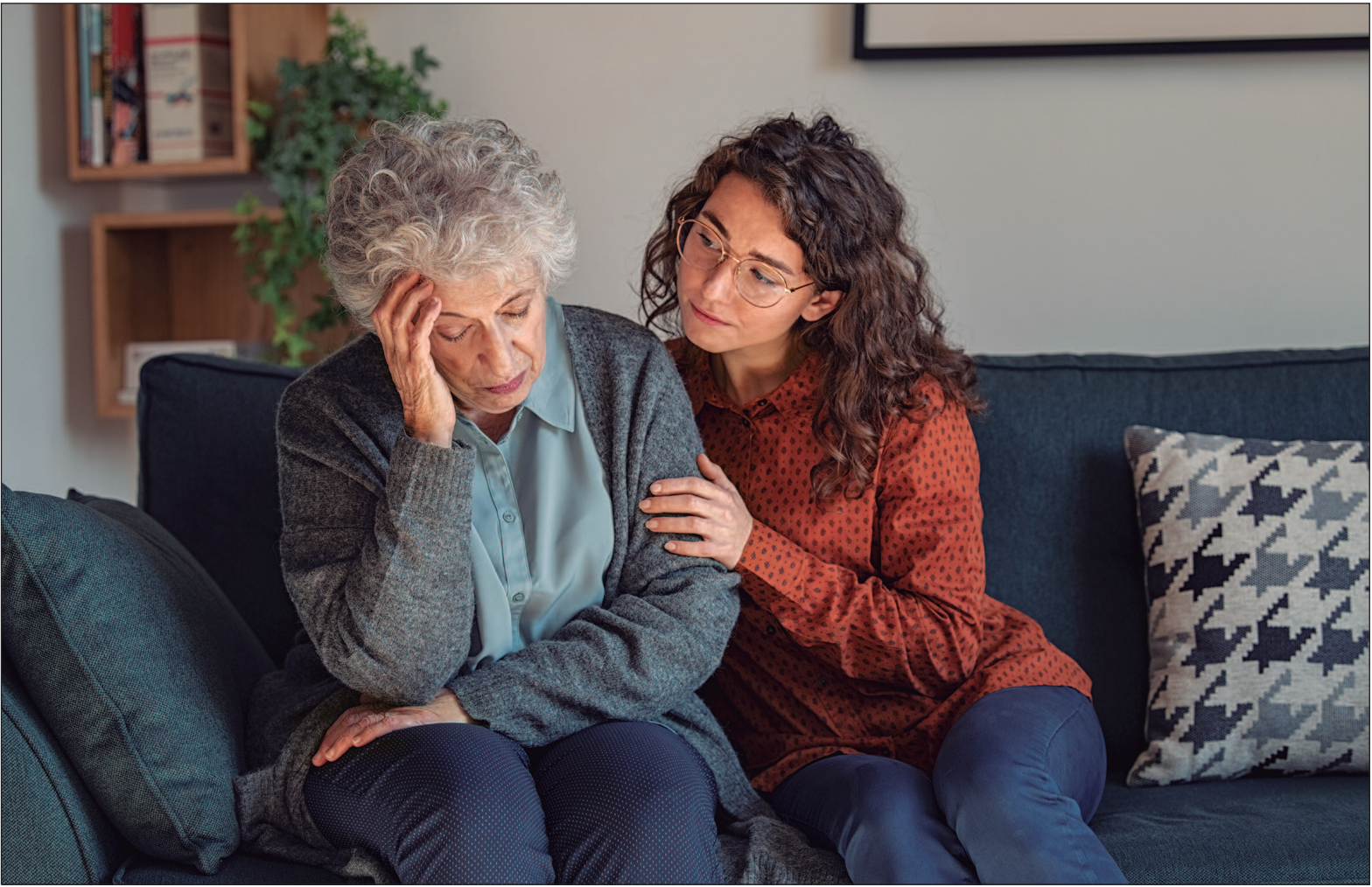
Alzheimer representa cerca de 70% dos casos de demência mundialmente

A Agência Nacional de Vigilância Sanitária (Anvisa) autorizou o uso do donanemabe, um medicamento inovador para o tratamento inicial da doença de Alzheimer. Esta terapia imunológica representa um avanço significativo ao reduzir os depósitos proteicos associados à progressão da enfermidade. O Alzheimer, principal tipo de demência, responde por cerca de 70% dos casos mundialmente. No Brasil, a situação é alarmante: o Relatório Nacional sobre a Demência (RENADE), divulgado pelo Ministério da Saúde em setembro de 2024, revela que 80% dos pacientes não recebem diagnóstico, ficando sem o tratamento necessário. O reconhecimento clínico da doença geralmente começa após o paciente ou seus familiares perceberem episódios frequentes de perda de memória e dificuldades cognitivas. A partir daí, exames específicos são aplicados para avaliar o grau de comprometimento das funções mentais e da autonomia nas atividades diárias. Segundo o mesmo relatório, cerca de 8,5% dos brasileiros com 60 anos ou mais apresentam algum tipo de demência, o que equivale a cerca de 2,7 milhões de pessoas. Com o envelhecimento da população, especialistas alertam que esse número pode quase triplicar até 2050, intensificando a necessidade de tratamentos mais