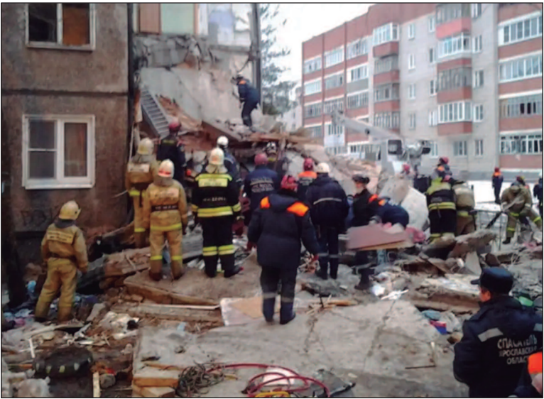
Presidente ucraniano alertou que Rússia prepara novas ofensivas

O Ministério russo da Defesa acusou, nesta terça-feira (27), a Ucrânia de intensificar os ataques aéreos na Rússia “com o objetivo de travar o processo de negociação” entre os dois países. O presidente ucraniano, por sua vez, alertou que a Rússia está preparando novas ofensivas terrestres e reforçou as defesas aéreas, depois de ter sido alvo de ataques aéreos maciços russos nos últimos três dias. “Por iniciativa da Federação Russa, foi retomado em Istambul, na Turquia, há cerca de dez dias, o diálogo direto entre a Rússia e a Ucrânia sobre a solução pacífica do conflito”, informou o ministério russo em comunicado. “Ao mesmo tempo, o regime de Kiev, com o apoio de alguns países europeus, tomou uma série de medidas provocatórias com o objetivo de interromper o processo de negociação”, acrescentou, afirmando que, desde 20 de maio, a Ucrânia “aumentou os seus ataques com recurso a drones e mísseis” contra instalações civis na Rússia. Moscou afirmou que os recentes ataques na Ucrânia foram “uma resposta a ataques maciços de drones ucranianos” contra civis russos. O Ministério russo da Defesa disse ter abatido 99 drones ucranianos na última noi-