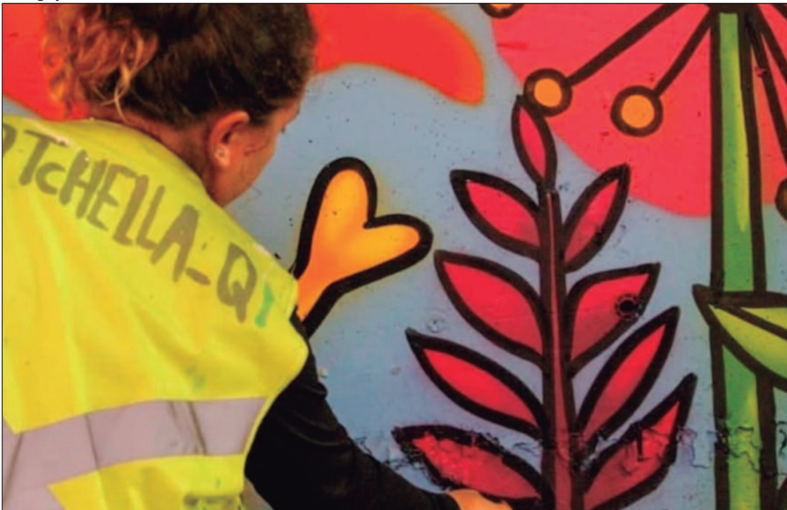
Tchella Queiroga segue com a execução do mural “Luzes da Terra” no Câmpus Goiânia do IFG

Quarta (28). Onde: Goiânia e Aparecida de Goiânia. Horário: a partir das 7h30. Entrada gratuita.