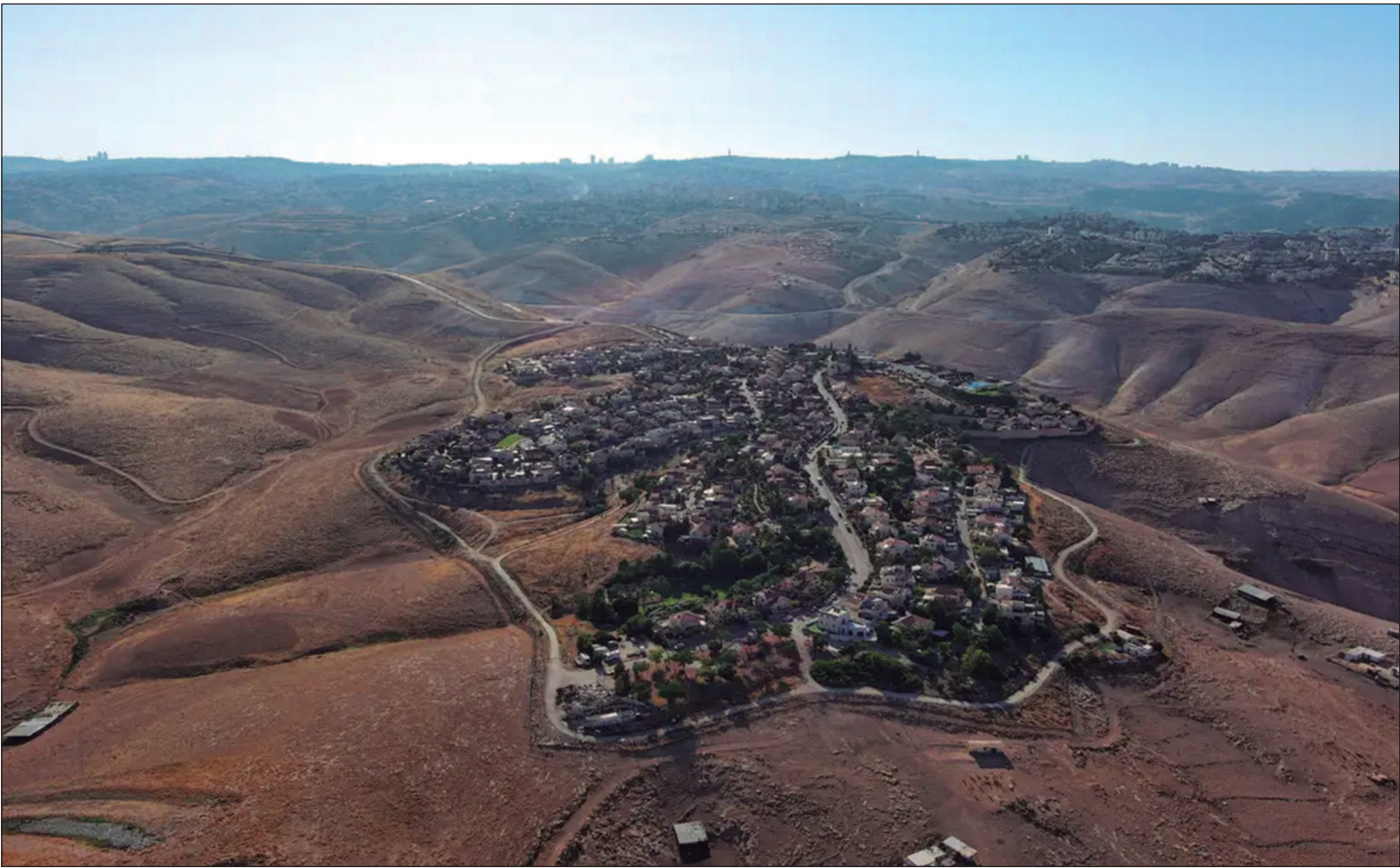
Dermer avisou que Israel tomará medidas unilaterais como a anexação de partes da Área C da Cisjordânia

Segundo os acordos assinados em 1993, a área citada por Dermer ficava sob administração israelense, enquanto a zona B sob o controle administrativo da Autoridade Palestina e controle militar israelense, sendo a zona A administrada exclusivamente pela Autoridade Palestina. Dermer fez as declarações em resposta a um possível reconhecimento internacional do Estado palestino na Cúpula de Nova York, que será copresidida pela França e a Arábia Saudita no próximo dia 18 de junho, segundo o diário israelense Haaretz.