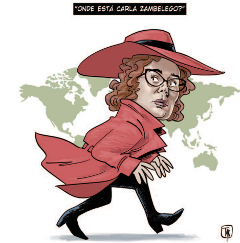
“ONDE ESTÁ CARLA ZAMBELEGO?”

Recém-lançado, o programa Goiás Mais Inclusivo estabelece uma nova bolsa mensal de R$ 500 para crianças e adolescentes com deficiência que vivem em extrema pobreza. Cidades 9