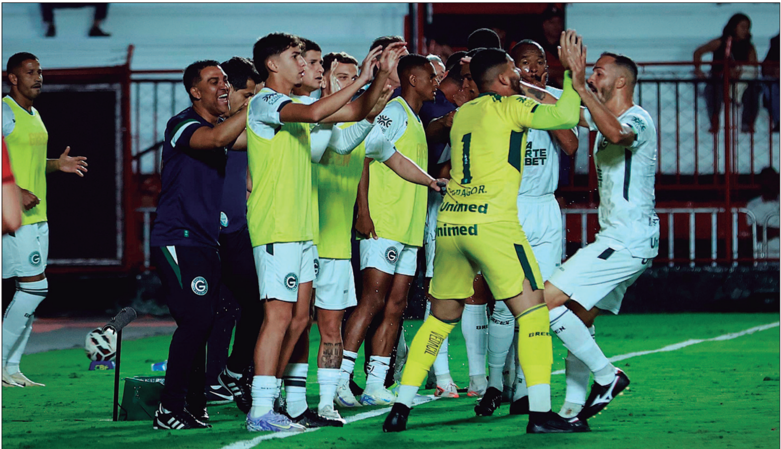
Defesa do Goiás se destaca na Série B, com apenas 6 gols sofridos em 10 jogos

No atual momento o Verde somou sete vitórias, dois empates e uma derrota na competição, em 2012 o Goiás tinha somado quatro vitórias, quatro empates e duas derrotas. Outra diferença é o saldo de gols já