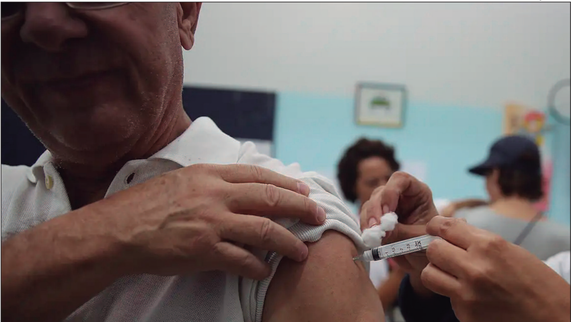
As autoridades reforçam a importância da vacinação contra a gripe e o reforço da imunização para idosos

Goiás enfrenta aumento preocupante nas mortes causadas pela gripe H1N1. Segundo dados divulgados pela Secretaria de Estado da Saúde de Goiás (SES-GO), o número de óbitos por síndromes respiratórias agudas graves (SRAGs), principalmente provocadas pelo vírus Influenza H1N1, cresceu 53% em apenas uma semana, chegando a 268 mortes em 2025. O Estado registrou até o momento quase 5 mil casos de SRAG, um aumento de 26% em relação ao ano passado, de acordo com boletim da Fundação Oswaldo Cruz (Fiocruz). O crescimento acelerado tem sobrecarregado unidades de saúde e acendido um alerta para as autoridades. A gripe H1N1 é a principal responsável pelas mortes associadas às síndromes respiratórias, atingindo principalmente idosos e crianças pe-