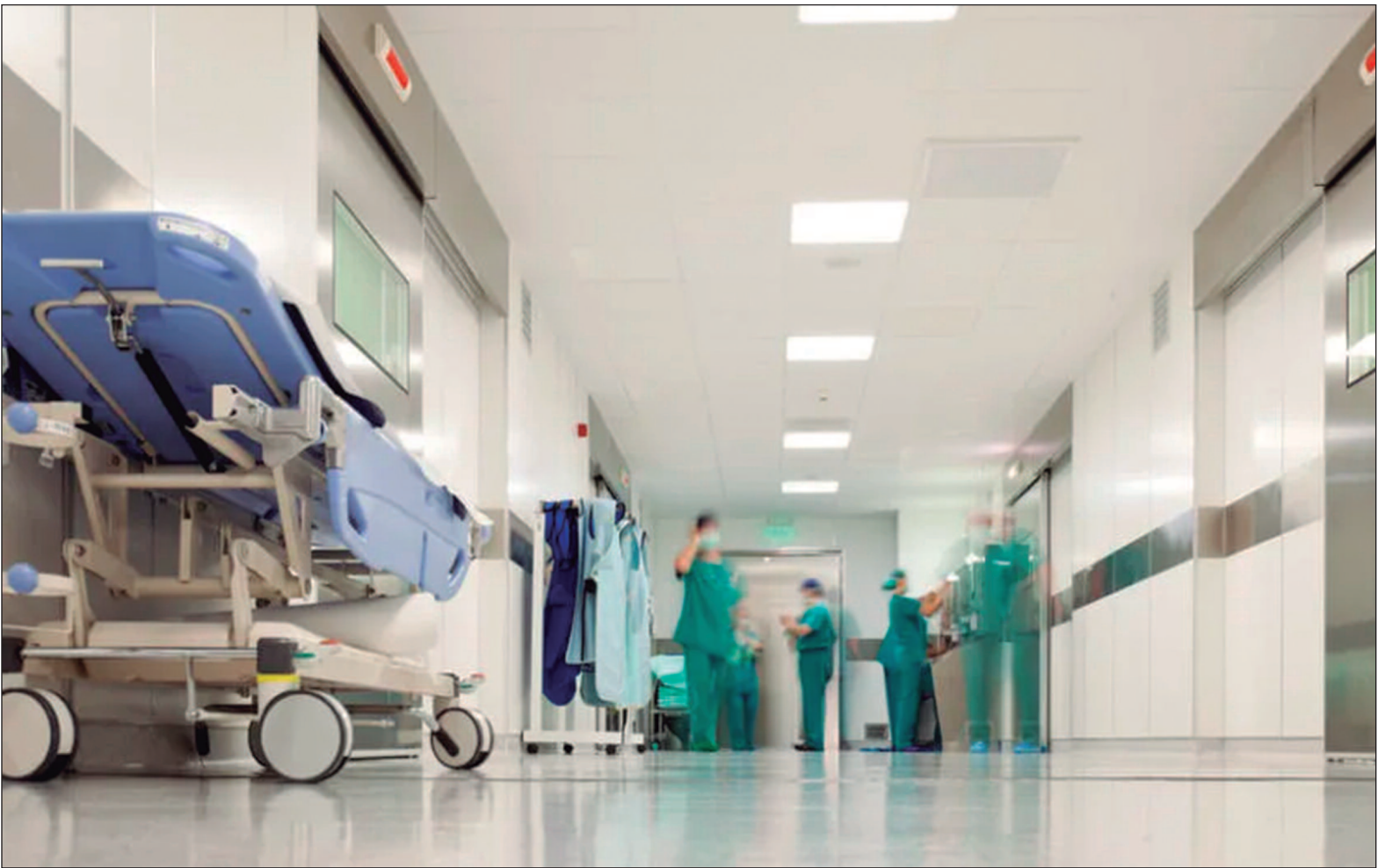
Cerca de 1,2 mil trabalhadores foram diretamente prejudicados

Profissionais da saúde que atuam na rede pública estadual de Goiás denunciam precarização nas condições de trabalho, falta de pagamento de direitos trabalhistas e incertezas sobre o futuro. As críticas se intensificaram após o governo do estado suspender contratos com duas Organizações Sociais (OSs) — o Instituto de Gestão e Humanização (IGH) e a Organização Social de Saúde Hospital e Maternidade Therezinha de Jesus — responsáveis pela gestão de unidades hospitalares. Cerca de 1.200 trabalhadores foram diretamente prejudicados. O tema foi debatido na última terça-feira (3), em audiência pública realizada na Assembleia Legislativa de Goiás (Alego), com forte participação de trabalhadores, sindicalistas e parlamentares. Na ocasião, uma carta assinada pelos profissionais foi lida pelo deputado estadual Mauro Rubem (PT), que defendeu intervenção do governo para garantir os direitos da categoria. “O governo de Goiás pode e deve interferir para manter nossas condições de trabalho. Queremos a nossa dignidade”, dizia o documento. O deputado também ressaltou que a ausência de carteira assinada impede o acesso a direitos básicos, como férias, 13º salário, licença-maternidade e aposentadoria, empurrando profissionais para regimes de trabalho precarizados e sem segurança jurídica. A procuradora do Ministério Público do Trabalho (MPT),