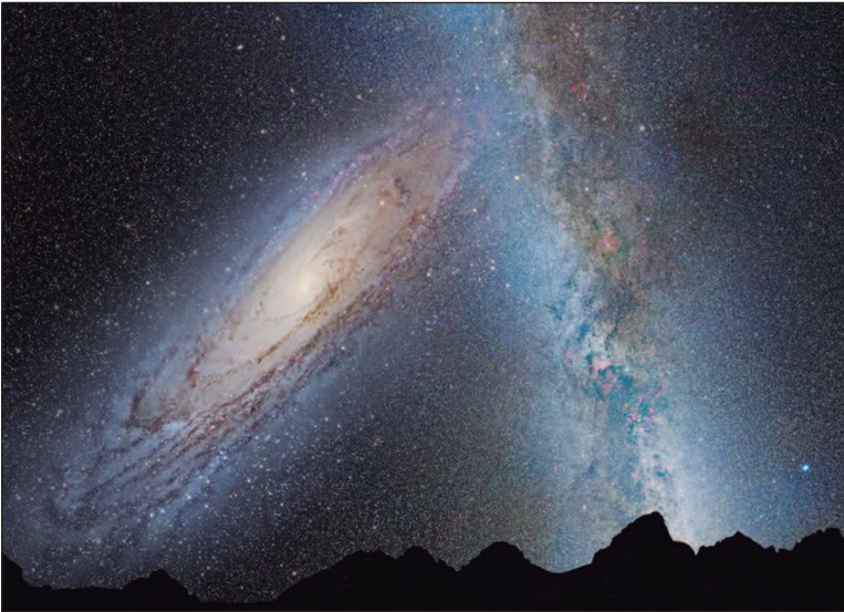
Galáxias estão a 2,5 bilhões de anos-luz uma da outra

A Via Láctea e a vizinha galáxia de Andrômeda estão atualmente se lançando uma em direção à outra no espaço a uma velocidade de cerca de 400 mil quilômetros por hora (km/h), armando o cenário para o que poderia ser uma colisão galáctica no futuro que destruiria ambas. Mas qual a probabilidade dessa colisão cósmica? Embora pesquisas anteriores previssem que ela poderia ocorrer daqui a aproximadamente 4 a 4,5 bilhões de anos, um novo estudo que usa dados observacionais recentes acrescenta novas variáveis e indica que a colisão está longe de uma certeza. Ele calcula a probabilidade de uma colisão nos próximos 5 bilhões de anos em menos de 2%, e uma nos próximos 10 bilhões de anos em cerca de 50%. As fusões galácticas não são como um clássico de demolição, com estrelas e planetas se chocando uns contra os outros, mas sim uma mistura complicada em uma escala imensa. “A futura colisão – se ocorrer – seria o fim da Via Láctea e de Andrômeda”, disse o astrofísico da Universidade de Helsinque, Till Sawala, principal autor do estudo publicado nesta segunda-feira (2) na revista Nature Astronomy,