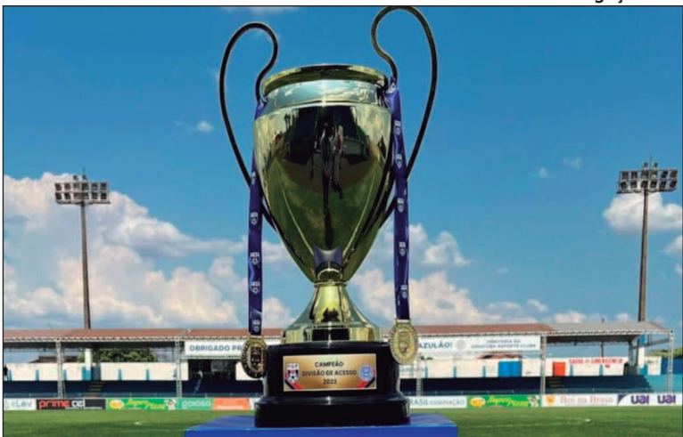
Até o momento, o Rio Verde lidera a Divisão de Acesso com seis pontos, enquanto o Grêmio Anápolis é o lanterna com dois pontos

A Divisão de Acesso de 2025 está se encaminhando para a quarta rodada, ao todo oito equipes estão na disputa pelo acesso ao Goianão. A competição segue o formato de pontos corridos, com todos os times se enfrentando em turno e retorno. Ao final da fase, os dois primeiros colocados conquistaram o acesso à Primeira Divisão, enquanto os dois últimos são rebaixados para a Terceira Divisão de 2026. O Rio Verde-GO lidera a competição com 6 pontos, somando duas vitórias e uma derrota. A equipe mostra consistência defensiva, tendo sofrido apenas dois gols até o momento. Em segundo lugar aparece a Anapolina, invicta com 5 pontos e uma vitória contra o Centro-Oeste na estreia e dois empates. No saldo de gols com sete gols marcados e quatro gols sofridos. Na sequência, Morrinhos, Tupy-GO, Trindade e Iporá estão todos empatados com 4 pontos e somando uma vitória, um empate e uma derrota. As equipes estão separadas na tabela apenas pelo saldo de gols, enquanto o Morrinhos marcou três e sofreu dois, o Tupy marcou seis e sofreu seis, já o Trin-