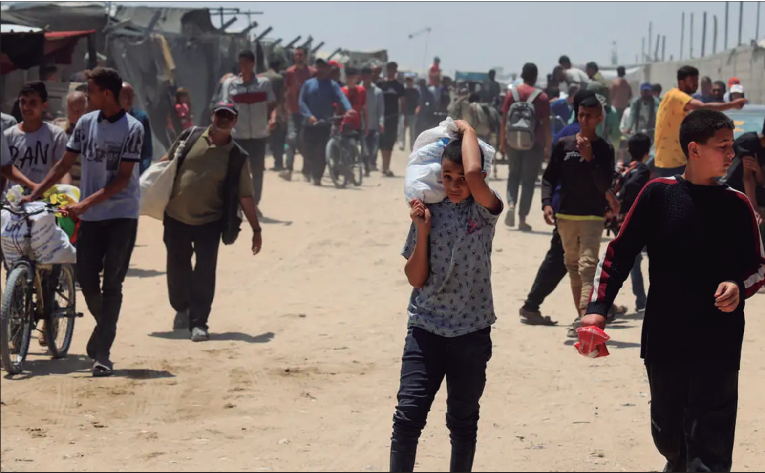
A agência de Defesa Civil, comandada pelo Hamas, calculou o número de mortos em 31

O secretário-geral da ONU apelou à realização de uma investigação independente sobre a morte de palestinos perto de um centro de distribuição de ajuda humanitária na Faixa de Gaza, neste domingo (1°). A agência de defesa civil afirmou nesta terça-feira (3) que pelo menos 27 pessoas morreram no sul do enclave quando as tropas israelenses voltaram a abrir fogo. Também nesta terça-feira, o diretor-geral do Hospital Nasser, em Khan Younis, afirma que 24 pessoas morreram e 37 ficaram feridas “em consequência de disparos por arma de fogo pelas forças israelenses contra multidões de civis” que aguardavam ajuda em Rafah. Testemunhas relataram que foram alvejadas enquanto esperavam por alimentos no centro de Rafah, gerido pela Fundação Humanitária de Gaza (GHF), apoiada pelos EUA e por Israel. A Cruz Vermelha informou que seu hospital recebeu, no domingo, 179 feridos, 21 dos quais morreram. A agência de Defesa Civil, comandada pelo Hamas, calculou o número de mortos em 31. Pontos de distribuição No domingo, o Gabinete das Nações Unidas para os Assuntos Humanitários (Ocha) publicou um vídeo filmado perto de um dos locais de distribuição no centro de Gaza. As imagens mostram uma