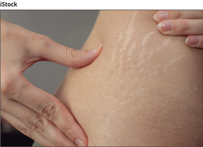
As lesões podem provocar coceira ou sensibilidade