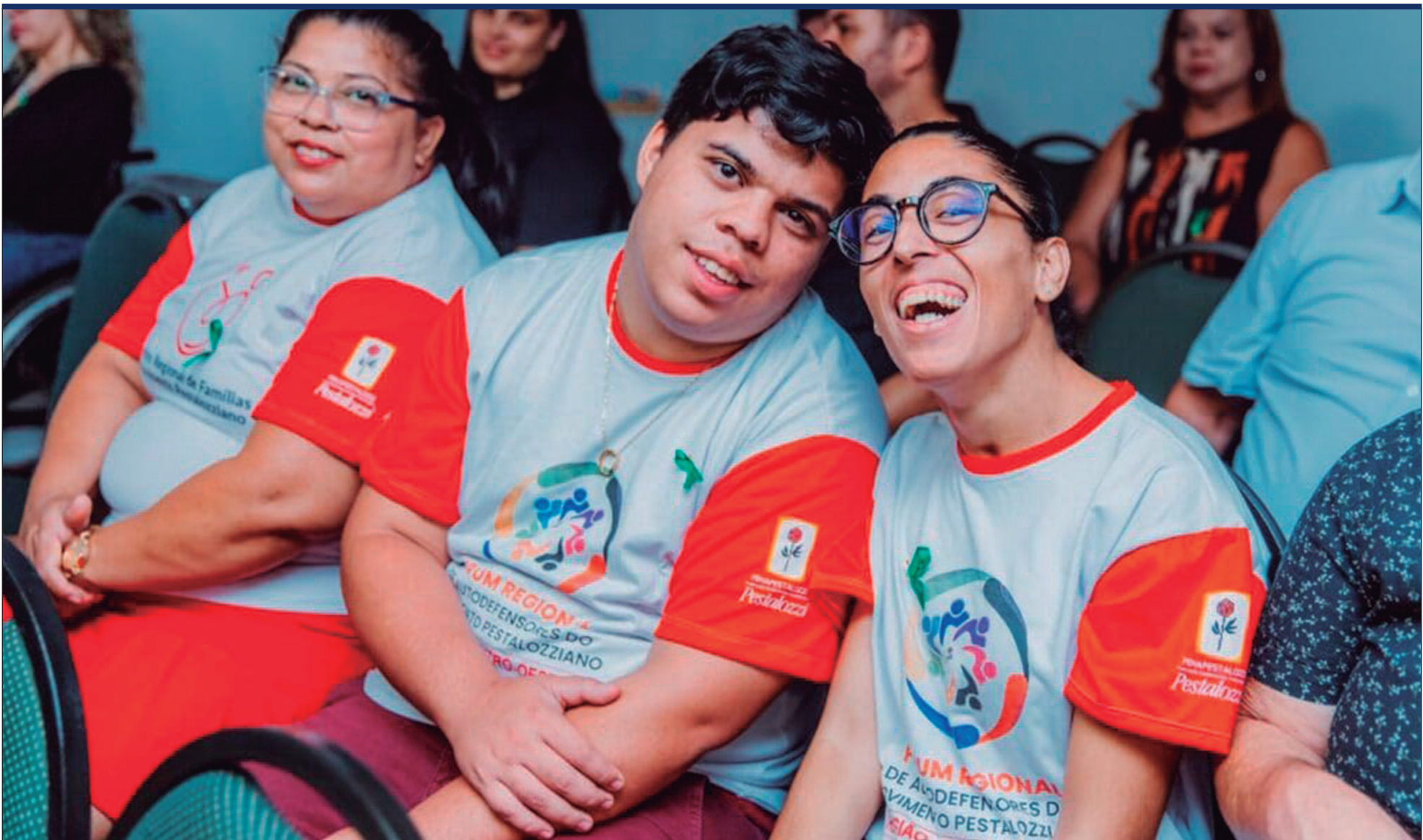
O Estado alcançou, em 2023, a menor taxa de extrema pobreza de sua história: apenas 0,8% da população vive com renda inferior a R$ 110 mensais