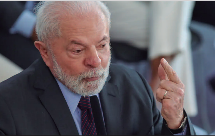
Avaliação negativa cresceu 3 pontos em dois meses