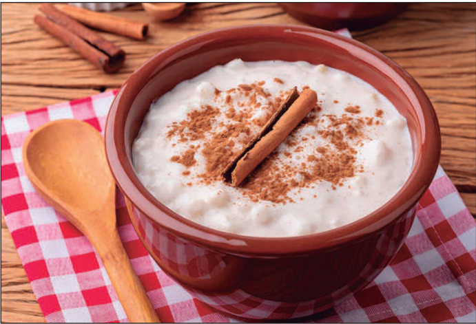
Tradicional nas festas de junho, a canjica é preparada com especiarias e tem origem disputada por três continentes