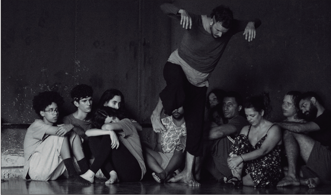
Nalini Cia de Dança produz espetáculo fruto de residência com estudantes da UFG

mação do primeiro dia inclui a palestra “Segurança Jurídica na Comercialização de Imóveis Rurais e RJ’s no Agronegócio”, às 10h15. A entrada é gratuita e a feira ocorre até o dia 20, na GO-020, a cinco minutos do Shopping Flamboyant. Quando: Segunda-feira (16). Onde: GO-020, a 5 km do Shopping Flamboyant, Goiânia-GO. Horário: 8h às 18h. Entrada gratuita.