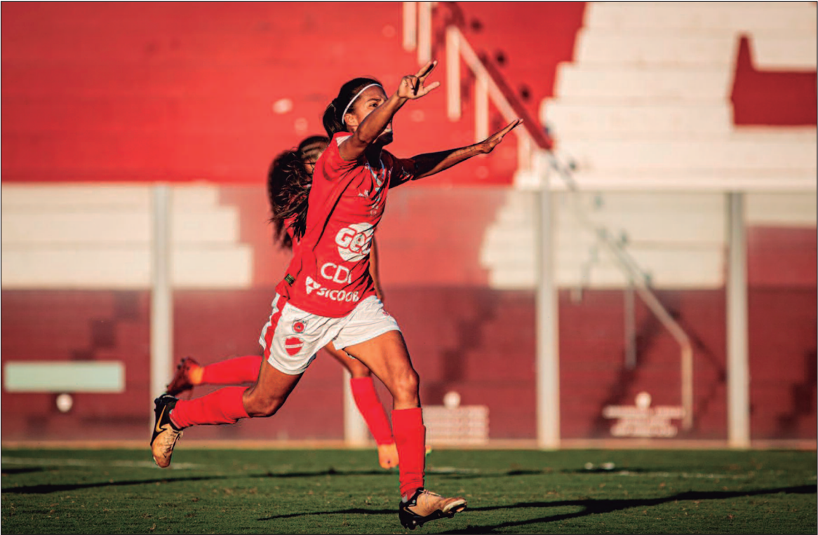
Com vitória por 2 a 1 sobre o Operário-MS, Tigre avança à semifinal da Série A3 e garante vaga na A2 em 2026

Com um jogo eficiente e mostrando maturidade nas decisões em campo, o Vila Nova superou as adversidades e soube aproveitar as chances que criou. O resultado não apenas garantiu a vaga na próxima divisão nacional, como também eliminou o Operário da competição. Agora, o Tigre espera o vencedor do confronto entre Pérolas Negras-RJ e Itabirito-MG para saber quem será seu adversário na semifinal.