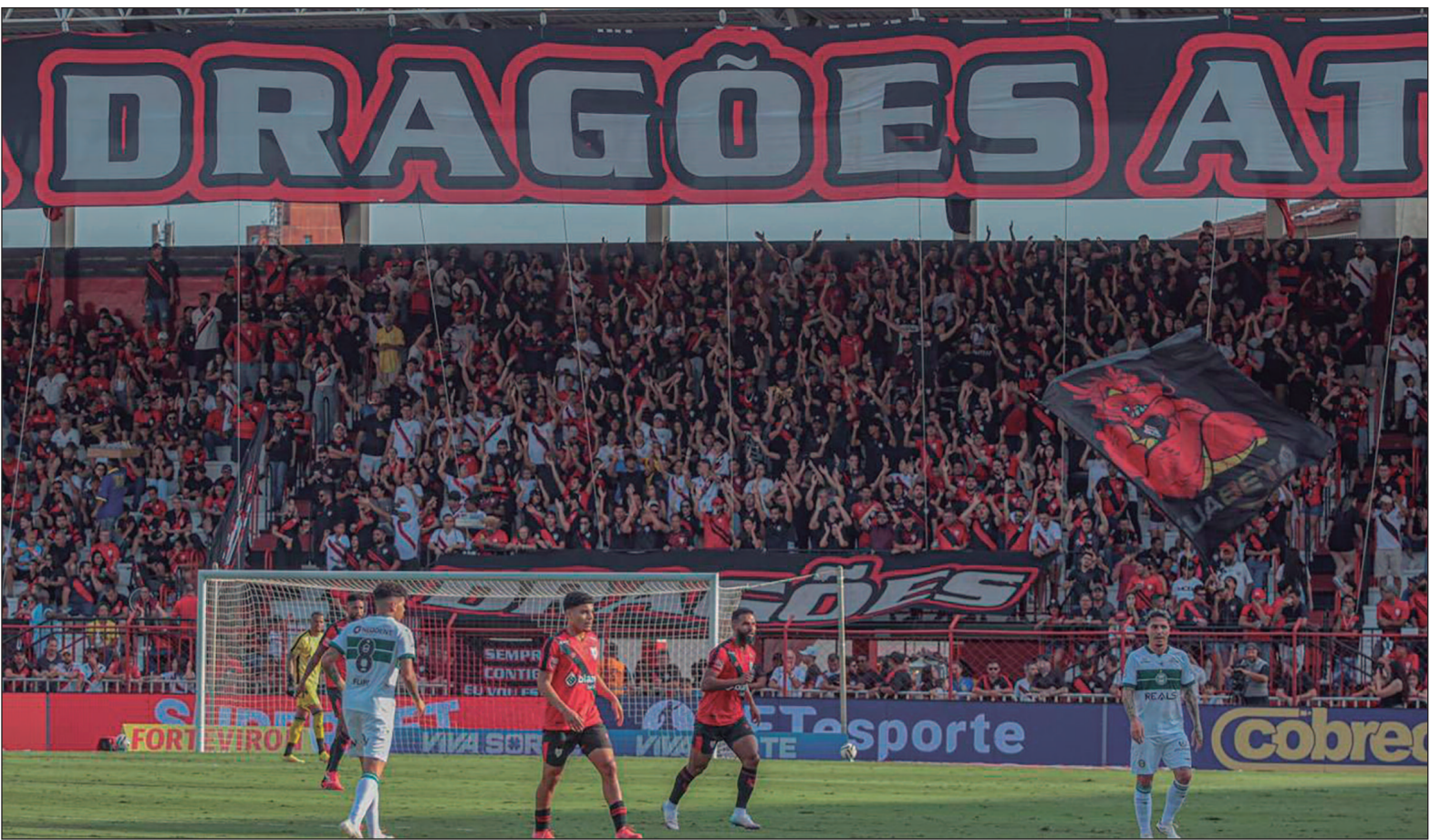
Dragão e Coxa Branca não saíram do 0 a 0 no Estádio Antônio Accioly, em Goiânia, pela Série B do Campeonato Brasileiro

O início foi marcado por muitos erros de passe de ambos os lados. A primeira boa