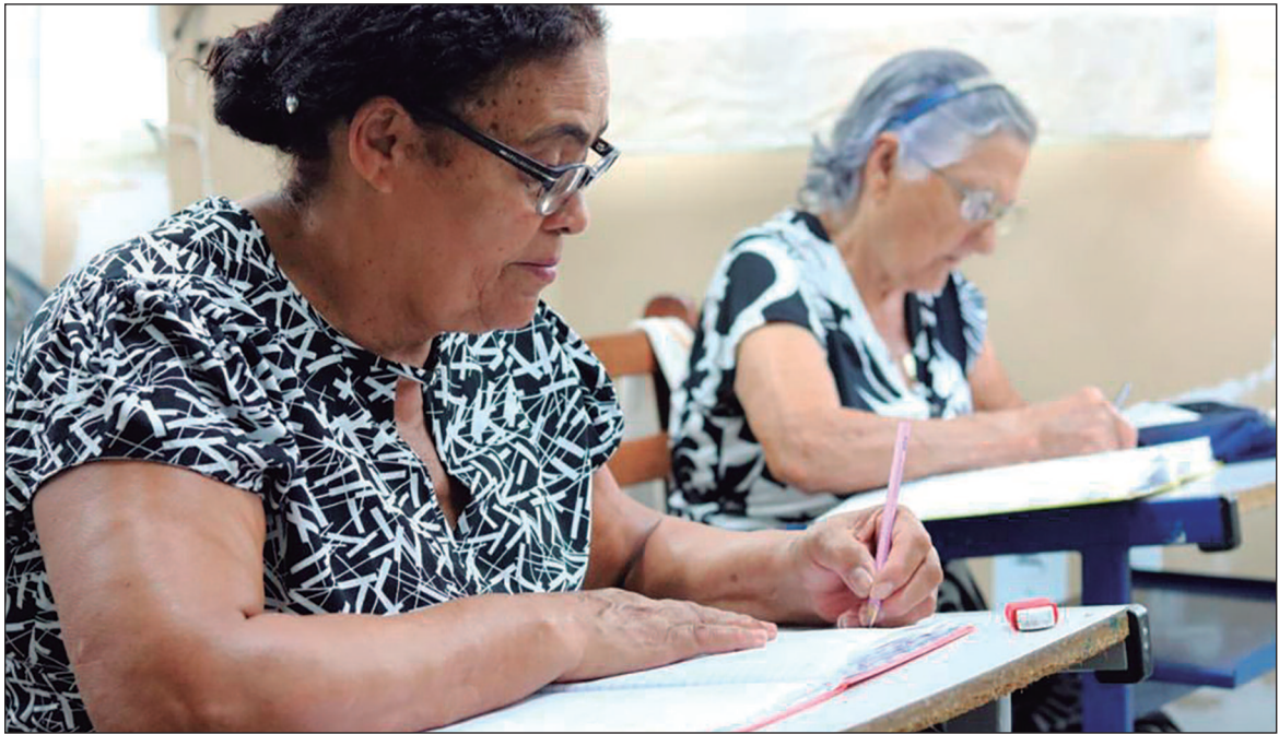
Taxa de analfabetismo entre pessoas com 60 anos ou mais em Goiás é mais que o dobro da média geral

O caso dos quilombolas rurais de Goiás é emblemático: segundo o Censo 2022, mais de 22% dessas pessoas não sabem ler ou escrever — uma taxa mais que três vezes superior à média estadual. A carência de escolas próximas, a ausência de transporte escolar e a falta de programas permanentes de educação para adultos contribuem para a exclusão educacional nessas comunidades. Diante desse panorama, iniciativas como a Educação de Jovens e Adultos (EJA) ganham ainda mais relevância. Em Goiânia, a Prefeitura tem reforçado a busca ativa por novos alunos para a EJA desde janeiro de 2024, mesmo após a reestruturação