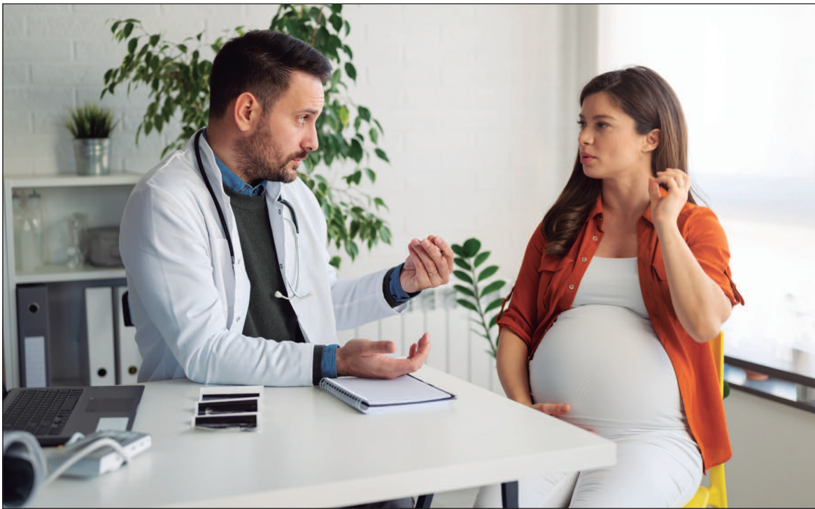
A cardiopatia congênita é uma anomalia estrutural do coração

Durante o pré-natal, profissionais da saúde monitoram diversas mudanças fisiológicas no organismo da gestante, como a pressão arterial, o ganho de peso, a alimentação, o desenvolvimento do bebê no útero e sua movimentação. O objetivo é identificar e prevenir precocemente problemas que possam comprometer a gestação, além de orientar a mulher sobre questões importantes relacionadas à maternidade. Existem dois tipos de pré-natal, definidos a partir das condições clínicas da gestante. O primeiro é o pré-natal de risco habitual, indicado para mulheres que não apresentam doenças pré-existentes ou fatores que possam trazer complicações durante a gravidez. Já o pré-natal de alto risco é destinado a gestantes com condições específicas, como hipertensão, diabetes gestacional ou outras patologias que exigem um olhar mais atento. Nestes casos, o acompanhamento deve ser feito por uma equipe multiprofissional, incluindo obstetras, enfermeiras obste-