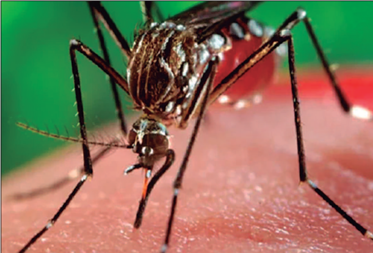
SES/Governo do Tocantins

Goiânia fez mais de 1,4 milhão de visitas domiciliares, que identificaram 22.141 imóveis com focos do mosquito Aedes aegypti